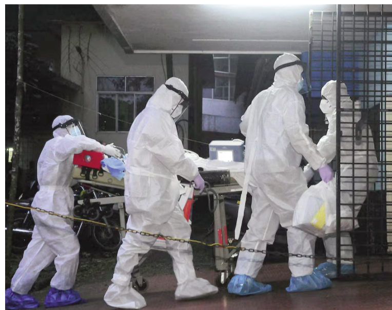
Autoridades de Bengala Occidental alertan sobre la alta letalidad del virus.

El virus Nipah pertenece a la familia de los henipavirus y se considera una amenaza prioritaria, según la Organización Mundial de la Salud (OMS). La infección puede ser asintomática en una primera fase, pero