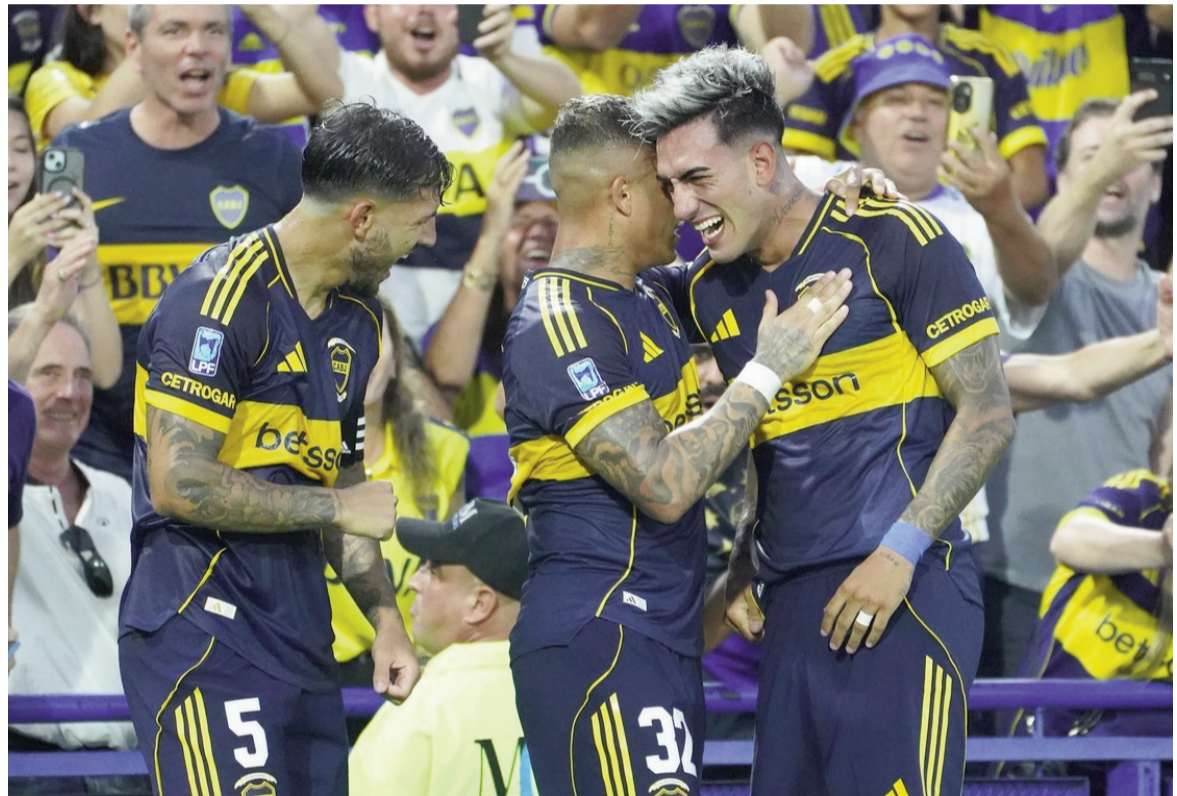
El Xeneize tuvo que esforzarse para batir a Riestra.