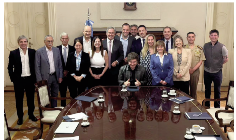
La mesa política del Gobierno se reúne hoy en Balcarce 50.

En ese sentido, el oficialismo todavía no comentó públicamente que hará con el Capítulo tributario de la reforma laboral que busca bajar impuestos y -como consecuencia- achicar la recaudación de las provincias. Por ahora, en Balcarce 50 hay alternativas para modificar la reducción del impuesto a las Ganancias para sociedades.