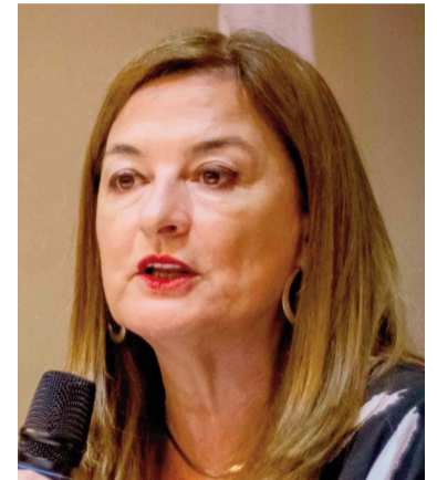
La ministra Díaz no desconocía lo ocurrido en el Senado platense.

La intervención formal del Ministerio de Mujeres y Diversidad bonaerense se produjo recién en octubre de 2024, cuando una empleada del Senado pidió ayuda tras haber sufrido abusos. El Equipo Interdisciplinario de la Legislatura elaboró un informe y lo elevó a la Dirección