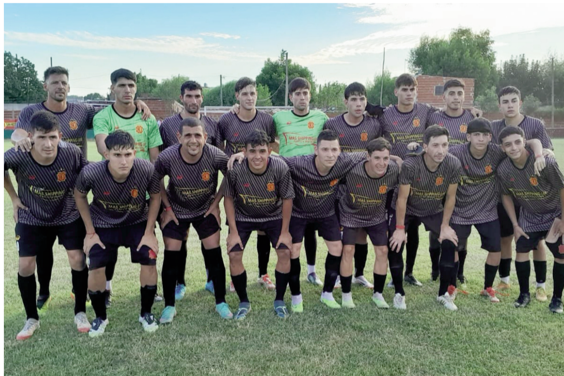
El Rojo lo ganó en la última. WEB

En un partido que tuvo de todo, por la zona 2, el Rojo le ganó como visitante a Defensores Unidos por 3 a 2. Los nicoleños lo ganaban 2 a 0, CADU lo empató y Ocanto terminó marcando el gol del triunfo en la última. En la zona 4, Social igualó 2 a 2 en Ramallo ante la Peña de Boca de Arrecifes.