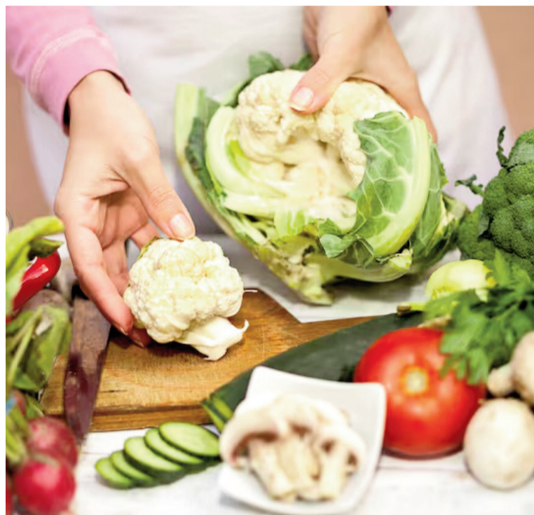
La dieta es uno de los factores que inciden en la salud de la microbiota intestinal.

Aunque el tema ganó relevancia en los últimos años, el vínculo entre microbiota y salud no es nuevo. Hace más de un siglo, el microbiólogo ucraniano Iliá Méchnikov, Premio Nobel de Medicina, propuso que era posible mejorar la salud y retrasar el envejecimiento manipulando el microbioma con bacterias benefi-