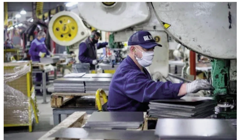
El sector metalúrgico, automotriz, químico y alimenticio, entre los más afectados.

Casos emblemáticos ilustran esta dinámica. En la industria de la ropa, el share de importaciones en la oferta total pasó del 13% al 23%, con un salto del 184% en las cantidades importadas. En muebles y juguetes, la participación importada subió del 33% al 41%, mientras que en autos y camiones trepó del 51% al 65%, con importaciones creciendo cerca del 80% en dos años.