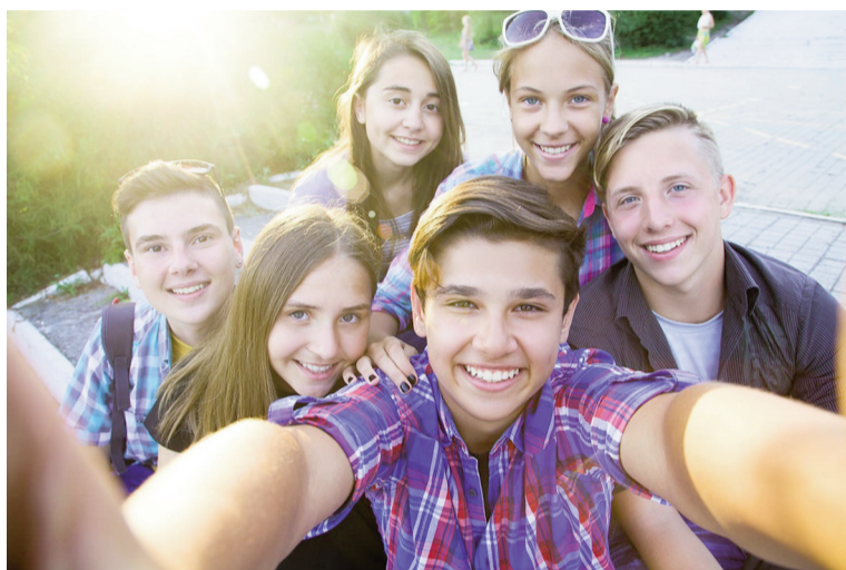
Las salidas con amigos y la vida social se intensifican en verano, lo que requiere comunicación y confianza entre padres e hijos.