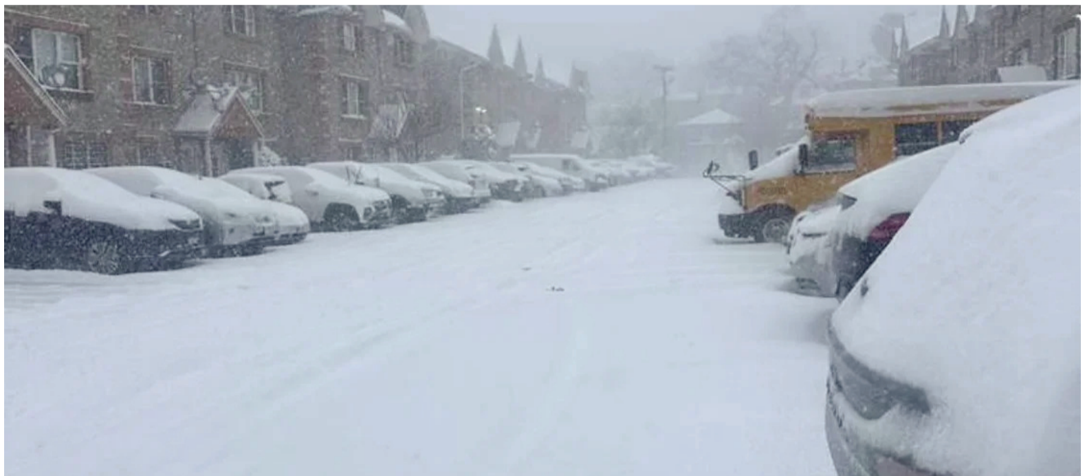
La tormenta invernal provoca acumulaciones históricas de nieve y hielo en el noreste y sur de Estados Unidos.

Por su parte, en el sur del país, el alcalde de Austin (Texas), Kirk Watson, confirmó la primera muerte en su jurisdicción. Watson instó a la población a no confiarse: «Todavía nos espera un clima muy, muy frío; es vital permanecer en interiores