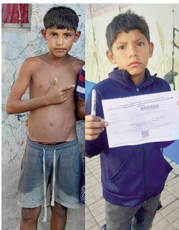
Buscan intensamente a dos hermanos, de 13 y 11 años, desaparecidos desde el 5 de enero.