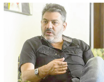
Ministro Carlos Bianco.

Según explicó el funcionario en la entrevista, el gobierno provincial