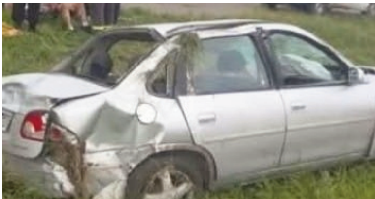
Un automóvil volcó en la Ruta 9.

Al arribar la dotación de rescate, los efectivos constataron que los tres ocupantes del rodado —un hombre, una mujer y una menor de edad— habían logrado egresar del habitáculo por sus propios medios. No obstante, siguiendo el protocolo de seguridad ante este tipo de colisiones, el personal de bomberos procedió a la in-