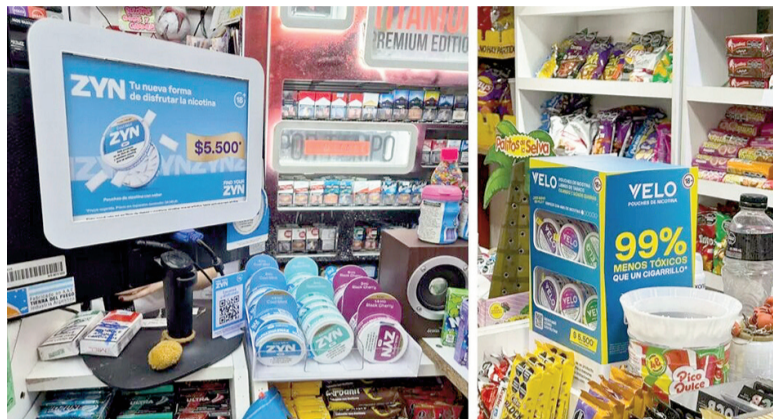
Bolsitas de nicotina exhibidas en kioscos bonaerenses.

El Ministerio de Salud de la provincia de Buenos Aires emitió una advertencia oficial por el crecimiento del consumo de bolsitas de nicotina, también conocidas como nicotine pouches, un producto que se presenta como alternativa "sin humo" al cigarrillo tradicional pero que, según remarcan las autoridades sanitarias, no es inocuo ni sirve para dejar de fumar.