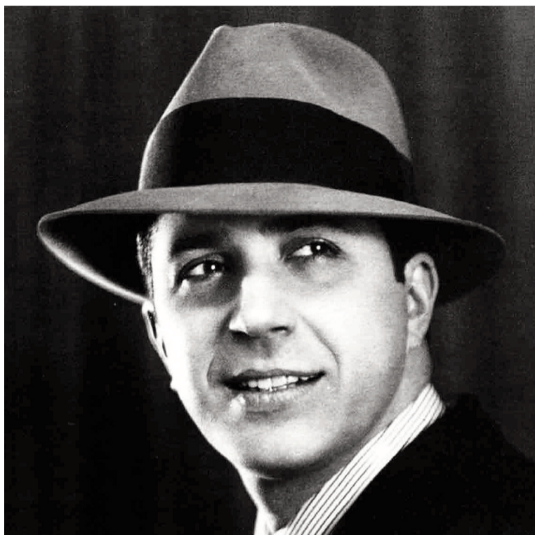
El «Zorzal Criollo» Carlos Gardel.