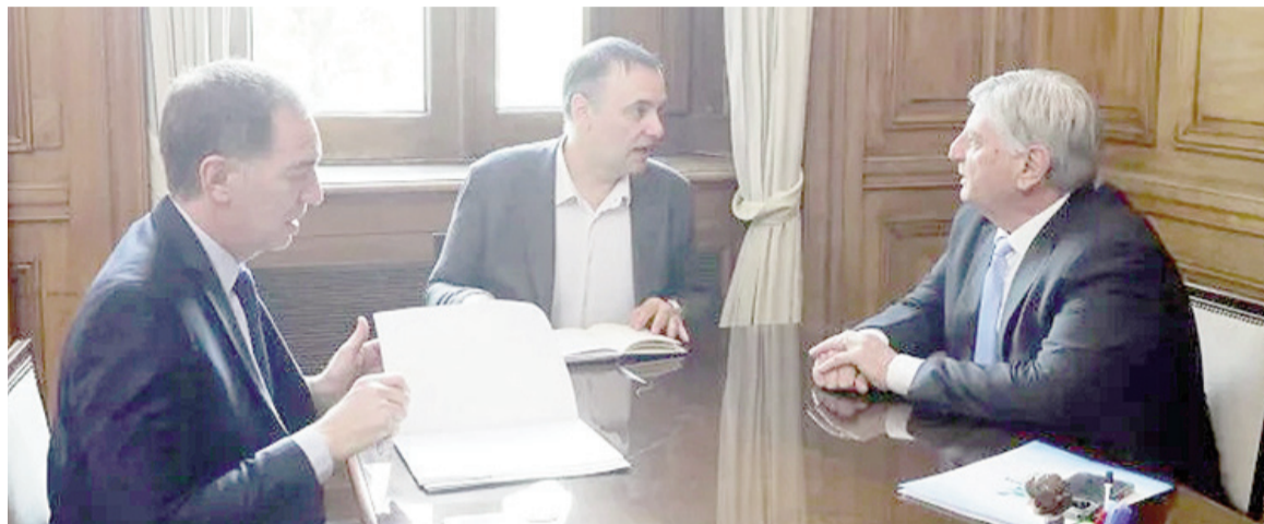
Santilli volverá a reunirse con Ziliotto, uno de los peronistas dispuestos a dialogar.

Para la reforma laboral, el oficialismo cuenta con 20 manos en el Senado, además de Luis Juez. Es decir, al oficialismo le restan al menos 16