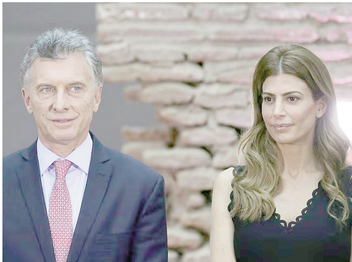
Tras quince años se terminó el amor.

Tomaron la decisión antes de las fiestas, pero igual cerraron el año juntos y en familia por el cariño, la buena relación y el respeto que mantienen.