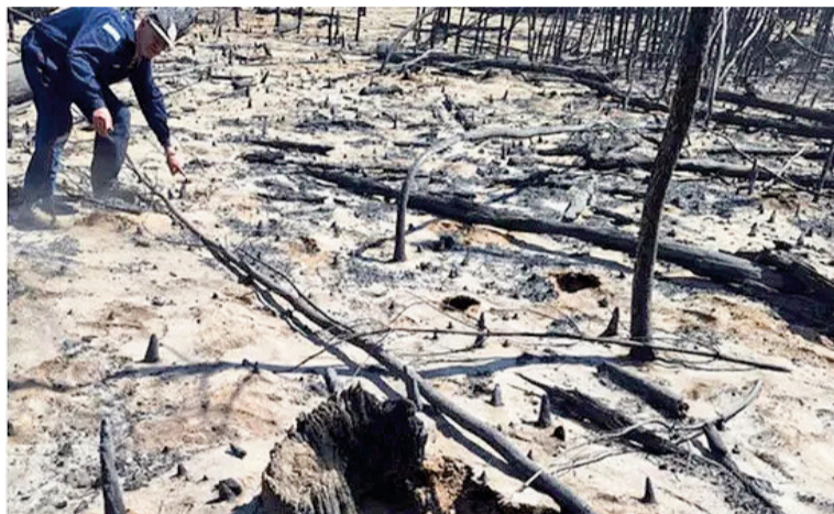
La imagen del tronco donde se habría iniciado el incendio.

La imagen difundida por el Ministerio Público Fiscal pasó a ser una