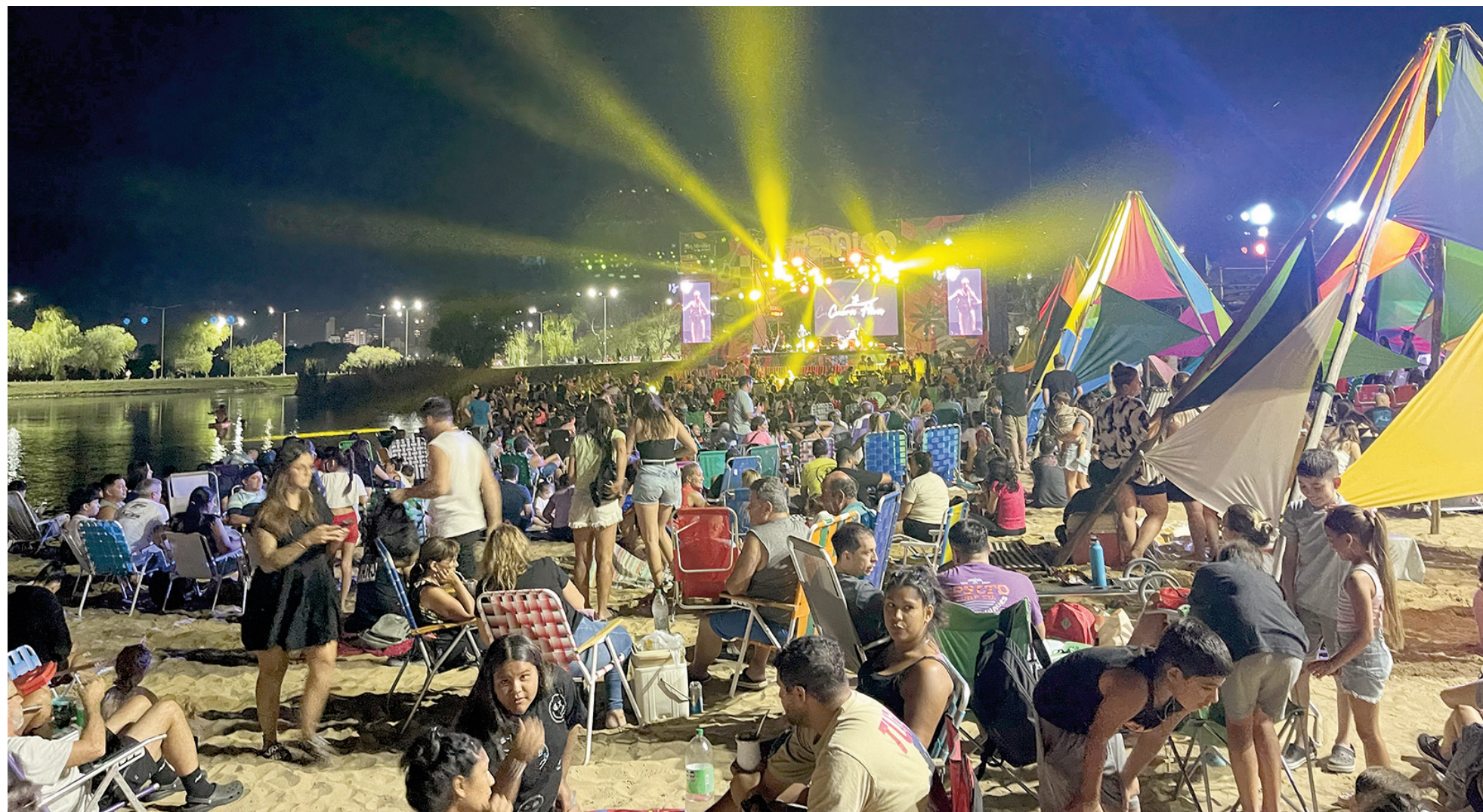
Música en vivo, variedad gastronómica y parque inflable en un entorno natural único, todo en Veranico para disfrutar el verano nicoleño.

Con entrada libre y una programación pensada para todo público, Veranico se presenta como una excelente alternativa para disfrutar del verano al aire libre, con música en vivo y propuestas gastronómicas en uno de los espacios naturales más lindos de la ciudad. Según la grilla oficial, hoy desde las 20:00 el escenario vibrará con la presencia de DJ Cristian Vigo, Clics (tributo a Charly García) y Que Le Den Candela.