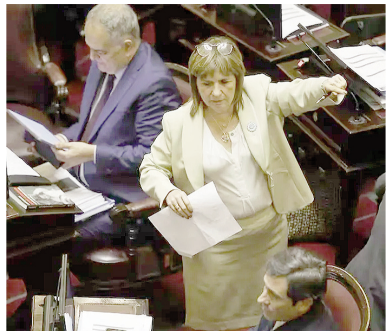
La senadora Bullrich, presidenta de la bancada de La Libertad Avanza.

Esta semana aún tiene pendiente viajar a Corrientes y Misiones