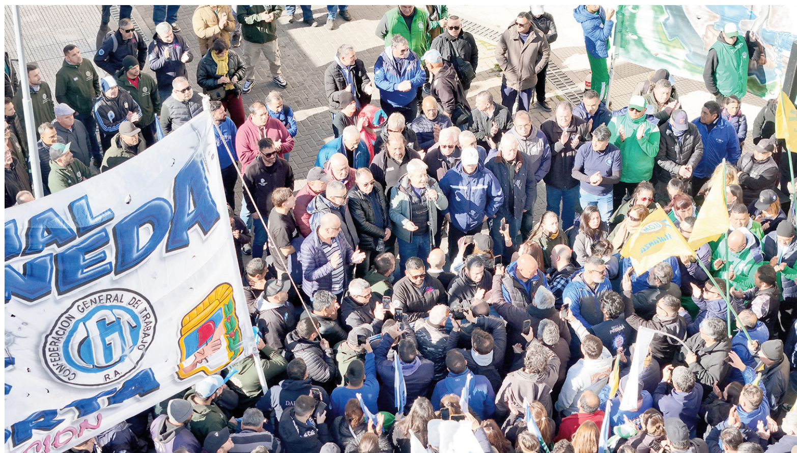
UOM espera que los actuales contactos de ámbito privado sirvan para consensuar un preacuerdo para firmar en la Secretaría de Trabajo.

mera reunión, el 14 de enero, la UOM planteó la necesidad de una recomposición del 9% en los básicos. Y “una recuperación inmediata del poder adquisitivo perdido en el último año y medio”. Según indicaba el propio gremio, la cámara empresaria quedó en evaluar el pedido trasladándolo a cada una de las empresas para dar una respuesta en el segundo encuentro.