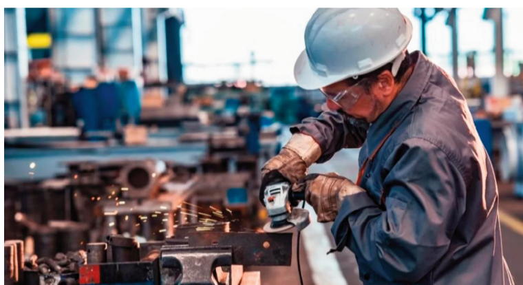
La actividad económica confirmó un cierre de año con señales de enfriamiento.

La industria manufacturera, en cambio, profundizó su tendencia contractiva. En diciembre registró una caída mensual del 1,4% en términos desestacionalizados y una baja interanual del 5,7%. En el balance anual, logró una suba marginal del 0,6%, ex-