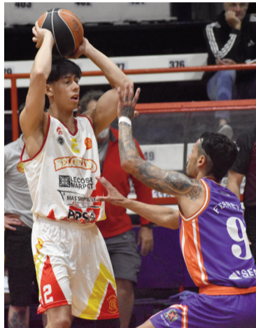
Habrará dos clásicos entre Belgrano y Regatas en la fase regular. Y otros cuatro duelos entre nicoleños.

por 8 clubes. Competirán ida y vuelta entre ellos.