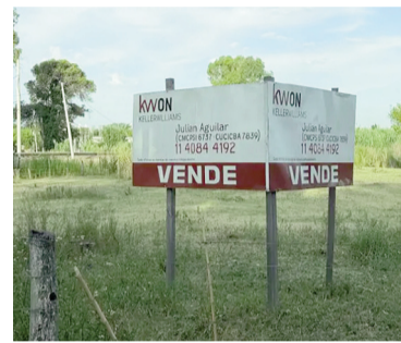
Terreno en Pilar.

todos los datos, especialmente los vinculados al domicilio y las reformas estatutarias, deben estar en regla y debidamente acreditados. La AFIP dispuso que hasta que esto no ocurra, los movimientos fiscales y registrales de la AFA permanecerán sujetos a revisión.