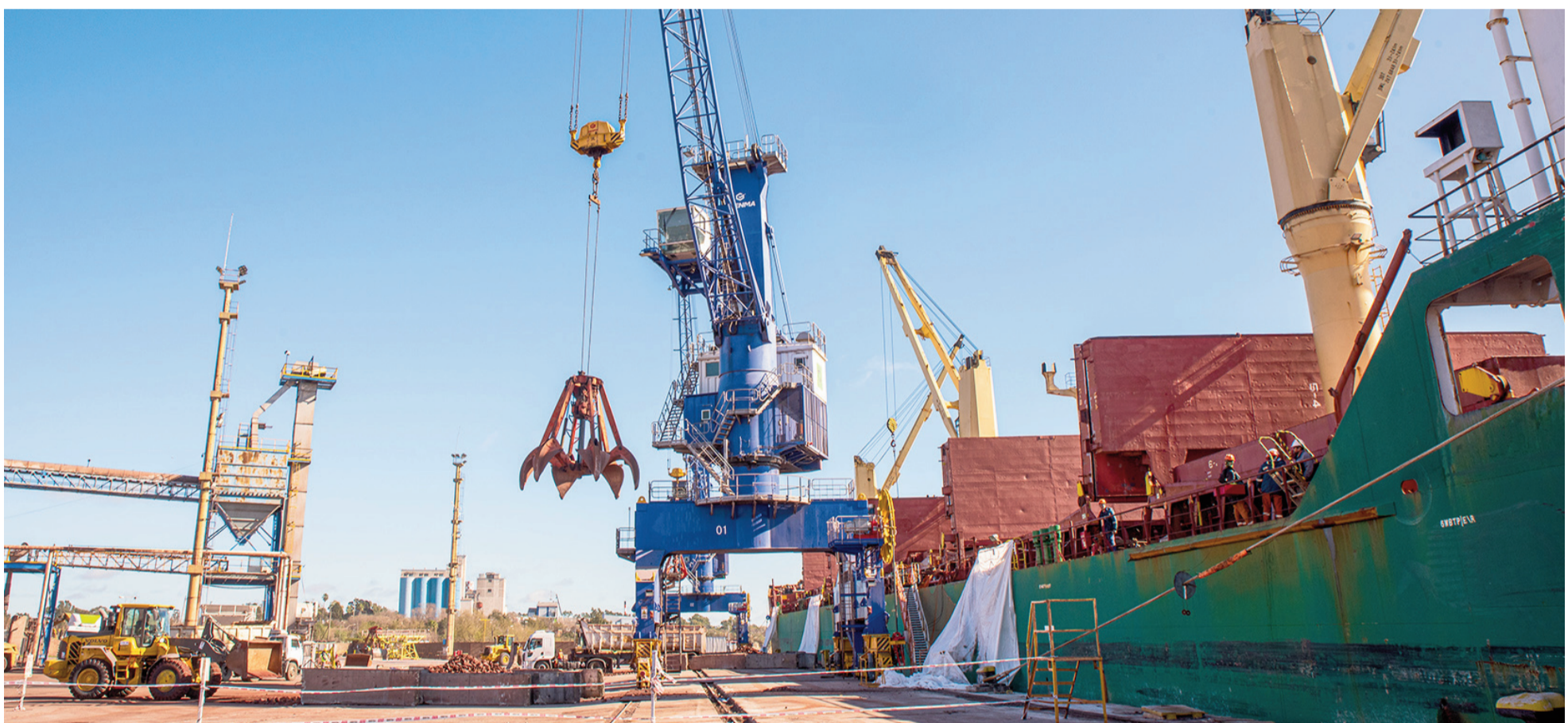
La medida adoptada por el Gobierno bonaerense fue recibida con beneplácito por parte de organizaciones sindicales del sector marítimo.