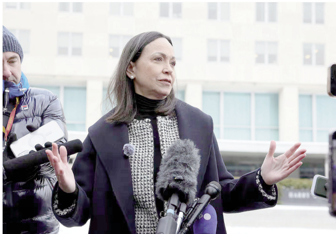
La líder opositora venezolana María Corina Machado.

La ganadora del Premio Nobel de la Paz dijo que su país enfrenta "horas y días decisivos" y descartó participar en un gobierno encabezado por la líder chavista Delcy Rodríguez.