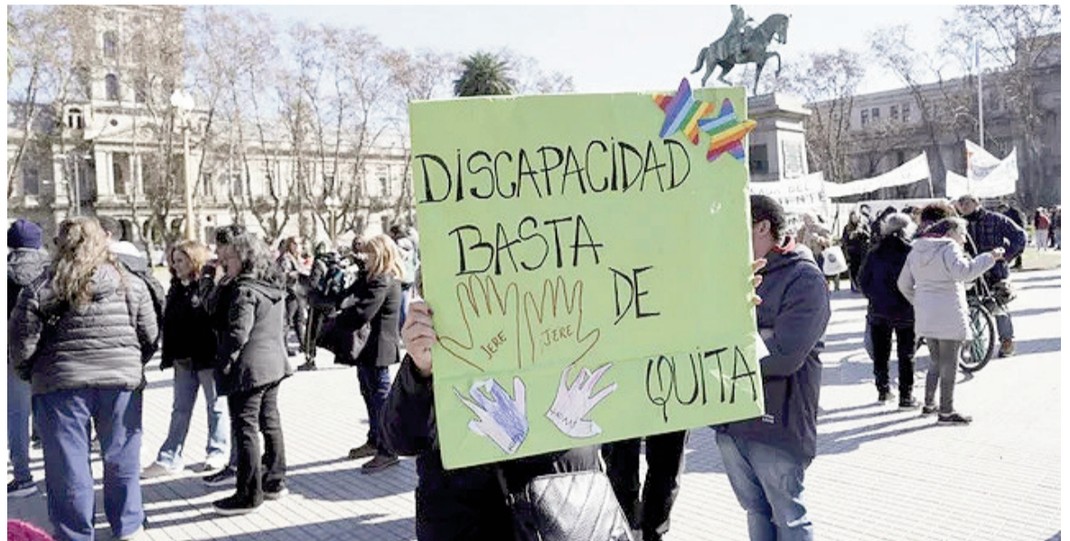
Si bien el gobierno promulgó la ley de emergencia en discapacidad, quedó suspendida su aplicación.

brayó que «la política que lleva adelante Javier Milei va en favor de los números. No hay una consideración de las realidades de las personas, no solo de las que tienen alguna discapacidad sino de las personas en general. La consigna del gobierno