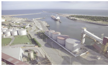
Hubo récord de exportaciones agroindustriales en 2025.

En tanto, del total, 31 complejos mostraron incrementos respecto