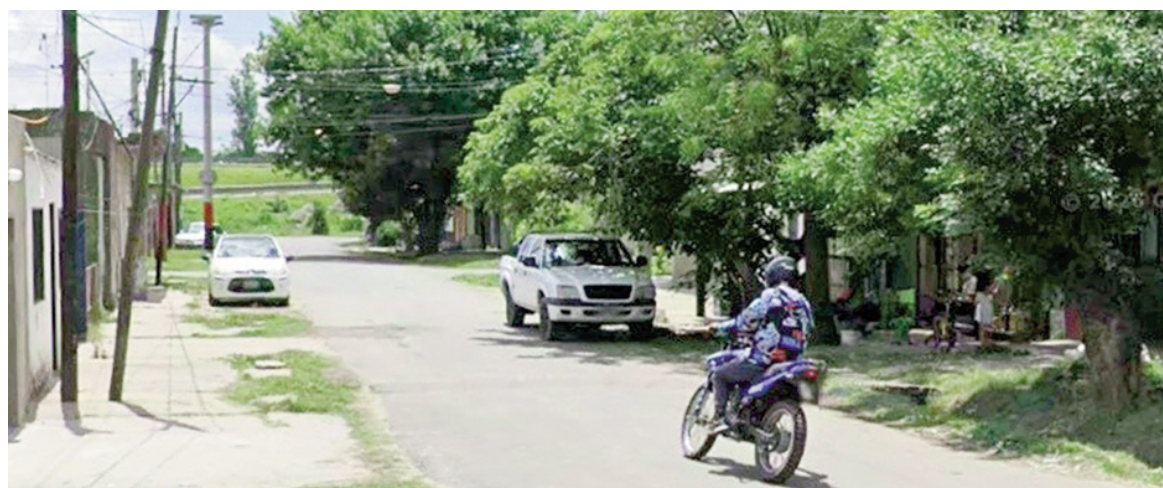
El ataque tuvo lugar en la cortada Pago de Los Arroyos, cerca de San Martín y Circunvalación.

La agresión tuvo lugar el viernes por la noche en la zona de San Martín y Circunvalación. En principio, las víctimas no corren riesgo de muerte. Se encuentran en el Heca y el Hospital Provincial. La zona, cercana al Hospital Regional Sur, fue escenario de allanamientos recientes por narcomenudeo y homicidios.