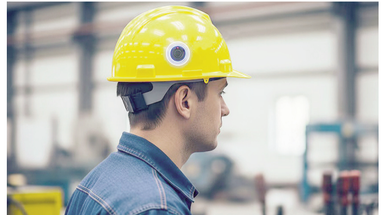
Las expectativas para los próximos meses muestran mayoritariamente estabilidad.

La producción industrial enfrenta restricciones que condicionan su capacidad de expansión. Según la última Encuesta de Tendencia de Negocios de la Industria Manufacturera del Instituto Nacional de Estadística y Censos (Indec), correspondiente a diciembre de 2025 y con expectativas para el período enero-marzo de 2026, el principal factor que limita el aumento de la producción es la demanda interna insuficiente.