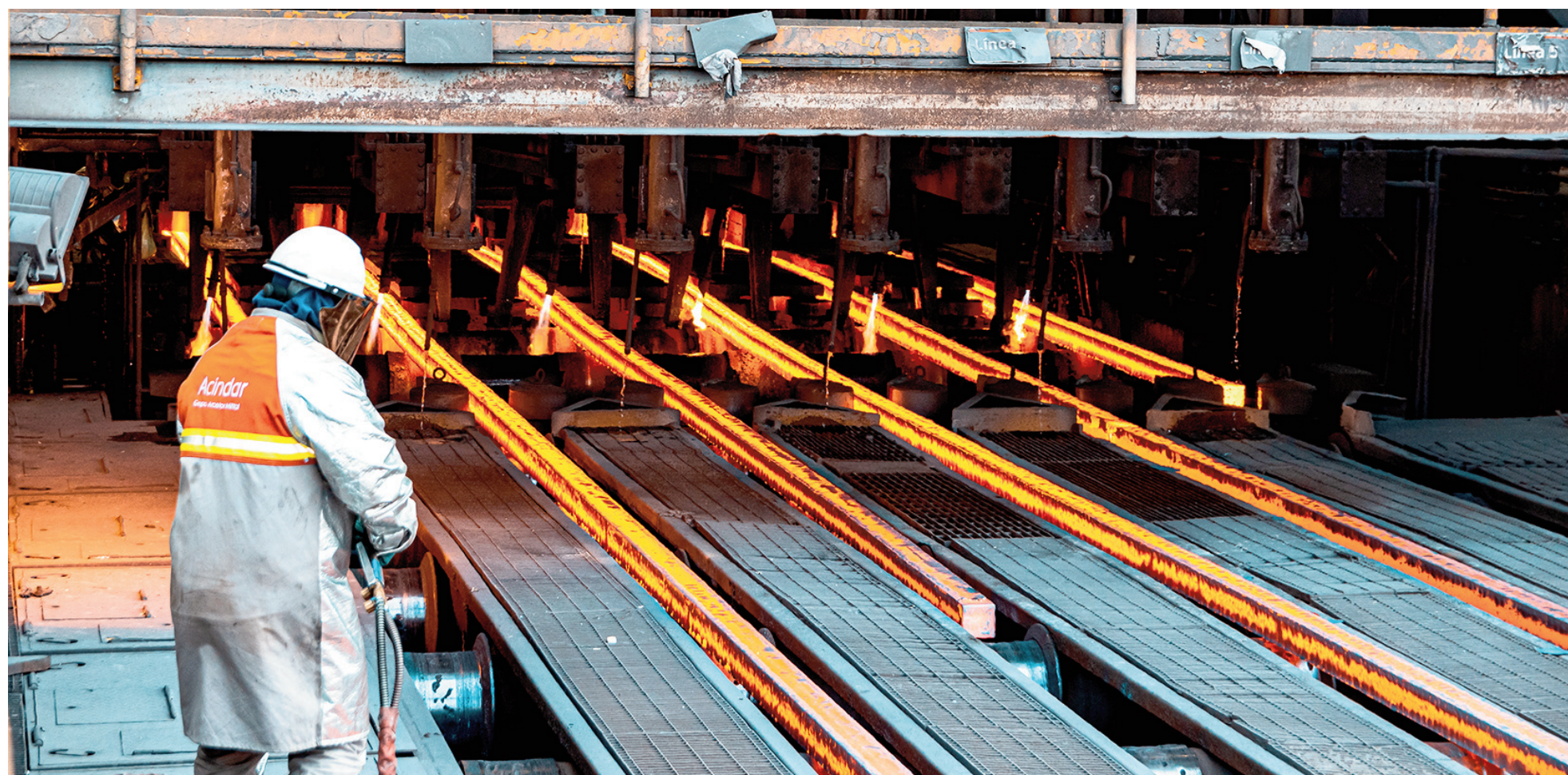
Entre el 15 de diciembre y el 11 de enero, en coincidencia con el periodo de vacaciones Acindar había aplicado su más reciente freno productivo programado.

Tal como venía sucediendo el año pasado, en este 2026 la siderúrgica de ArcelorMittal continuará evaluando mes a mes su escenario productivo buscando adecuar el uso de su capacidad instalada a la demanda existente. No obstante, desde la compañía avizoran un mes de febrero con actividad “normal”. Niegan que exista una profundización de la crisis ni un escenario de paralización total.