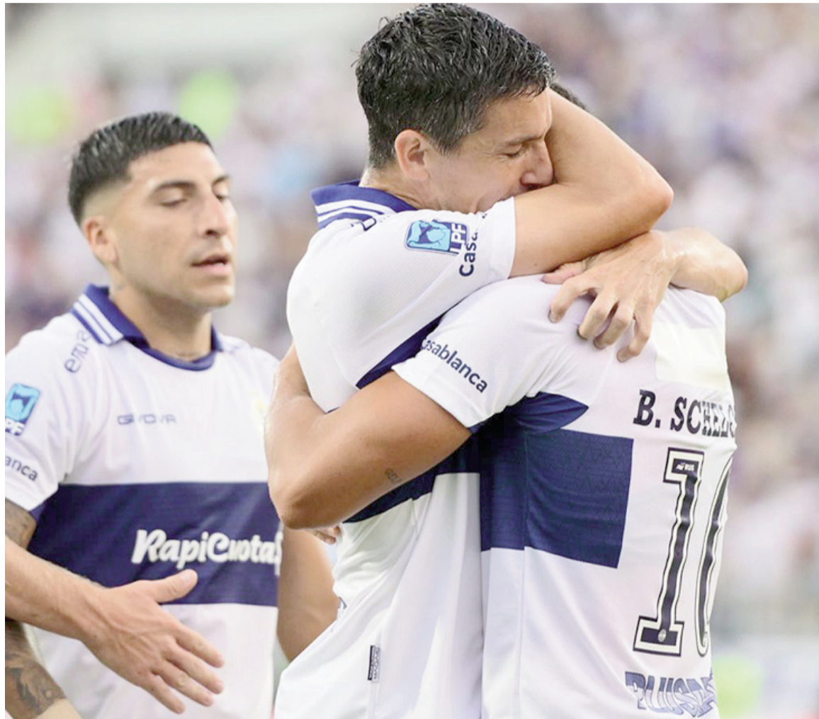
El Lobo debutó venciendo a la Academia WEB