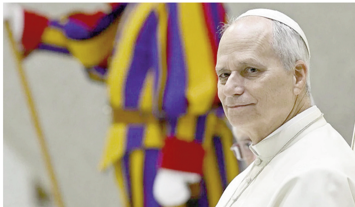
El papa León XIV.

El pontífice reflexionó sobre el impacto de la tecnología en la industria cultural y la comunicación. Dijo que la revolución digital debe ser “guiada”.