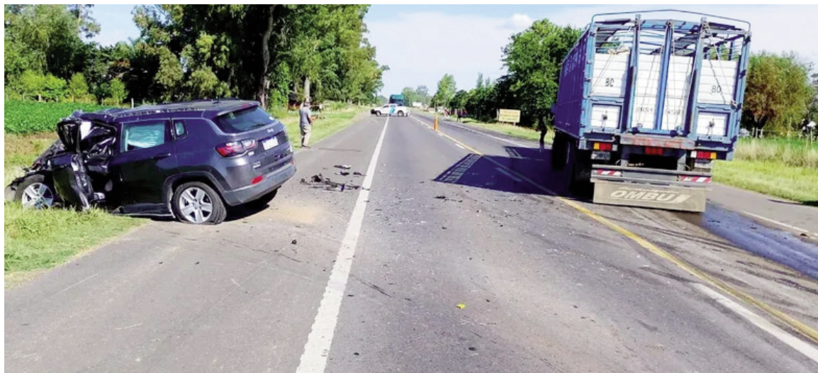
Un matrimonio perdió la vida en un accidente de tránsito.

Un trágico accidente de tránsito ocurrido este sábado por la tarde sobre la Ruta Nacional 7, a la altura de Chacabuco, se cobró la vida de un matrimonio de adultos mayores de la localidad de El Socorro, partido de Pergamino, que viajaba en una camioneta Jeep que colisionó de manera frontal contra un camión jaula. El siniestro vial se registró alrededor de las 15:30, en el kilómetro 207 de la Ruta Nacional 7, en jurisdicción del partido de Chacabuco, cerca del centro de distribución de un importante supermercado. Por causas que son materia de investigación, una camioneta Jeep y un camión jaula protagonizaron un violento choque frontal.