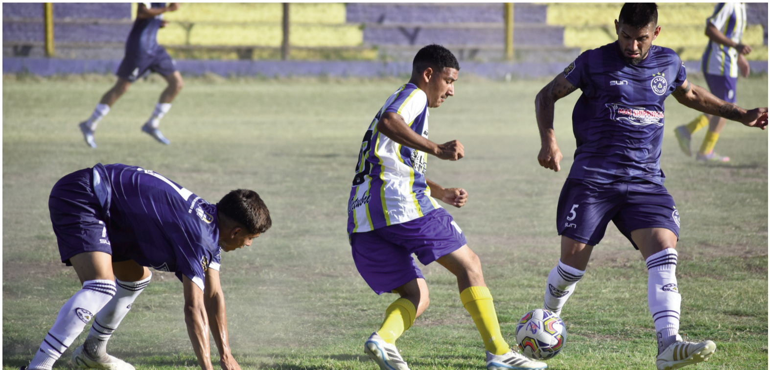
Los somiseros comenzaron el año con una sonrisa en el Torneo de la Federación. EL NORTE

Después del parate a los 25 minutos para que los jugadores pudieran hidratarse (la tarde en Soler y América fue agobiante), Somisa se adelantó en el campo y empujó al León contra su área. Retamar tuvo dos muy buenas intervenciones ante un remate