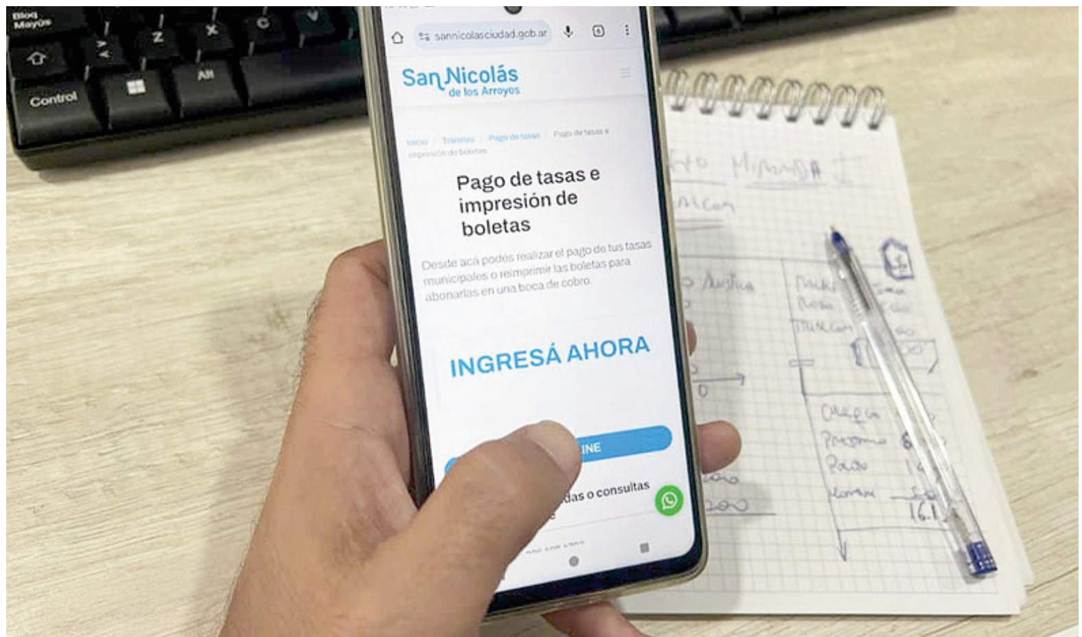
La prórroga permite pagar las tasas municipales con un 6% de descuento hasta el 31 de enero.

En ese marco, el Ejecutivo local informó que se prorrogó hasta el 31 de enero el plazo para realizar el pago anual de Tasas Municipales con descuento. El beneficio base consiste en la reducción del 6% respecto de las tarifas actuales. Sin embargo, no será ese el único ahorro que implicará la opción del pago único y anual. Cancelando la deuda por adelantado, se evitan los posteriores ajustes correspondientes a un mecanismo previsto en la Ordenanza Tarifaria 2026, que establece actualizaciones tarifarias atadas a la evolución de la inflación medida por el Indec. En las boletas que los contri-