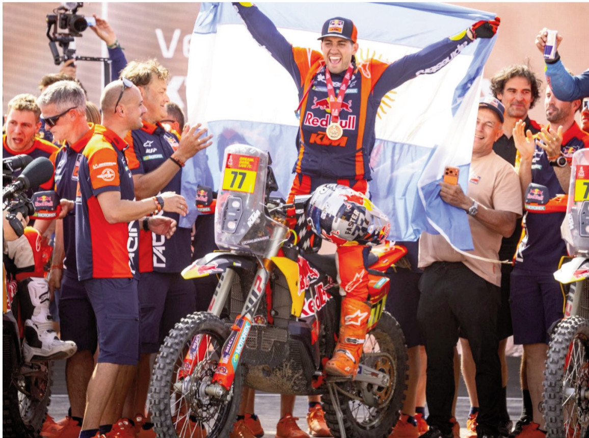
Luciano Benavides hizo historia en Arabia Saudita.

Gracias a esta histórica consagración, Benavides se convirtió en el sexto argentino en gritar campeón en el Rally Dakar. Los anteriores fueron los hermanos Marcos y Alejandro Patronelli (2010, 2013 y 2016 el primero y 2011 y 2012 el segundo), Nicolás Cavigliasso (2019 en cuatriciclos y 2025 en challenger), Manuel Andújar (2021 y 2024 en cuatriciclos) y su hermano Kevin (2021 y 2023 en motos).