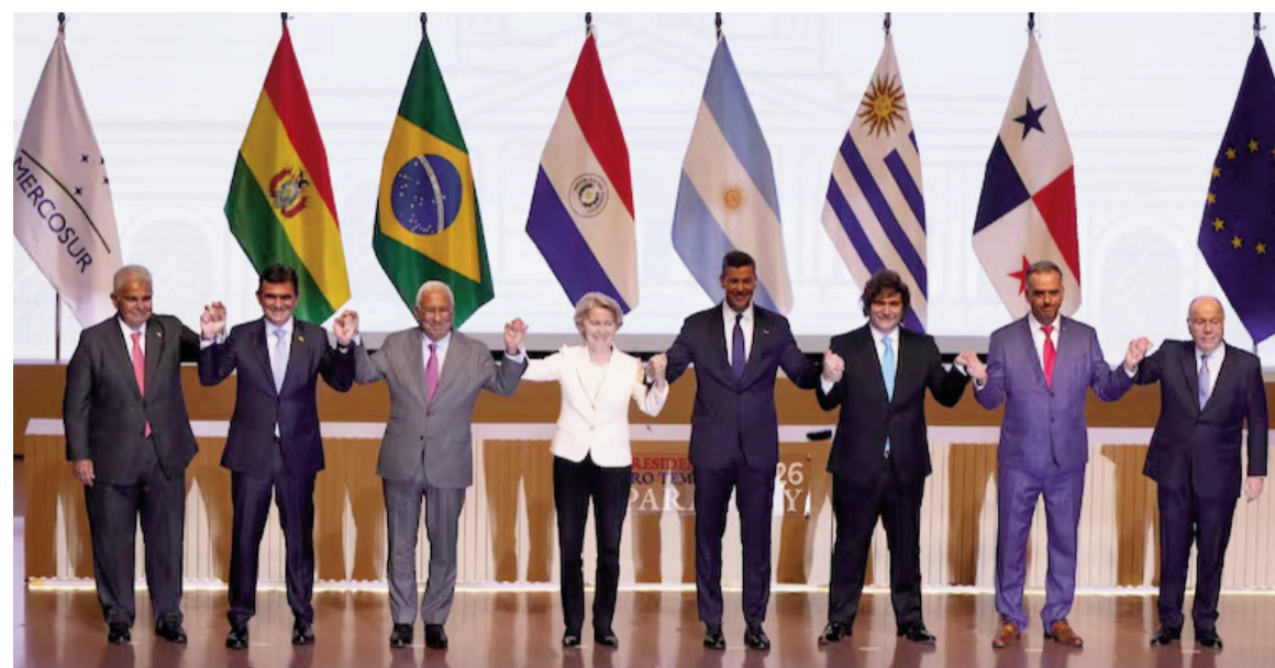
Autoridades del Mercosur y la UE en la «foto de familia» tras la firma del acuerdo.

La ceremonia se llevó a cabo en Asunción del Paraguay. Milei elogió la apertura comercial. «Lula» Da Silva, el gran ausente.