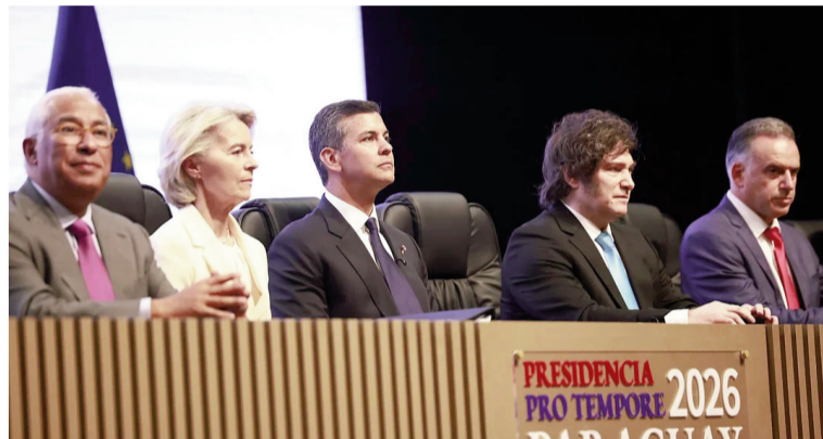
Javier Milei en la firma del acuerdo entre el Mercosur y la Unión Europea.

Asimismo, señalaron que el nuevo escenario abre perspectivas favorables para el desarrollo de inversiones productivas, el fortalecimiento de la capacidad exportadora y la consolidación de los complejos agroindustriales, en un