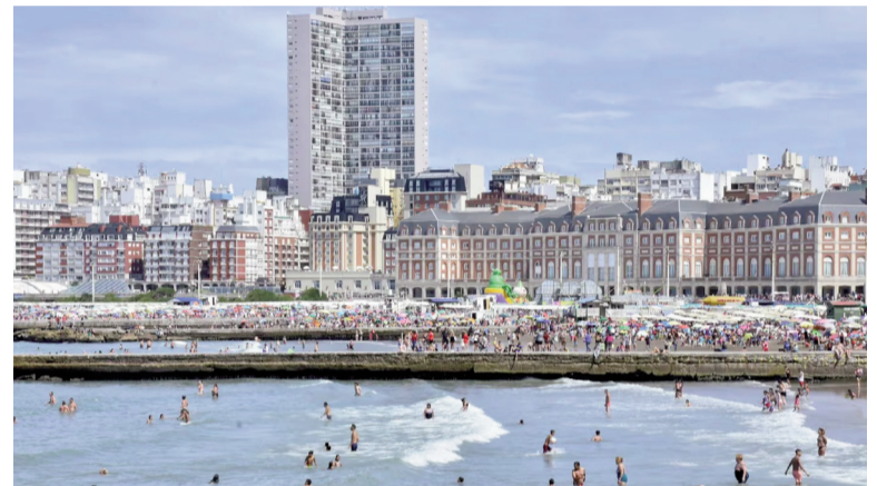
Las familias optan por estadías cortas y más planificadas.