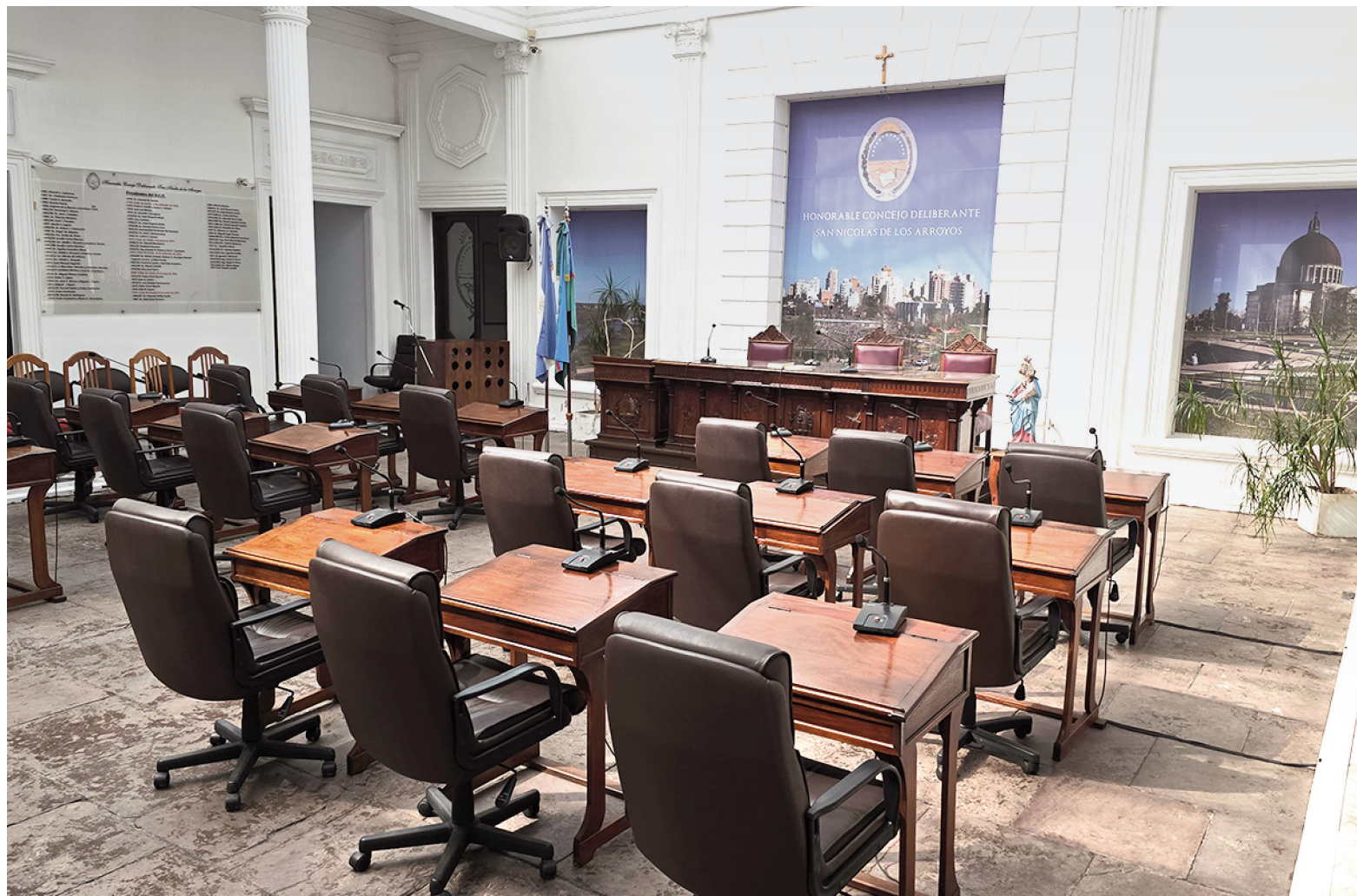
Todo listo en el recinto Soberanía Nacional del Concejo Deliberante para la sesión preparatoria convocada para las 10:00 de este viernes.

«Habiendo paridad de votos para la designación de autoridades del