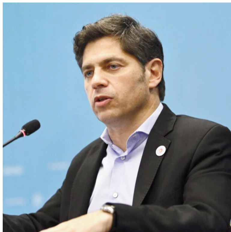
Gobernador Axel Kicillof.