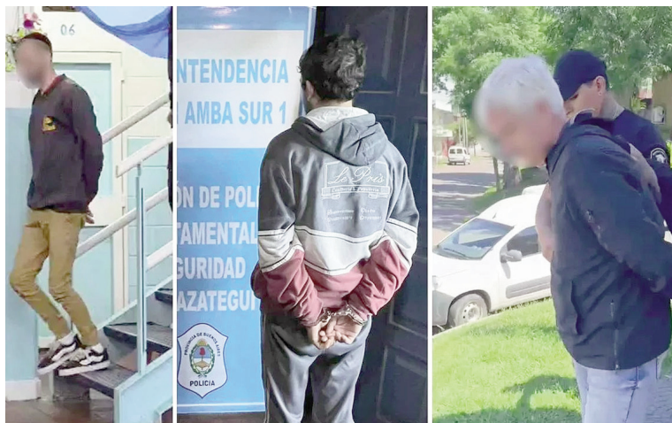
Tres de los sujetos aprehendidos en los allanamientos.

Dentro de los domicilios allanados, entre los que se incluyen tres unidades carcelarias, se identificaron 40 menores que convivían