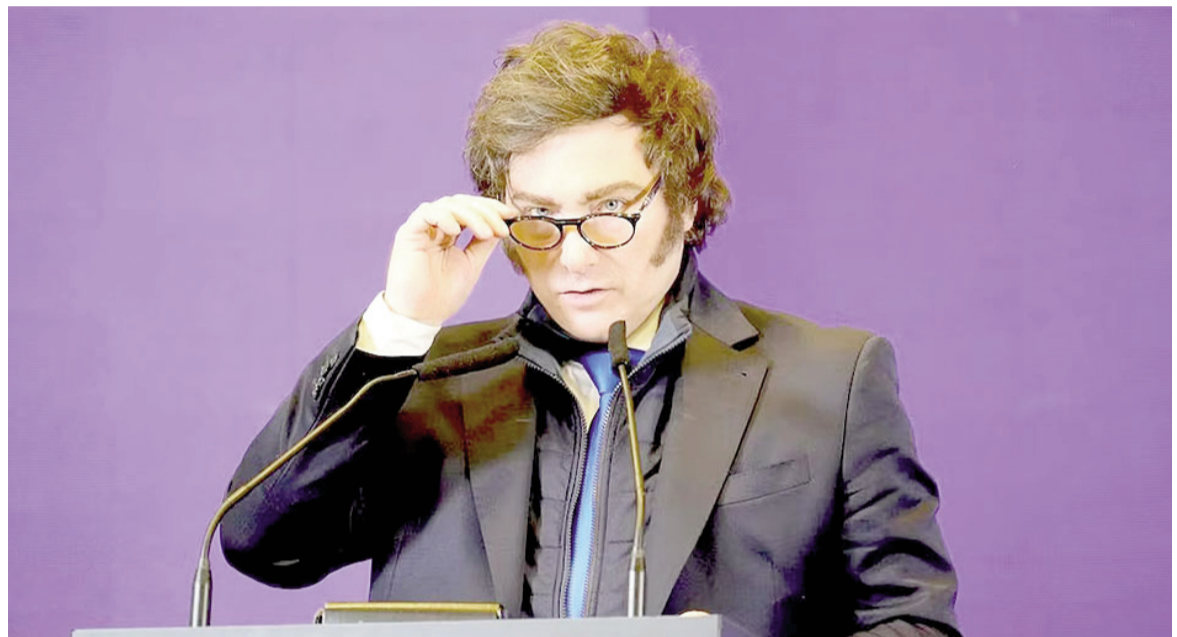
Milei convoca a extraordinarias.

El proyecto presupuestario es la iniciativa prioritaria para Milei. Es decir, es la que busca impulsar en primer término debido a su urgencia: resultaría sumamente conveniente iniciar el próximo año con