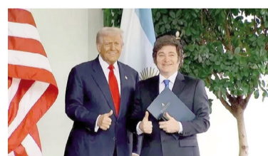
Trump y Milei.

El evento de bienvenida al embajador de Estados Unidos, Peter Lamelas, organizado por la Cámara de Comercio de EE.UU. en Argentina (AmCham) contó con una fuerte presencia de representantes del gabinete del gobierno de Javier Milei y del sector empresarial. El diplomático norteamericano elogió al oficialismo y anticipó que buscará gestionar una visita de Donald Trump al país.