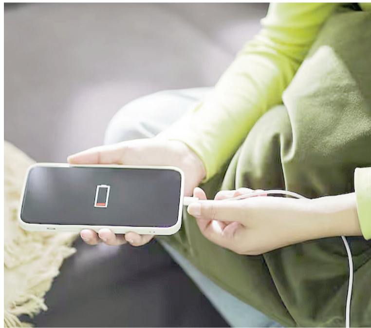
Existen algunas formas de cargar el celular si hay un apagón.

Este truco es ideal para viajes o apagones cortos. Vale aclarar que cargar el dispositivo de esta manera puede consumir batería del auto,