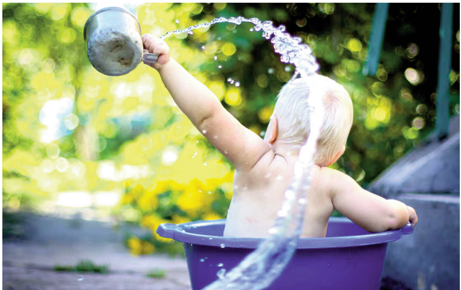
Para los golpes de calor se deben fortalecer los cuidados en las edades extremas de la vida, tanto bebés o niños como adultos mayores. ILUSTRACIÓN

Es importante estar alerta a los síntomas y se debe consultar al médico y tomar conductas activas. El agotamiento por calor es un estadio previo al golpe de calor; hay que reconocerlo para prevenir una situación más grave. Los síntomas son: sudoración excesiva; en los bebés puede verse la piel muy irritada por el sudor en el cuello, pecho, axilas, pliegues del codo y la zona del pañal (sudamina); piel pálida y fresca; sensación de calor sofocante; sed intensa y se-