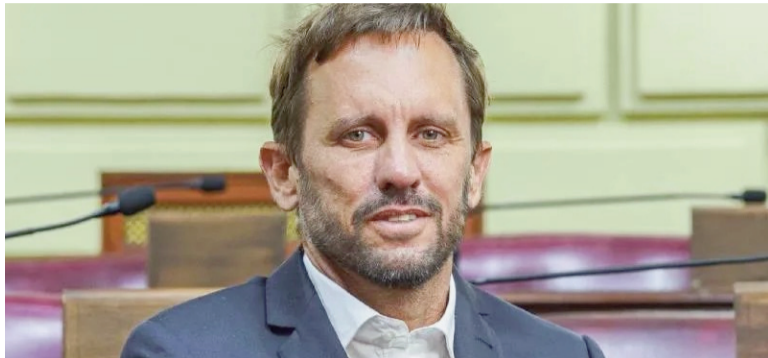
El diputado provincial Martín Rosúa.

El diputado provincial Martín Rosúa (UCR-Unidos) presentó un proyecto para impulsar una reforma integral del régimen de prisión domiciliaria en la provincia de Santa Fe. El legislador alertó sobre la existencia de privilegios encubiertos y fuertes desigualdades en la forma en que se ejecutan algunas condenas.