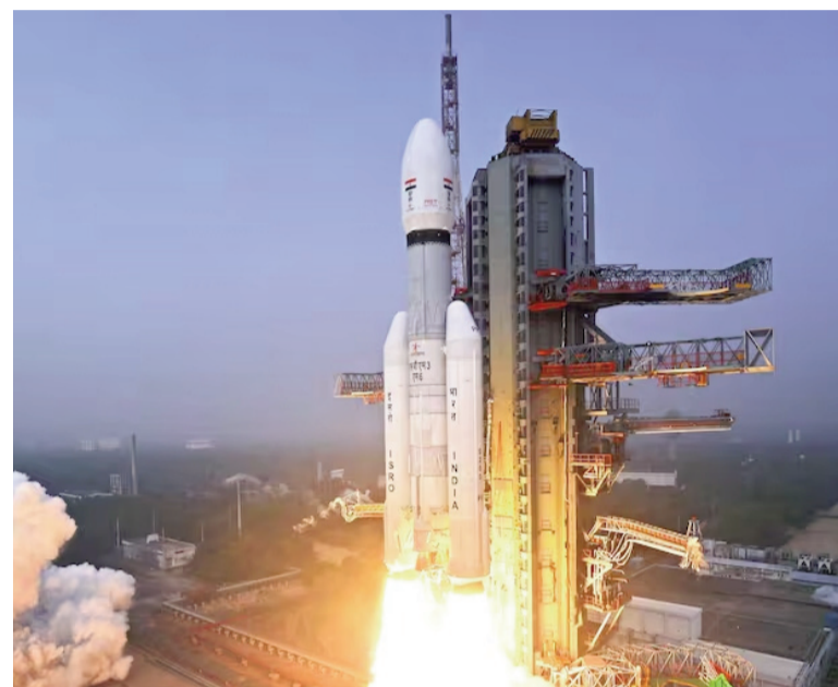
Un cohete de la Agencia Espacial India despega con un satélite 5G de 6 toneladas en su interior.

convencional; es el primero de una nueva generación diseñada para romper récords en el espacio. Con una estructura de antenas (phased arrays) de casi 223 metros cuadrados, se convertirá en el satélite comercial más grande jamás desplegado en la órbita baja terrestre (LEO).