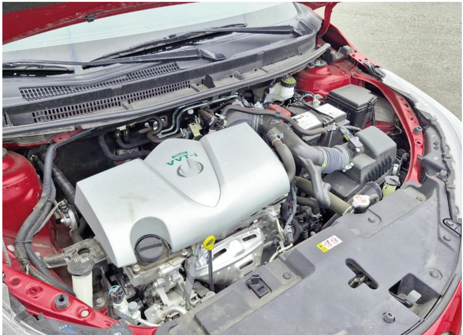
Se necesitan mínimamente $1.228.500 para salir a la ruta con un service del vehículo completo.

Además, su buen funcionamiento es garantía de que los elementos internos del motor se desplazan fácilmente, reduciendo el desgaste por fricción. "Un servicio de aceite y fil-