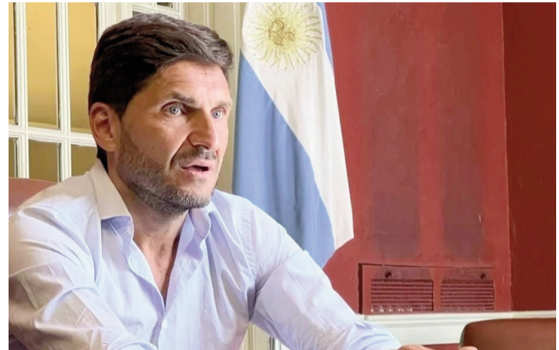
Maximiliano Pullaro, gobernador de Santa Fe.

La nueva postulación se produce apenas tres meses después de una reforma constitucional que incorporó la obligación de “procurar la paridad de género” en la integración de la Corte Suprema. Según advirtieron