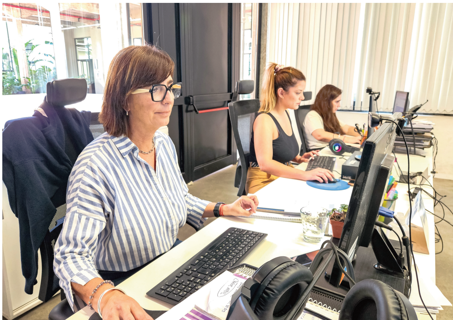
En 2025, los reclamos más frecuentes presentados ante la OMIC tuvieron que ver con compras online y estafas digitales.

Un dato destacado del trabajo realizado es la eficacia alcanzada en las audiencias de conciliación. Según informaron desde la OMIC, el 90% de los acuerdos cerrados logran una resolución favorable para el consu-