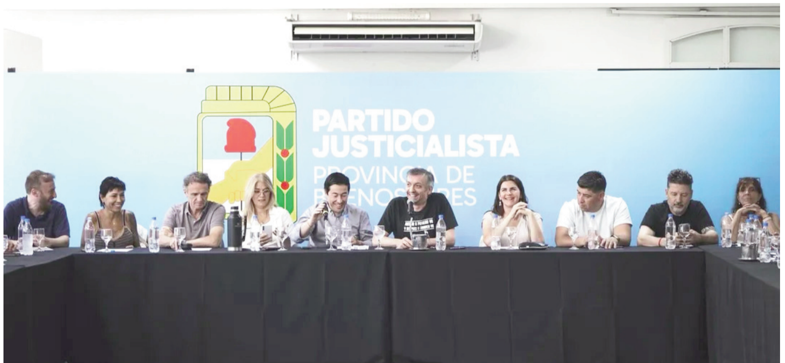
El PJ reunido en Malvinas Argentinas.

En el plano partidario, el PJ bonaerense dejó abierta la posibilidad de consensuar una lista de unidad, en cuyo caso la fecha fijada tendría