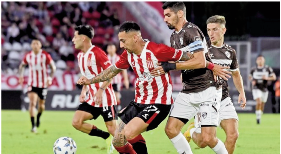
Platense y Estudiantes, cara a cara por un título en nuestra ciudad. WEB

Estudiantes, por su parte, llega en un momento inmejorable tras ganar el Torneo Clausura en una defi-