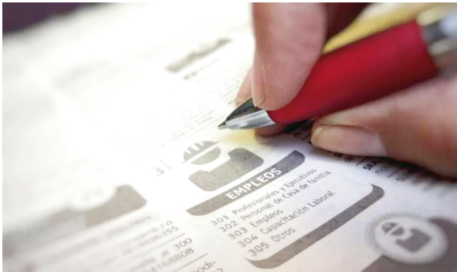
San Nicolás-Villa Constitución es uno de los 31 aglomerados urbanos de todo el país que el Indec releva a través de su Encuesta Permanente de Hogares.

La subocupación creció vertiginosamente en el aglomerado San Nicolás-Villa Constitución: 4,2 puntos respecto del segundo trimestre de 2025 (cuando fue de 8,4%). Y bajó aún más —7,2 puntos— en relación con el indicador de 5,4% que había arrojado un año