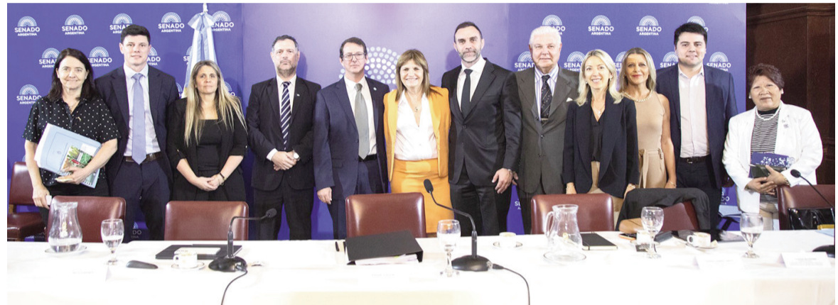
Patricia Bullrich celebró en redes y afirmó: "El 26 de diciembre vamos a aprobar el Presupuesto y la Ley de Inocencia Fiscal"

tensión fue la obra pública. Guberman sostuvo que el Gobierno priorizará obras nacionales y que buscará esquemas de financiamiento privado cuando sea posible, aunque senadores de provincias patagónicas advirtieron que muchas rutas no resultan atractivas para inversores. El funcionario respondió que el 90% de las 240 obras que asumirá el Es-