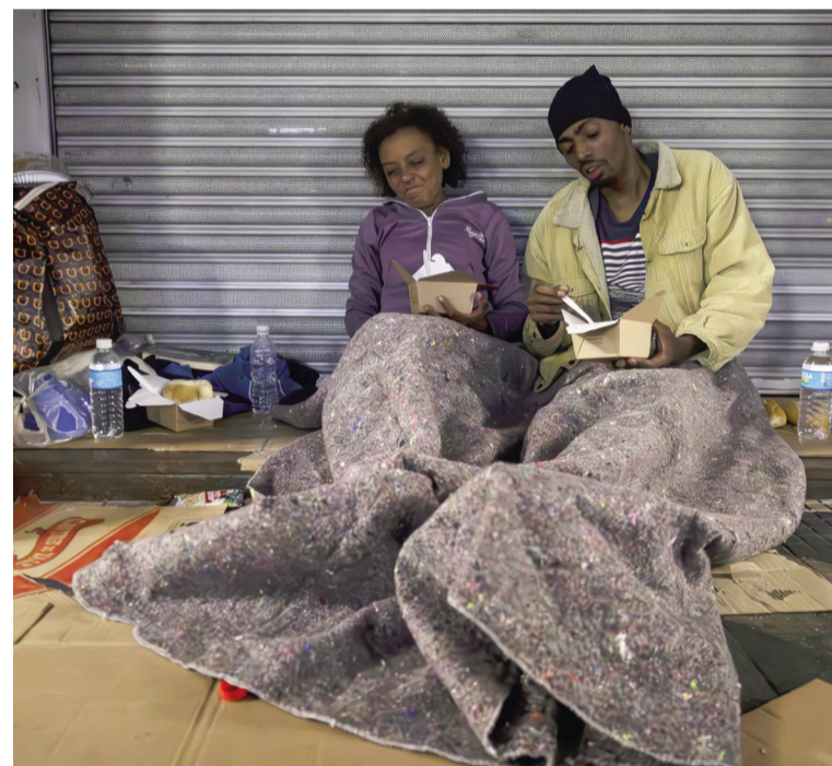
Brasil, en 2026, alcanzará cifras de pobreza envidiables.

Brasil cerrará este año con menos del 1 % de inseguridad alimentaria y con una tasa de pobreza extrema del 4,4 %, el nivel más bajo de su historia.