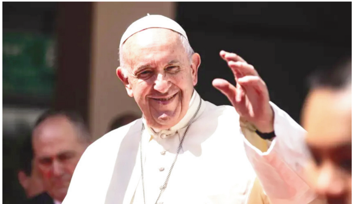
Jorge Bergoglio, el papa argentino.

Durante sus 12 años de pontificado, Bergoglio esquivó —o fue esquivado— un clima político enrarecido que nunca ofreció el contexto adecuado para un regreso a su tierra. Ni los gestos diplomáticos del gobierno de Milei lograron torcer esa historia inconclusa.