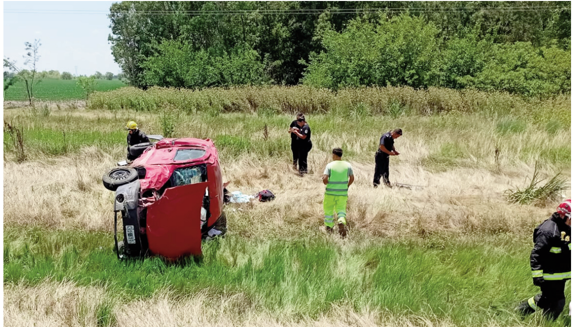
La Renault Kangoo siniestrada.

Un matrimonio y sus dos hijos viajaban a bordo de una Renault Kangoo cuando, por causas que se investigan, el conductor perdió el control del vehículo en el kilómetro 195 de la Ruta 9.