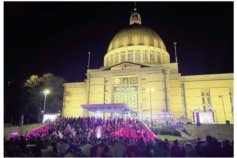
Vista del Santuario iluminado en la vigilia del 42° Aniversario de María del Rosario de San Nicolás.