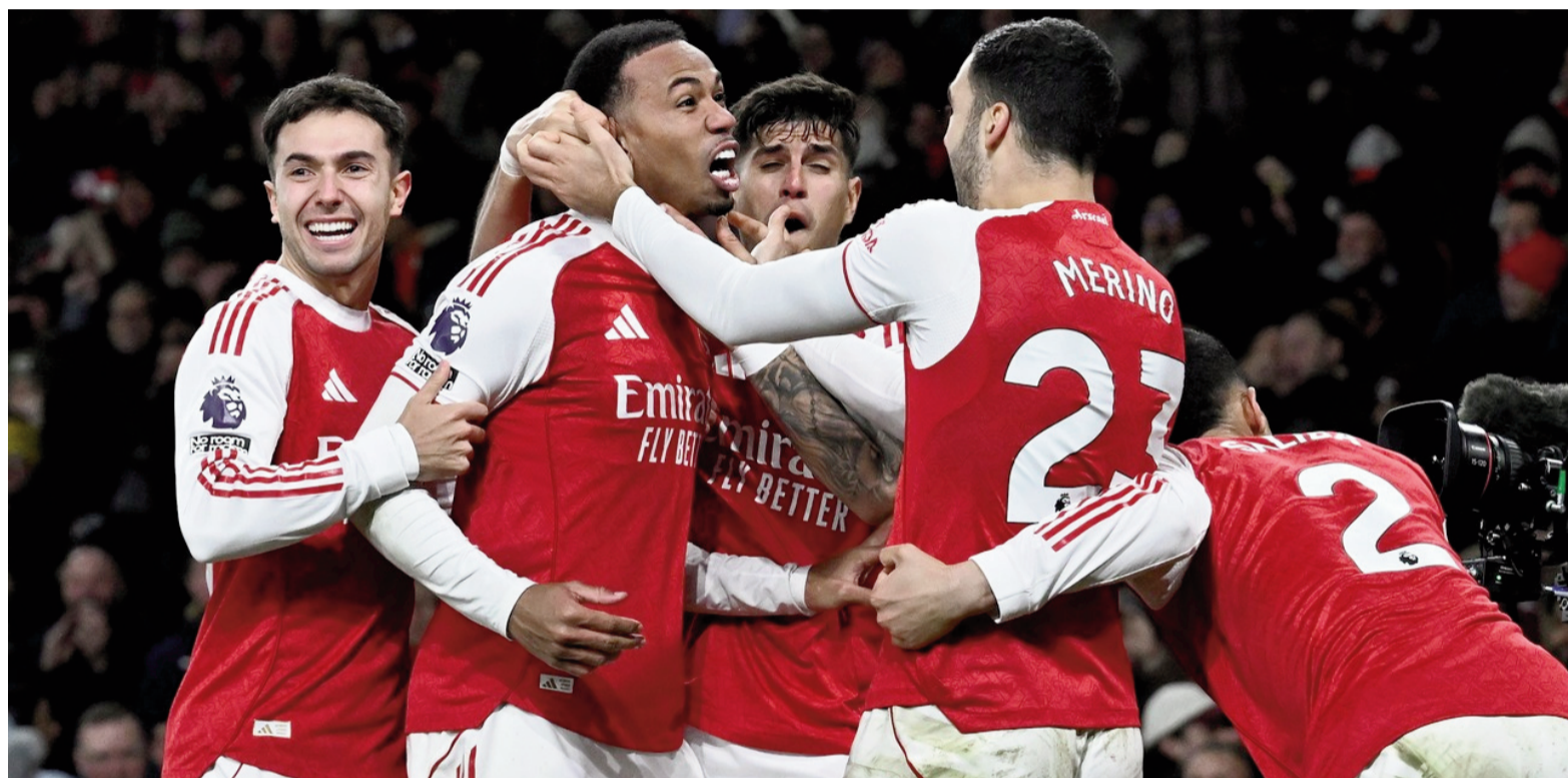
El puntero goleó al equipo de Unai Emery y se consolidó en la cima. WEB

El conjunto "Gunner" le ganó por 4 a 1 al equipo del "Dibu" Martínez y se consolidó como único líder con 45 puntos, mientras que los villanos se mantienen en el tercer puesto con 39.