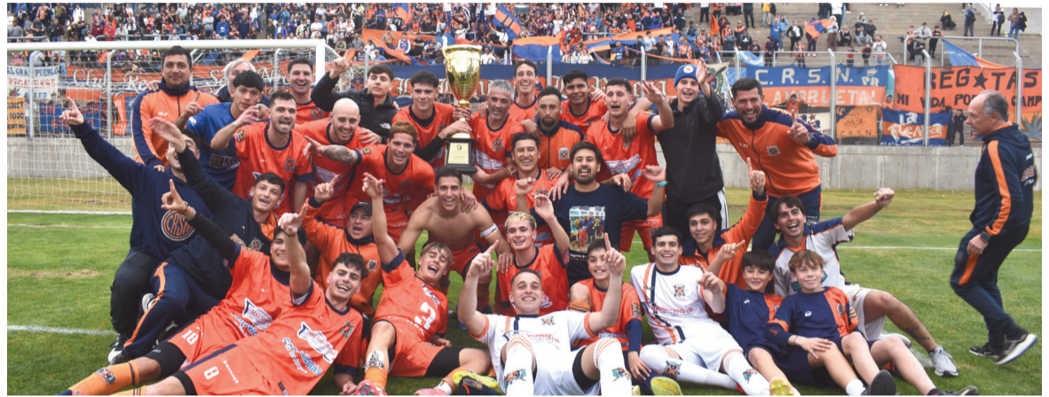
El equipo de La Ribera se consagró campeón del Apertura.