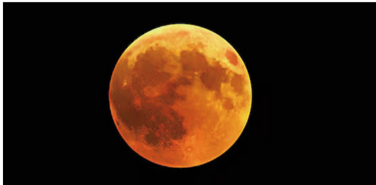
En 2026 habrá dos eclipses lunares, uno total y otro parcial.

De acuerdo con el sitio Time and Date, la primera Luna llena de 2026 se producirá el sábado 3 de enero. Por lo tanto, será a principios