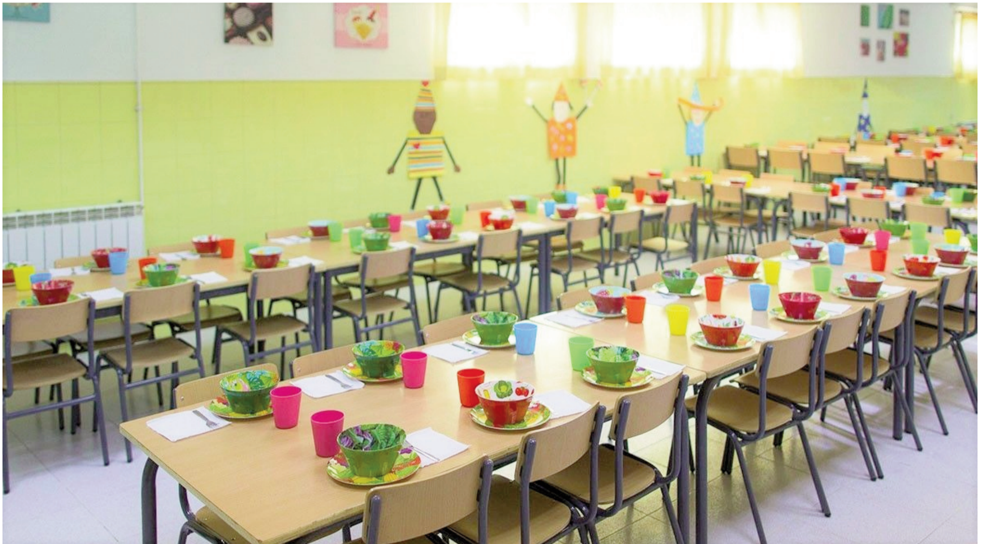
El programa asegura la continuidad del Servicio Alimentario Escolar (SAE) en el período de receso escolar.