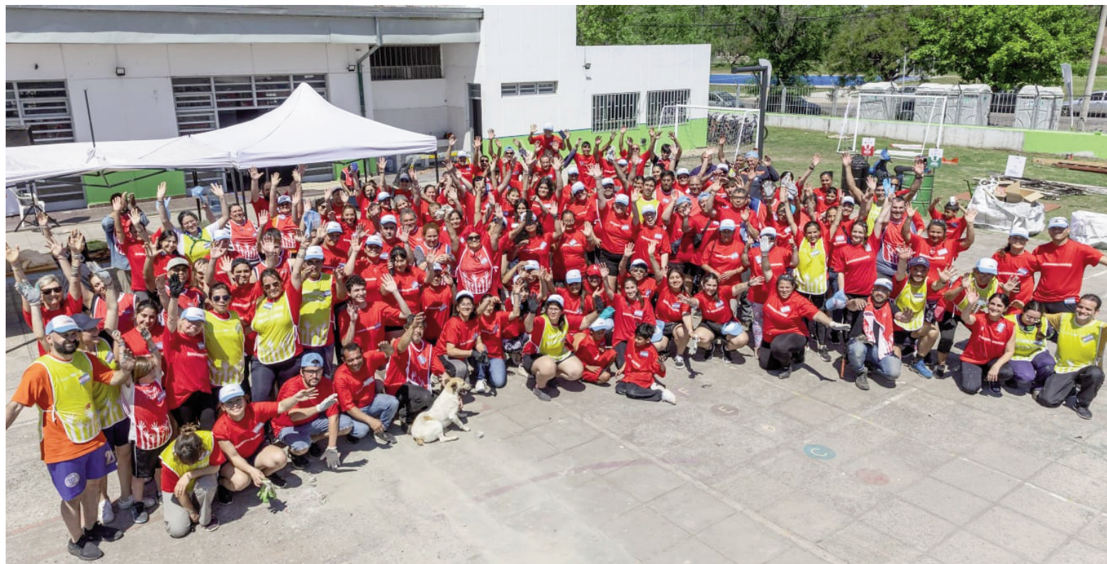
Por otro lado, la Escuela Primaria N° 32 de Villa Riccio y la Escuela Primaria N° 38 de San Nicolás recibieron a las ediciones 23ª y 24ª del Programa Voluntarios en Acción.

El enfoque en educación incluye también programas pensados para