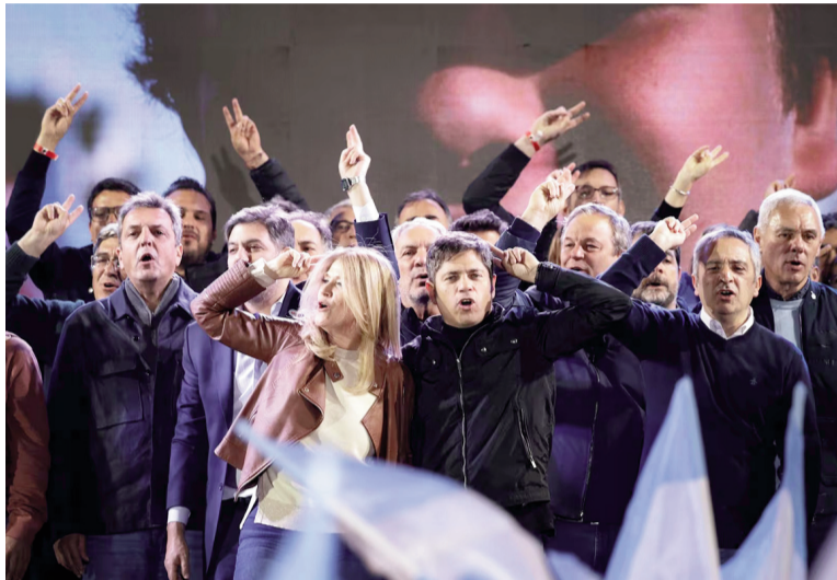
El gobernador celebró en septiembre; el presidente lo hizo en octubre.

lebrar la victoria, consideró que el Gobierno había pasado "el punto bisagra" y marcó que comenzaría a partir de ese momento "la construcción de la Argentina grande".