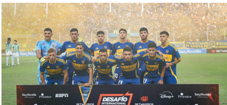
Boca tuvo su primera vez en el Estadio. WEB

Además, por primera vez, los dos clásicos Belgrano vs. Regatas tuvieron como escenario el Estadio. En ambas oportunidades, el que salió victorioso fue el Náutico.