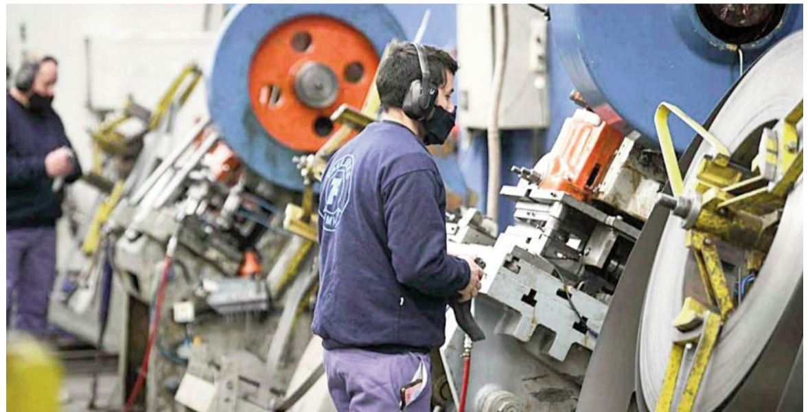
Difícil situación atraviesa la industria bonaerense.

Para el ministro López, el cuadro es claro: sin una mejora sostenida