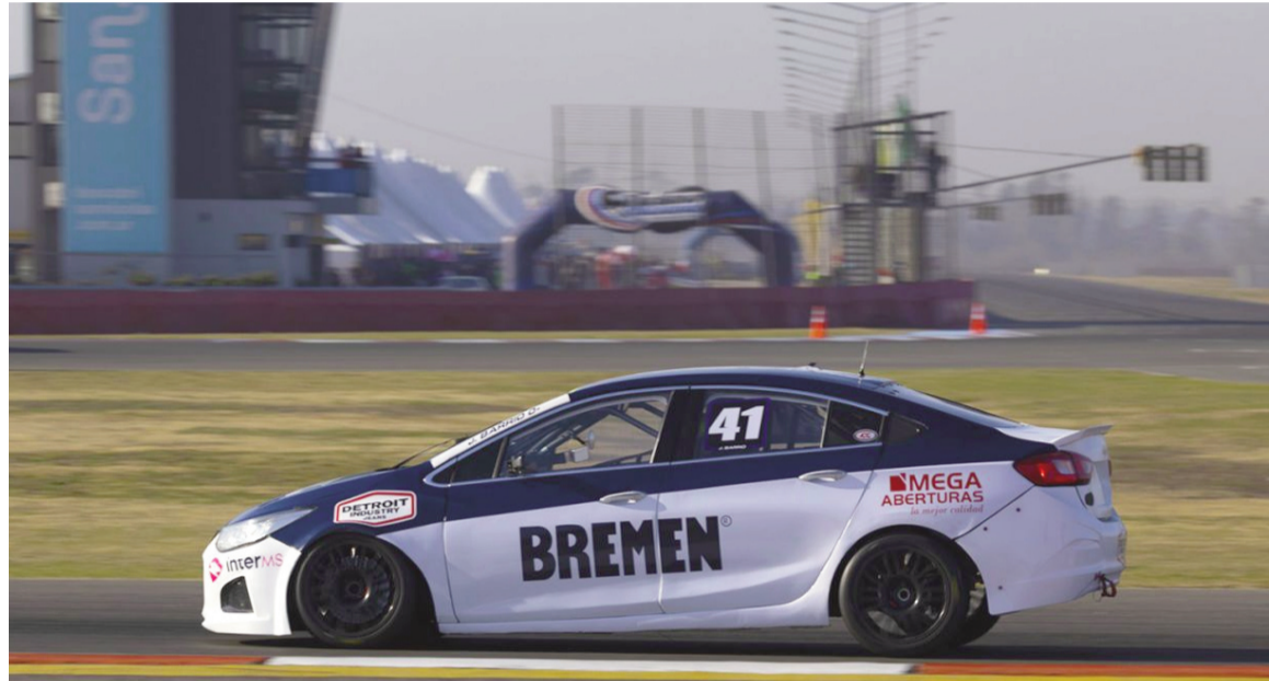
La última visita del TN a San Nicolás fue en julio de 2024.

El certamen visitará dos veces Córdoba, con competencias en Alta Gracia y Río Cuarto; y también habrá dos fechas en la provincia de Buenos