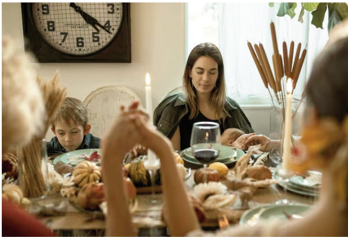
Las comidas navideñas pueden estar acompañadas de canciones para la fecha.

el clásico más emblemático de la Navidad, cargado de tradición y calidez, según el análisis de la plataforma.