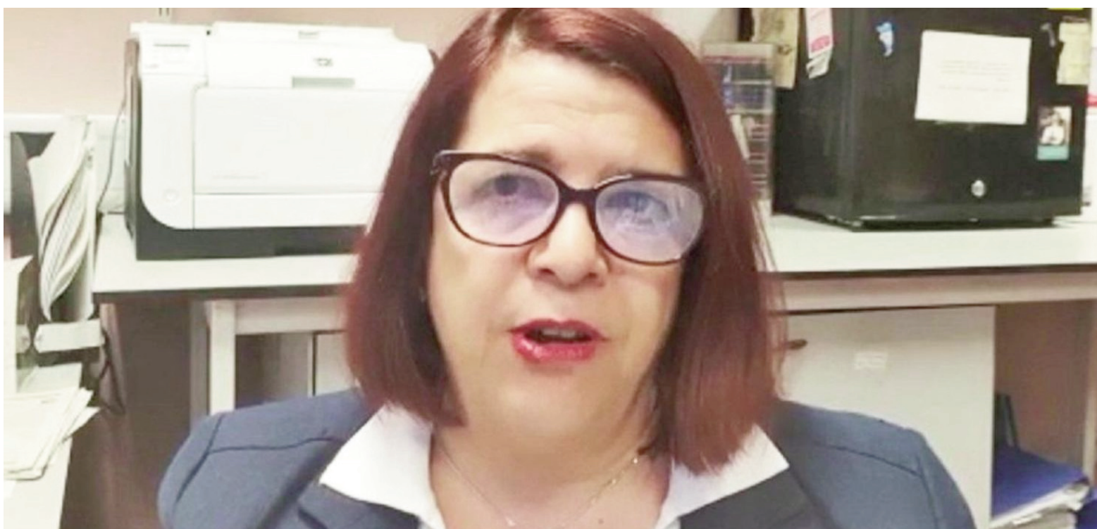
La patóloga argentina Marta Cohen.

La especialista buscó llevar calma ante lo que describió como un estrés postraumático derivado de la pandemia de COVID-19. En ese sentido, afirmó que “hay que prepararse, pero no va a ser una pandemia, es un pico excesivo del número de casos”.