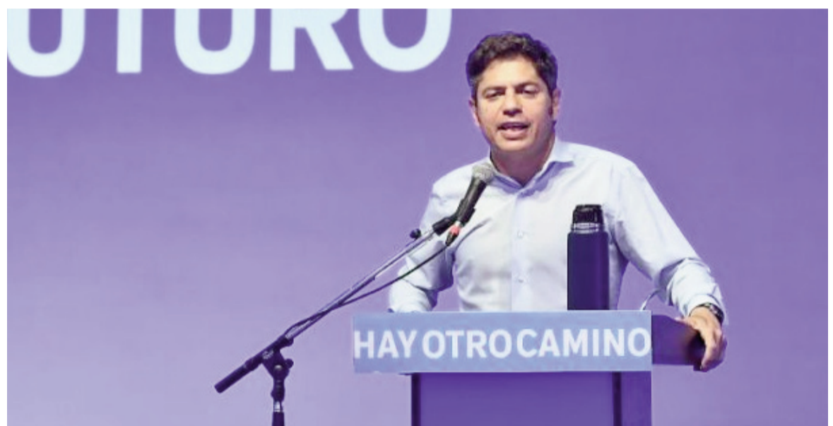
Gobernador Axel Kicillof.