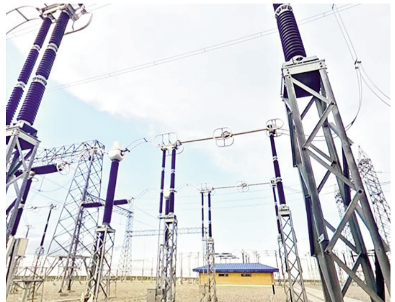
El Gobierno le puso fecha para la venta de las acciones que el Estado tiene en Transener.

Ahora, en el final de año, el foco está puesto en los próximos movimientos. Mientras espera que los fondos de las hidroeléctricas engrosen las reservas del BCRA, el Gobierno abrió el concurso para la venta de acciones que controlan Transener, la principal transportadora de energía del país y un paso clave hacia la privatización