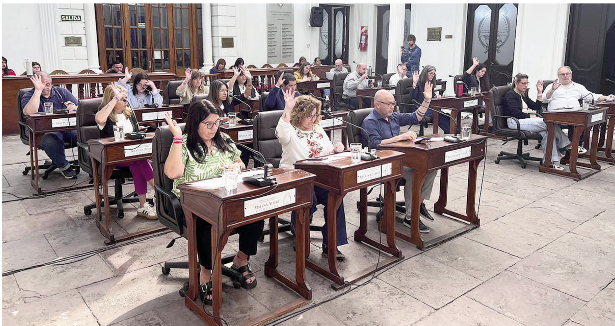
A lo largo de 2025, el Concejo Deliberante celebró 18 sesiones ordinarias, una extraordinaria, una preparatoria y una asamblea con mayores contribuyentes. ARCHIVO / EL NORTE