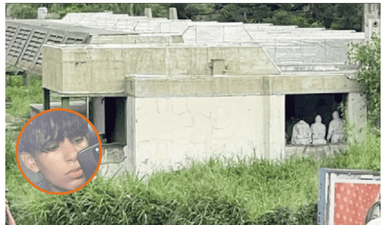
Investigan el homicidio de un adolescente.

Los detenidos de 14 y 15 años participarán en una audiencia de atribución del hecho en la que se determinará su grado de participación.