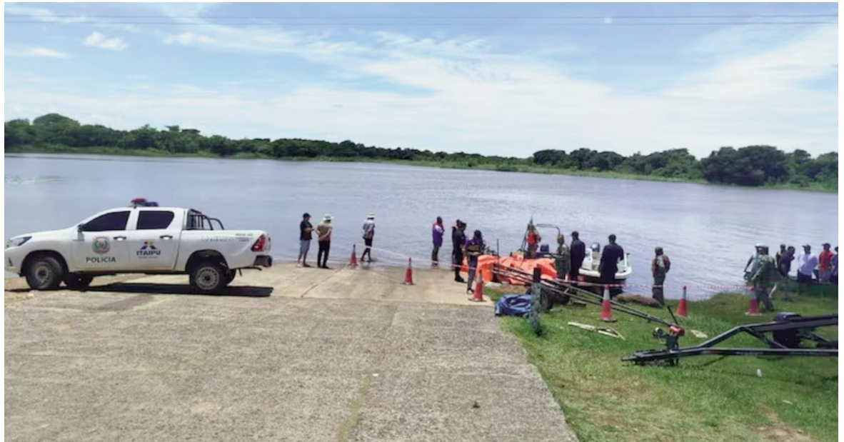
Un naufragio causó la muerte de tres argentinas.

Las autoridades continúan con la búsqueda del hombre que desapareció en el naufragio, añadió.