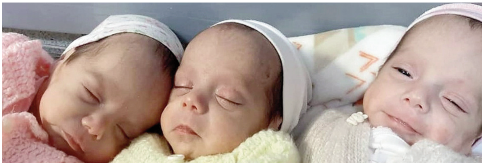
Nacieron trigemelas en Chubut.

Las tres bebés nacieron el 25 de diciembre en Trelew. El gobernador Ignacio Torres celebró la noticia y destacó el trabajo del sistema de salud provincial.