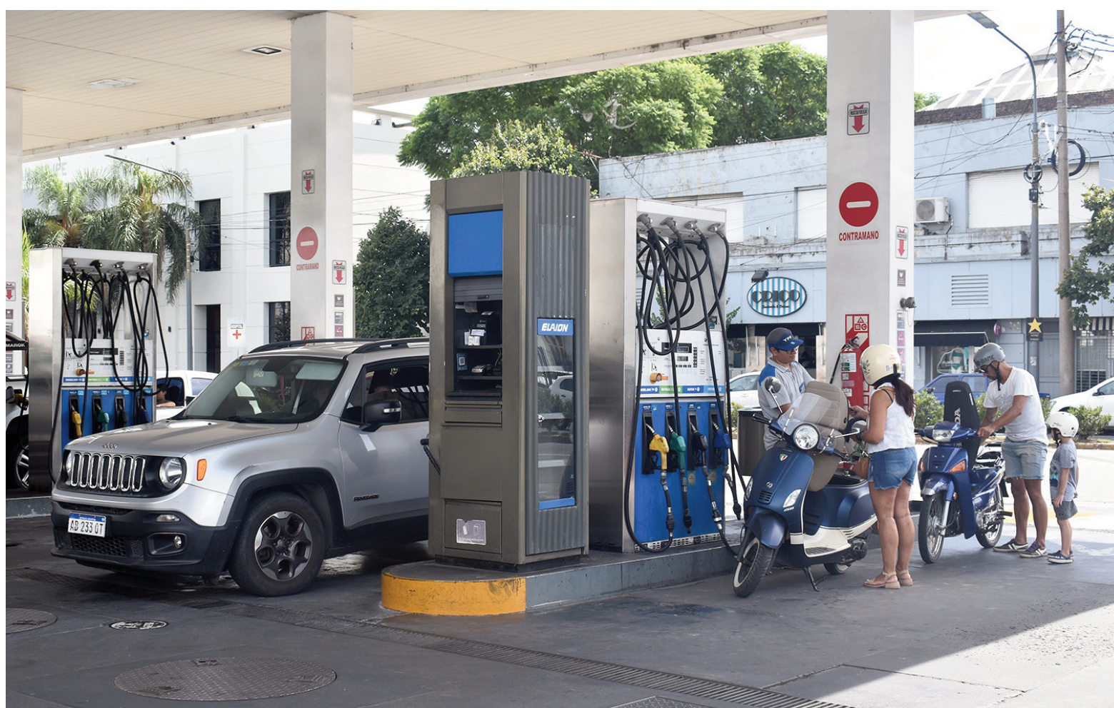
En las estaciones de servicio YPF de San Nicolás, los combustibles acumularon subas promedios del 36,18% en todo el año.

Con aumentos mensuales entre enero y fines de julio y posteriores ajustes más frecuentes y casi cotidianos a partir de entonces, los precios de los combustibles en las estaciones de servicio de la petrolera estatal de YPF que operan en San Nicolás cierran el año 2025 con una variación ascendente del orden del 36,18%, valor que expresa un promedio entre los distintos cuatro tipos de productos que se expenden en los surtidores. Natu-