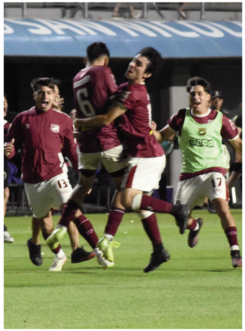
El Granate celebró su campeonato número 22 en la Liga. EL NORTE

MARCELO SASSAROLI deportes@diarioelnorte.com.ar