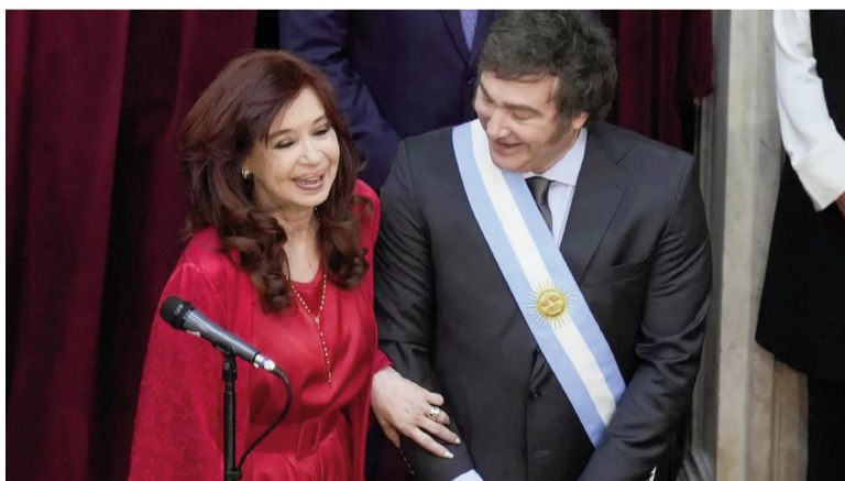
Cristina Kirchner y Javier Milei.

En un giro sorpresivo dentro de la habitual confrontación política, el presidente Javier Milei se refirió a la salud de la expresidenta Cristina Kirchner, quien permanece internada en el Sanatorio Otamendi debido a un cuadro de apendicitis.