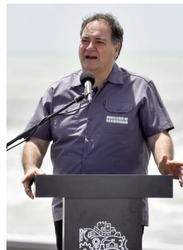
El ministro de Seguridad bonaerense, Javier Alonso.

La iniciativa desplegará dispositivos de seguridad, salud y transporte