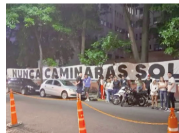
La vigilia frente al Sanatorio Otamendi, donde está internada Cristina Kirchner.

blemas de salud tratados en diversos centros de salud. En 2013, cuando era la jefa del Poder Ejecutivo, fue intervenida en el Hospital Universitario de la Fundación Favaloro para remover una colección subdural crónica en la cabeza.