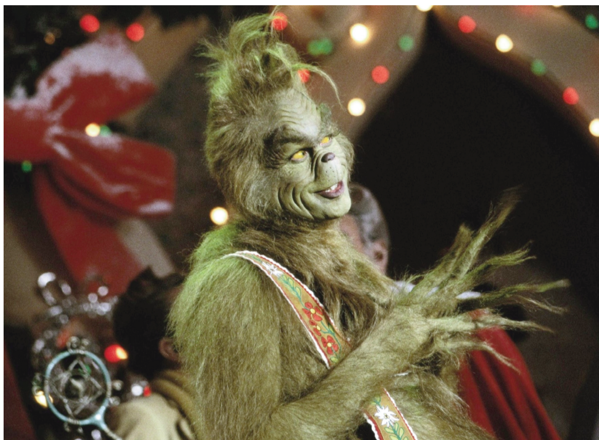
El Grinch es uno de los personajes más destacados de las películas navideñas.

Cuenta la historia del pueblo de Who, donde todos los habitantes adoran la Navidad y año tras año esperan impacientes la llegada de Papá Noel. Al norte de Who, vive escondida una criatura verde que se hace llamar Grinch. Harto del espíritu alegre y fes-