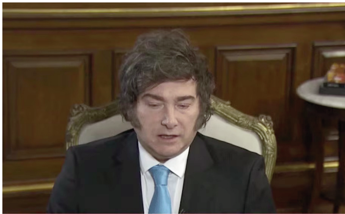
El presidente brindó una entrevista este domingo en el que defendió la sanción del presupuesto en Diputados.

"El déficit es inmoral", reiteró el presidente Milei y dijo que garantizará un presupuesto equilibrado "sin subir impuestos".