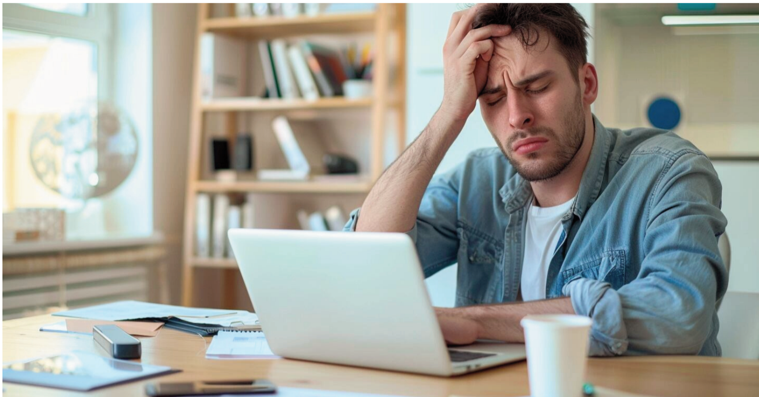
El cansancio mental afecta la atención, la memoria y la regulación emocional, impactando la vida personal y profesional.

Los investigadores comprobaron que los descansos cognitivos breves mejoran la retención de datos y for-