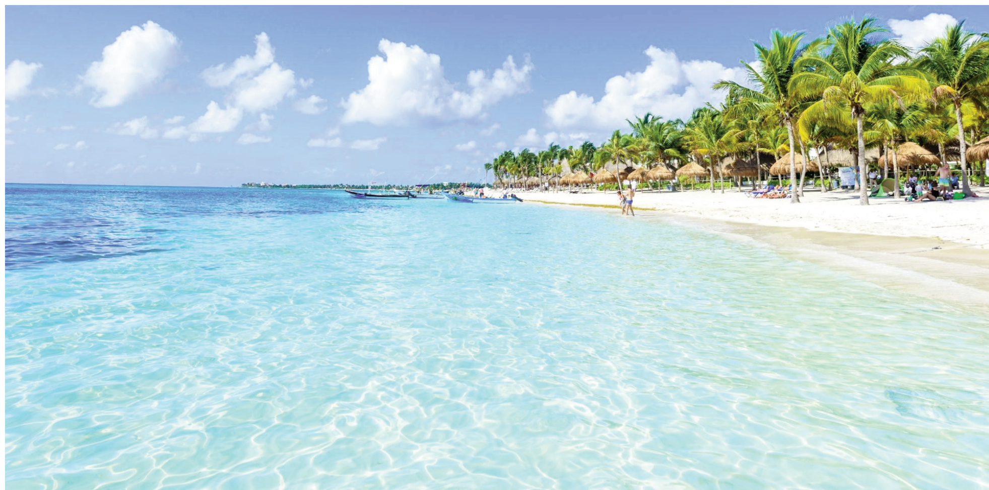
Desde las agencias locales sostienen que hay una demanda marcada hacia el Caribe y Brasil en esta temporada estival. ILUSTRACIÓN

En esta temporada, entre las preferencias de los nicoleños para viajar se destacan destinos como Brasil desde el sur al noreste, República Dominicana, Cuba o el Caribe mexicano. Los precios al Caribe se inician desde USD 1700 por persona con todo incluido, a Puerto Plata o Cuba, que son los destinos más económicos, o desde USD 2000 a República Dominicana o Caribe mexicano. En Brasil, siete noches se consiguen desde USD 900 en adelante con desayuno.