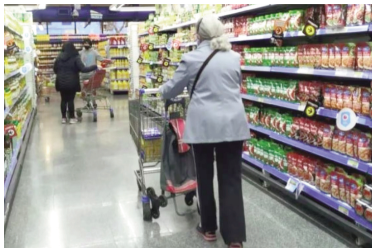
El consumo sigue sin recuperarse.

bién varió de manera significativa según el canal. En self service, las ventas cayeron -2,4% interanual en noviembre y acumularon una baja