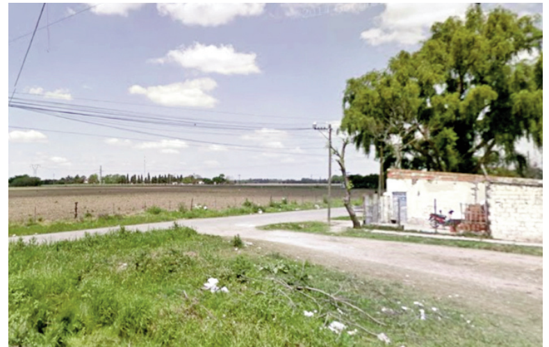
Sector de la ciudad en el que ocurrieron los trágicos hechos.

Asimismo, aseguraron que no se trató de un enfrentamiento. "Era un nene que no se metía con nadie; iba caminando porque su casa queda en Las Viñas, justo su mamá no lo pudo ir a buscar y venían caminando, y este loco les salió de atrás...", expresaron. También señalaron que el agresor habría protagonizado episodios similares en otras oportunidades, aunque esta vez el accionar terminó con la