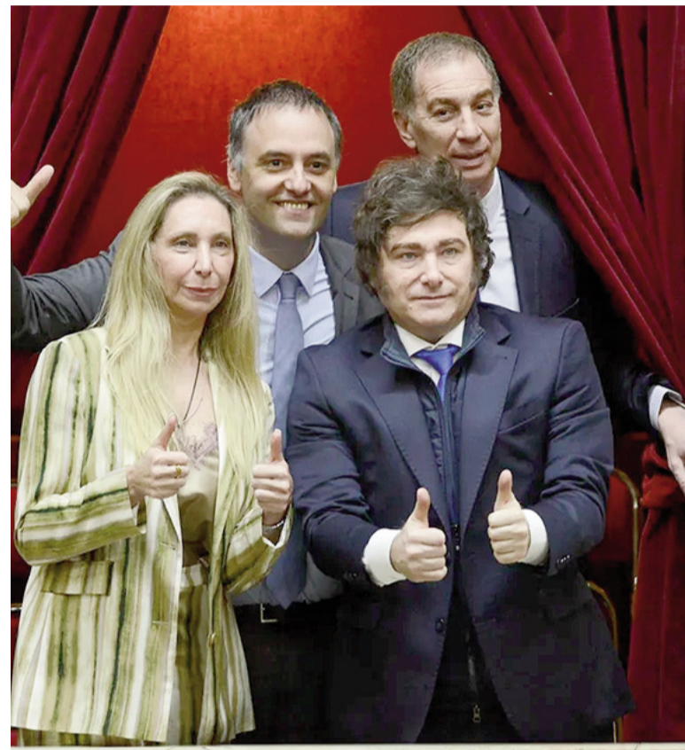
El Presidente acompañó la jura de los diputados.

Otro polo de poder clave serán los gobernadores peronistas distanciados del kirchnerismo. Los salteños de Gustavo Sáenz y los misioneros de Hugo Passalacqua permanecerán en el bloque Innovación Federal, con siete diputados. Actuarán coordinados con los tucumanos de Osvaldo Jaldo, los catamarqueños de Jalil y la neuquina de Rolando Figueroa. A ellos podrían sumarse dos legisladores que responden al sanjuanino Marcelo Orrego. En conjunto, reúnen 16 escaños. La izquierda tendrá 4 diputados, mientras que otros cinco estarán dispersos en bancadas unipersonales.