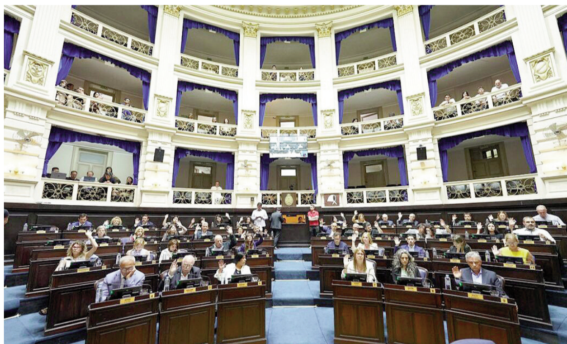
La Legislatura quedó en cuarto intermedio.