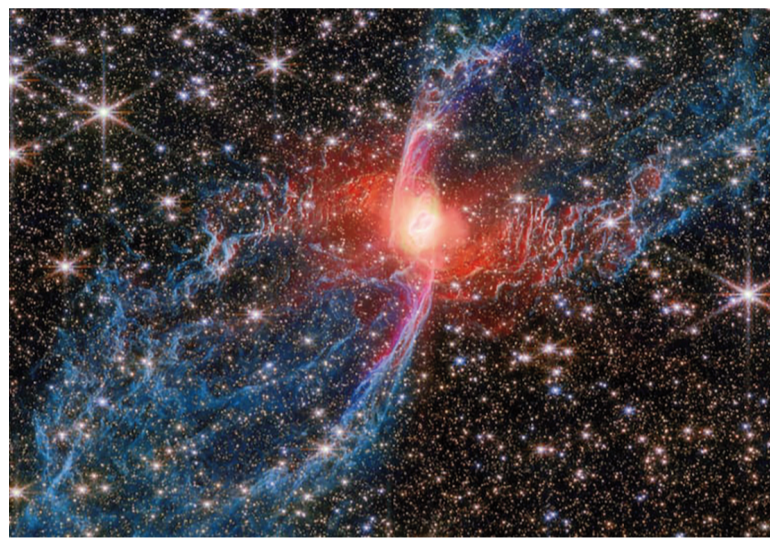
La historia del universo es una de las grandes incógnitas de la humanidad.

"Alaknanda revela que el universo temprano era capaz de un ensamblaje galáctico mucho más rápido de lo que anticipábamos", afirmó Wadadekar. "De alguna manera, esta galaxia logró reunir diez mil millones de masas solares en estrellas y organizarlas en un hermoso disco espiral en apenas unos cientos de millones de años. Eso es extraordinariamente rápido en