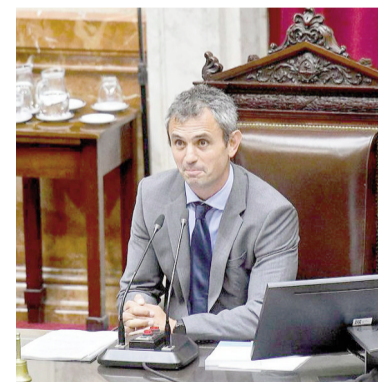
Martín Menem sigue al frente de Diputados.

Los diputados de izquierda también se abstuvieron, aunque con otro enfoque. Myriam Bregman fundamentó la postura en el desacuerdo con la agenda económica del Gobierno y su vínculo con el Fondo Monetario Internacional, mientras que Néstor Pitrola fue más directo al calificar de «antiobrera» la orien-