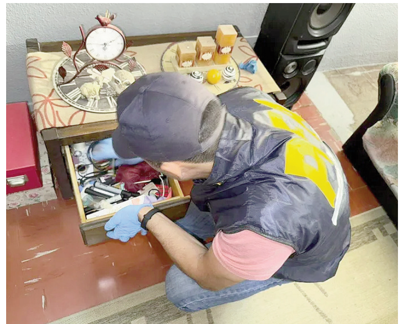
Agentes especializados realizaron procedimientos en Pergamino y Ocampo.

La participación de Cibercrimen Pergamino y la UFIJ N° 3 reafirma el compromiso local con una política de persecución penal moderna, basada en tecnología, cooperación y una firme defensa de los derechos de niños, niñas y adolescentes.