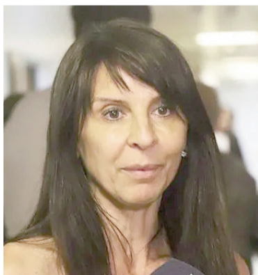
La senadora electa no asumirá su cargo.

«Yo no me involucré en este proyecto por un asiento, ni por una dieta, ni por honores personales. Entré porque creo en la libertad, en el mérito, en el trabajo duro y en su liderazgo. Y precisamente por eso, porque creo en este rumbo como la única salida posible para la Argentina, pongo a su entera disposición mi renun-