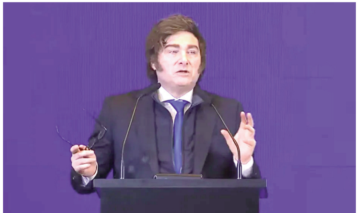
El presidente Javier Milei en La Rural.

En ese marco, afirmó: “Tenemos una oportunidad enorme, hemos dejado atrás el riesgo kuka. La elección del 26 de octubre fue impresionante. Si hubiera sido una elección presidencial, el resultado hubiera sido 41