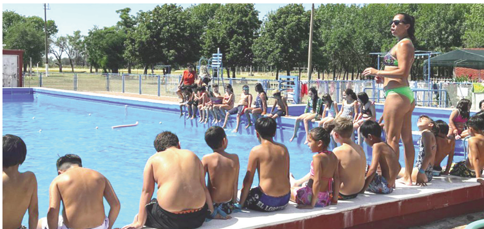
El programa Escuelas Abiertas en Verano brinda actividades deportivas, recreativas y acuáticas a estudiantes de gestión pública.

El programa está destinado a niños y niñas en edad escolar que asistan a establecimientos de gestión pública (desde los 3 años cumplidos) y ado-