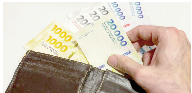
Aumenta el salario mínimo.

De esta manera, el sueldo básico cierra el 2025 con un incremento del 19,69%, por debajo de la inflación acumulada (31,3% hasta octubre).