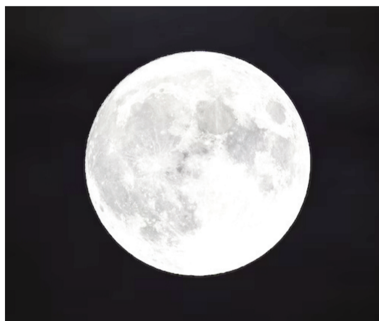
El perigeo llevará la Luna a 357219 kilómetros de la Tierra.

Cada 18,6 años ocurre un standstill, un ciclo que marca sus posiciones más amplias hacia el norte y hacia el sur. Durante 2024 y 2025 se des-