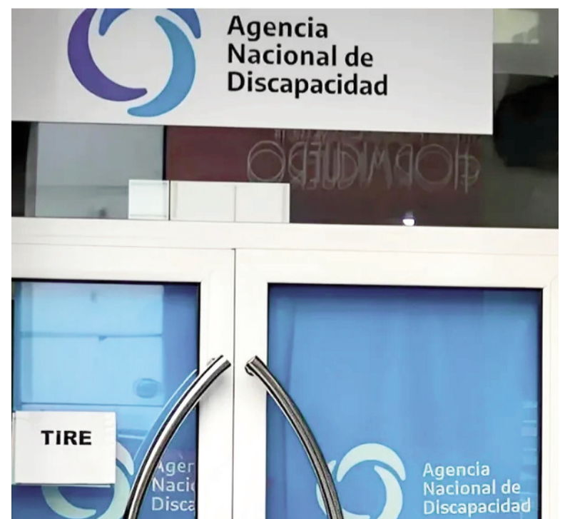
Otro escándalo en la ANDIS.

Los resultados aún no están cerrados y podrían ser oficializados hacia el final del primer trimestre de 2026.