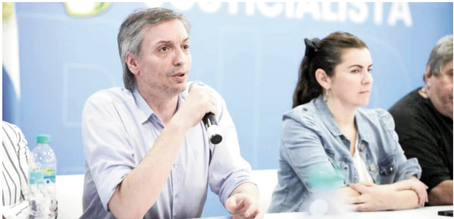
El 15 de marzo se renovar n las autoridades partidarias del PJ bonaerense.