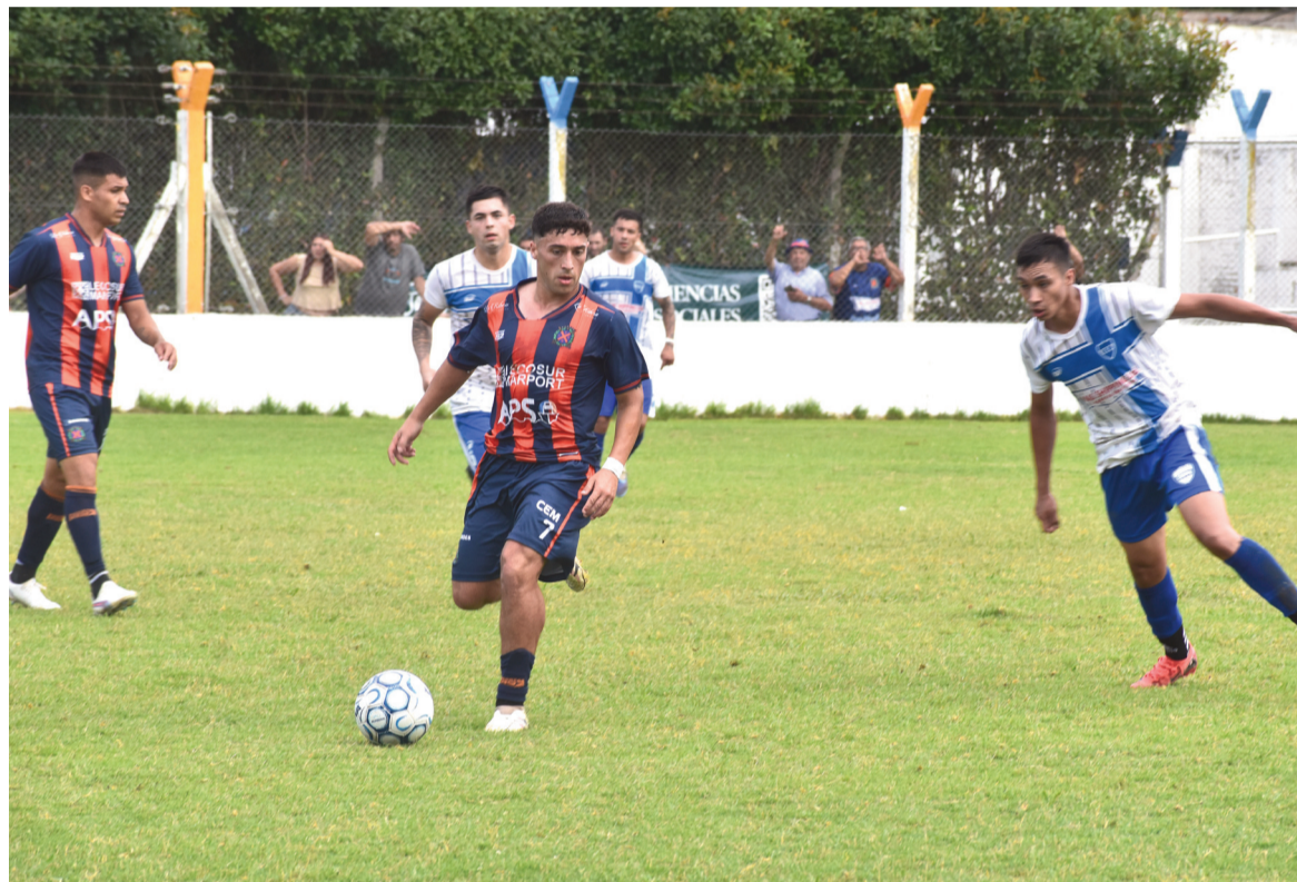
El "General" y el "Náutico" jugarán en Pérez Millán.