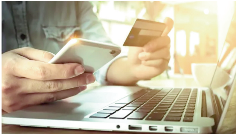
La morosidad por el uso de tarjetas de crédito fue de las que más aumentó.

Los aumentos más importantes se registraron en los segmentos de préstamos personales (+6,5 p.p.) y tarjetas de crédito (+6 p.p.), donde la morosidad marcó un 9,9% y un 7,7%, respectivamente. Paralelamente, en los créditos prendarios la suba fue de 1,1 p.p., hasta el 4,8%, mientras