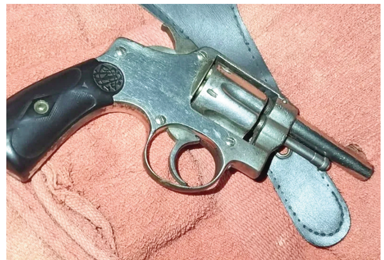
El arma secuestrada en el procedimiento policial de aprehensión del sospechoso. LA OPINION

del arma de fuego utilizada y a la aprehensión del agresor, un sujeto de avanzada edad que se moviliza en silla de ruedas. Desde el Ministerio Público se evalúa encuadrar el hecho en la calificación penal de tentativa de homicidio, teniendo en cuenta la cantidad de disparos efectuados contra la humanidad de la víctima, más allá de que solo uno de ellos haya causado una lesión efectiva. En las próximas horas se resolverá la situación procesal del imputado y las medidas a seguir en la causa. El caso volvió a poner en evidencia cómo conflictos familiares, especialmente en la antesala de las fiestas de fin de año, pueden derivar en episodios de extrema violencia con consecuencias que podrían haber sido fatales.