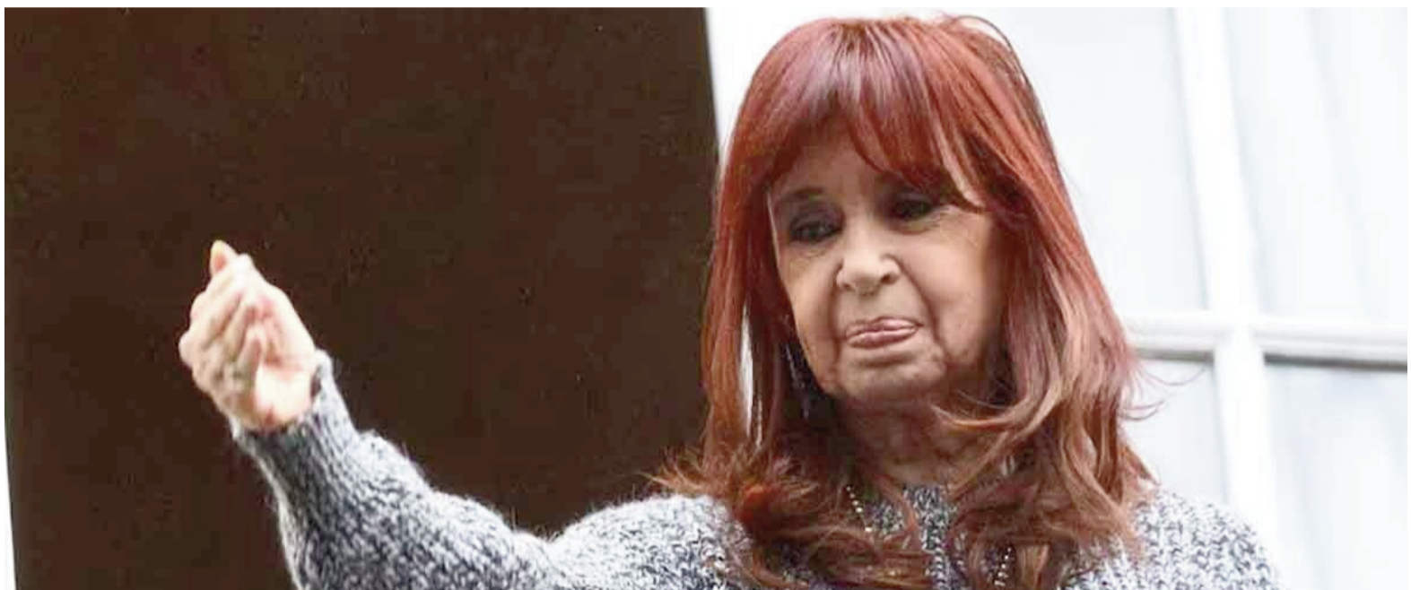
La ex presidenta debió ser intervenida quirúrgicamente.

Cristina Kirchner, de 72 años, cumple prisión domiciliaria en el departamento ubicado en el barrio porteño