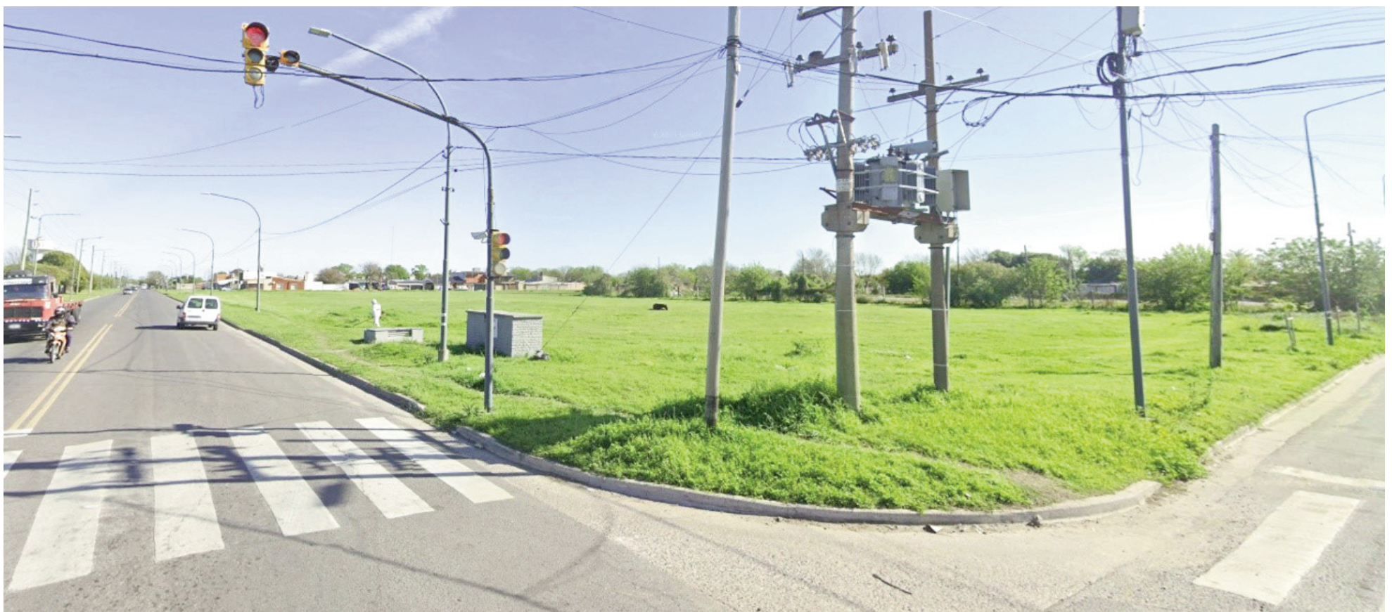
El edificio propio para la Escuela Especial 503 está proyectado en un terreno ubicado en avenida Moreno y Dámaso Valdés.

En agosto pasado, en medio de la campaña electoral bonaerense, funcionarios de la Dirección de Cultura y Educación de la provincia de Buenos Aires y autoridades educativas de Región y Distrito presentaron en San Nicolás el proyecto de edificio propio para la escuela especial que funcionara en el anexo del hospital San Felipe. Se anunció que la obra se licitaría en diciembre, pero al momento ello no ocurrió. Y que la construcción comenzaría en 2026, aunque la inversión no figura en el Presupuesto provincial del año próximo. Hay terreno, pero no hay dinero. Para peor, la gestión que presentó el proyecto ya no es parte del Gobierno.