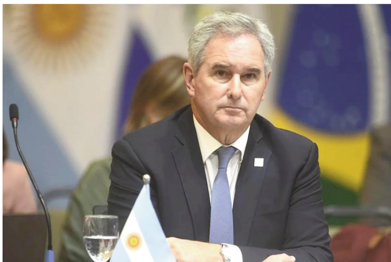
El canciller Pablo Quirno, en la cumbre del Mercosur.

“Somos muy optimistas de que es un acuerdo que se va a firmar prontamente y que va a traer muchísimos beneficios para todos”, resaltó el ministro del gobierno de Javier Milei.