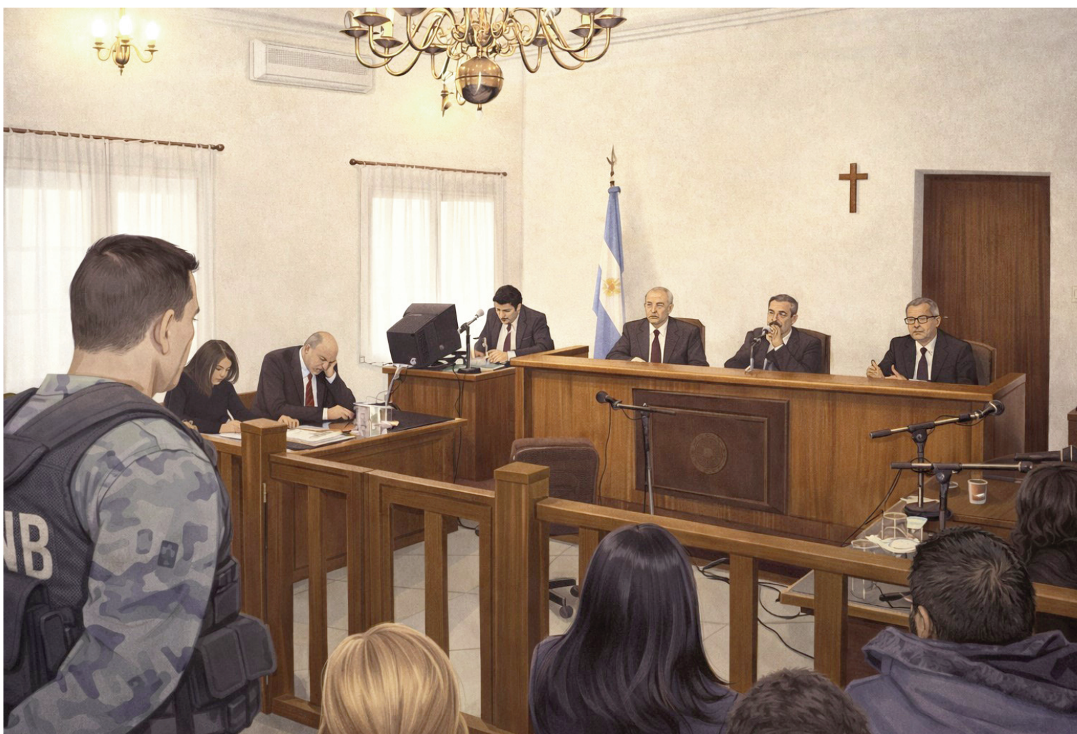
El juicio se llevó a cabo en los Tribunales de Pergamino. IMAGEN ORIGINAL RECONSTRUIDA CON IA.