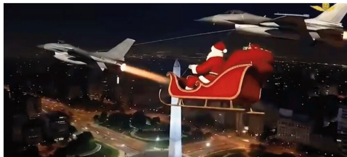
De Dinamarca a Buenos Aires: Papá Noel vuela en los F-16 argentinos.

La institución militar difundió un video por redes sociales en el que el personaje navideño recorre el cielo remolcado por los nuevos aviones de guerra.