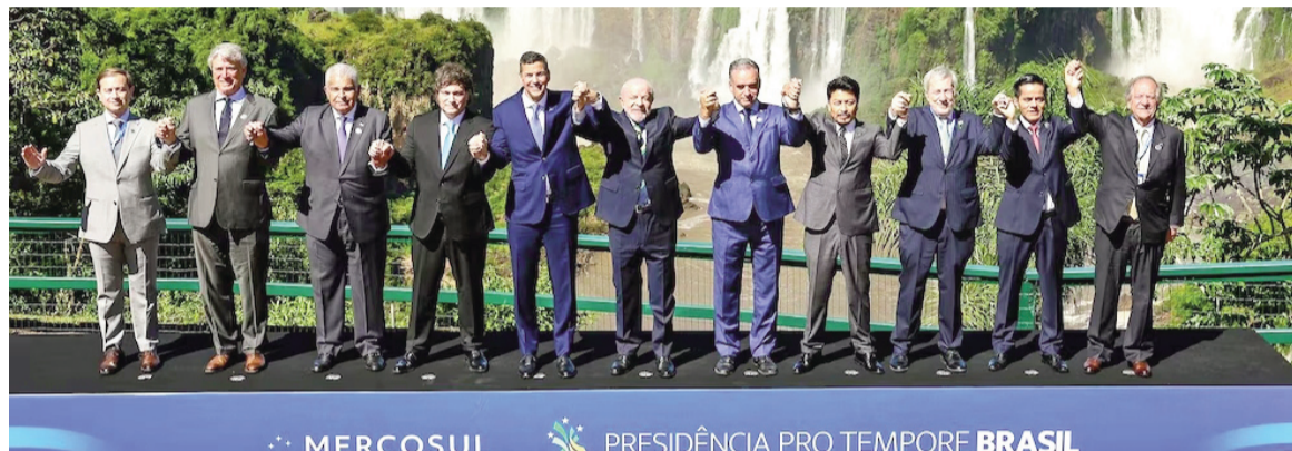
Foz de Iguazú recibió la 67ª Cumbre del Mercosur.

Luego remarcó que “no hay mercado común, no hay libre circulación efectiva, no hay coordinación macroeconómica”, como tampoco “apertura suficiente al mundo”, al considerar que el “Mercosur no