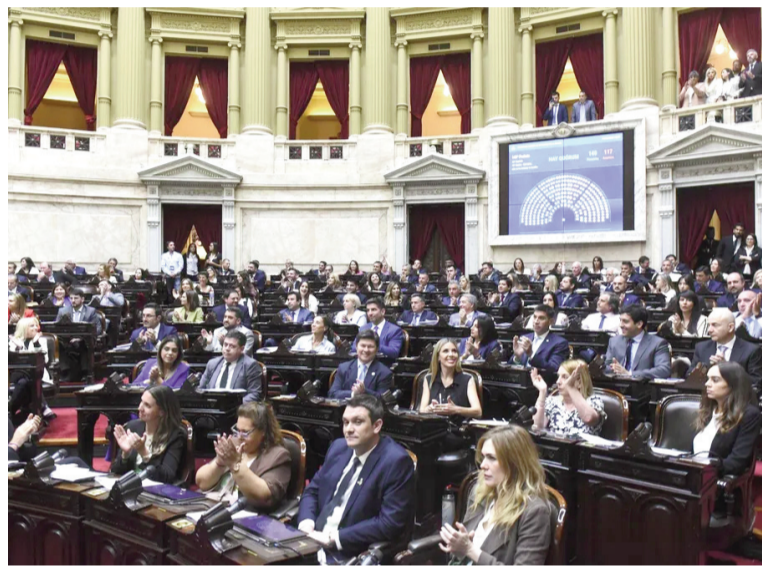
La Cámara de Diputados, en sesión por el Presupuesto.

La iniciativa mantiene la declaración de emergencia en discapacidad, pero plantea que la prestación quede atada a parámetros previsionales: fija la pensión en el 70% del haber mínimo jubilatorio y habilita