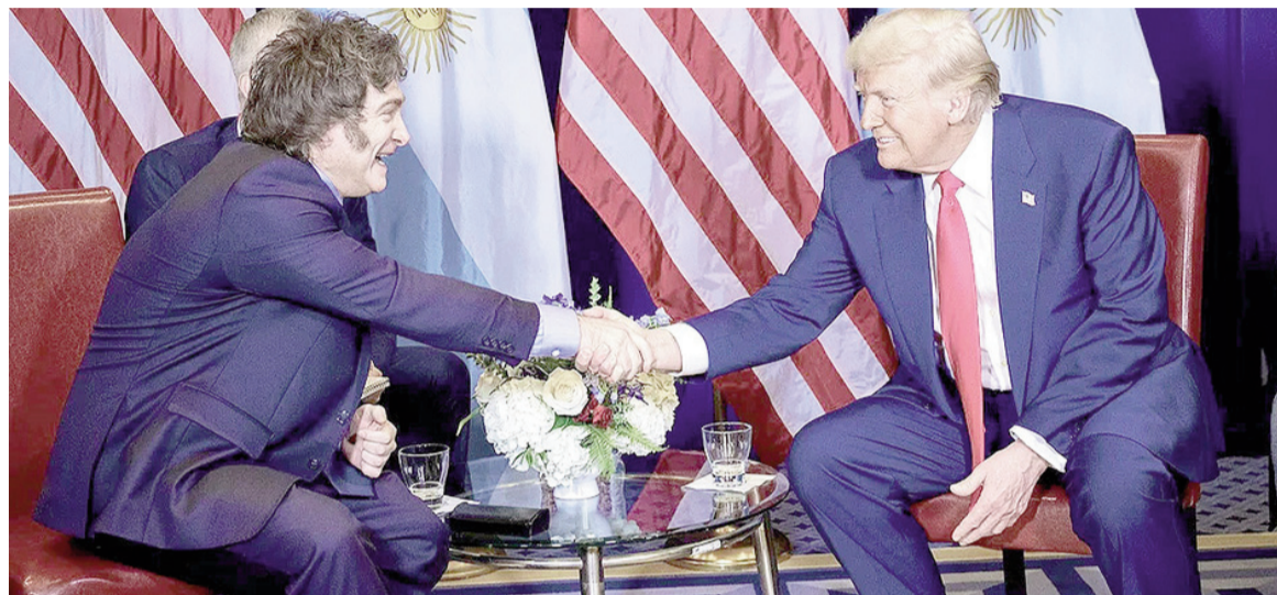
Javier Milei y Donald Trump.

El entendimiento establece que la Argentina dará acceso preferencial a productos estadounidenses, entre ellos medicamentos, maquinaria, dispositivos médicos, tecnología, automóviles, alimentos y bienes agropecuarios. A su vez, Estados Unidos eliminará aranceles