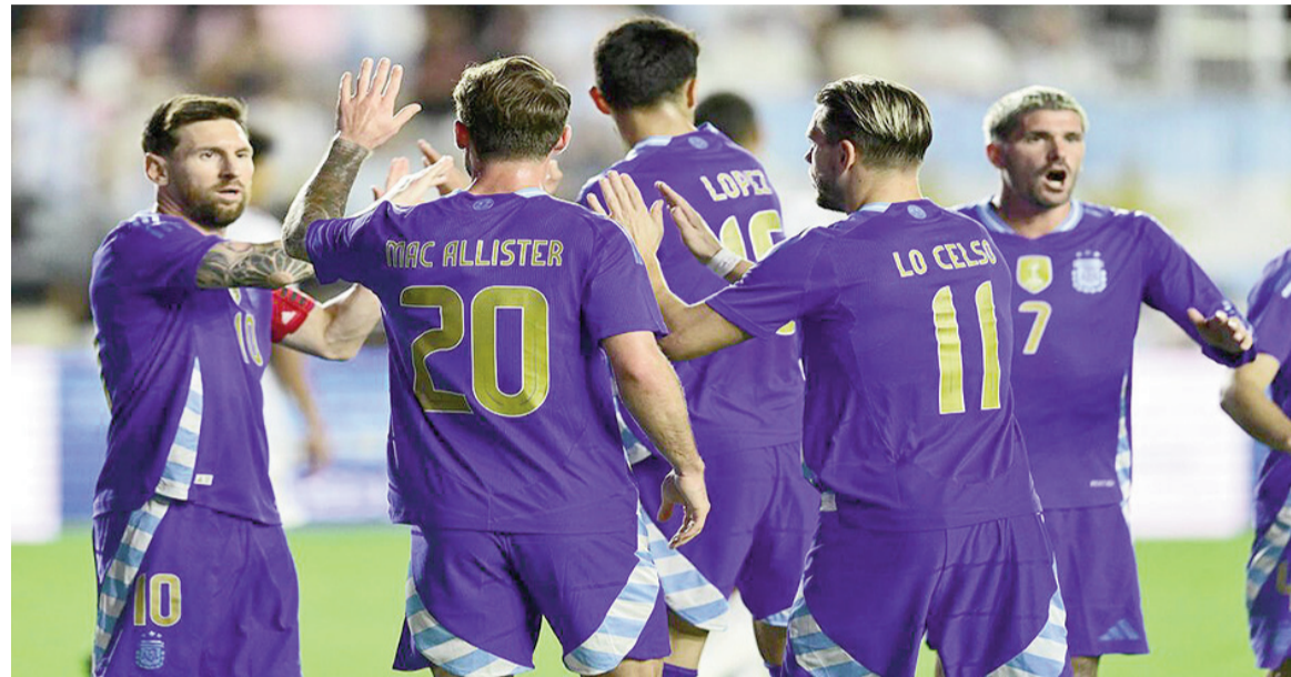
El seleccionado albiceleste jugará en suelo africano.

El plantel dirigido por Scaloni se medirá hoy desde las 13.00 ante el conjunto africano, que celebra el 50mo aniversario de su independencia. Lionel Messi sería titular.