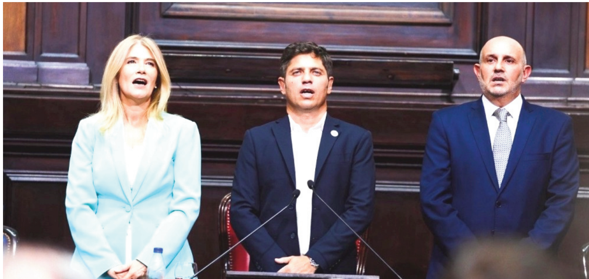
El gobernador Axel Kicillof y sus laderos en el Senado y la Cámara de Diputados: Verónica Magario y Alexis Guerrero.

El Senado bonaerense también convocó a sus miembros a sesionar. Será el miércoles, después del encuentro en Diputados. Así el oficialismo bonaerense de Axel Kicillof prepara el terreno para una semana decisiva, en que deberán votarse un pedido de endeudamiento multimillonario, junto con el Presupuesto y la Ley de Impuestos para 2026. Tres legisladores nicoleños participarán de los trascendentes debates.