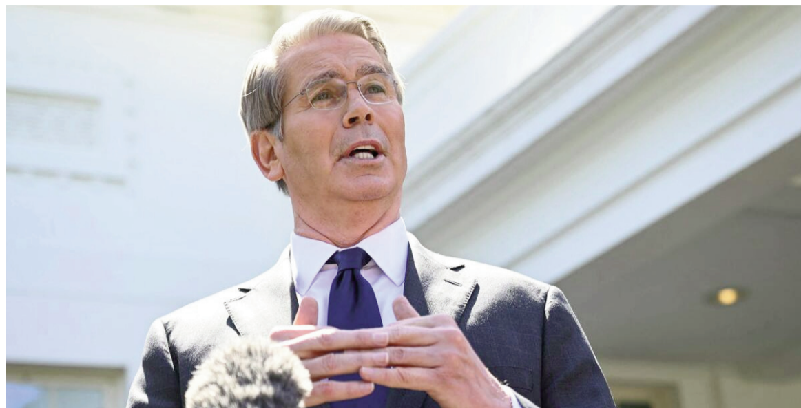
El secretario del Tesoro, Scott Bessent.