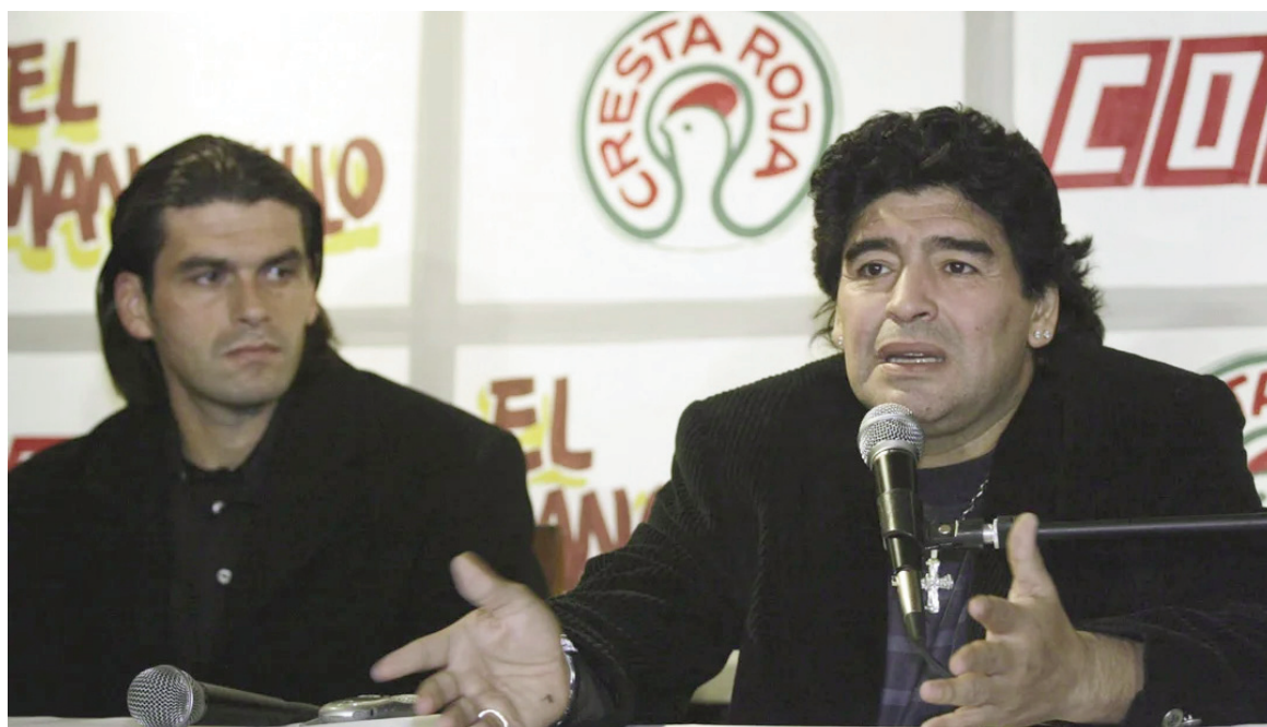
Mancuso fue ayudante de campo de Maradona durante el Mundial de Sudáfrica 2010.

El exayudante de Maradona en Sudáfrica 2010 enfrentará un debate oral en Mar del Plata por presuntamente recibir dinero en efectivo a cambio de cheques falsos o irregulares emitidos en 2021.