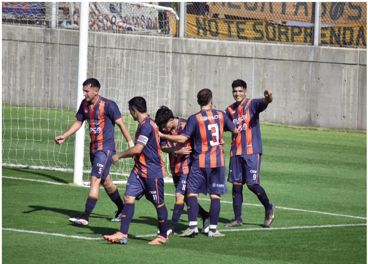
El "Náutico" hizo añicos a Belgrano en el clásico. EL NORTE

Belgrano tuvo una sola ocasión sobre el final de la etapa: Ocanto pateó desde lejos y Furlán se es-