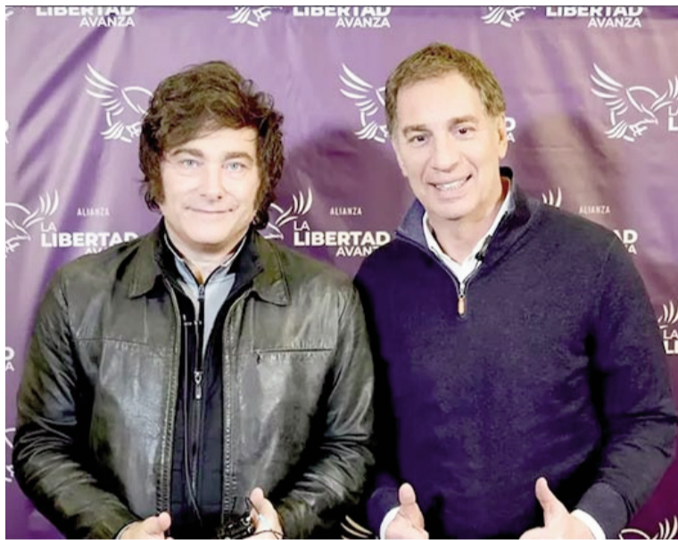
Javier Milei ungió de ministro a Diego Santilli.

“Tenemos ministro del Interior: bienvenido Colo Santilli”, escribió Milei y siguió: “Diego será quien llevará adelante las conversaciones con gobernadores y legisladores para poder articular con el Congreso de la Nación cada uno de los consensos necesarios para las reformas que vienen de cara al futuro”. Horas atrás, y para afianzar el apoyo al presidente Milei, Santilli respaldó la decisión de no invitar al gobernador de la provincia de Buenos Aires, Axel Kicillof, al encuentro con los mandatarios provinciales que se llevará a cabo