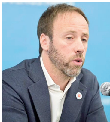
Ministro Pablo López.

Una vez conocida la noticia de esta reunión, algunos legisladores, en estricto OFF fueron cautos, pero las críticas más subidas vinieron de parte de algunas voces del bloque oficialista. El diputado de una de las tribus peronistas advirtió que "si los negociadores van a ser los del año pasado y se van a sentar sin posibilidad de ceder en algunas cuestiones,