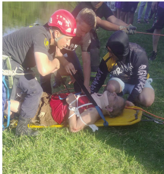
Un hombre fue rescatado por los bomberos.

Un hombre de 74 años fue rescatado con éxito este domingo por la tarde por personal del Cuartel de Bomberos de San Nicolás, luego de caer en la costanera de Somisa. El hecho ocurrió alrededor de las 17 horas, y el operativo contó con la intervención de la Comisaría Segunda y personal de salud.