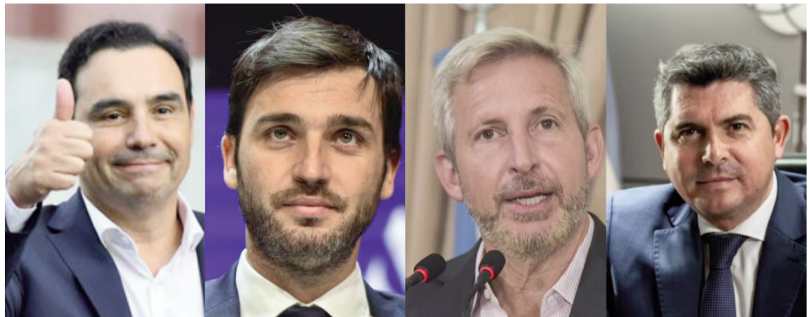
Los gobernadores dialoguistas celebraron la llegada de Santilli al Ministerio del Interior.