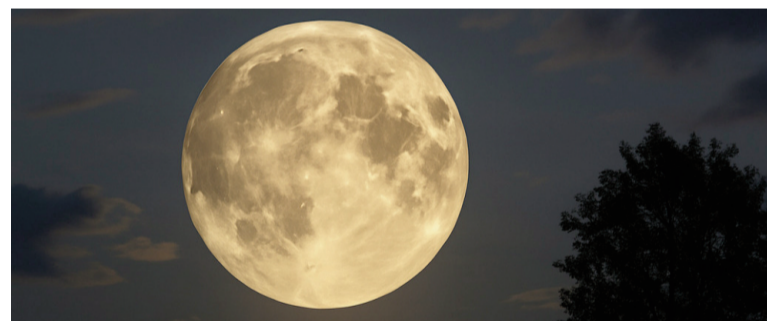
Superluna de noviembre.

Las superlunas ocurren varias veces al año. Una en octubre hizo que la luna se viera algo más grande, y otra en diciembre será la última del año.