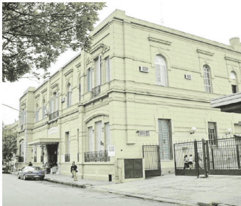
Los tres hombres heridos ingresaron en el Hospital Cullen.

Las otras dos víctimas resultaron con heridas en las piernas, y se desconocía la gravedad de su estado.