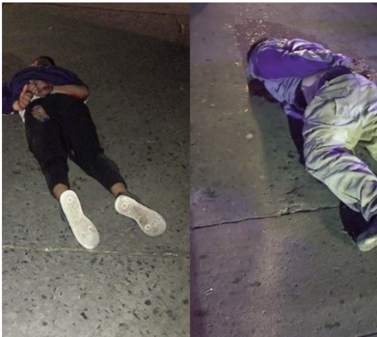
Acusados de ser culpables de una muerte en barrio Ludueña.

La jornada del sábado se conmovió con tres episodios muy brutales. Barrio Ludueña, Triángulo Moderno y Villa La Lata, los escenarios del horror. En dos de los tres hechos fueron detenidos los presuntos responsables.