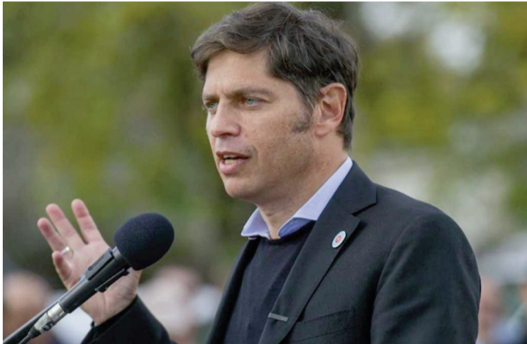
El gobernador Axel Kicillof.

El gobernador bonaerense, Axel Kicillof, sumó anoche un fuerte respaldo político al exministro de Planificación Federal Julio de Vido, detenido desde el jueves en el Hospital Penitenciario Central de Ezeiza luego de entregarse en los tribunales de Comodoro Py para comenzar a cumplir la condena firme por la tragedia de Once.