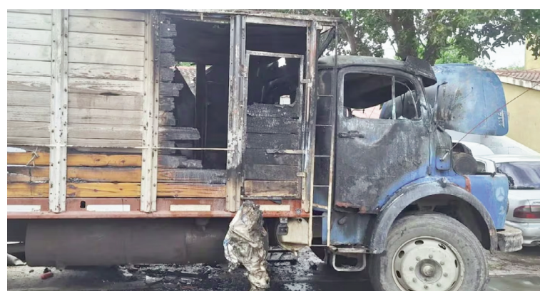
Un nene de 4 años murió tras incendiarse un camión en el que jugaba.

La Justicia investiga las causas que originaron el incendio para determinar cómo se desencadenó el fuego y si hubo elementos que contribuyeron al trágico desenlace.