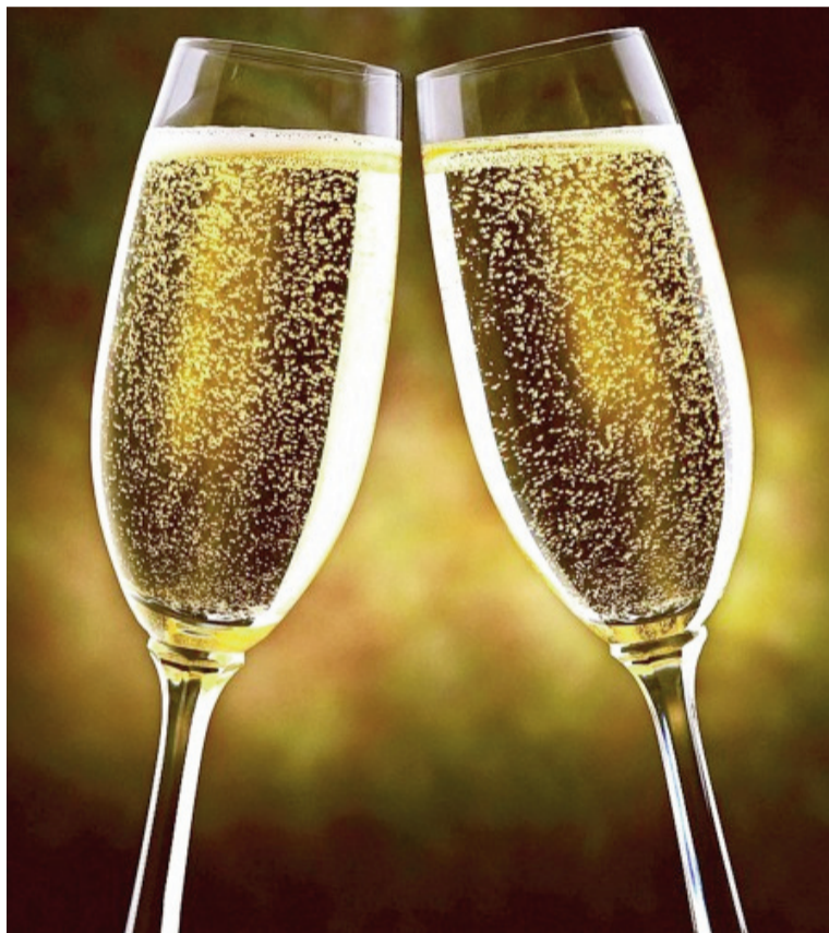
En la 12.ª edición del certamen, participaron 1000 vinos de 21 países y solo 48 productores recibieron trofeos.

Hace años que el CSWWC (Champagne & Sparkling Wine World Championships) se estableció como la competencia de vinos espumosos más prestigiosa y grande del mundo, respetada globalmente por su riguroso proceso de evaluación y jueces especialistas en champagnes y es-