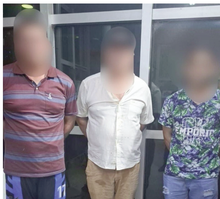
Los sujetos serían los responsables de un deceso en el barrio El Triángulo.

20.30 del sábado, se produjo un hecho de suma violencia. Dos personas que se movían en moto dispararon contra una vivienda ubicada en Solís al 400 bis. En el ataque, hirieron de muerte a una persona. Luego del ataque, los agresores notaron la presencia de oficiales de Gendarmería y se trenzaron en una balacera con ellos. Allí comenzaron una huida por Solís hacia el sur y se inició una persecución con oficiales de la policía de la provincia, en la que también hubo intercambio de disparos.