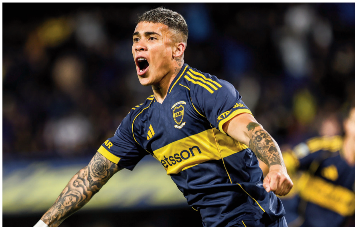
El Xeneize lo liquidó en el complemento y consiguió su cuarta victoria al hilo. WEB

Con goles de Ayrton Costa y Edinson Cavani, de penal, el conjunto de la ribera derrotó por 2 a 0 al Matador en La Bombonera y se adjudicó la Zona A.