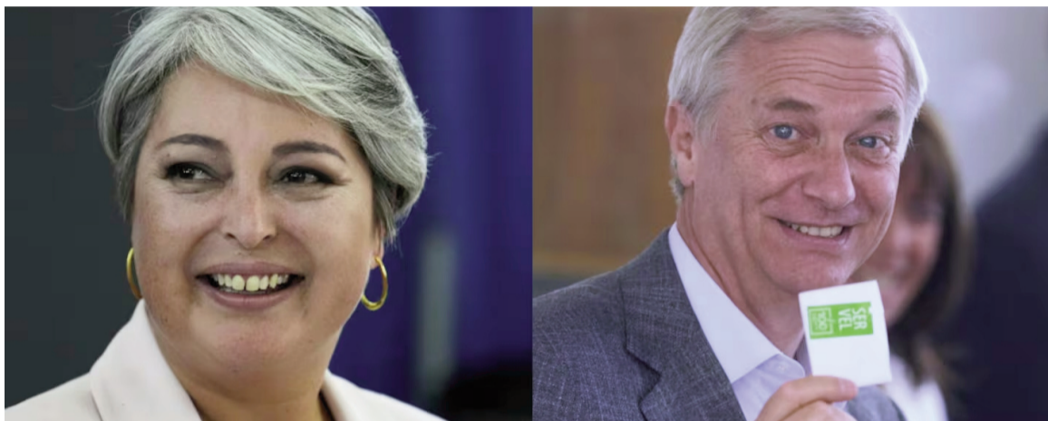
Jeannette Jara y José Antonio Kast, al balotaje.

Luego están Evelyn Matthei, de la coalición Chile Vamos, de centro-