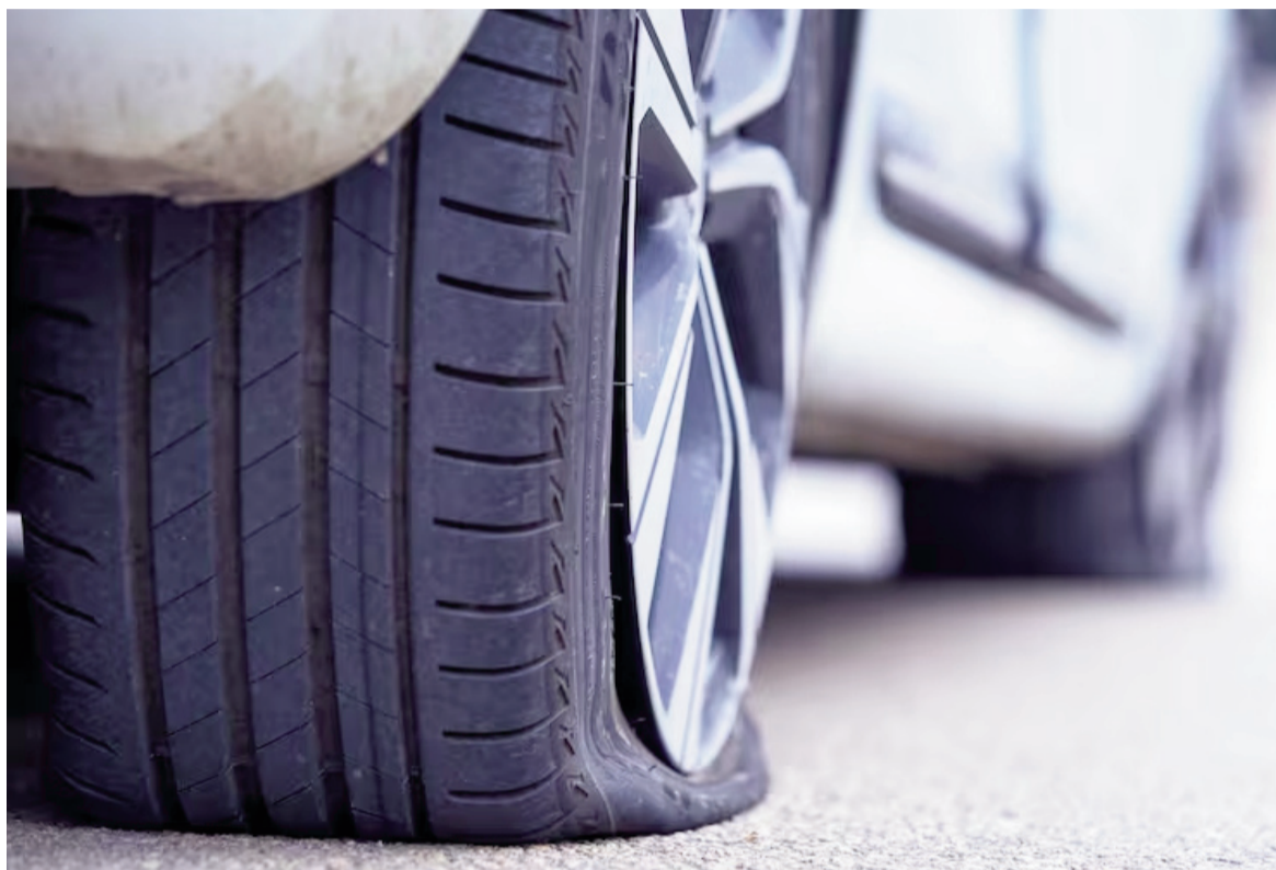
Si un neumático se pincha mientras el vehículo está en movimiento a alta velocidad, no se recomienda frenar de golpe.

● Desgaste irregular: finalmente, Ford México detalla que cuando el desgaste se produce de manera irregular, no solo es momento de cambiar la llanta, sino de revisar la alineación y balanceo