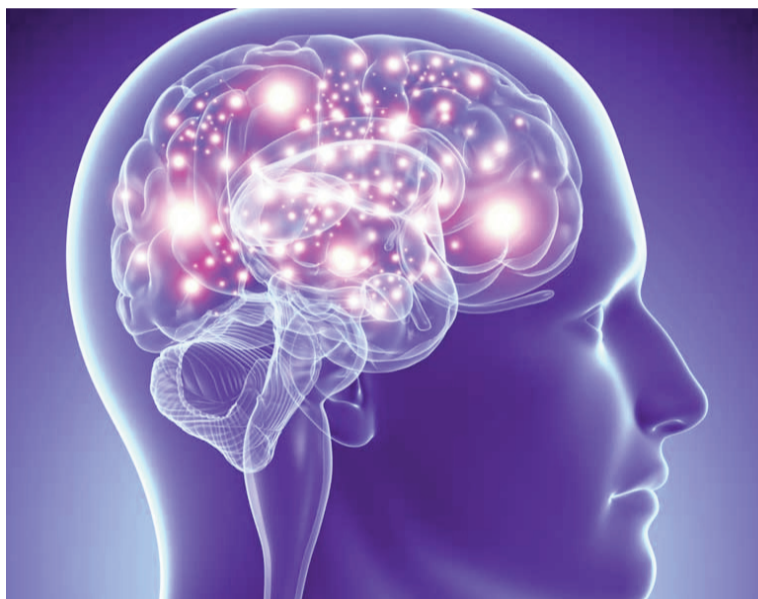
El estudio internacional revela que la plasticidad cerebral permite que ciertas áreas del cerebro crezcan durante el envejecimiento.

La expansión observada se interpreta como manifestación de la plas-