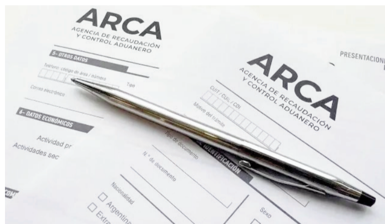
Mañana ARCA dará a conocer el resultado de la recaudación de impuestos de octubre.