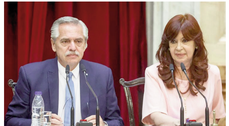
Cristina Kirchner y Alberto Fernández.

Además, defendió el papel de los jefes comunales: “Los intendentes son grandes funcionarios cuando se los convoca. Hay que dejar de mal-