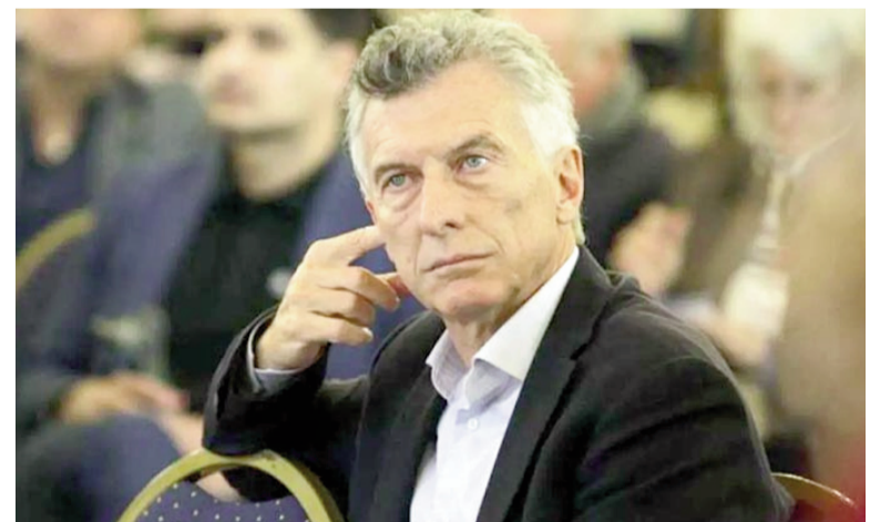
Macri se mostró crítico del cambio en la Jefatura de Gabinete.