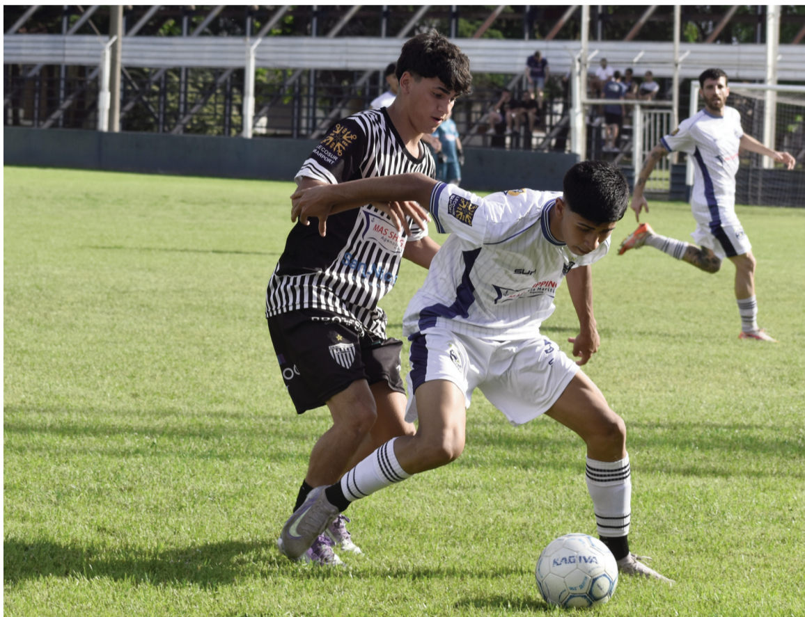
La Emilia sumó un punto valioso para seguir en la cima.

y ocupa el noveno puesto a dos unidades de Regatas y Belgrano.