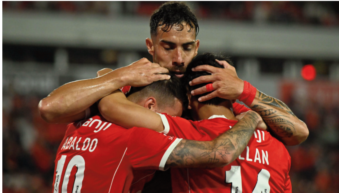
El Rojo ganó en casa y sigue con las chances intactas. WEB

El equipo de Gustavo Quinteros derrotó al Decano por 3 a 0 en el estadio de la doble visera y sigue con chances de clasificar a octavos. Abaldo, Ávalos y Loyola convirtieron los goles.