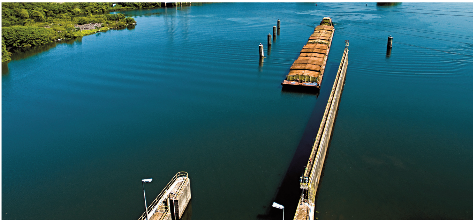
La Hidrovía Paraná-Paraguay es la principal ruta del comercio exterior argentino.

La Agencia Nacional de Puertos y Navegación negó las acusaciones y aseguró que el proceso cumple con todos los requisitos legales. Informó