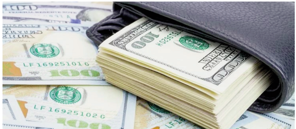
La compra de dólar para atesoramiento se disparó en septiembre.

El salto se dio a la par de una liquidación récord del agro, en medio de una fuerte inestabilidad financiera, debido a la poca credibilidad en el esquema cambiario.