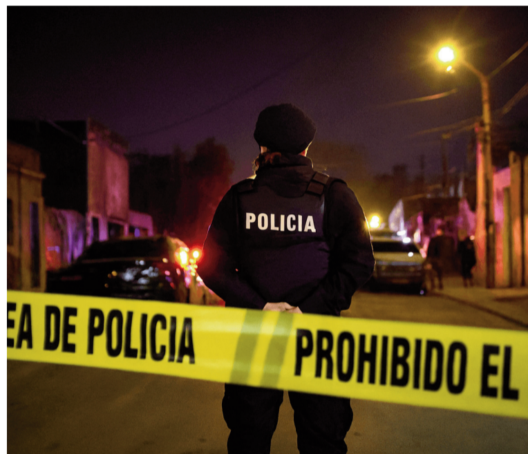
Uruguay enfrenta una «epidemia» de homicidios.

“Es un territorio que sufre una cantidad de índices negativos. Tiene un índice de pobreza muy grande. Nuestra zona tiene lugares de conflicto. Si bien las estadísticas del Ministerio del Interior son fuertes en cuanto a homicidios, la realidad es que los vecinos sufren muchísimo el delito de rapiña (robo), en especial el arrebato. Hay una sensación de miedo por este tipo de delitos superior al de homicidio. El asesinato está muy encapsulado en la disputa narco”, afirmó Velasco.