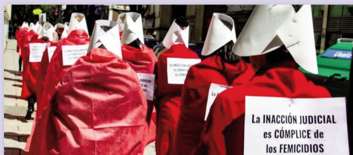
Vestidas como en el Cuento de la Criada: el viernes pasado frente a los Tribunales de Rosario una organización protestó por la "inacción judicial cómplice de los femicidios". WEB

"Sólo el 14% de las víctimas habían denunciado a sus agre-