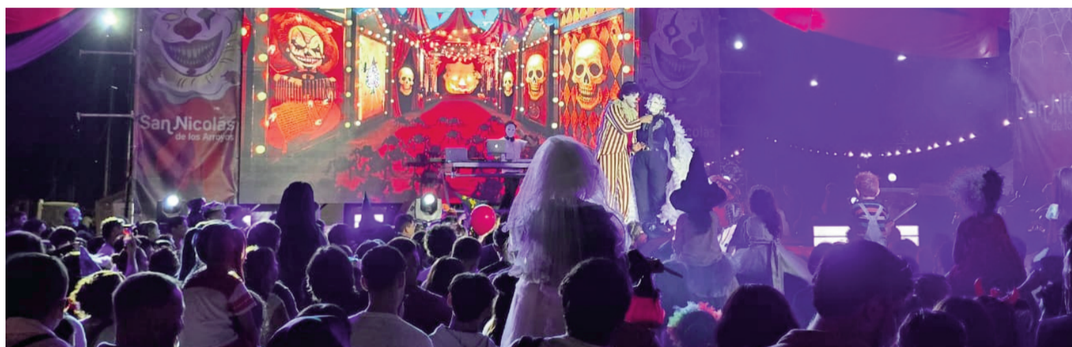
El evento, organizado por la municipalidad, se desarrolla en el Empedrado de 18:00 a 22:00, con entrada libre y gratuita.

Toda la zona cuenta con una decoración particular y espeluznante: una máscara gigante del payaso IT recibe a quienes transitan por la bajada Belgrano y quienes pasan por la plaza Mitre se encuentran con un cementerio con calabazas y esqueletos, dando un marco de terror a un espacio clásico de la ciudad.