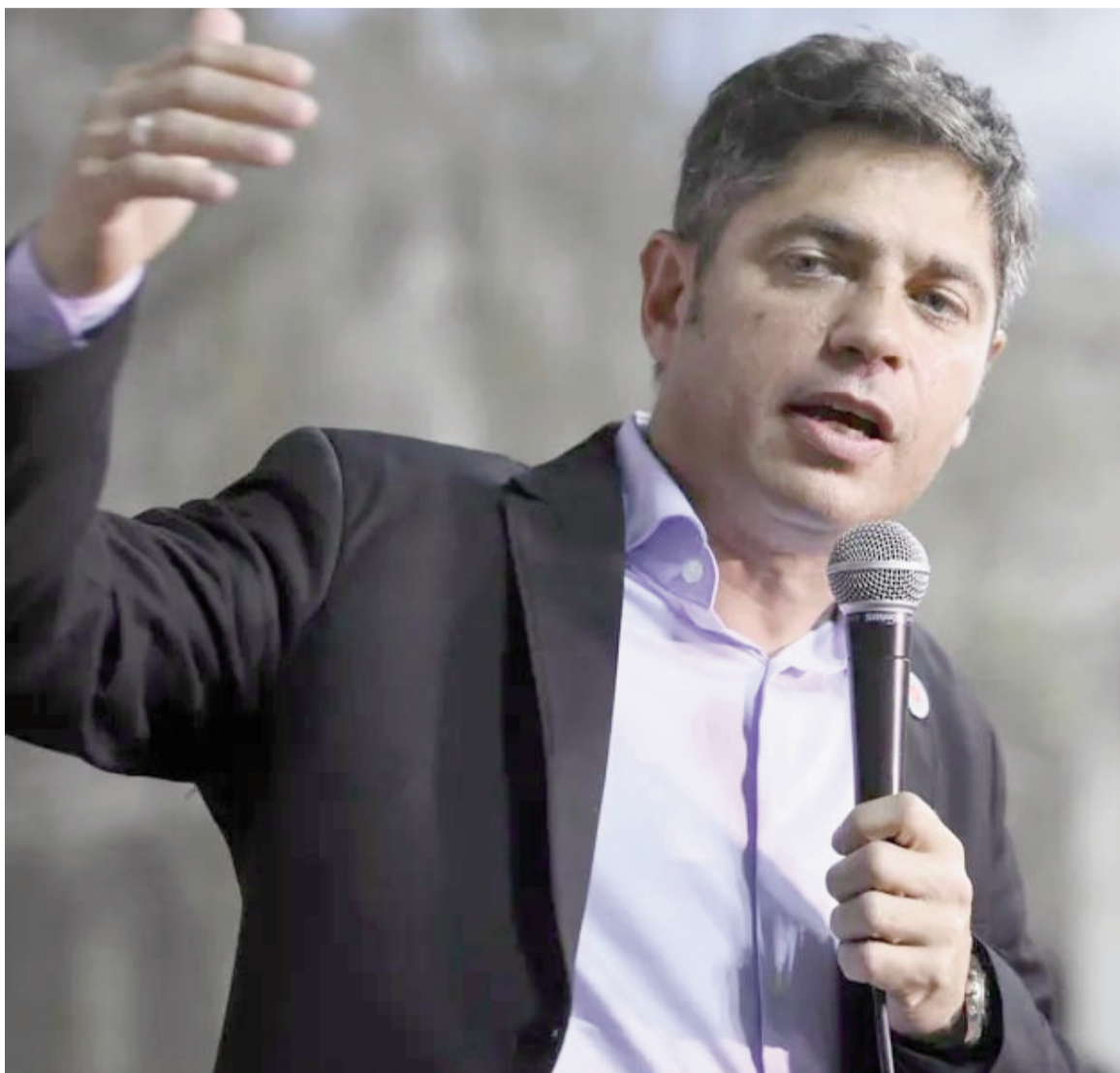
El gobernador criticó que el presidente Milei no lo haya convocado a la reunión de gobernadores.

En la misiva, el exministro de Economía también cuestionó las consecuencias del plan de ajuste económico del Gobierno. Señaló que