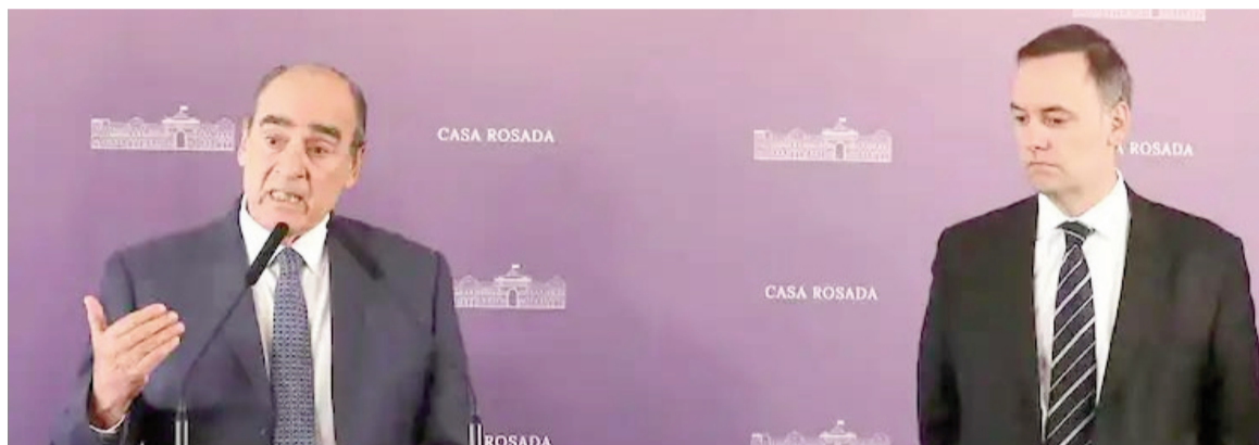
Sale Franco, entra Adorni.

Al hablar de la salida de Francos, el vocero enfatizó: “Francos es una persona sensacional, que hizo un aporte invaluable. Me ayudó mucho y yo le tengo mucho cariño y respeto”.