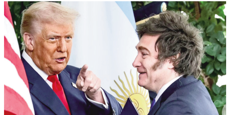
Varios temas sensibles aún no fueron resueltos.

Como se informó, la Argentina eliminó temporalmente sus retenciones a esas exportaciones para aliviar el impacto sobre empresas como Techint y Aluar, pero la negociación por una rebaja