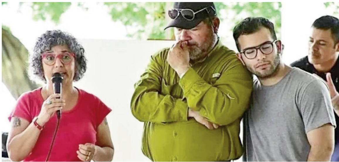
El jurado popular los declaró culpables.