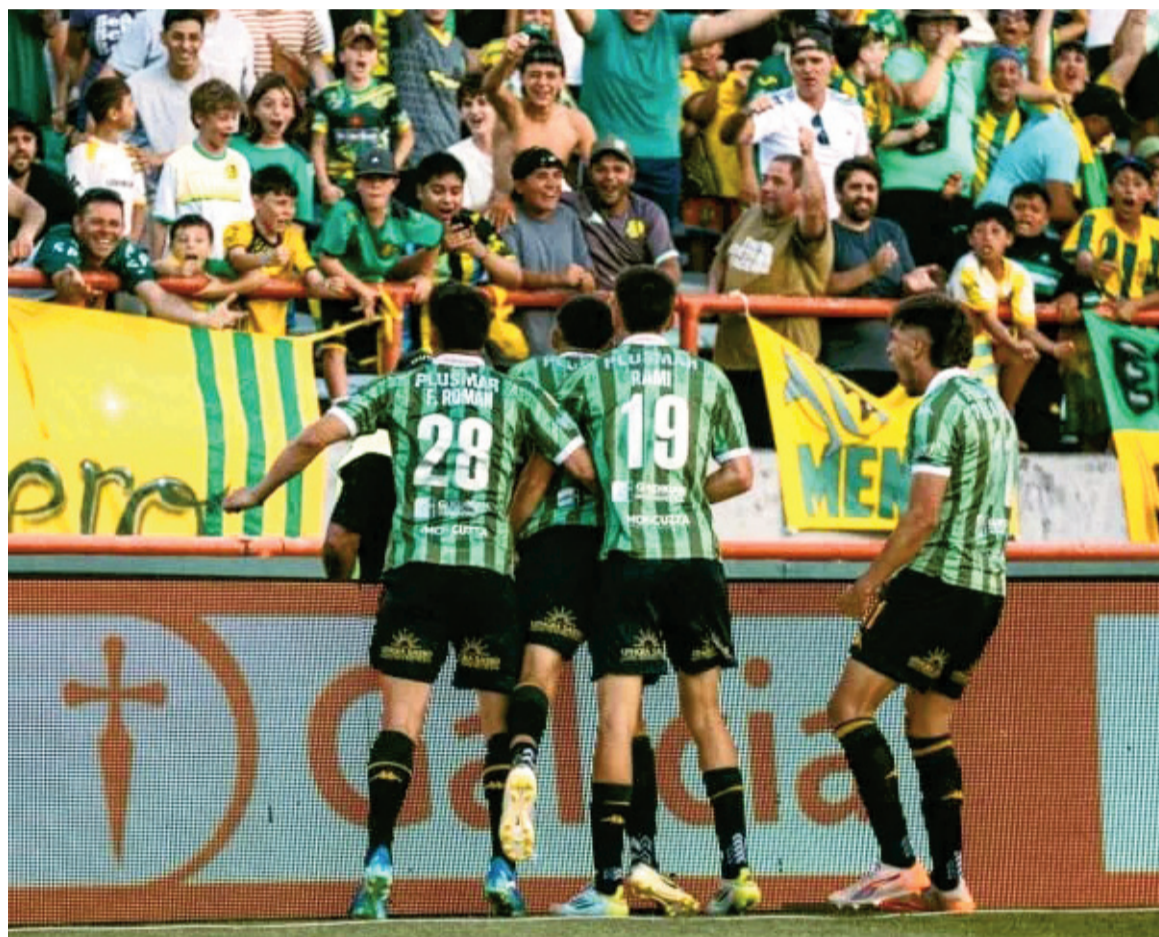
El Tiburón lo dio vuelta en el tramo final y se salvó.

El equipo marplatense se impuso por 4 a 2 en el "José María Minella" y aseguró su permanencia, mientras que el conjunto sanjuanino deberá regresar a la Primera Nacional tras un año en la máxima categoría.