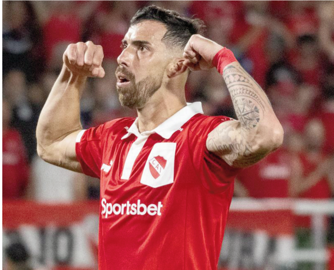
El Rojo de Avellaneda se despidió con una victoria.