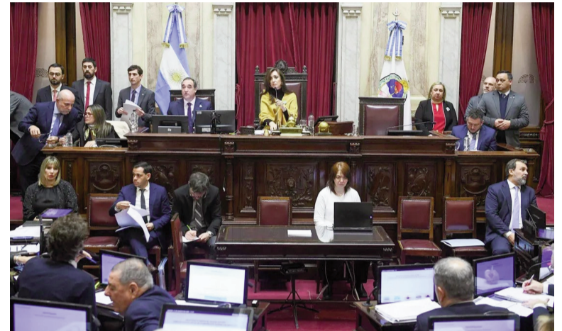
Villarruel presidirá la sesión de asunciones.

"Conversamos y nos pusimos de acuerdo de acá a futuro", dijo Villarruel a la prensa, minutos después del encuentro. Bullrich, por su parte, sostuvo en redes que "la vicepresidenta se mostró totalmente dispuesta a colaborar dentro de su rol institucional. Y es importante distinguir la construcción de una mayoría, que es tarea mía como Jefe de Bloque de La Libertad Avanza, con la función de la Presidente del Senado, que debe garantizar el orden parlamentario y el buen funcionamiento de la Cámara".