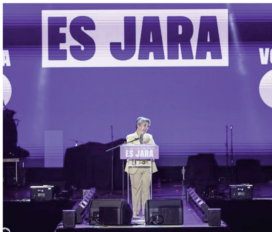
Jara parte como favorita pero habría segunda vuelta, según los sondeos previos.

En el padrón están habilitadas 15.770.000 personas para sufragar: las encuestas mencionan una posible segunda vuelta con la participación de la oficialista Jara.