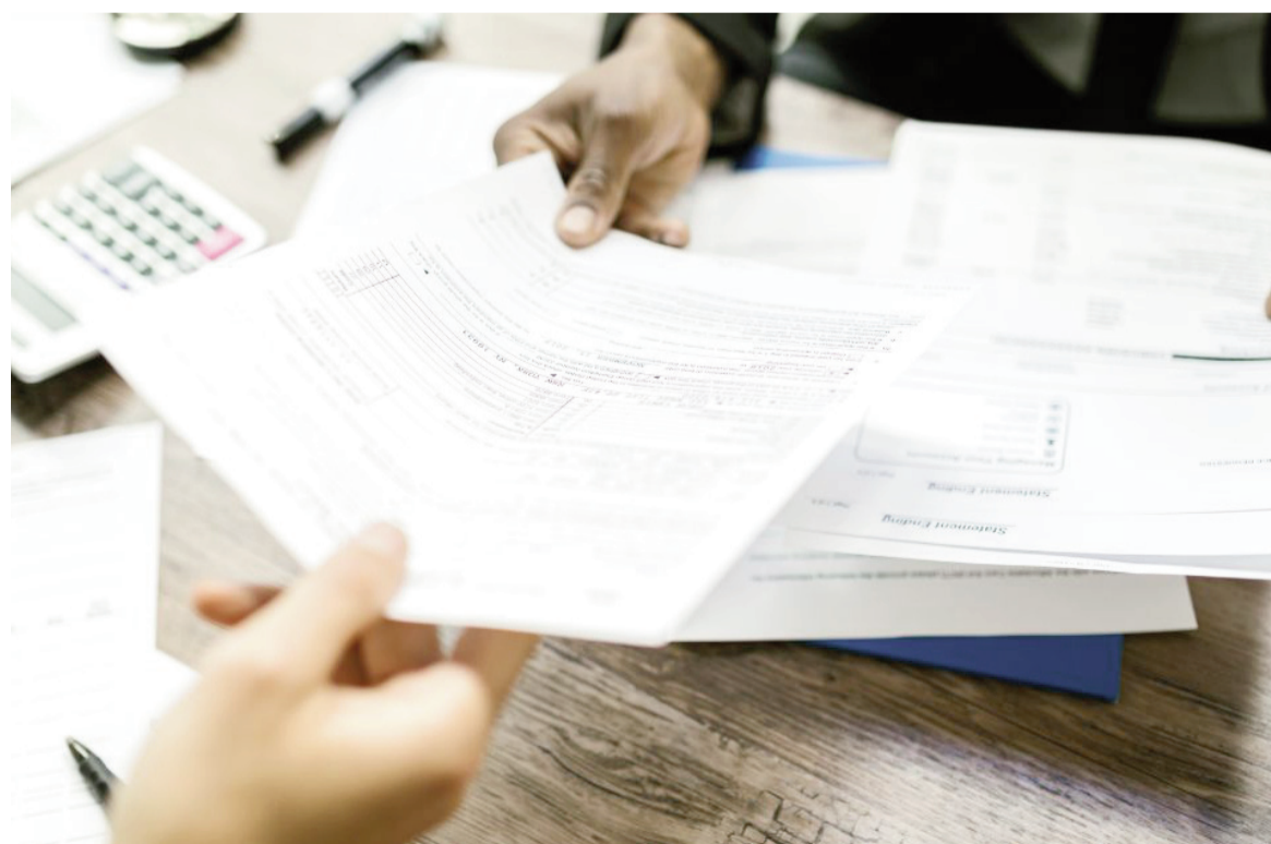
Chau a las Facturas M e IVA Simple.

La ventaja es clara: menos burocracia, constancias inmediatas y menor margen de error. Pero también exige contar con personal capacitado en el uso del aplicativo y con procesos ajustados para cumplir con los horarios de validación.