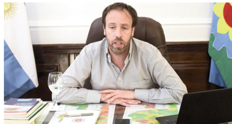
Ministro de Economía bonaerense, Pablo López.

Los sectores más golpeados encabezan caídas de dos dígitos. Textil se hundió 22 puntos porcentuales contra el año pasado, seguido por caucho y plástico (-17,1 p.p.) y minerales no metálicos (-17,7 p.p.). A estos se suman descensos significativos en industrias metálicas básicas, papel y cartón, sustancias químicas, automotriz y metalmeccánica. Todas operan muy por debajo de su capacidad potencial y sin señales