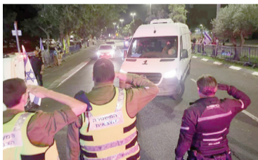
Vehículos que transportan los cuerpos de rehenes llegan a un instituto forense, en Tel Aviv, Israel.

Israel se encuentra a la espera de que Hamás entregue los cadáveres restantes de los rehenes que aún se encuentran en Gaza, señaló el miércoles la portavoz del Gobierno, Shosh Bedrosian. Hasta el momento, tras el alto al fuego que ya lleva seis días, Hamás liberó el lunes a 20 rehenes vivos y posteriormente entregó los cadáveres de otros siete de los 28 fallecidos conocidos.