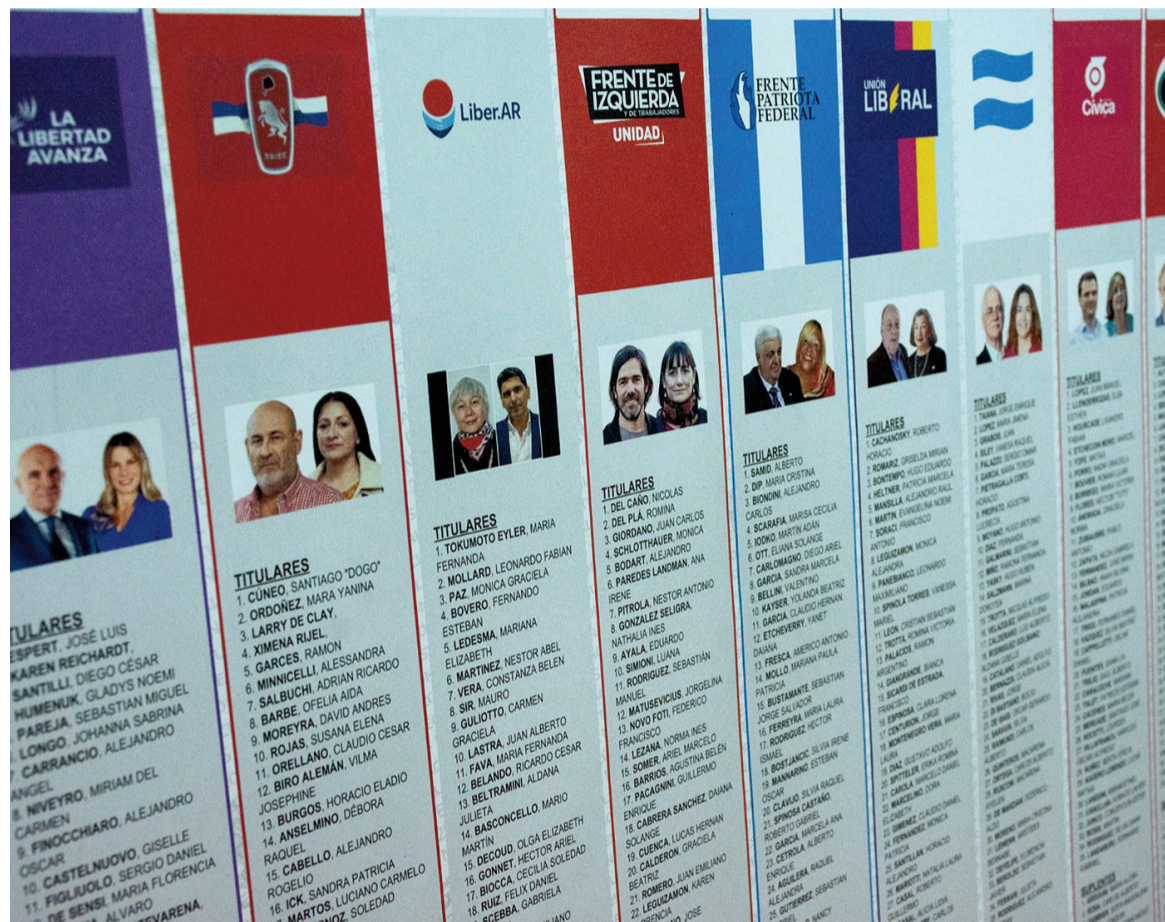
Los afiches que figurarán en los centros de votación deberán reimprimirse con la lista actualizada de los diputados de La Libertad Avanza con Diego Santilli a la cabeza.