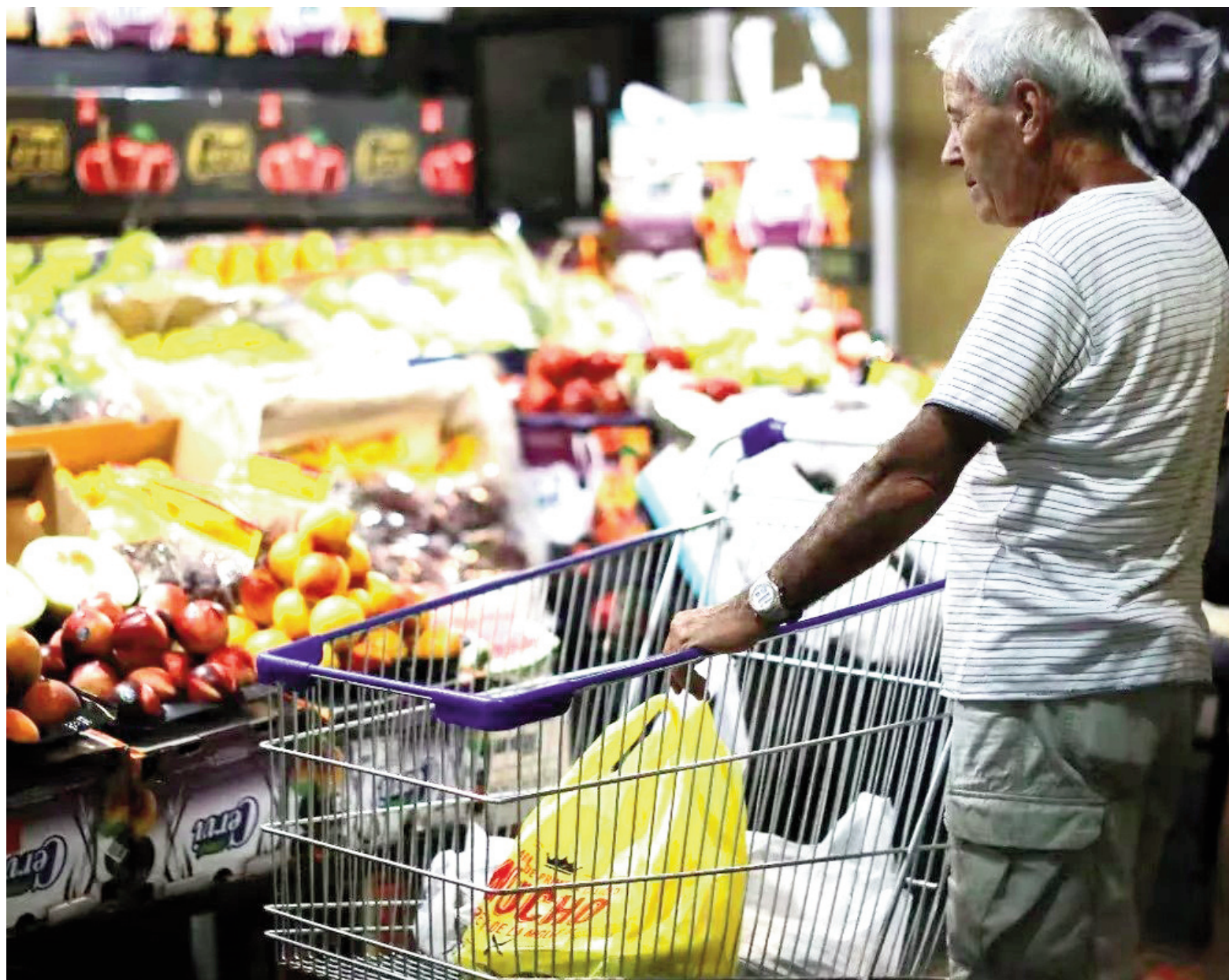
En supermercados de San Nicolás, las frutas y verduras de mayor consumo subieron en septiembre en torno al 2,9%. ILUSTRACIÓN

La canasta local que releva EL NORTE contiene arroz, azúcar, té, mate cocido, yerba, fideos secos,