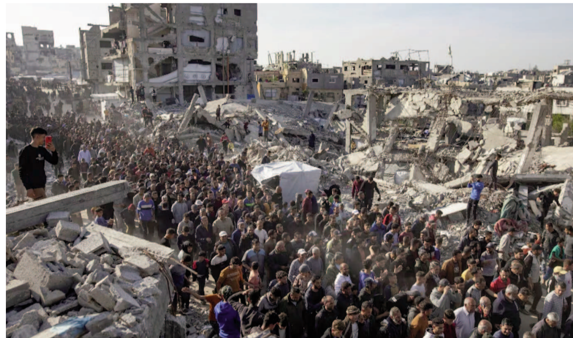
El acuerdo de cese el fuego pone fin a dos años de guerra en Gaza.

El acuerdo del cese el fuego fue alcanzado tras dos años de enfrentamientos. Los mediadores internacionales que participaron en las negociaciones en el balneario egipcio de Sharm el Sheik son Estados Unidos, Qatar, Egipto y Turquía.