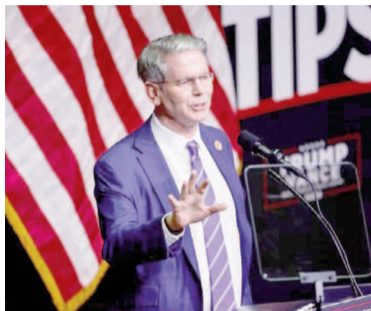
El secretario del Tesoro de Estados Unidos, Scott Bessent.

Aunque evitó referirse a la reciente inyección de dólares estadounidenses en el mercado argentino