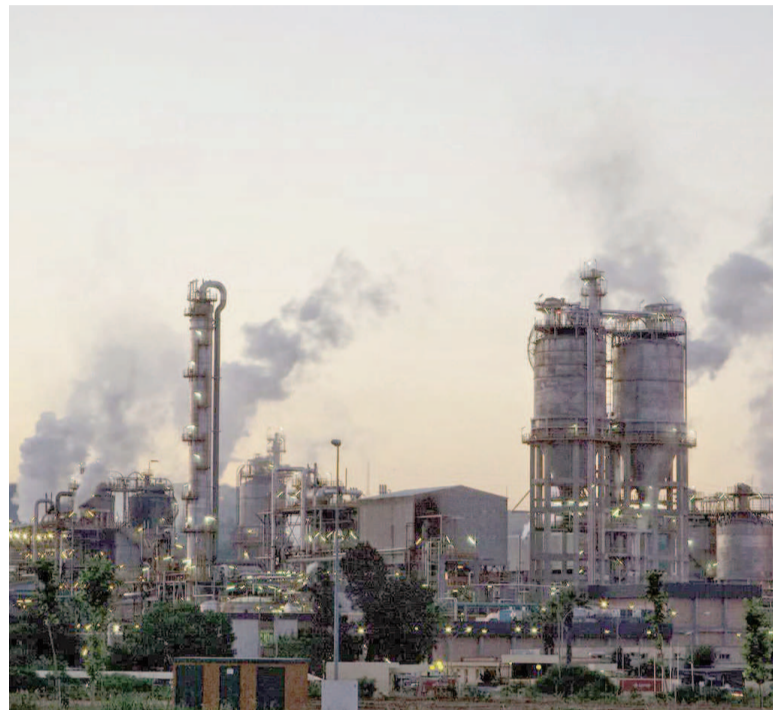
El índice de actividad industrial de agosto tuvo una leve mejora respecto a julio.

Tras dos meses de caída, el Instituto Nacional de Estadística y Censos (INDEC) precisó que el índice de actividad industrial de agosto tuvo una leve mejora respecto a julio, al crecer 0,6% en la medición desestacionalizada. No obstante, en el relevamiento interanual, el informe tuvo una caída del 4,4%.