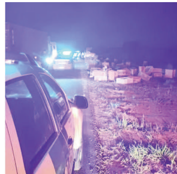
Vuelcos de camiones a la altura del kilómetro 206 de la Ruta 8.