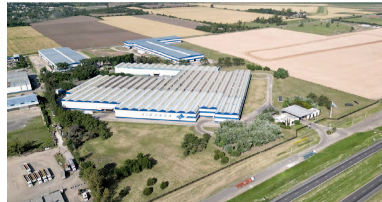
Hoy llega el presidente a Sidersa.

El proyecto Sidersa+ plantea la construcción de una planta siderúrgica de última generación en San Nicolás, que demandará una inversión de 300 millones de dólares.