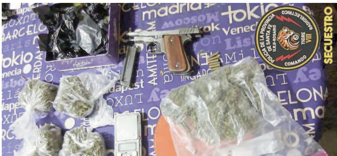
Algunos de los elementos incautados a dos de los aprehendidos.

al Hospital de Emergencias Clemente Álvarez (HECA) con heridas de arma