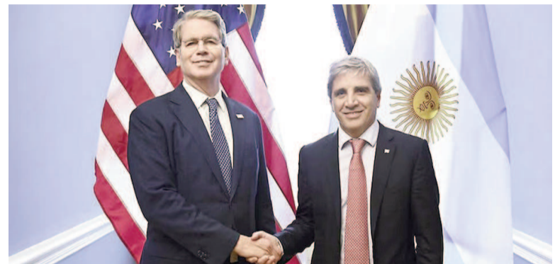
Scott Bessent y Luis Caputo durante su último encuentro en la Secretaría del Tesoro.

Asimismo, el funcionario de la administración de Trump consideró que las reformas que impulsa el gobierno de Milei permitirán “incrementar las exportaciones y fortalecer las reservas internacionales”. Y re-