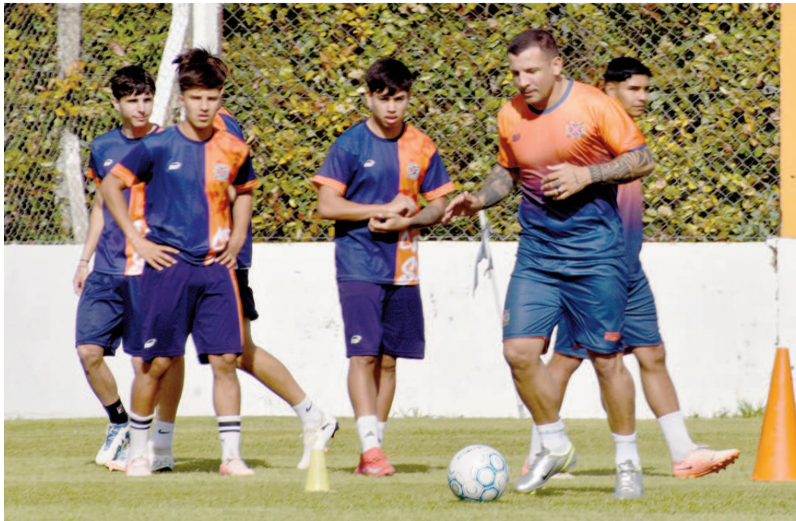
El rosarino llevó adelante su primera práctica en el equipo de Sergio Barbieri.

El futbolista rosarino se incorporó a los entrenamientos del equipo nicoleño y confirmó su participación en el torneo que comenzará el 18 de octubre.