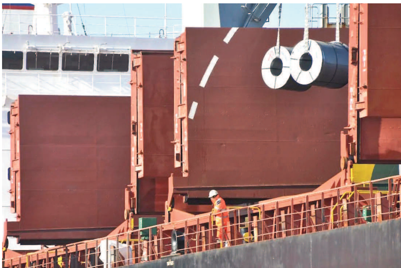
La reciente normativa oficial fijó la alícuota de derechos de exportación en 0%, aunque solo para una serie de productos exportables.

La misma fuente advirtió que la quita de retenciones a las exportaciones de productos elaborados en el país es lo que la industria necesita para fomentar exportaciones que, a