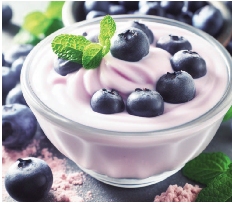
Nutricionistas recomiendan incluir esta fruta en la dieta diaria para potenciar la salud metabólica.

Dicha fibra, que proviene fundamentalmente de la piel de la fruta y tiene una proporción mayor en los silvestres debido a su menor tamaño, favorece la regularidad intestinal y promueve el desarrollo de una flora