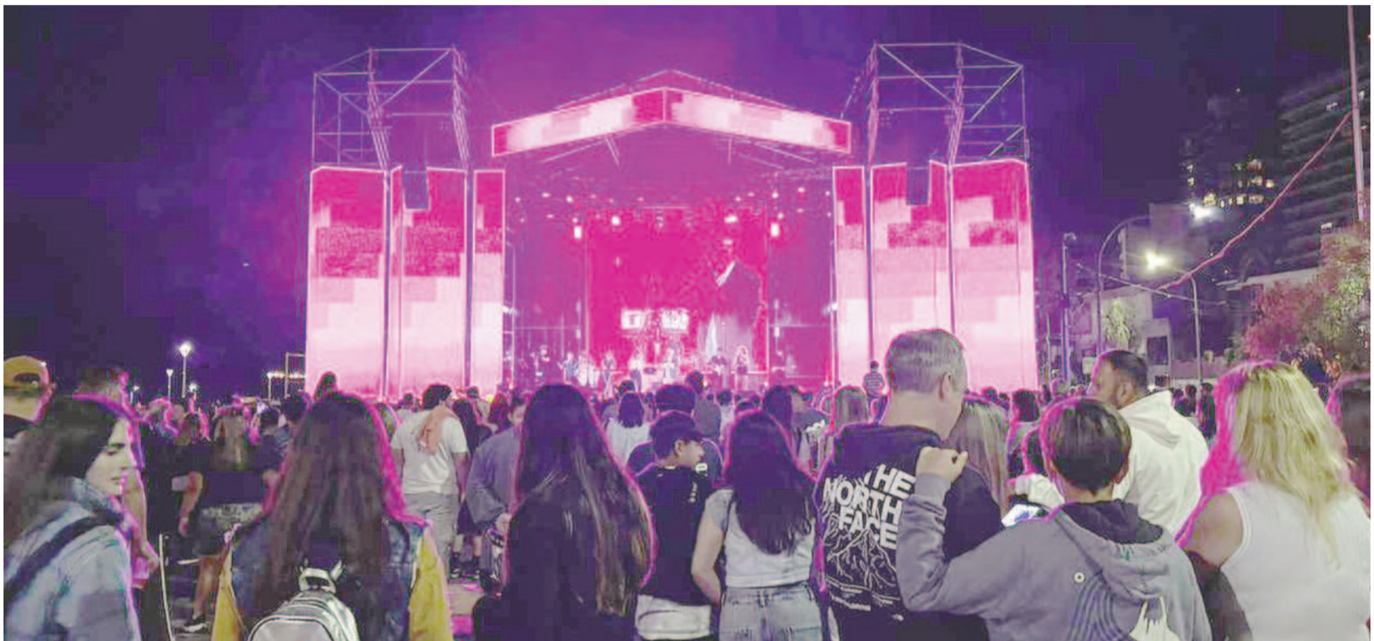
Comenzó el Festival RICO, un clásico punto de encuentro a la vera del Paraná para los vecinos y visitantes. EL NORTE

El evento, organizado por la Municipalidad de San Nicolás, contó con una amplia convocatoria de nicoleños y visitantes en su primera jornada, en medio de un clima de fiesta con shows en vivo y variada oferta gastronómica. El festival se desarrolla desde las 20:00 en la intersección de Lavalle y Juan Manuel de Rosas, con entrada libre y gratuita. En esta oportunidad, se podrá acceder a la cobertura completa del evento a través de EL NORTE Stream.