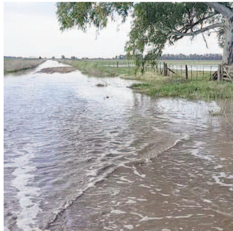
Hay regiones con fuertes anegamientos.

Las proyecciones de los modelos siguen mostrando un calentamiento