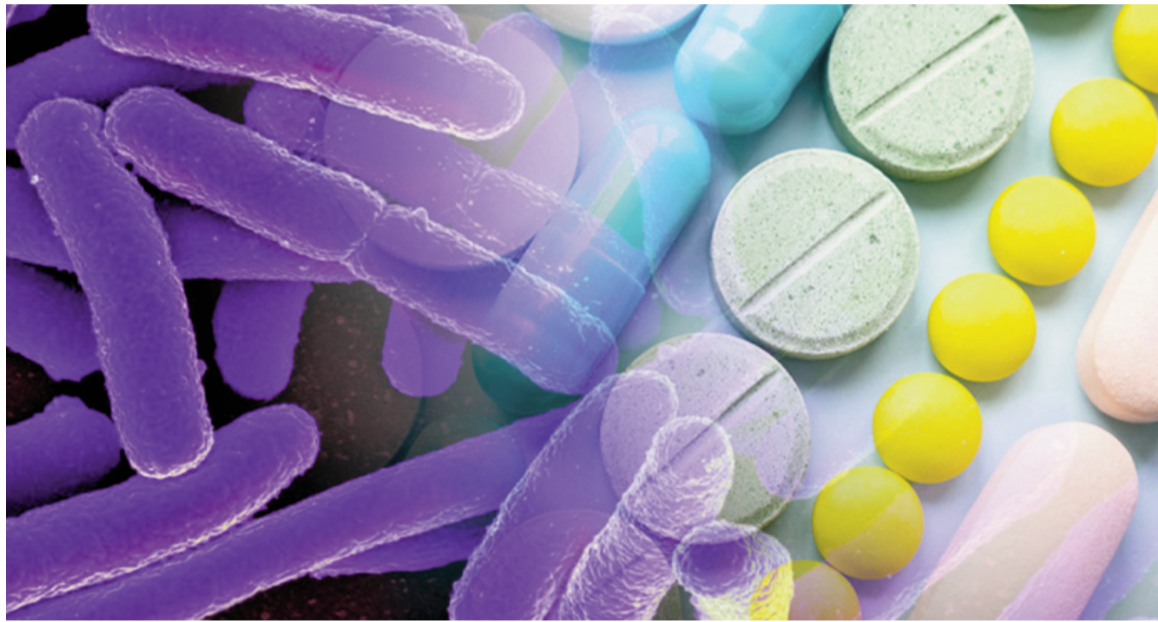
La resistencia de las bacterias comunes a los antibióticos más frecuentes es una situación de gravedad y preocupación mundial.

sistencia a los antibióticos se registra en la Región de Asia Sudoriental y la del Mediterráneo Oriental, donde una de cada tres infecciones notificadas era resistente. En la Región de África, una de cada cinco infecciones era resistente. Los datos de la Región de las Américas muestran que una de cada siete infecciones es resistente a los antibióticos, una cifra ligeramente mejor que el promedio mundial. La resistencia también es más común y está empeorando en los lugares donde los sistemas de salud carecen de capacidad para diagnosticar o tratar patógenos bacterianos.