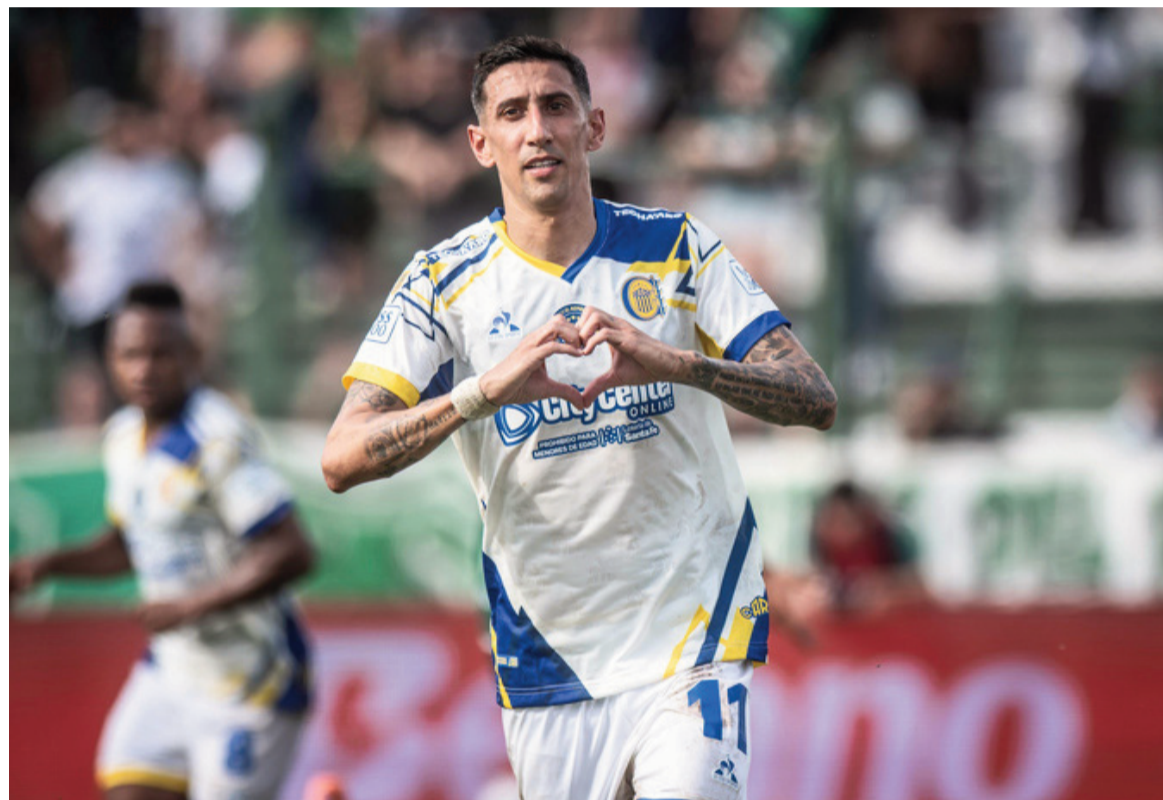
Ángel Di María le dio el agónico triunfo al Canalla.

El partido por la sexta fecha se reanudó ayer en Junín y, con gol de Di María de penal, el equipo rosarino alcanzó la punta de su zona y el boleto para el certamen continental.