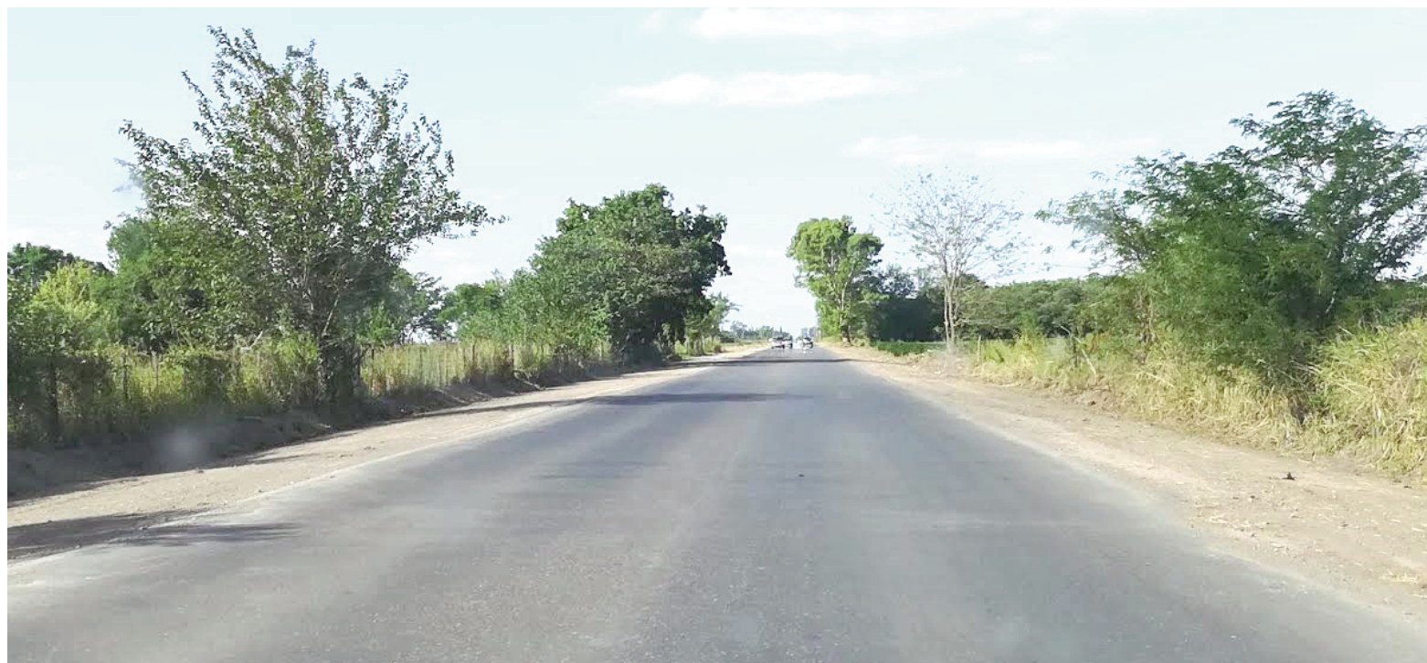
Establecida formalmente como Acceso Norte desde 2004, Dámaso Valdés es un ingreso muy frecuente a partir de su pavimentación en 2015.

La avenida quedó consolidada oficialmente como acceso a la ciudad en 2004 a través de la Ordenanza Municipal 6341, impulsada por la gestión del entonces intendente Marcelo Carignani. Y es una opción de ingreso muy frecuente en la zona norte de la ciudad a partir de su posterior pavimentación en el año 2015,