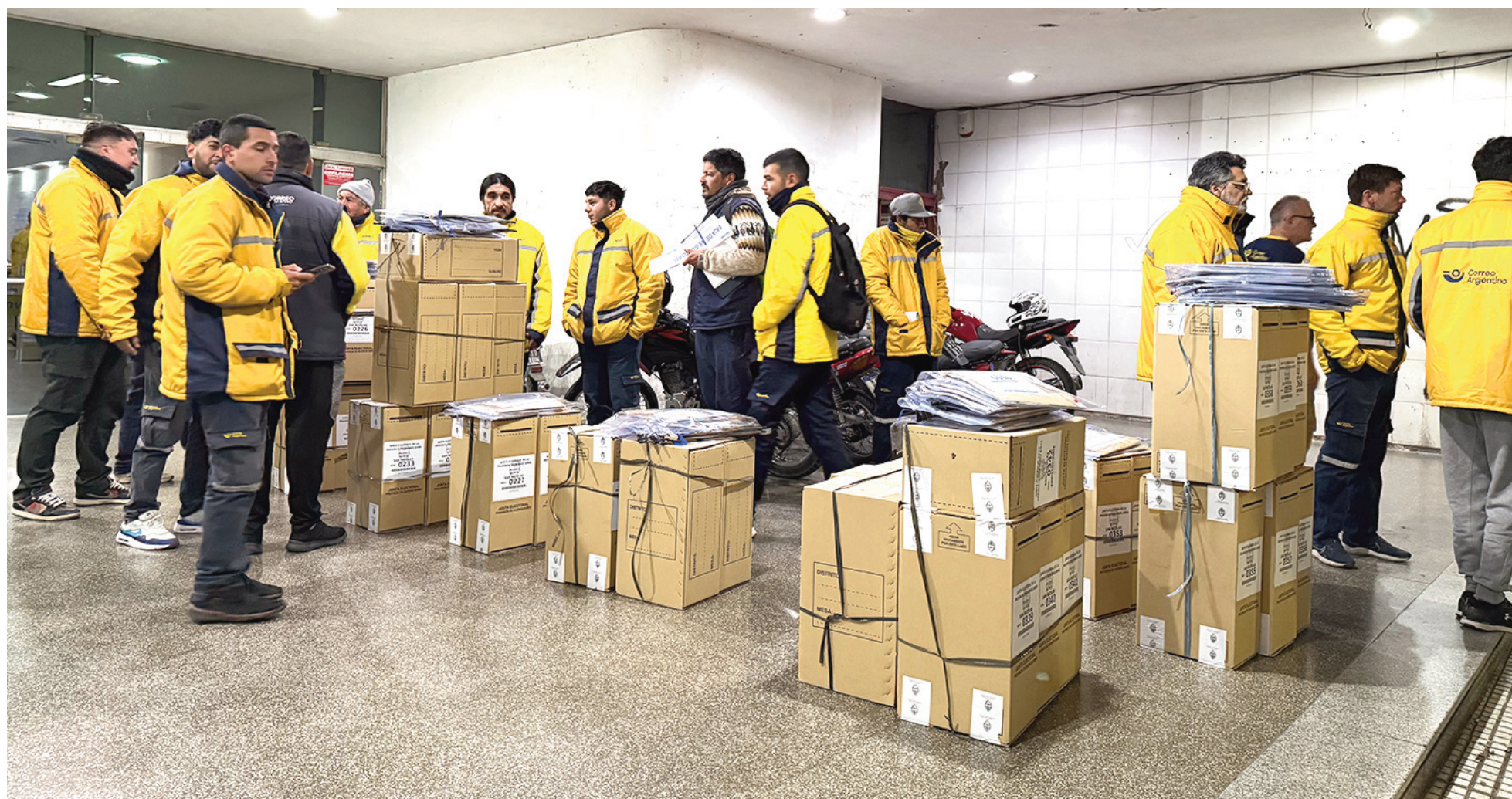
Un equipo de empleados del Correo Argentino y colaboradores contratados estarán abocados al operativo electoral. EL NORTE