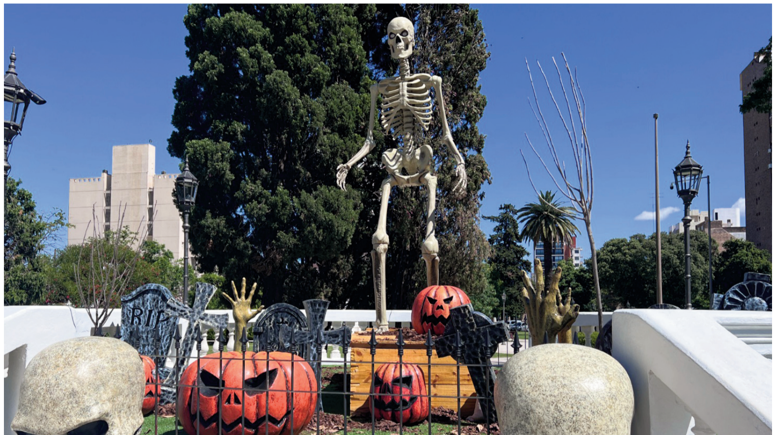
La decoración de Halloween llegó a varios puntos de la ciudad, entre ellos, la plaza Mitre.

La propuesta de este año tendrá como eje un "circo encantado", con una kermesse de juegos, maquillaje temático, puntos fotográficos y un sector gastronómico con diversas opciones. Una de las atracciones principales será el Globo de la Muerte, acompañado por artistas y ambientaciones especialmente diseñadas para la ocasión. Además, se habilitará un espacio para tomarse fotografías con disfraces y participar