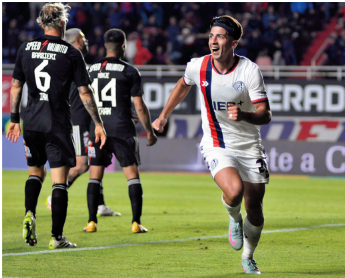
El Azulgrana obtuvo una victoria clave como local y ya piensa en los octavos de final.