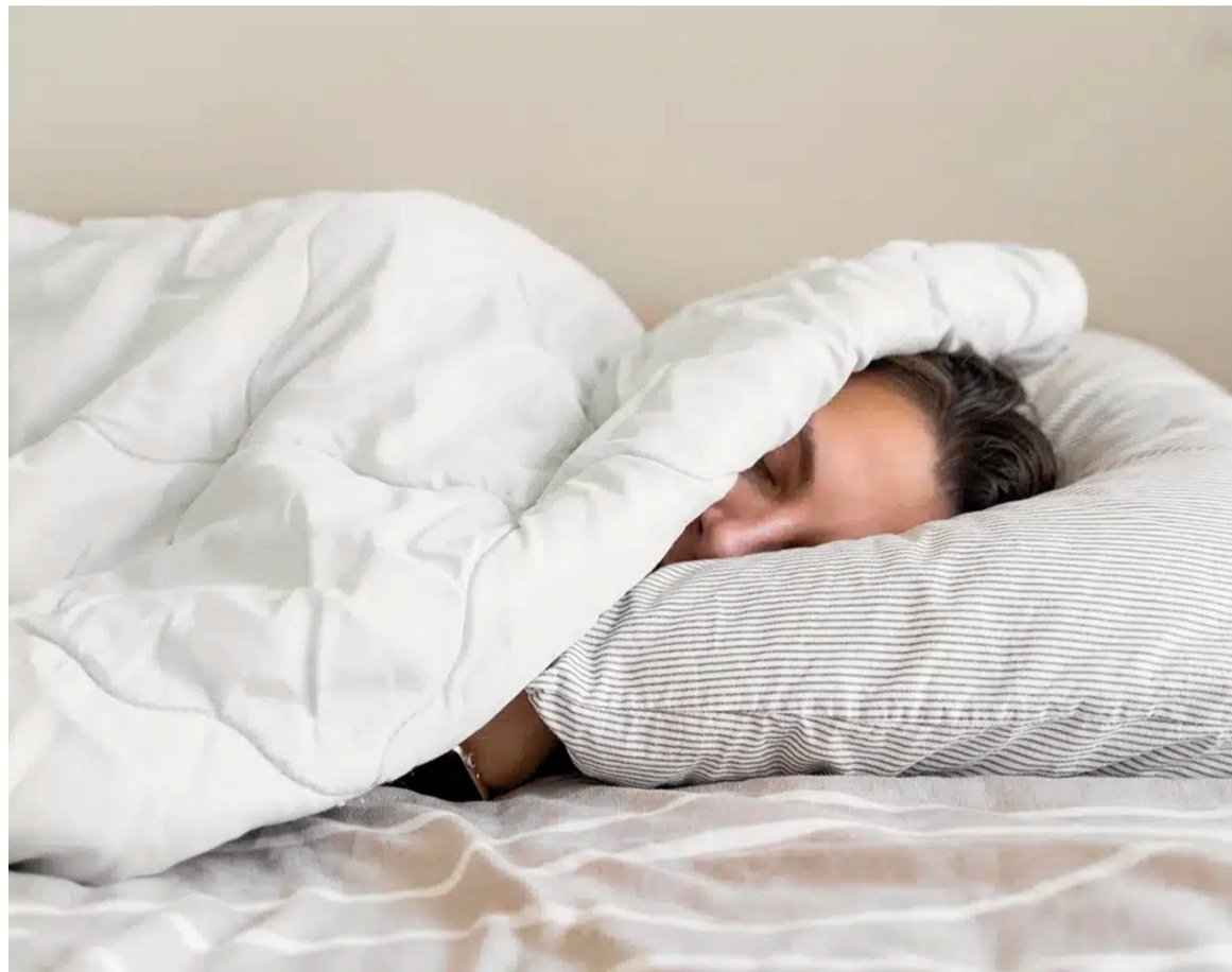
El magnesio se posiciona como tendencia entre quienes buscan mejorar la calidad del sueño y combatir el insomnio.