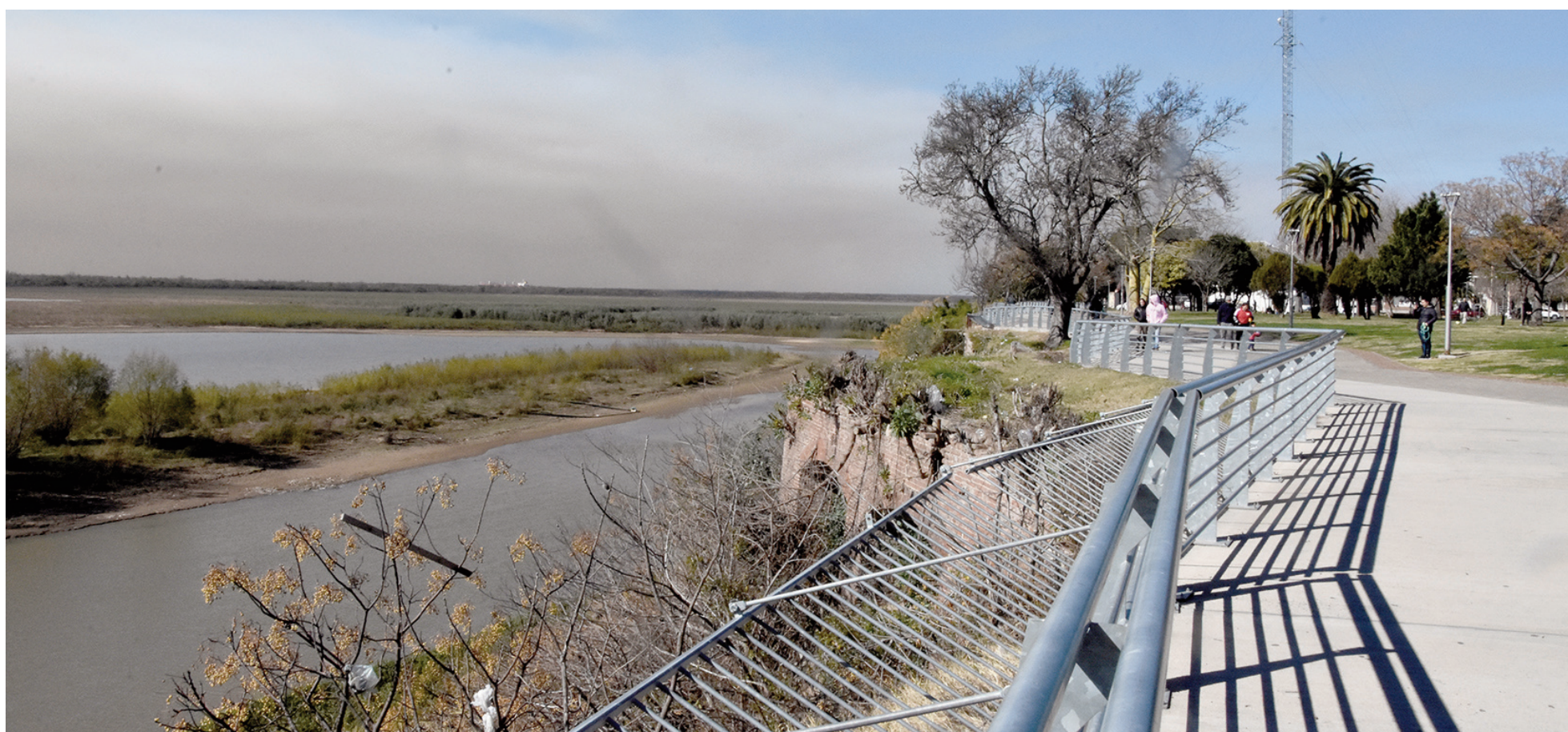
Uno de los siniestros fatales que se originaron a causa del humo que invadió la RN 9 se produjo entre San Nicolás y Villa Constitución.

La medida había sido apelada por el fiscal federal Claudio Kishimoto, acompañada por la Municipalidad de Rosario y una asociación civil, querellante en la causa penal. Se incorporó como argumento el humo que se desplazó hacia diversas rutas y autopistas, que en julio del 2022 ocasionó un hecho trágico en la autopista Rosario-Buenos Aires, a la altura de San Nicolás.