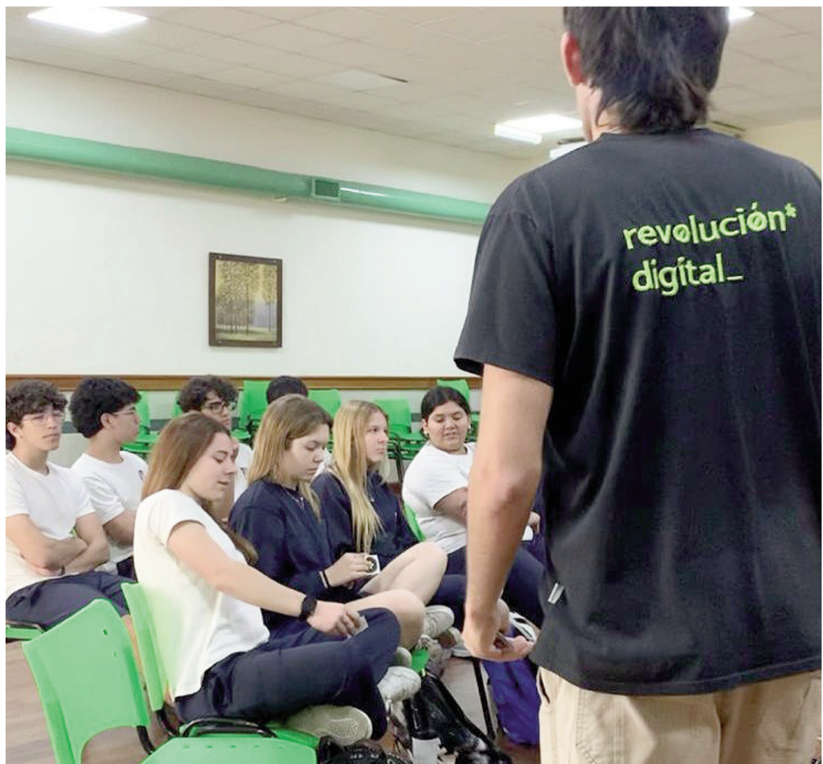
Esta semana se iniciaron los talleres de “Seguridad en línea” para los últimos años de escuelas secundarias.

Las escuelas interesadas en sumarse a la experiencia pueden solicitar la visita del taller completando el formulario de inscripción disponible en https://forms.gle/q9txFTVMas-xJBWpBA .