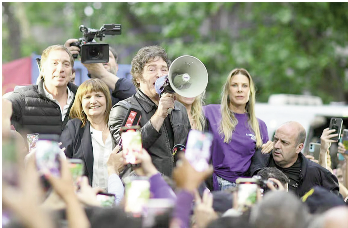
Milei hizo una caminata en Tres de Febrero.

"Estamos de nuevo frente a un momento bisagra, tenemos la posibilidad de abrazar la civilización