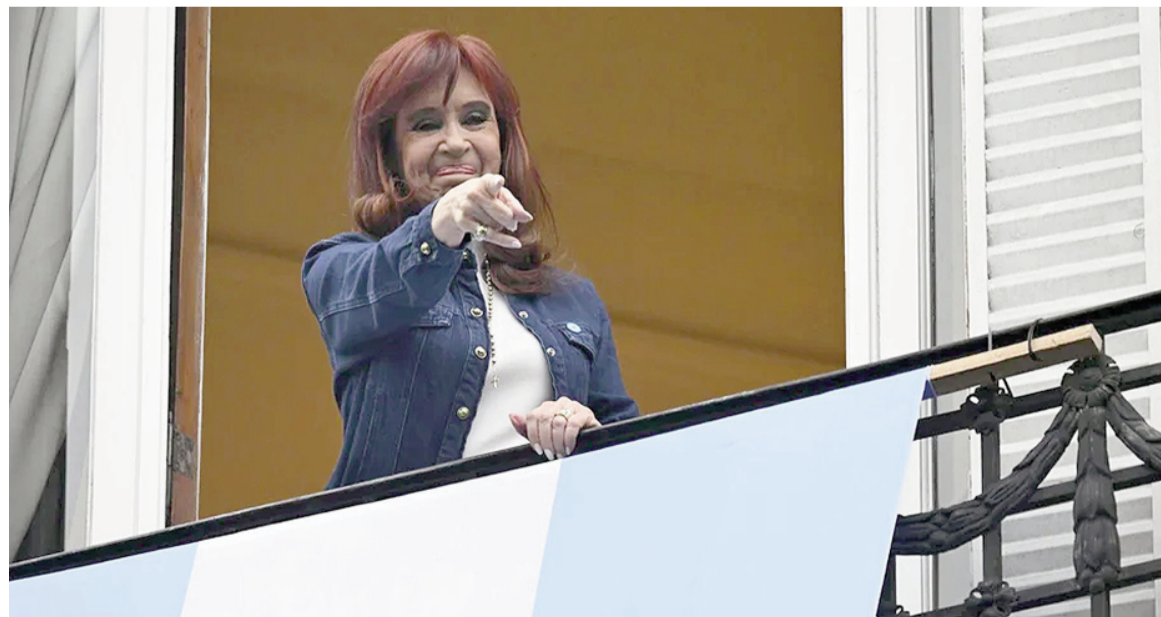
Cristina Kirchner se asomó, una vez más, a su balcón.