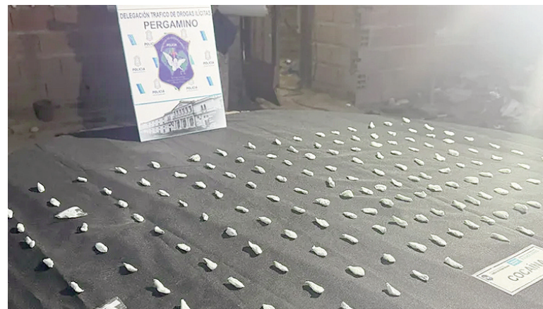
Las dosis de cocaína secuestrada en uno de los allanamientos.