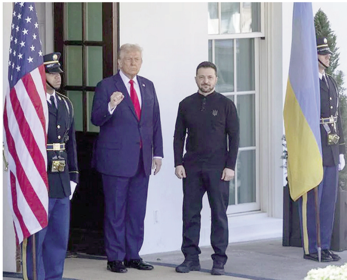
Donald Trump y Volodimir Zelenski.

Trump propuso a Zelenski terminar la guerra "donde están", permitiendo a ambos bandos "reclamar la victoria" y hacer un acuerdo para detener la matanza.