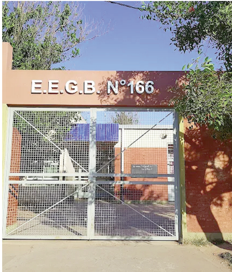
Una de las escuelas que lleva su nombre.

Y pasan dos años, dos años de lucha, de logros, de emociones. Junio de 1926. Una carta le notifica un ascenso, y con él, un traslado a una colonia agrícola a pocos kilómetros