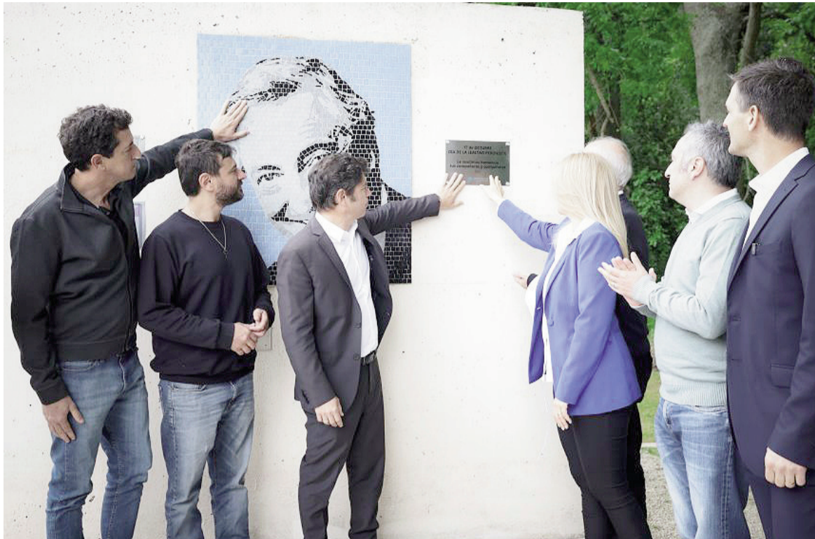
El gobernador bonaerense celebró el Día de la Lealtad.

Axel Kicillof encabezó un acto en la Quinta de San Vicente en conmemoración del 80 aniversario del día de la Lealtad Peronista. Sin Máximo Kirchner ni Sergio Massa, el Gobernador dio otra muestra más de autonomía en el marco de las tensiones internas con Cristina Fernández y hasta ahora no se sabe si irá a la caravana convocada por el Partido Justicialista (PJ) nacional.