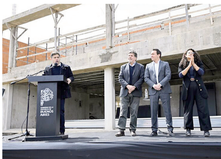
Kicillof visitó Florencio Varela.

Axel Kicillof insistió en diferenciar entre la "deserción" del gobierno nacional en obras educativas y la postura antagónica de su ges-