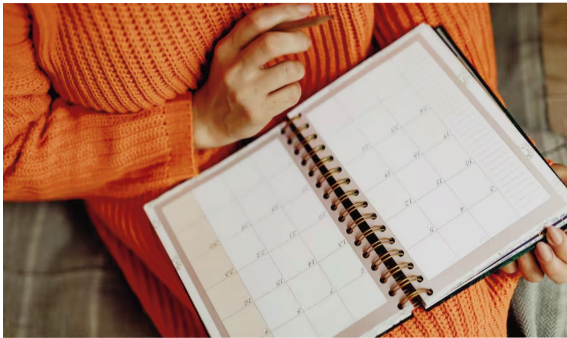
Feriatos de noviembre 2025.

El Gobierno, a su vez, tiene la potestad de designar hasta tres ocasiones, a lo largo del año, un feriado o día no laborable con fines turísticos. Este año se decidió que este quedará a discreción de cada empleador para determinar