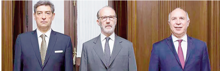
Los jueces de la Corte: Horacio Rosatti, Carlos Rosenkrantz, Ricardo Lorenzetti.