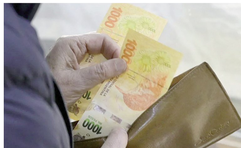
Según el Indec, los salarios le ganaron a la inflación en agosto.

Dentro del sector público, el informe detalla que el subsector público nacional experimentó un aumento mensual del 3% y el subsector público provincial un 2,9% en agosto. Las variaciones interanuales para estos subsectores fueron de 23,3% y 44,3%, respectivamente. El acumulado anual fue de 14,6% para el nacional y de 25,7% para el provincial.