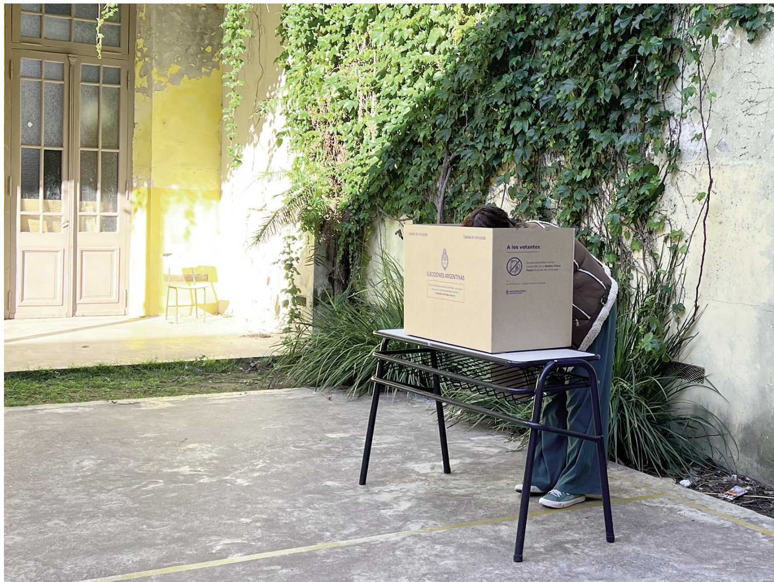
El nivel de participación electoral en San Nicolás se ubicó por encima de la media provincial y la nacional. EL NORTE

En tanto, del otro lado del ranking, los electorados más apáticos fueron los de: General Lavalle (59,76%), Pinamar (59,07%), General Madariaga (57,59%), Villa Gesell (56,76%) y Ge-