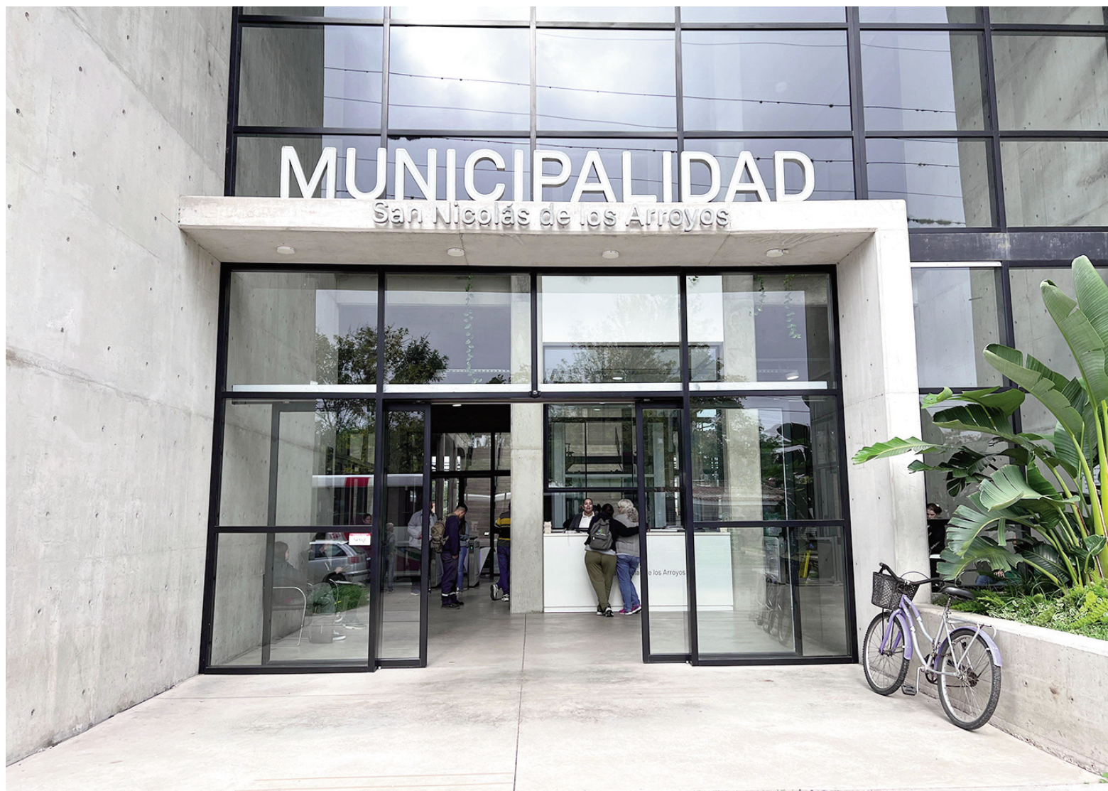
Aunque restan precisiones que deberán llegar desde provincia, el Ejecutivo Municipal ya repasa números de cara al Ejercicio 2026. ILUSTRACIÓN

Año a año, una constante en la administración municipal es la que tiene que ver con el destino de los recursos disponibles. Tal como viene sucediendo en los últimos, el 53%