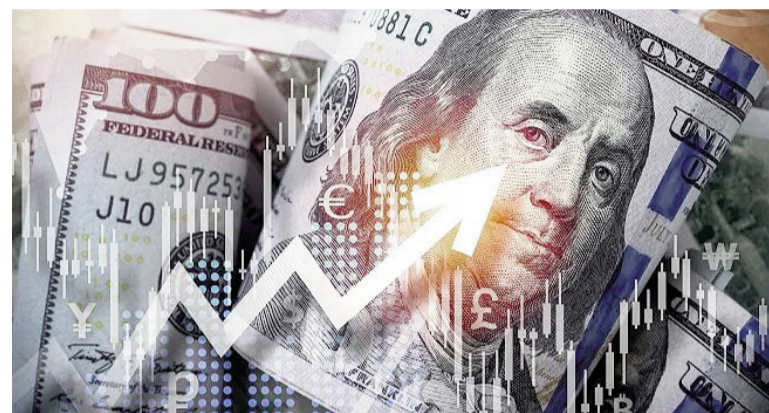
El dólar rebotó tras la calma poselectoral.

«La inminencia del fin de octubre genera como pasa en todos los fines de mes, la avidez por cobertura y cierre de posiciones, un factor que también contribuye a