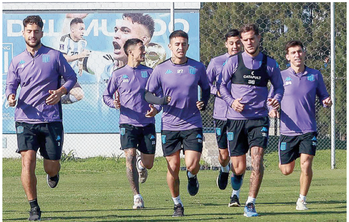
La Academia deberá mostrar su mejor versión ante el Mengao.

EL equipo de Gustavo Costas necesita prevalecer por dos goles para ser finalista tras perder por 1 a 0 en Río de Janeiro. Se jugará hoy desde las 21.30 en el Cilindro de Avellaneda.