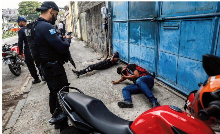
Muertos y aprehendidos en operativos en favelas.

El Comando Vermelho nació en 1979 en una cárcel de Río de Janeiro y se ha transformado en una estructura de ámbito nacional, considerada como una de las dos organizaciones crimi-