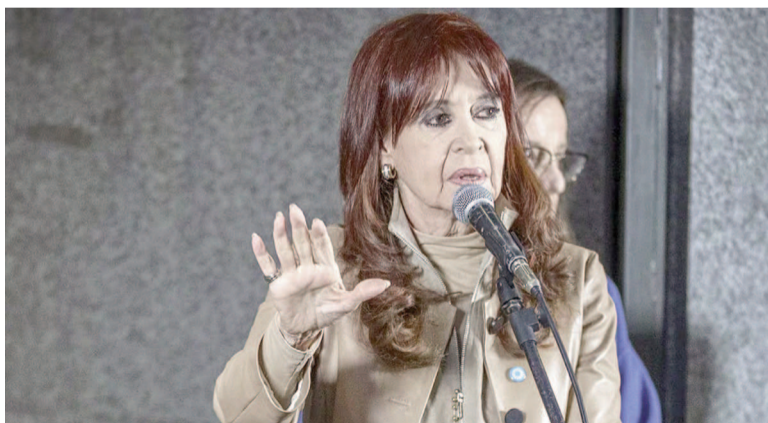
El mensaje de CFK luego de las palabras de Trump: «Ya saben qué hacer».

Luego de la reunión entre el presidente Javier Milei y su par estadounidense, Donald Trump, en la Casa Blanca, quien se expresó al respecto fue Cristina Kirchner. La titular del PJ hizo referencia a la frase del jefe de Estado de EE.UU., quien aseguró: «Si (Milei) pierde las elecciones, no seremos generosos con la Argentina».