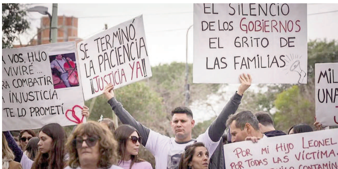
La concentración, que dará inicio a las 18:00 horas, busca unir a los afectados por la contaminación de fentanilo y generar un espacio de apoyo y recuerdo.