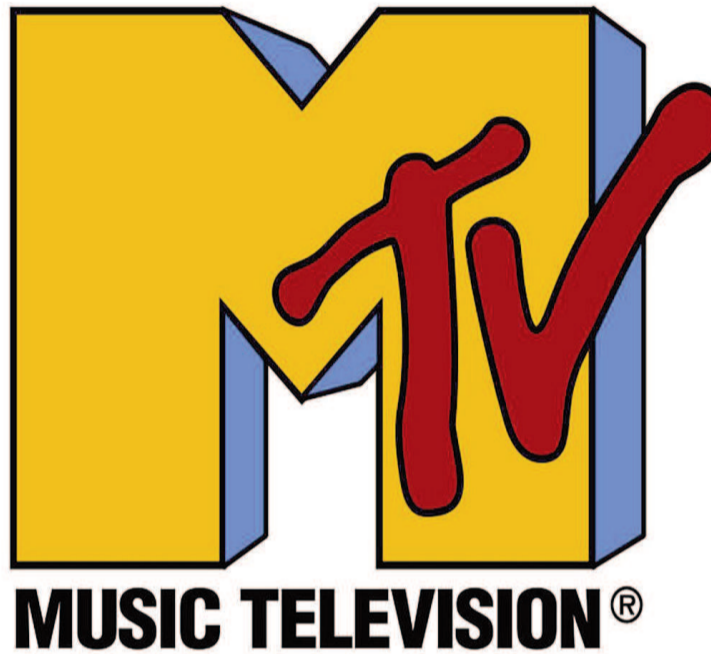
La señal MTV deja de existir a partir del 1° de enero del próximo año.

El tema, más allá de lo económico, es que se acaba un movimiento cultural. Durante poco más de cuatro décadas, la marca MTV no sólo era reconocida en el mundo entero, sino que fue