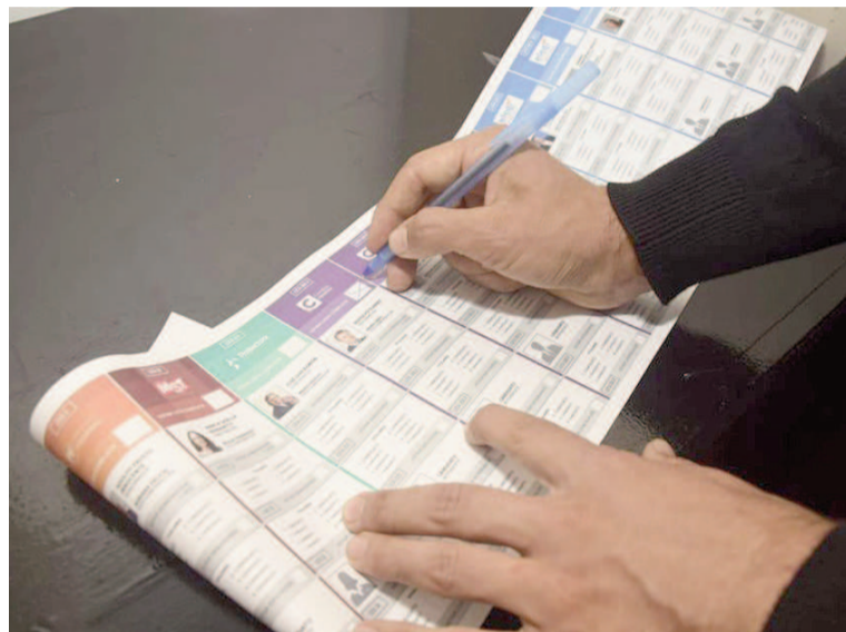
Espert, candidato a nada pero aparecerá en todos lados.

Las fuerzas opositoras coincidieron en su rechazo al planteo libertario. Desde Fuerza Patria argumentaron