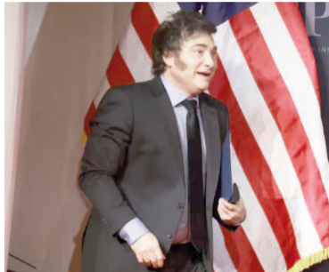
Milei durante una de sus visitas a Estados Unidos.

«La situación es clarísima: si el país se alejara de la senda de las