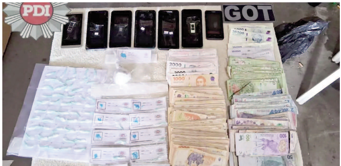
Un allanamiento con óptimos resultados.