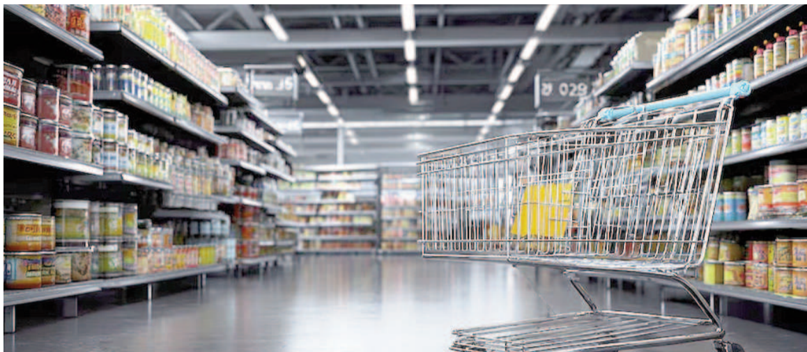
La inflación tuvo una leve aceleración en septiembre.

Un escalón por debajo que Salud con 2,3%; luego Comunicación con 2,2% y Bienes y servicios varios con 2,1%. El resto de los rubros quedaron