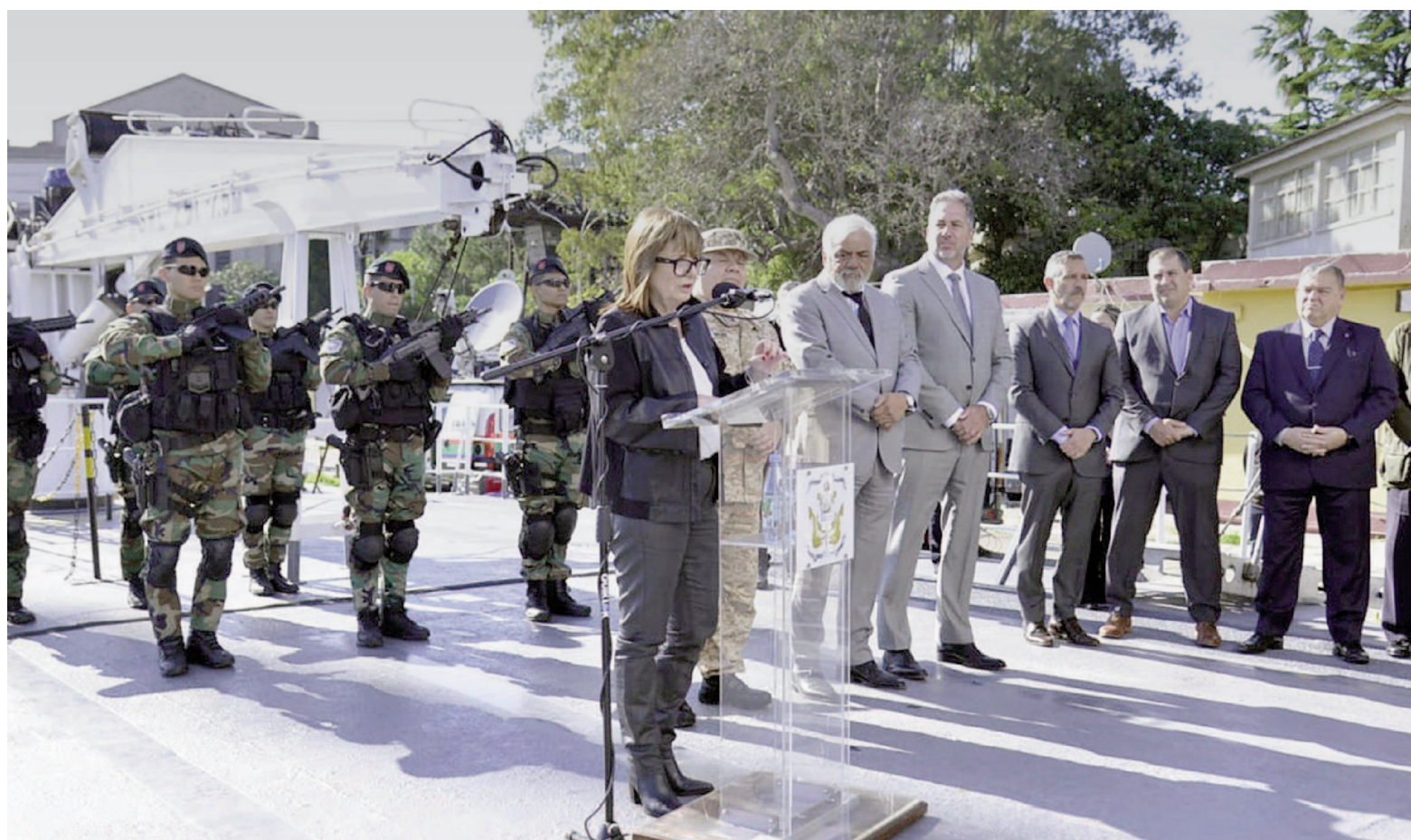
La ministra aseguró que el plan permitirá blindar el corredor fluvial más importante del país.

Agregó que cuentan con una cantidad muy importante de drones “que nos permiten analizar si hay o no hay intentos de abordaje”. “La zona de San Nicolás, donde este buque fue abordado, es bastante más tranquila, por eso es que ahora tenemos que estudiar la metodología. El delito se va corriendo y nosotros nos vamos corriendo junto al delito para poder atraparlo”, dijo.