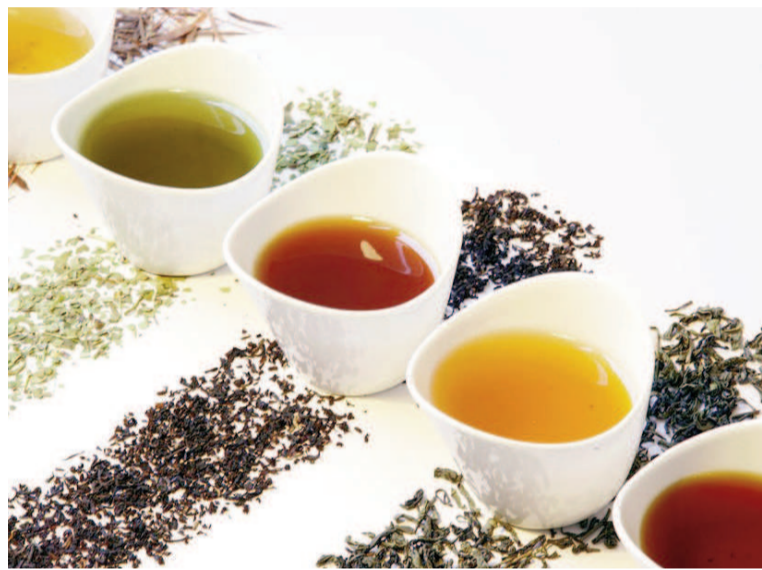
Las diferencias culturales en el consumo de té influyen en sus beneficios para la salud.

Occidente como en Asia, “contiene la mayor concentración de flavonoides entre los té tradicionales. Su color oscuro lo delata, y es el proceso de fermentación lo que le confiere este beneficio especial para la salud”.