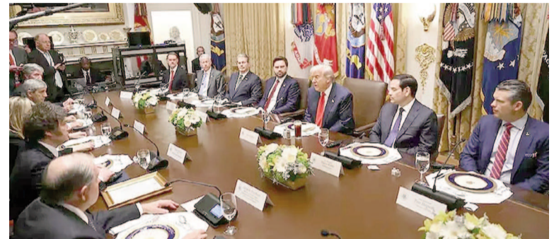
Milei y Trump, con sus equipos en la Casa Blanca.

«La victoria es muy importante, es muy importante saber quién va a ganar la elección, si será un socialista o no», dijo Trump al encabezar en la Casa Blanca el almuerzo de ambas comitivas. «Si Milei no gana las elecciones, no seremos generosos con Argentina», advirtió Trump. «Si Milei no gana las elecciones, sé que la persona que estaría presentándose para 2027 es un comunista de la extrema izquierda responsable de llevar al país a este problema en primer lugar. Si eso pasa, entonces no seremos generosos con Argentina», definió el mandatario norteamericano al compartir con Milei un almuerzo en la Casa Blanca. Milei le agradeció a su vez, a su par estadounidense, el apoyo por el «mundo libre» en medio de la «amenaza del socialismo del siglo XXI en todo el mundo».