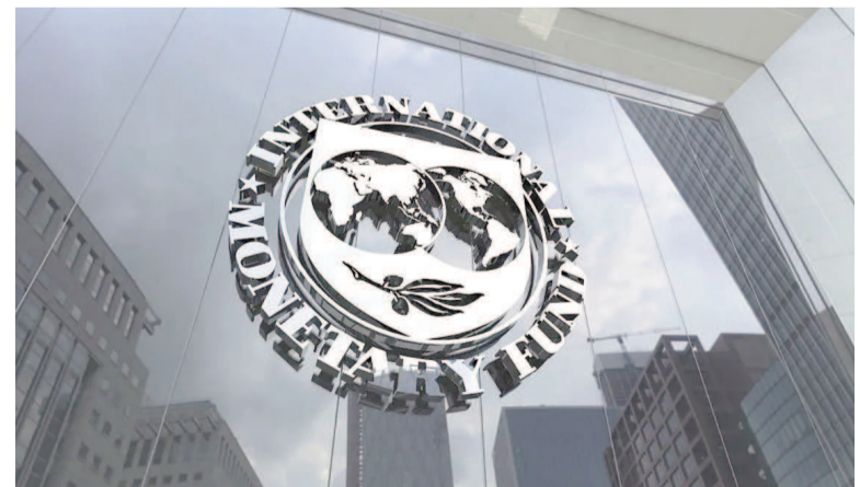
Fondo Monetario Internacional.

El organismo señaló que las proyecciones globales se mantienen ligeramente por debajo del promedio previo a la pandemia (3,7%), reflejando una adaptación gradual a las tensiones comerciales. Asimismo, advirtió que la incertidumbre en materia de política comercial sigue siendo elevada ante la falta de acuerdos duraderos entre los