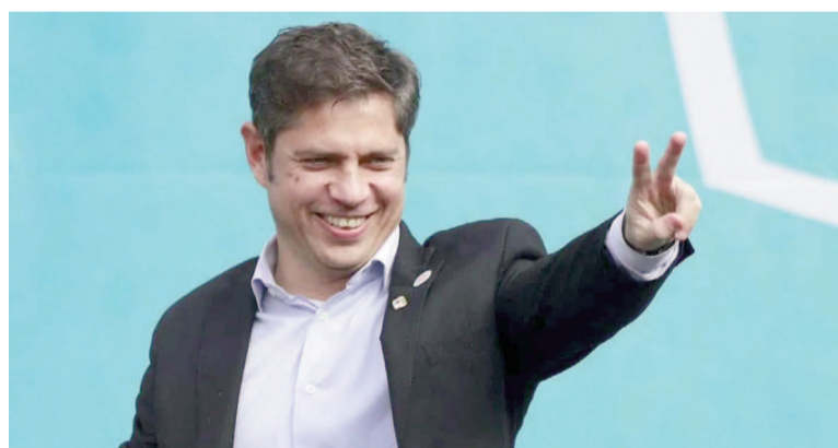
El gobernador encabezará el acto por el Día de la Lealtad.

nismo vuelve a convocar al pueblo argentino frente a una realidad que repite viejos ataques a los derechos conquistados”, señala la invitación difundida por el partido, en un mensaje que apela a la memoria histórica y la defensa de los derechos laborales.