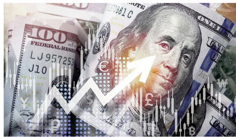
El dólar oficial se acercó al techo de la banda.

Y agregaron que «ni siquiera la intervención del Tesoro norteamer-