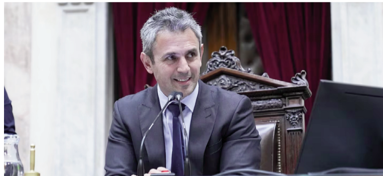
Martín Menem busca consensos por el Presupuesto 2026.

También pidieron asegurar las partidas presupuestarias destinadas a las tres leyes que sancionó el Congreso: Emergencia en Discapacidad; Financiamiento para el Hospital Garrahan y para las Universidades Na-