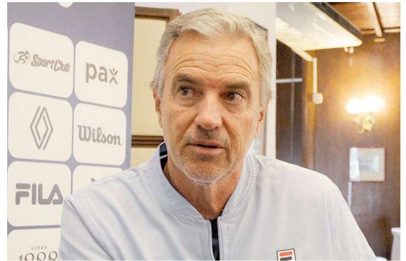
Javier Frana viene teniendo un muy buen primer año como capitán argentino.

Cuadrangular K: Villa San Martín de Resistencia, Estudiantes de Paraná, Alumni de Casilda y Obras Sanitarias; Cuadrangular L: Anzorena de Mendoza, Regatas de San Nicolás, Pacífico de Bahía Blanca y Bahiense del Norte; Cuadrangular M: Ferro Carril Oeste, Sportivo Bolívar de Villa Carlos Paz, Independiente de Neuquén y Atenas de Córdoba. El primero de cada grupo y el mejor segundo accederán al Final Four (15 y 16 del próximo mes), tras el cual se conocerá al campeón.