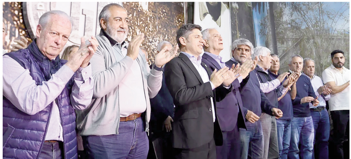
Kicillof, con la CGT en La Plata.

“El Presidente nos eligió como enemigos y ahora habla de una nueva reforma laboral: en los próximos dos años los trabajadores tenemos la obligación ser el frontón de resistencia a las políticas que quiere impulsar Milei”, sostuvo Palazzo y agregó: “No nos vamos a quedar en la discusión, sino que vamos a elaborar una propuesta que sea realmente