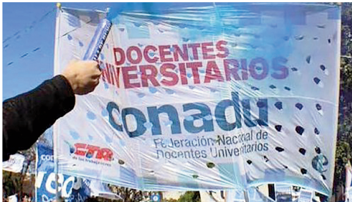
La CONADU vuelve a parar.