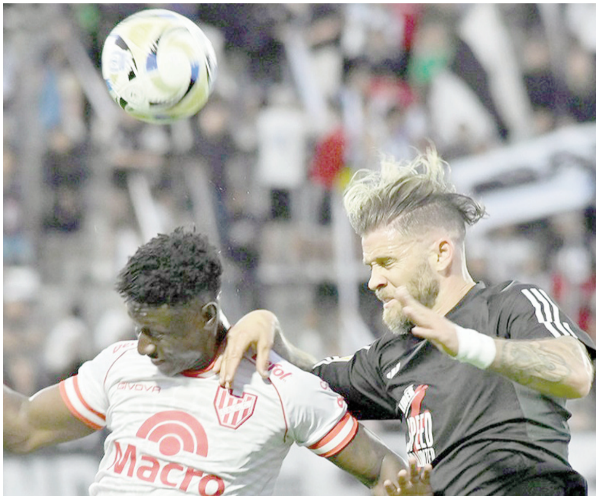
El Malevo ganó y recuperó la punta.