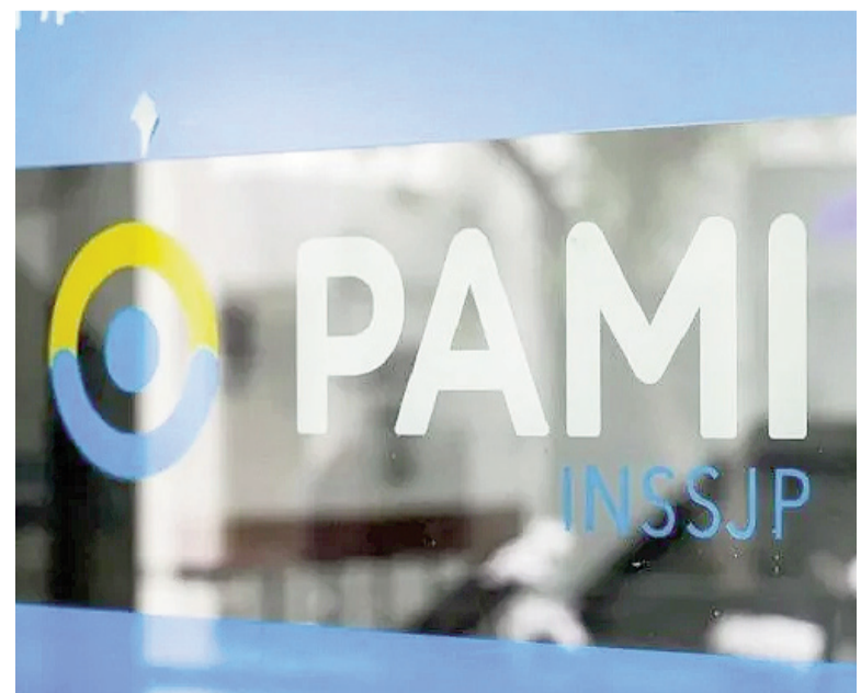
El programa beneficiará a 5,4 millones de afiliados al PAMI en todo el país.

El programa beneficiará a 5,4 millones de afiliados en todo el país. El INSSJP (PAMI), creado para garantizar atención médica y asistencia social a jubilados y sus familias, ejecutará el plan mediante su red de centros propios y convenios con prestadores públicos y privados.