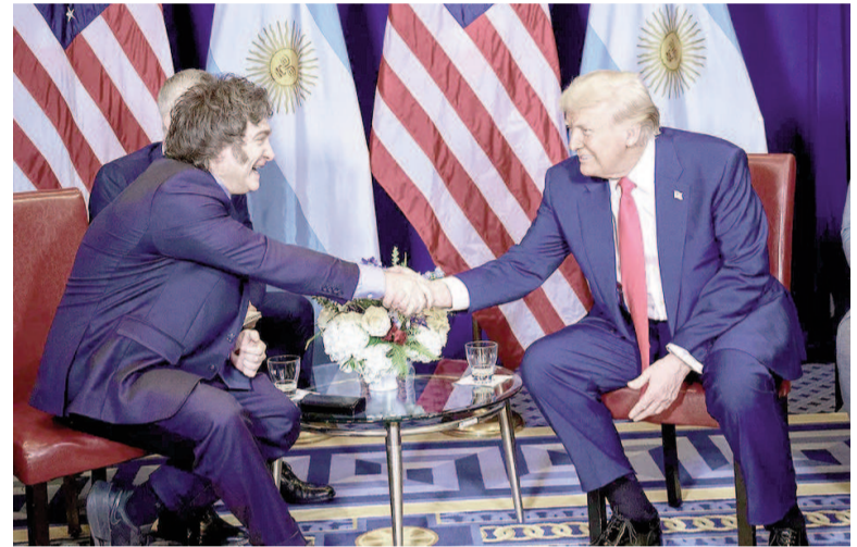
Una foto que se repetirá.

Los horarios de las actividades de Milei en Washington estaba sin confirmación, debido a que todo estaba atado a la agenda de Trump, quien debía regresar a su país desde Egipto, donde en las últimas horas encabezó la resonante firma de un acuerdo entre un grupo de países para supervisar el proceso de paz en La Franja de Gaza.