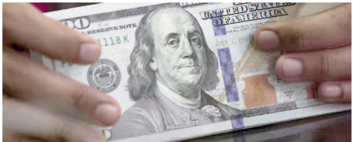
El dólar volvió a caer y quedó más lejos del techo de las bandas cambiarias.

"El dólar mayorista retrocedió con fuerza, toda vez que la estrategia de ventas del Tesoro de EEUU resultó de inmediato muy creíble entre los operadores, y así es que se derrumba junto a los dólares financieros y los futuros. Ocurre que su participación modifica de inmediato la dinámica a corto plazo, e incluso retroalimentarla a partir de la aparición de ofertas privadas más inclinadas en esta etapa a aprovechar las elevadas tasas en pesos", explicó Gustavo Ber, econo-