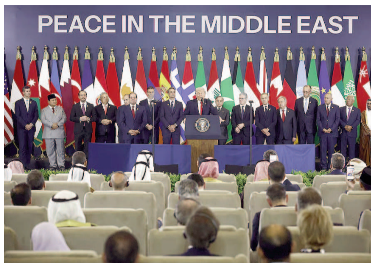
Donald Trump habla durante una cumbre de líderes mundiales.

El documento en cuestión, publicado por la Casa Blanca a través de sus redes oficiales, enfatiza el compromiso de las