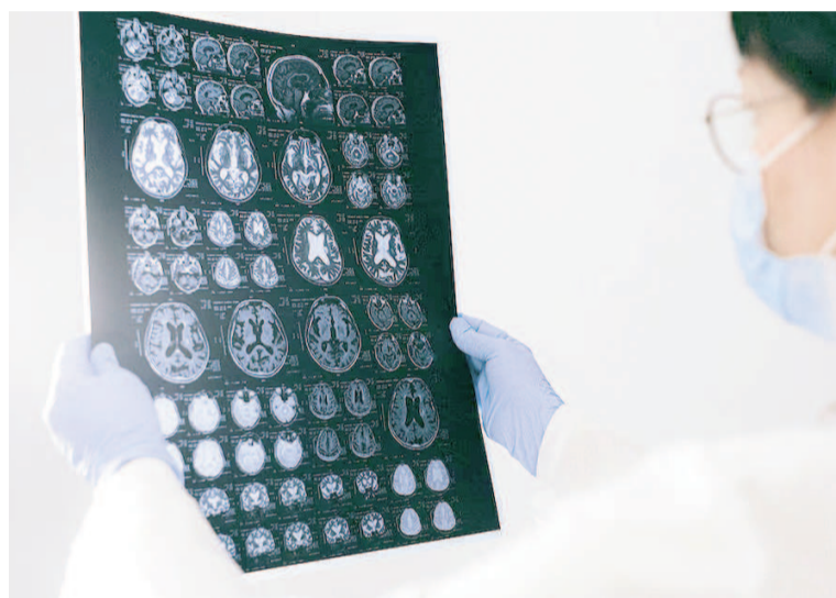
El nuevo desarrollo facilita el seguimiento de trastornos neurodegenerativos en entornos de investigación.

comprobó que, mientras las microglías sanas permanecen adheridas al interior del canal, la exposición prolongada a A \beta provoca que pierdan su capacidad para fijarse. "Después de 24 horas bajo concentración elevada de estos oligómeros, las células inmunitarias perdieron por completo su adhesión, señal de que ya no son viables", precisó el informe.