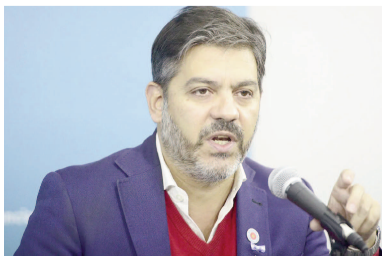
Ministro Carlos Bianco.

En otro tramo de la conferencia en la Gobernación, el ministro se