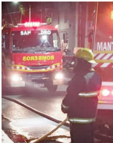
Un hombre perdió la vida tras una explosión.

ricias correspondientes para investigar y poder determinar qué fue lo que originó la explosión y cómo murió esta persona.