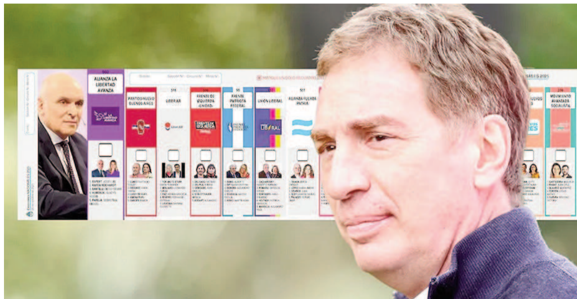
Santilli primero, pero con la cara de Espert.

Entre los considerando del fallo, sostienen que "el señor fiscal actuante