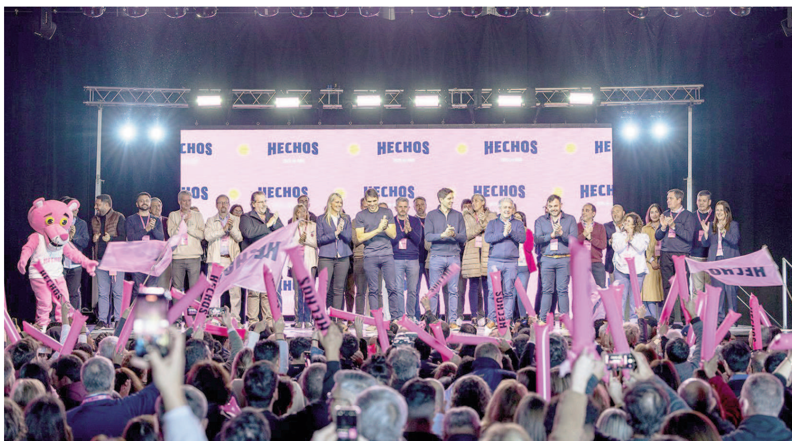
HECHOS tendrá bancas en San Nicolás, Ramallo, Baradero, Pergamino, San Antonio de Areco, Arrecifes, Rojas, Carmen de Areco, Bolívar, Roque Pérez y Tandil.

Ese mismo día, otros 22 representantes de HECHOS estarán jurando en sus flamantes cargos ante las autoridades de otros diez concejos deliberantes: tres en Ramallo, dos en Baradero, dos en San Antonio de Areco, dos en Arrecifes, cuatro en