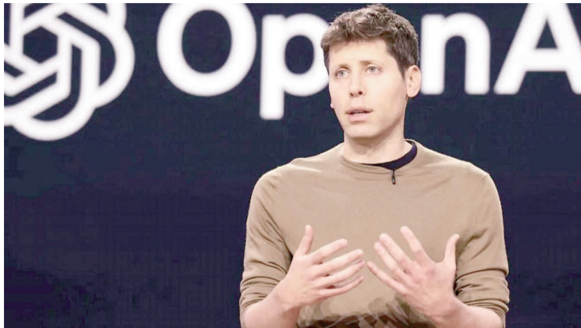
Sam Altman, dueño de OpenAI, la propietaria de ChatGPT.

«Es un mega data center que se va a poner en la Patagonia y lo más importante de eso es que la inversión que se hace, que pone en un mapa global a la Argentina y empieza a jugar en otros términos, porque empresas grandes no han invertido esa cantidad en la región, ni siquiera en otro país cercano. Entonces para Argentina es muy importante, no so-