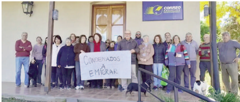
Correo Argentino, la empresa más castigada por la "motosierra" en el empleo público.

En diciembre de 2023, cuando comenzó el gobierno de Javier Milei, se "ha implementado una política deliberada de ajuste y desmantelamiento del sector público nacional, con un impacto masivo tanto en la dotación de personal como en las capacidades operativas del Estado".