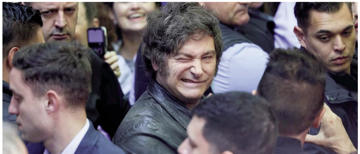
Javier Milei, el gran ganador de la jornada electoral.

Luego, el jefe de Estado agradeció uno por uno a la primera línea de su gobierno, haciendo mención con nombre y apellido a los inte-