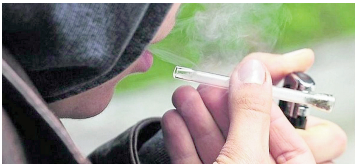
Preocupa la falta de prevención y naturalización de las adicciones.

Además, expresó su impotencia ante la falta de conciencia social. "Hay muchísima gente que trabaja en comercios, incluso hasta en hospitales, que consumen y que mi-