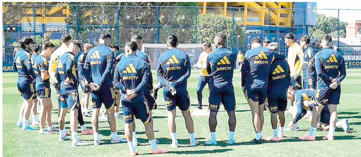
Boca necesita sumar de a tres para fortalecer sus chances clasificatorias.

Hoy desde las 16.00, el Guapo y el Xeneize se enfrentarán en el estadio Claudio «Chiqui» Tapia en un partido postergado de la duodécima fecha, debido a la muerte de Miguel Ángel Russo, ex DT del equipo auriazul.