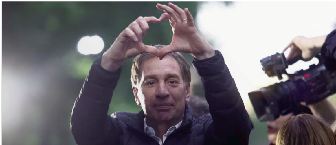
Santilli dio la sorpresa de la jornada ganando en la provincia de Buenos Aires.

"Celebramos una elección con niveles de transparencia sin precedentes", afirmó el jefe de Gabinete