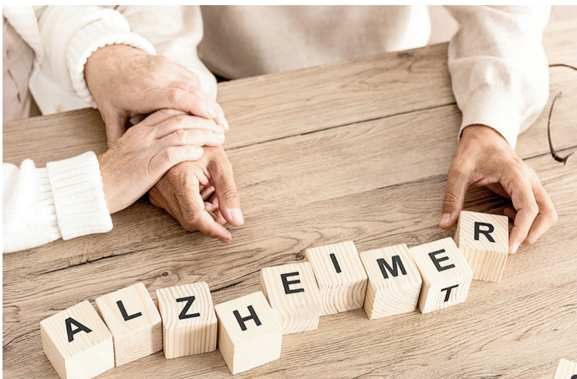
Hasta un 45% del riesgo de demencia se asocia a factores modificables, según la OMS y The Lancet.

La atención médica personalizada y la detección temprana de problemas cognitivos resultan esenciales. El Dr. Kaiser aconseja no retrasar las consultas médicas: "No tenga miedo de ir al médico", señaló. Los especialistas diseñan planes de prevención y, si es necesario, orientan sobre los tratamientos. La prioridad de la