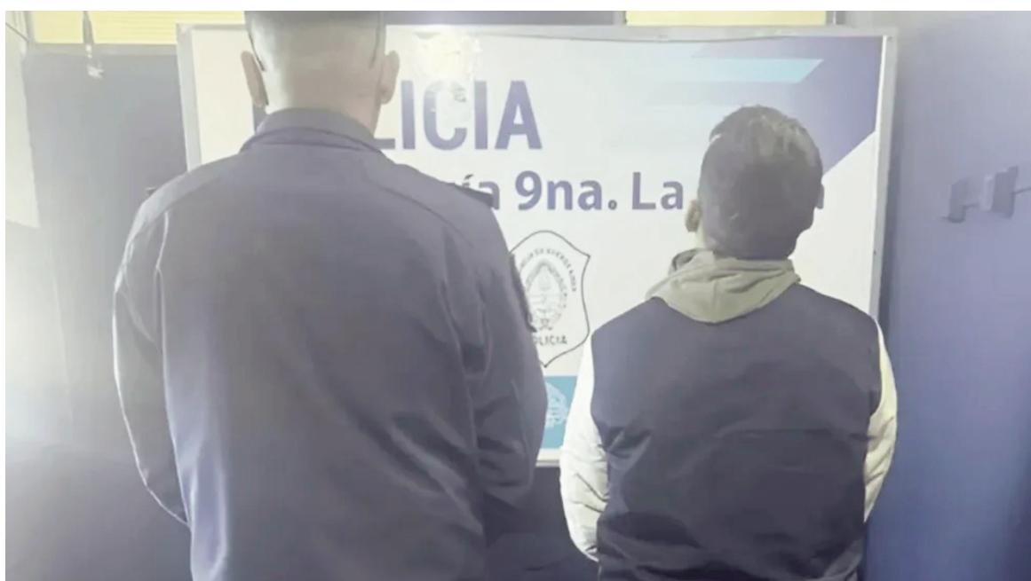
En La Plata, fue detenido un hombre acusado de violencia de género cuando fue a votar.

El primero de los arrestos ocurrió en la Escuela Primaria N° 209, en la calle Gamarra 8510, de Virrey del Pino, donde un hombre de 35 años fue aprehendido sin resistencia luego de sufragar. El segundo operativo