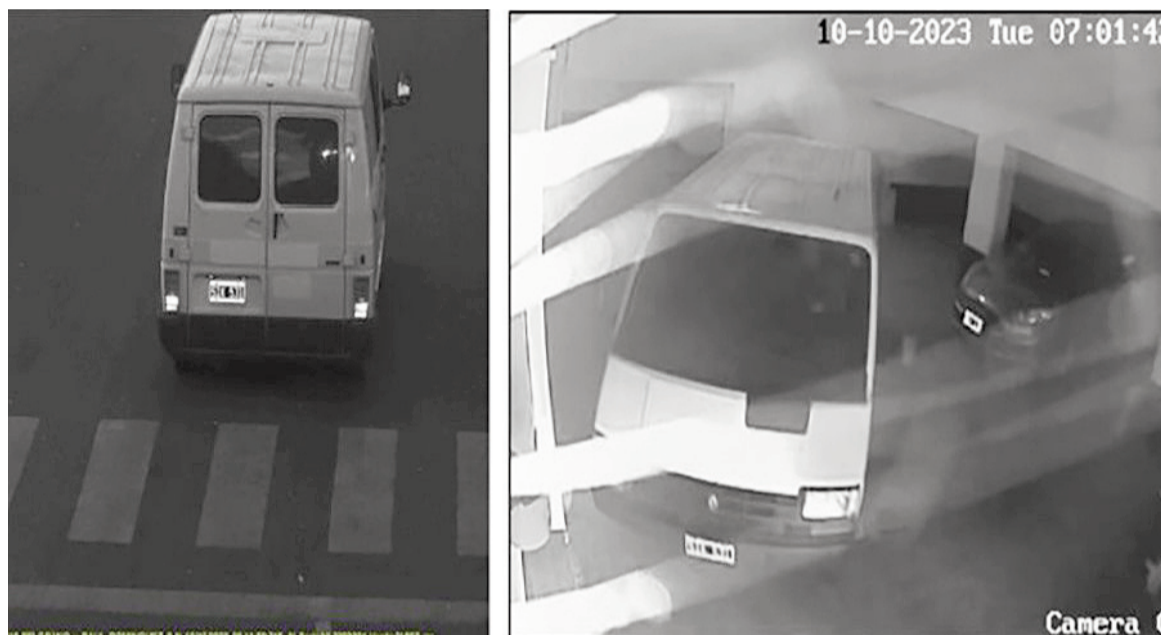
La camioneta Renault Trafic blanca empleada por la banda criminal para concretar un doble secuestro en Rosario.

En tanto, aunque sin precisiones de una ubicación puntual, el otro secuestro investigado también tuvo un domicilio nicoleño como lugar de confinamiento. Se trata del primero de los hechos por los que se condenó a la organización delictiva y ocurrió el 24 de enero de 2023 en