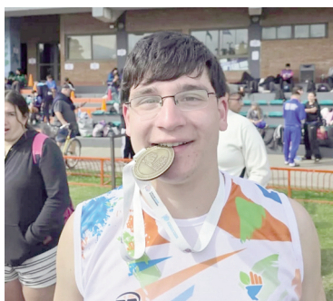
Uno de los destacados deportistas ramallenses.

En la 34.ª edición de los Juegos Bonaerenses, que se desarrolló entre el 13 y el 18 de octubre en la ciudad