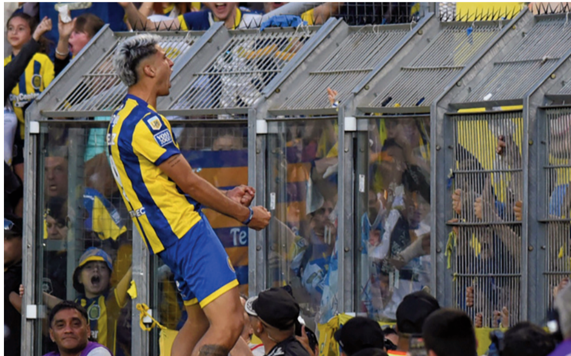
El Canalla ganó y se metió en la pelea por los primeros puestos del Grupo B.