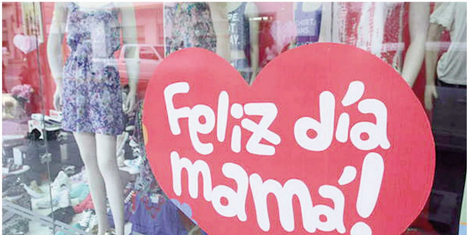
En la mayoría de los casos, las promociones absorbieron el margen de rentabilidad.

De acuerdo al informe, el ticket promedio alcanzó los $37.124, lo que representa un incremento nominal del 9,8% frente a los $33.819 registrados en 2024. Sin embargo, al ajustar por inflación, la variación real es negativa en 16,7%, lo que indica que las familias destinaron menos dinero que el año pasado para celebrar el Día de la Madre. A pesar de que el 83,5% de los comercios aplicó descuentos, promociones y cuotas sin interés, las ventas no lograron repuntar en términos reales. La amplia adopción de estrategias comerciales —como reintegros bancarios, ofertas cruzadas y financiación extendida— permitió sostener el movimiento en algunos