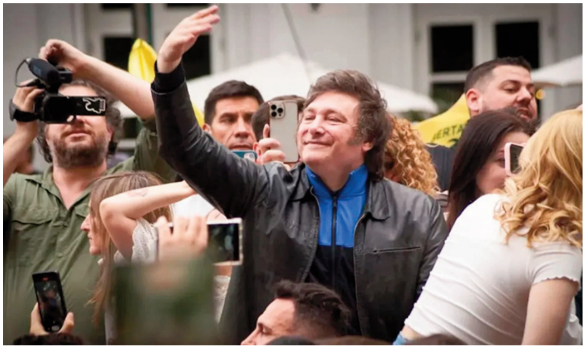
Se acerca el final de la campaña proselitista.

Durante la última semana de la campaña, se espera que el mandatario participe en el segundo cierre que tendrá lugar en el Área Metropolitana de Buenos Aires (AMBA) del país. Si bien aún la actividad se en-