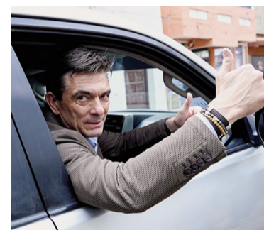
Rodrigo Paz Pereira, presidente electo de Bolivia.

Gobernará por los próximos cinco años. Asumirá el 8 de noviembre.