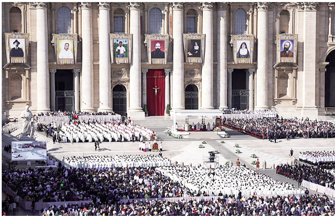
Las imágenes de los siete nuevos santos, durante la ceremonia.

La tradición impone que para ser canonizado sea necesario haber realizado dos milagros, llevar fallecido al menos cinco años y haber llevado una vida cristiana ejemplar.