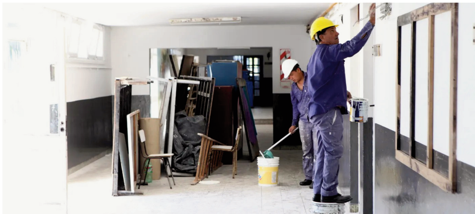
Las dificultades que atraviesa el Consejo Escolar de San Nicolás por el recorte presupuestario también las padecen en el resto de los distritos.

El Consejo Escolar San Nicolás recibió en abril pasado un total de 44.613.741 pesos en concepto de Fondo Compensador. A partir de entonces, el monto comenzó a recortarse de manera drástica en todos los distritos bonaerenses. En junio, Provincia comenzó a enviar una partida adicional para nivelar lo que ya no se recibía por Fondo Compensador. El problema es que ese recurso compensatorio no se envió en agosto ni en septiembre, explica un consejero del oficialismo local, lo que complica aún más la tarea de ejecutar los trabajos de mantenimiento de los edificios escolares.