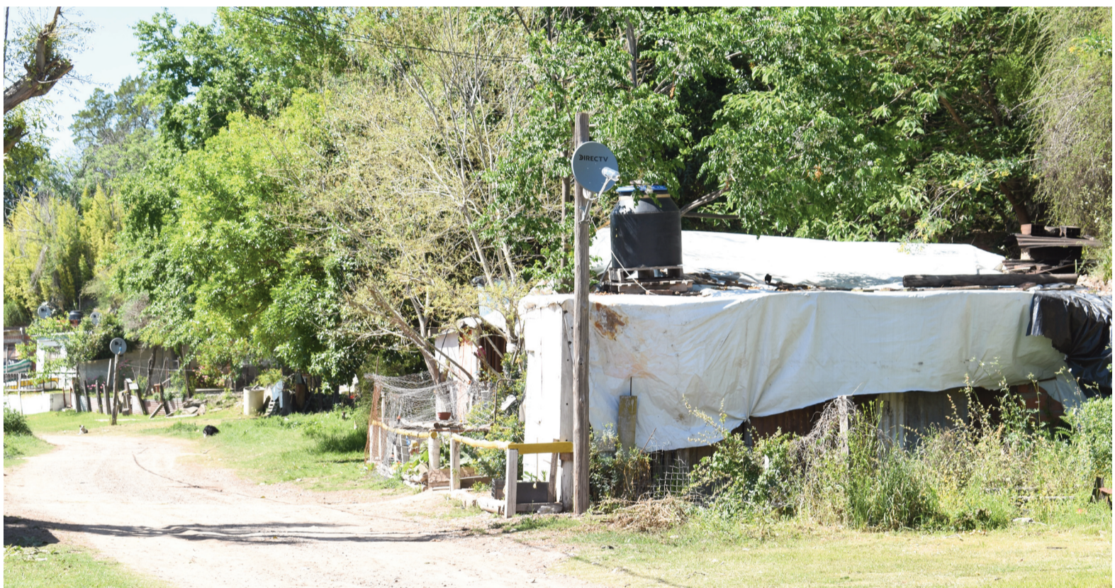
Vecinos en alerta aguardan que desde el Concejo Deliberante de Ramallo logren frenar cualquier tipo de intervención en la zona de Costa Pobre.