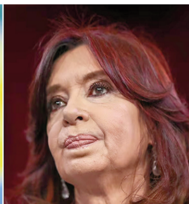
Una encuesta le daría la razón a Cristina de no haber desdoblado la elección provincial.

La administración nacional termina con 52,7% de evaluación positiva (25,5% de muy bien + 27,2% de bien) y 42,5% de negativa (10,3% mal y 32,1% muy mal). Mientras que la bonaerense cosecha + 44,3% (19,5% muy bien y 24,9% bien) vs. - 50,9% (11,3% mal y 39,5% muy mal).