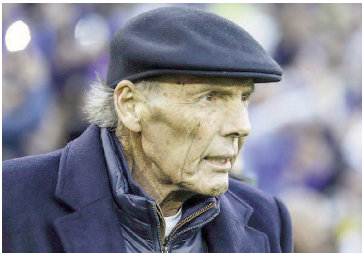
La vida de Russo se apagó a los 69 años tras una extensa trayectoria.

El histórico entrenador que estaba dirigiendo el conjunto xeneize, falleció ayer a la tarde en su domicilio. El DT había sido internado en su domicilio con pronóstico reservado luego de una recaída.