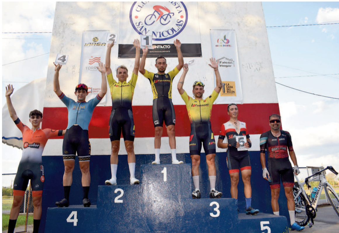
El podio de la competencia de fondo realizada el sábado.

Al espectáculo se sumaron las presencias de veteranos ciclistas de nuestra ciudad y de una amplia región, muchos de los cuales no concurrían a la institución nicoleña