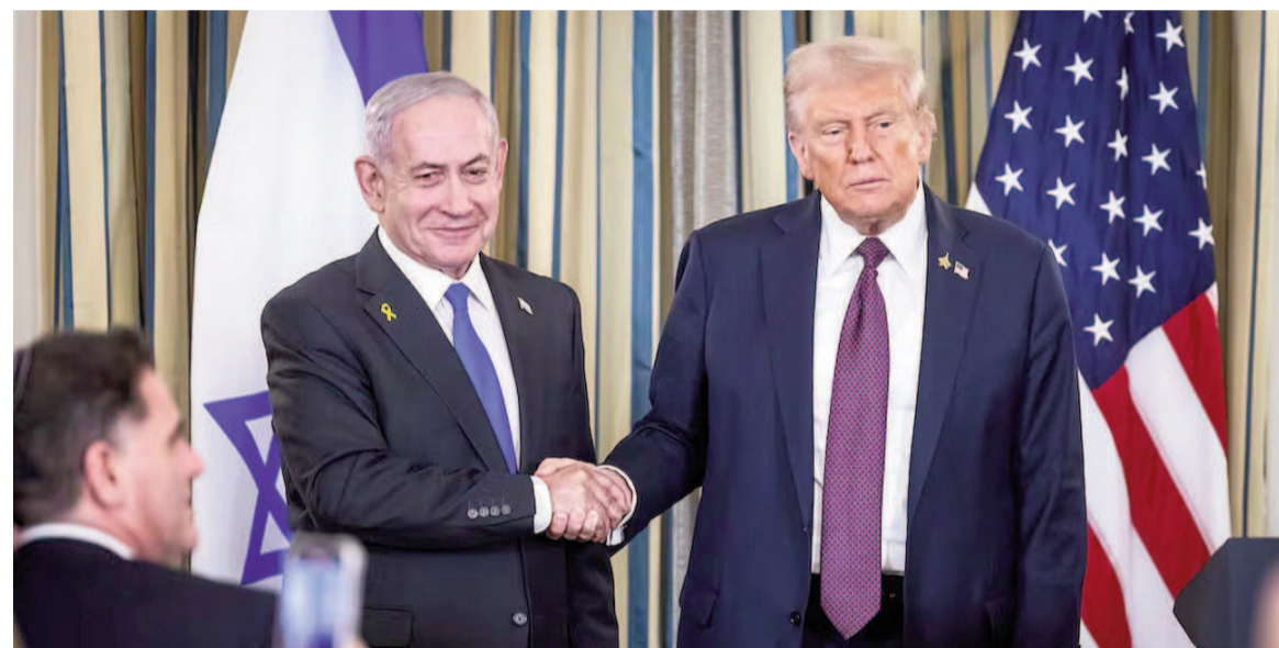
Benjamin Netanyahu junto a Donald Trump.

Se trata de la primera fase del plan presentado por el presidente estadounidense que contempla el regreso a casa de los 47 secuestrados por los terroristas y la liberación de una lista de palestinos encarcelados en territorio israelí.