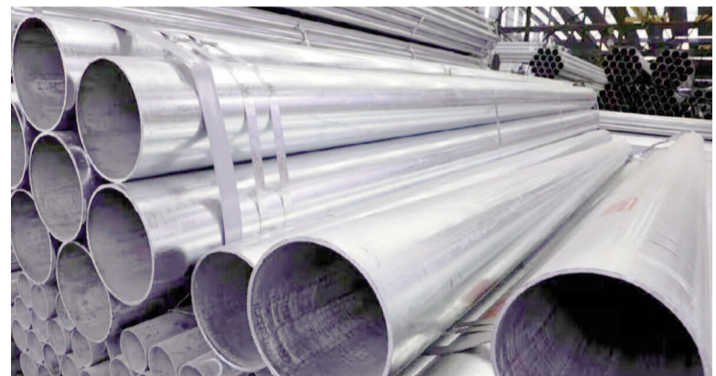
Se suspendió la alícuota del derecho de exportación para el aluminio y el acero.

Al argumentar la decisión, el Ejecutivo sostuvo en el texto oficial que “la presente medida busca fortalecer la capacidad exportadora y dotar de una mayor competitividad a uno de los sectores productivos del país, alineando las políticas con los principios de la libertad y una mayor apertura del comercio que impulsen el crecimiento de las cadenas de valor industriales”.