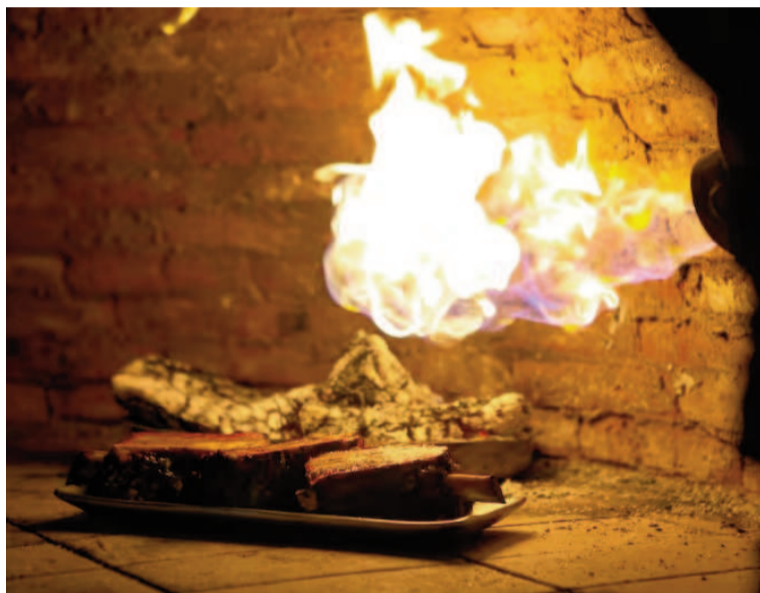
Las temperaturas infernales, radioactivas, devastadoras no son buenas para cociones largas.

Y es común que, como pasa con algunas construcciones improvisadas, la bóveda se termine rajando, perdiendo en las cociones una importante cantidad de energía.