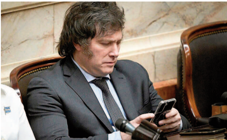
La Justicia analizará el teléfono del Presidente.