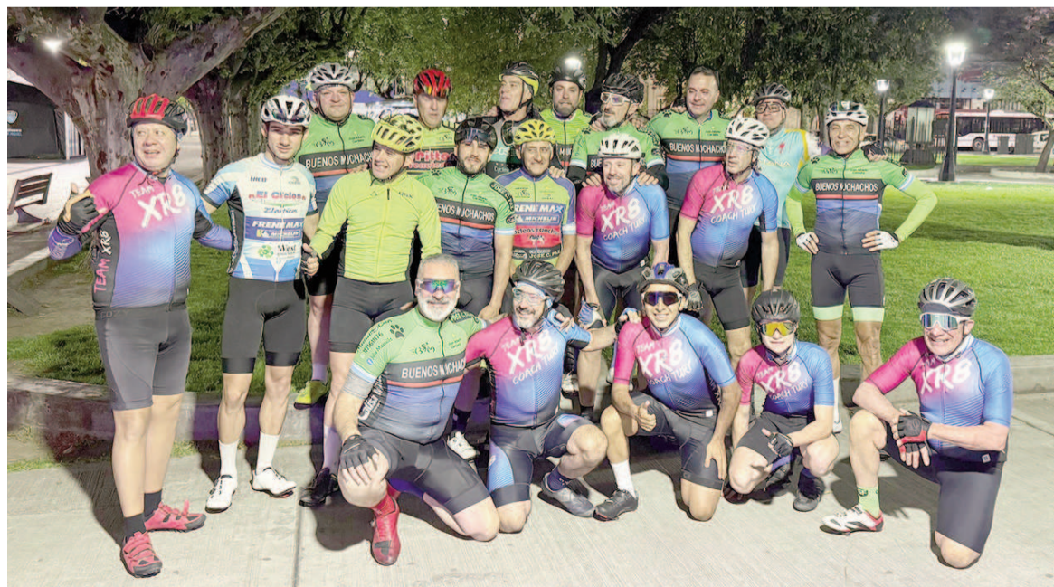
El grupo de cicloturismo "Buenos Muchachos" de Buenos Aires, que visitaron el club Ciclista San Nicolás.