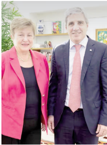
Luis Caputo con la directora gerente del FMI, Kristalina Georgieva.

“Argentina está llevando adelante un programa de ajuste muy drástico. El éxito va a depender de lograr que la gente acompañe”, remarcó durante un discurso antes de la reunión conjunta con el Banco Mundial y luego del encuentro con el ministro de