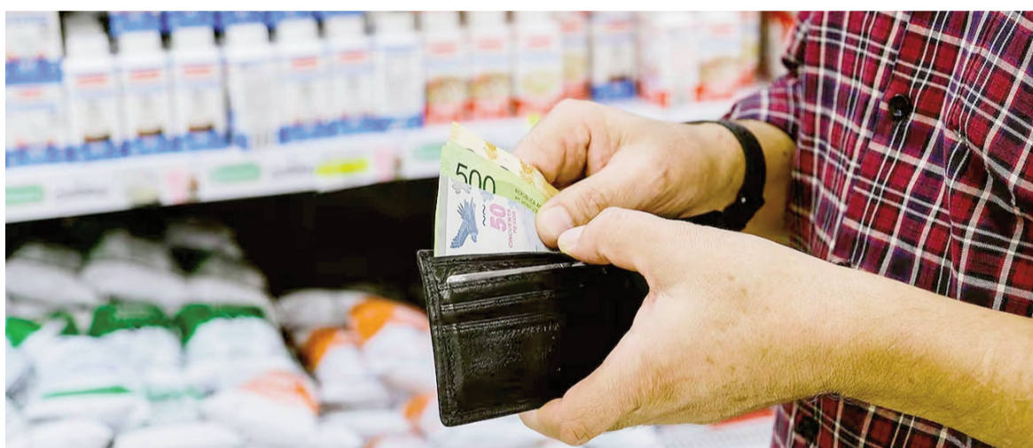
La inflación semanal de alimentos se aceleró en octubre.

adelante menguaron, ya que el resultado de la elección traccionó los activos argentinos al alza y el dólar a la baja. Esto, «llevó a corregir nuestra imputación de la última semana y el promedio del mes levemente a la baja», especificaron. Así, en octubre, la consultora que dirige Marina Dal Poggetto proyecta que la inflación se ubique en 2,4%. En tanto, para CRE-EBBA la variación de precios del capítulo alimentos se ubicará en octubre en torno al 2,2%, superando al valor del mes previo (+1,7%). Dentro de esta división, se observan aumentos en Carnes cercanos al 4% promedio; Frutas (+7%); Bebidas alcohólicas (+4,5%) y Cereales y derivados con valores en torno al 3,5%. Mientras que en el resto de los capítulos las variaciones fueron más dispares, con algunos aumentos puntuales en automóviles OKM en torno al 5% promedio.