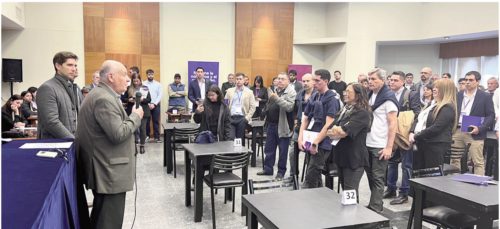
La cuarta Ronda de Negocios de la Federación propició contactos y acercamientos entre pymes, grandes empresas y el sector financiero. EL NORTE