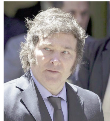
Milei y gobernadores, se verán las caras tras las elecciones.