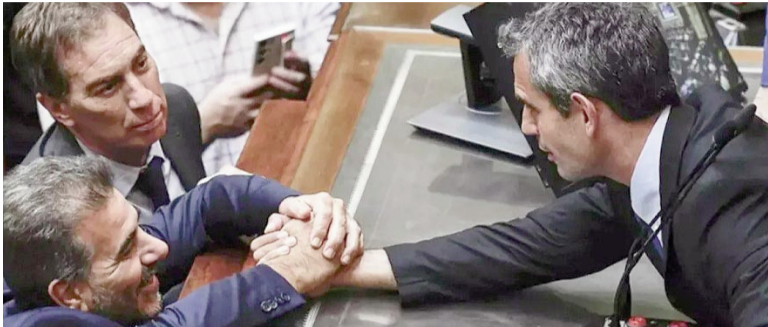
Menem, Ritondo y Santilli.

Las bancadas de La Libertad Avanza y el PRO avanzaban en la conformación de un interbloqueo en la Cámara de Diputados que les permitirá alcanzar la primera minoría, lo que le facilitará al oficialismo la sanción de las iniciativas estructurales que impulsa el Gobierno.