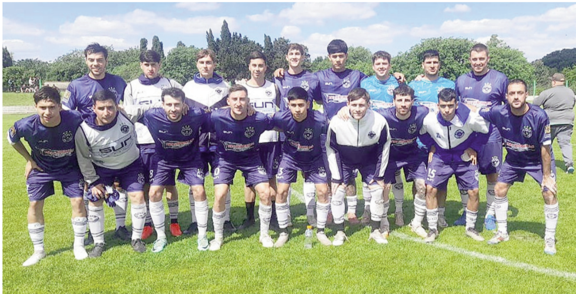
Somisa quedó como escolta del líder La Emilia. EL NORTE

En el cierre de la fecha 12 del Clausura, el equipo del barrio rescató un punto agónico ante Los Andes. Fue 2 a 2, con un polémico discutido gol de Gatti sobre la hora. Rojo venció a Argentino Oeste y se prendió arriba.