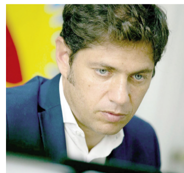
El gobernador no se verá con Milei aunque quiera.

“Sí, vamos a ir”, expresaron fuentes bonaerenses consultadas sobre