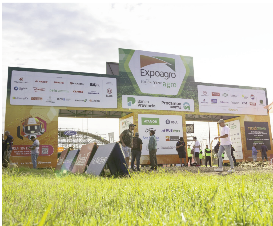
Del 10 al 13 de marzo, en el Predio Ferial y Autódromo San Nicolás, Expoagro celebra en 2026 sus 20 años.

La edición aniversario llega con un predio renovado y una infraestructura a la altura de este gran hito: reestructuración de los ingresos para agilizar la circulación; ampliación de los playones con servicios