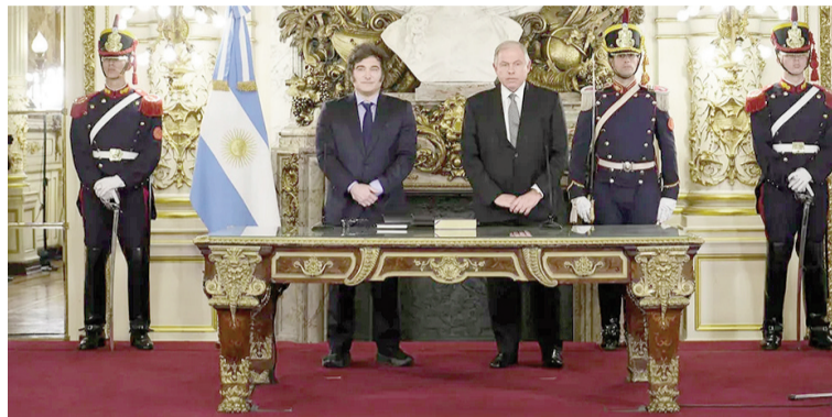
El presidente Javier Milei con Gerardo Werthein.

El ministro de Relaciones Exteriores tenía mucha mejor relación