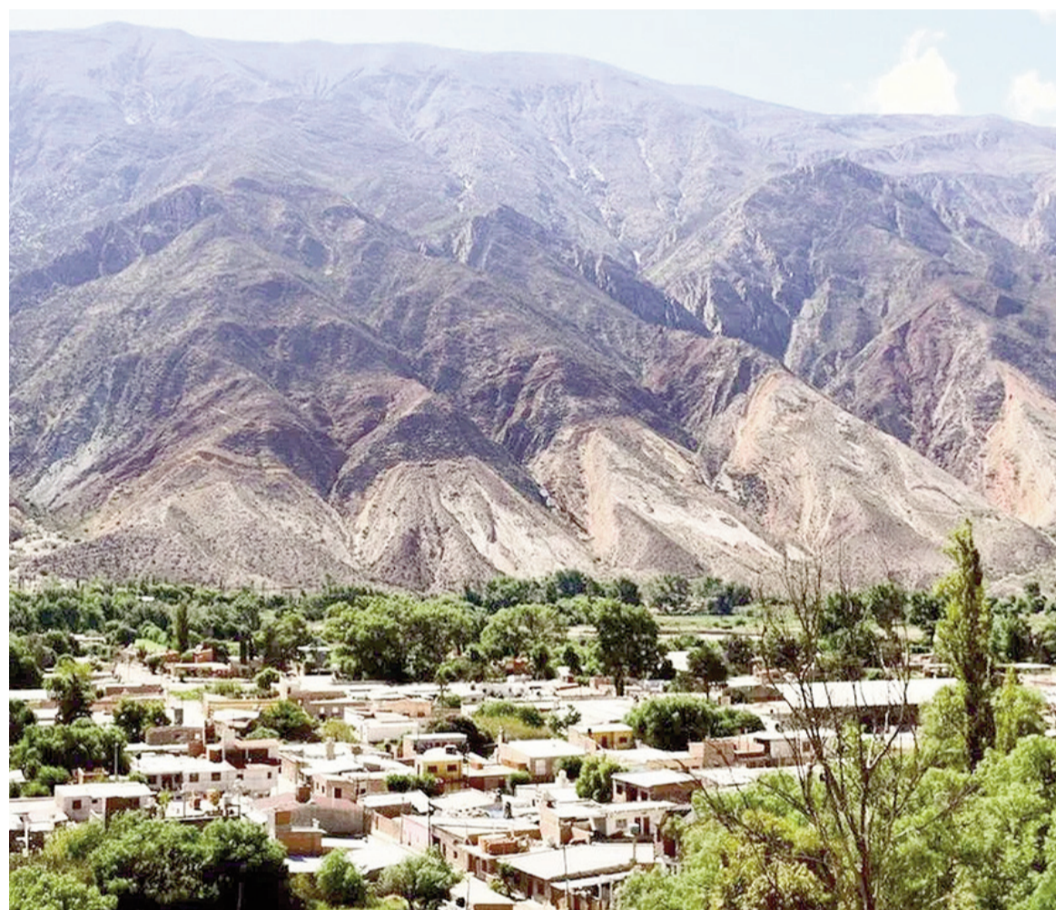
Un pueblo argentino reconocido en China.

La localidad jujeña, en el corazón de la Quebrada de Humahuaca, fue reconocida por la ONU por su paisaje, su cultura ancestral y su desarrollo sostenible.