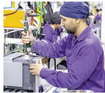
El EMAE mejoró 0,3% respecto de julio.

En el otro extremo, los sectores que más incidieron a la baja fueron la industria (-5,1%) y el comercio (-1,7%). "Estos datos reflejan aun el escenario de una economía estancada