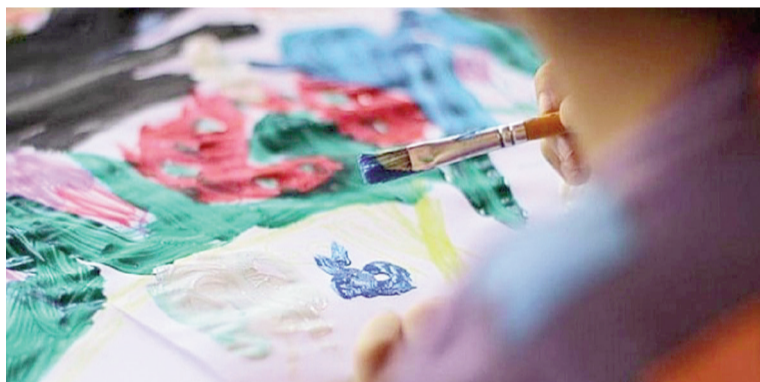
Autismo y salud mental.

La licenciada señala que no existe una definición cerrada del autismo, pero sí puede identificarse a través de síntomas recurrentes. «El lenguaje es un elemento fundamental porque para entender el autismo tenemos que entender que hay un disfuncionamiento del lenguaje», afirmó.