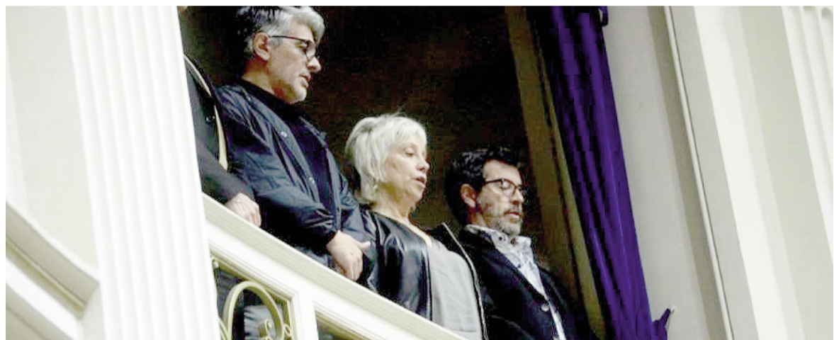
El actor Pablo Echarrí apoyó la ley durante el debate en Diputados.

También crea el Consejo provincial de la Producción Audiovisual Bonaerense, que funcionará dentro de la órbita de la autoridad de aplicación y será un órgano consultivo "a los efectos de garantizar la implementación transparente, inclusiva y equitativa de la promoción y el fomento que esta ley establece, y