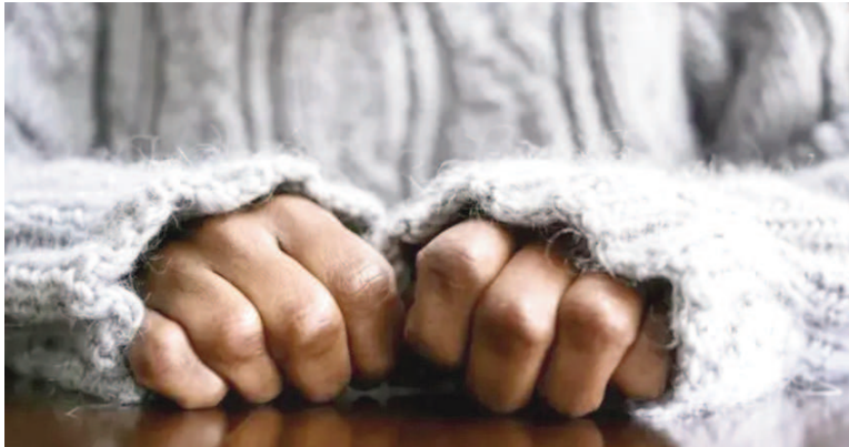
La mujer hipoacúsica estaba encerrada dentro de la casa de su expareja en Acevedo.

Un grave episodio de violencia de género en la localidad de Acevedo requirió anteayer la intervención de efectivos del destacamento policial, luego de que una mujer denunciara que su hija estaba siendo retenida contra su voluntad en la vivienda de su expareja, pese a que existía una medida judicial de prohibición de acercamiento vigente.