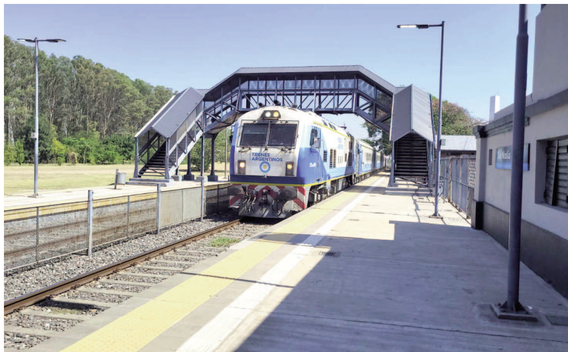
Ezequiel Ruiz Memler / EL NORTE

En cuanto a los pasajeros que ya tenían los pasajes para estos destinos, fueron informados sobre la situación y se habilitó la devolución de la totalidad del dinero pagado por el boleto. El servicio a Córdoba sale de Retiro los jueves y domingos y regresa viernes y martes, con paradas en la provincia de Buenos Aires en Campana, Zárate, Baradero, San Pedro, Ramallo y San Nicolás. Y los trenes a Tucumán parten los miércoles y los domingos, con retorno martes y viernes, con paradas en Campana, Zárate, Baradero, San Pedro y San