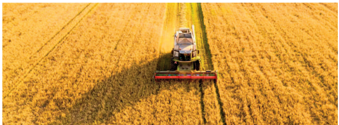
La cifra liquidada marca un salto del 187% en comparación con el mismo mes de 2024.

Según informa CIARA-CEC, en el esquema habitual “el ingreso mensual de divisas, transformadas en pesos, es el mecanismo que permite seguir comprando granos a los productores al mejor precio posible. La liquidación de divisas está fundamentalmente relacionada con la compra de granos que luego serán exportados, ya sea en su