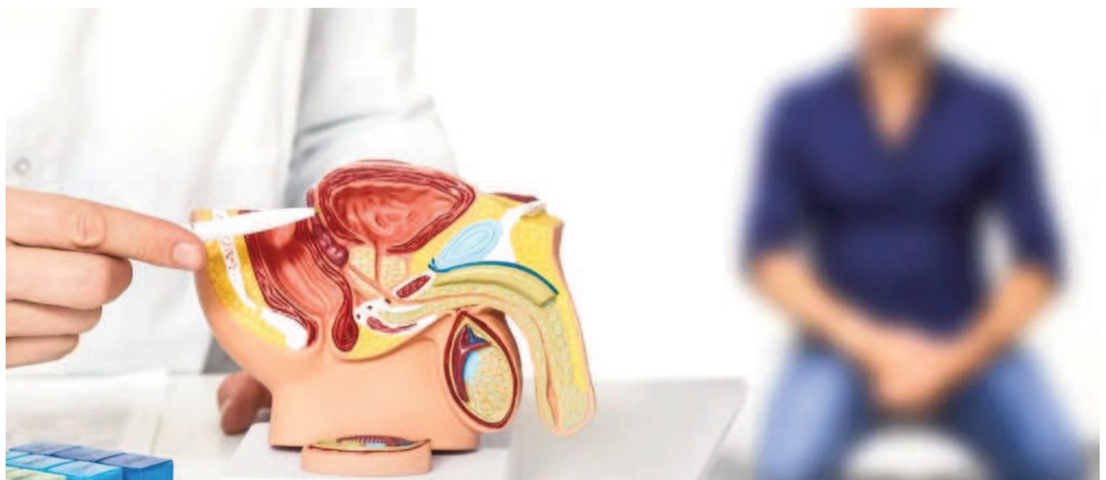
Aprueban en el país una nueva terapia para el cáncer de próstata avanzado.

La terapia funciona como un “misil guiado”: una molécula (PSMA-617) se une a una proteína que sobreexpresa las células tu-