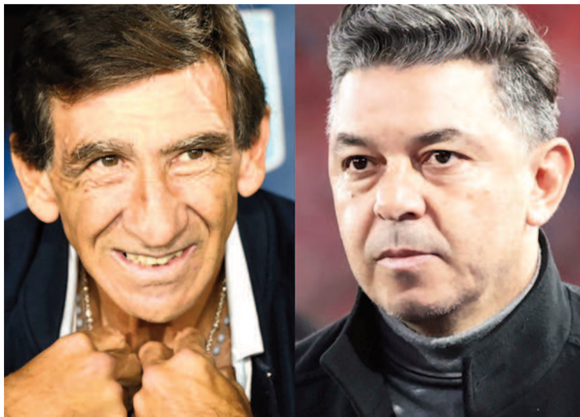
Racing y River, duelo decisivo en Rosario por los cuartos de final.

La "Academia" y el "Millonario" se enfrentarán en un choque cargado de necesidades y con realidades opuestas en el plano local e internacional. Se jugará en el Gigante de Arroyito a partir de las 18.00.