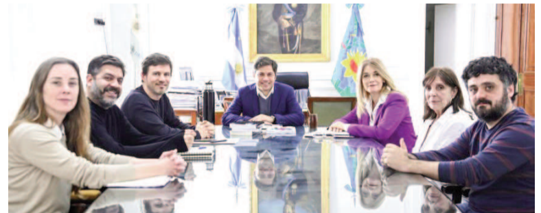
El gobernador no lograr  su "minipresupuesto".

Si los planetas se alinean y los 21 senadores de Uni n por la Patria bajan y votan favorablemente (ser  algo in dito en este a o legislativo), estar  a 10 voluntades de aprobar el proyecto. La UCR tiene seis votos, el PRO cuenta