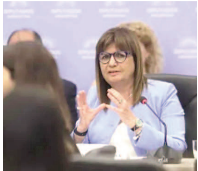
La ministra le exigió respuestas al principal candidato de LLA de cara a octubre.

«Es lo que necesitamos saber, puede haber presentado una explicación en la Justicia Electoral, y esa explicación puede haber sido válida