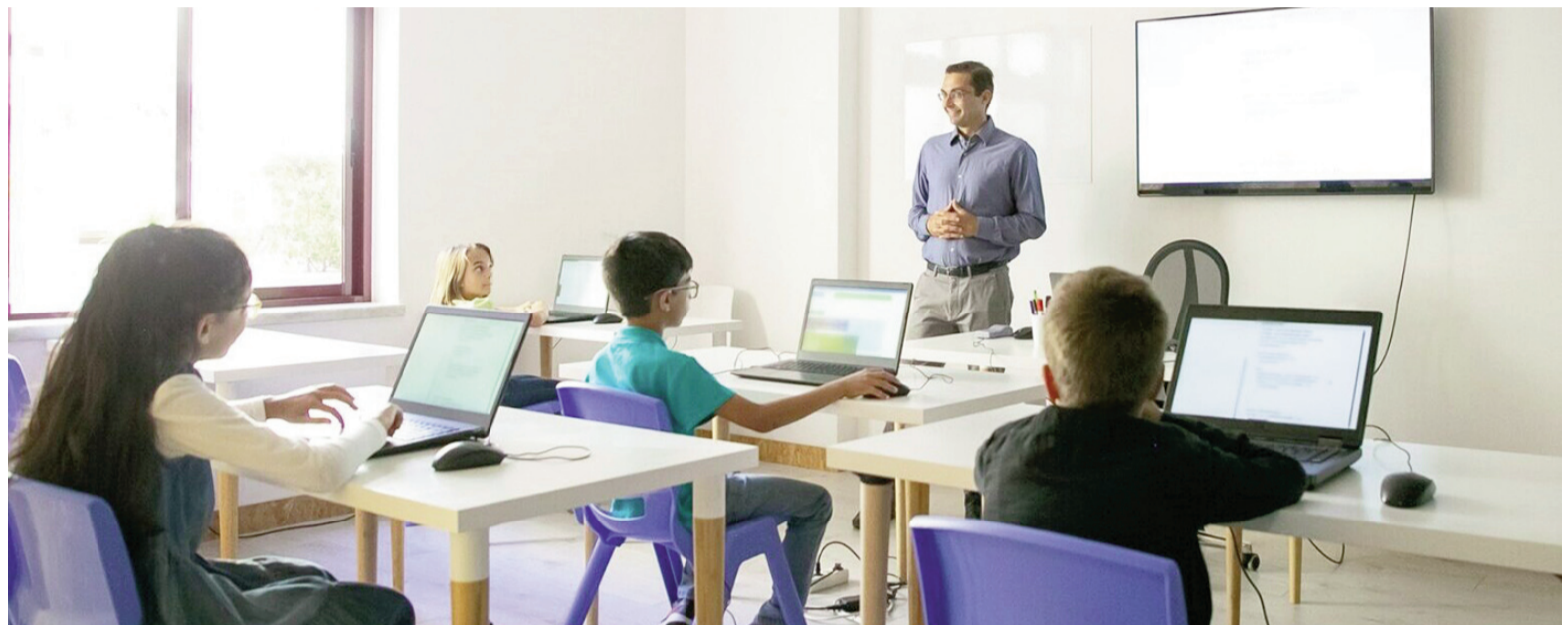
La cibergogía combina saberes pedagógicos y recursos digitales para sostener actividades que comprometan al estudiante en primera persona.

El enfoque suele organizarse en tres planos: el social, el cognitivo y el emocional. Es decir, cómo se vinculan los estudiantes entre sí, qué operaciones de pensamiento se proponen y qué lugar ocupan las emociones durante el proceso. Cuando uno de esos planos queda desatendido, la experiencia pierde cuerpo: el intercambio se achica, la tarea