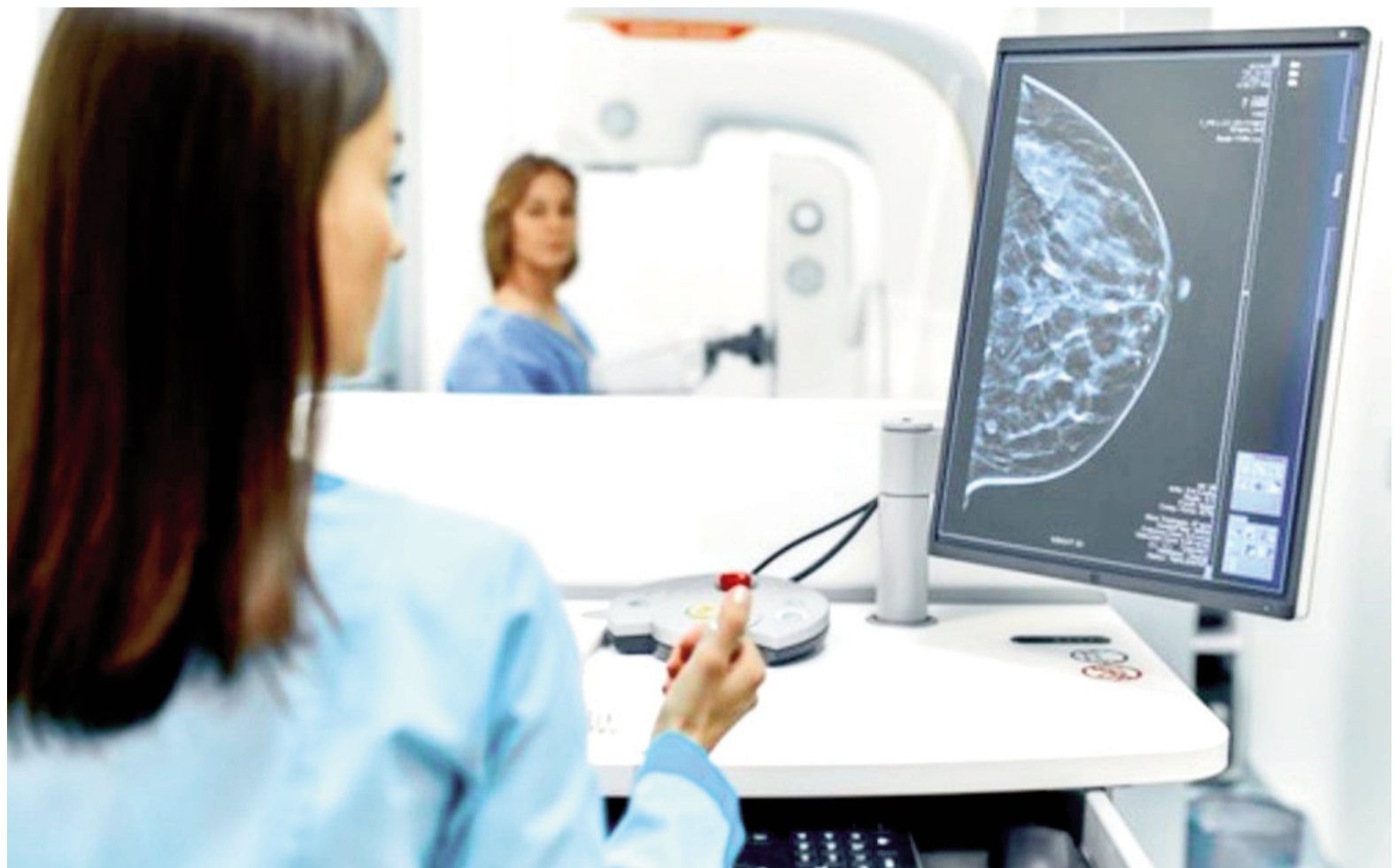
La mamografía estará indicada desde ahora a partir de los 40 años en pacientes bonaerenses.

Sin duda, se trata de una iniciativa conveniente e importante a la hora de prevenir una enfermedad que afecta a gran cantidad de mujeres año a año. Sin embargo, el Hospital