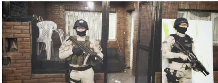
Los operativos se efectuaron en propiedades de Río Tala y San Nicolás, de donde son oriundos los efectivos.

La víctima, una vez que reanudó la marcha, se dirigió a la sede de Prefectura en San Pedro y radicó la denuncia co-