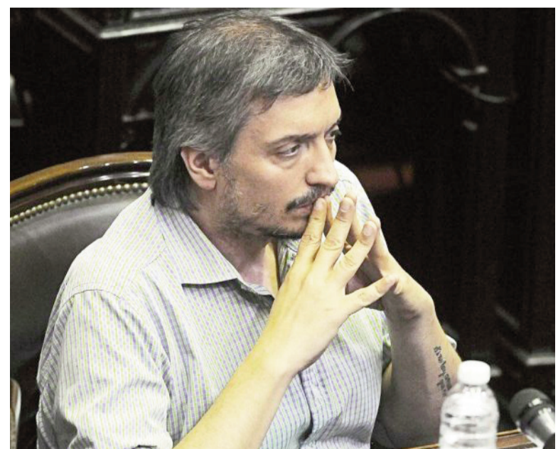
El diputado nacional Máximo Kirchner.

A la hora de justificar su iniciativa, Kirchner calculó que “entre abril y agosto de este año se fugaron 18 mil millones de dólares solo por MUC, ¿no? Ponele que vos dijeras, bueno, vamos un poquito abajo de Brasil del 3,5 al 3% y estamos hablando de 540 millones de dólares que lo podrías distribuir de asignación específica a seguridad social, salud, a las provincias argentinas, que están en un momento, muchas, complejo”.