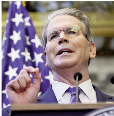
El secretario del Tesoro de Estados Unidos, Scott Bessent.

Al ser consultado si el Tesoro de EEUU comprará deuda argentina,