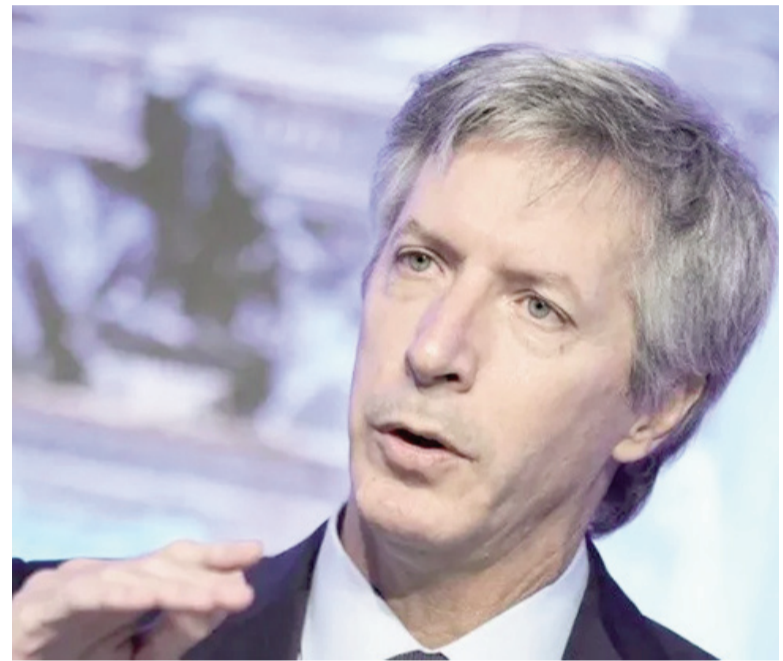
Bausili adelantó cuál será el plazo del swap.

Consultado por las declaraciones de Trump sobre el resultado electoral argentino, Caputo aclaró: «El presidente Trump apoya nuestras políticas. No me imagino que apoye el comunismo. Lo que nos hace daño en la Argentina es la volatilidad política; los inversores quieren ver que vamos todos hacia el mismo lado».