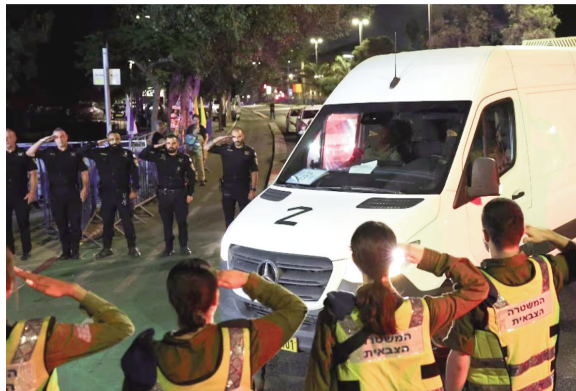
Personal israelí saluda la llegada de un vehículo que transporta el cuerpo de un rehén fallecido en Gaza.

La organización terrorista entregó ayer otros dos cuerpos, pero dijo que no pudo localizar a los 19 restantes.