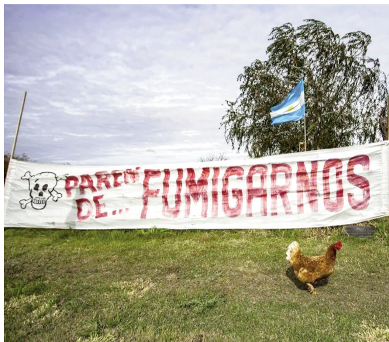
Rechazo a la fumigación con agrotóxicos.

Según las comunidades, “el verdadero debate sobre el modelo agro-negocio no son las distancias de las fumigaciones, sino su insostenibilidad ambiental y sanitaria”, por lo que exigieron la derogación inmediata del proyecto y la resolución, así como