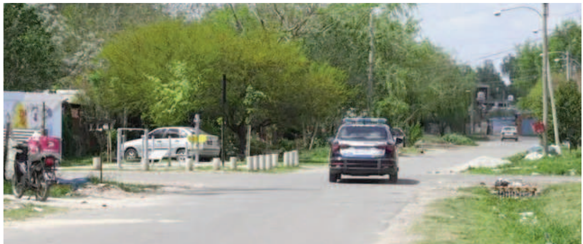
El cuerpo del hombre fue hallado en una casa abandonada de la zona oeste.

Relevamiento de cámaras de seguridad de la zona para intentar reconstruir los hechos.