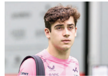
Franco Colapinto, 16 en la parrilla de salida.