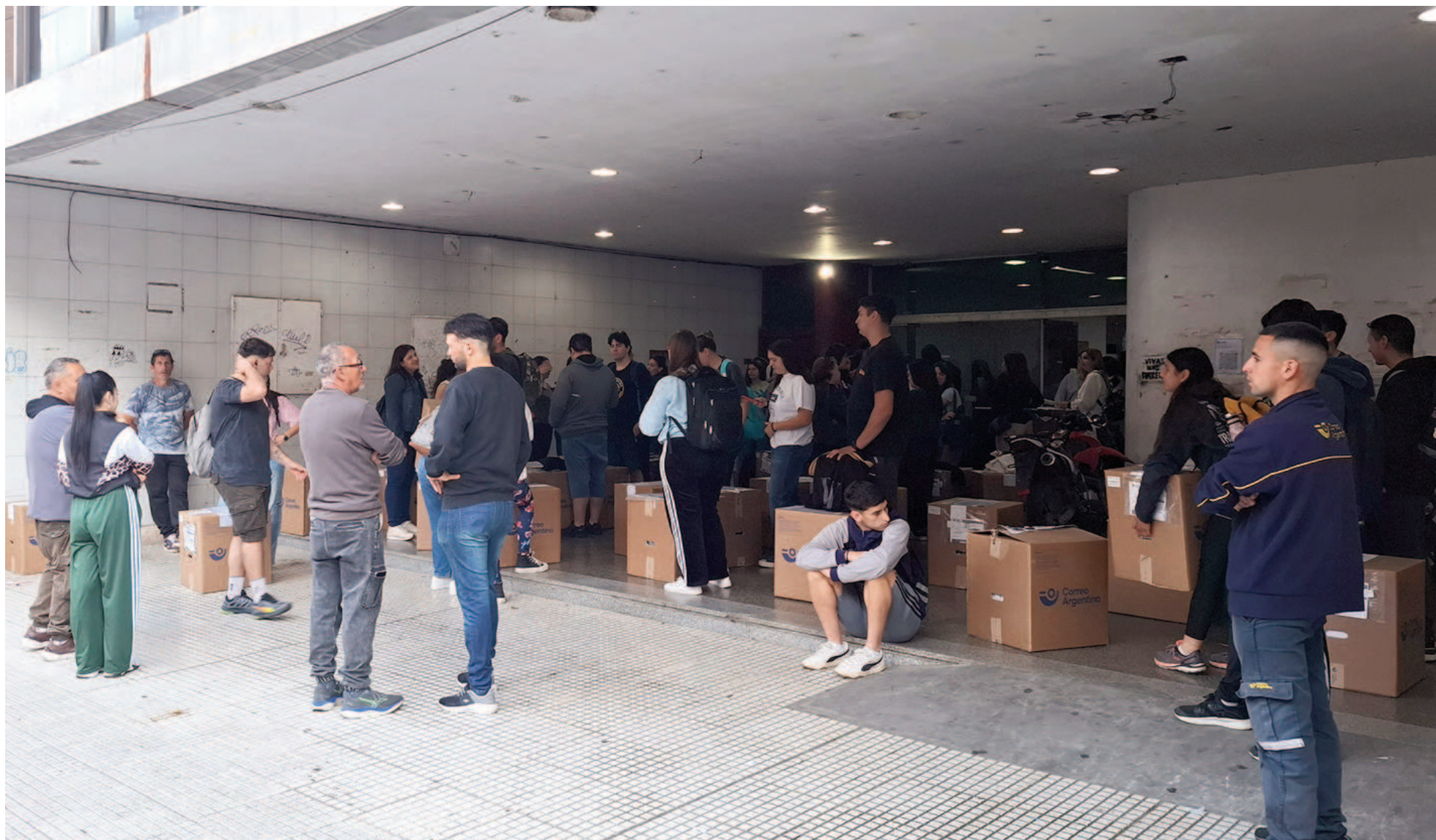
Personal del Correo Argentino y operadores se concentraron en la sede local para la distribución de urnas y equipos.