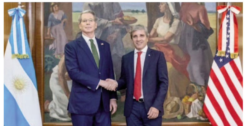
Bessent y Caputo y una foto que se repetirá por estas horas.

“El Tesoro de los Estados Unidos está totalmente preparado para hacer lo que sea necesario y continuaremos observando de cerca los acontecimientos”, escribió Bessent en su cuenta de X.