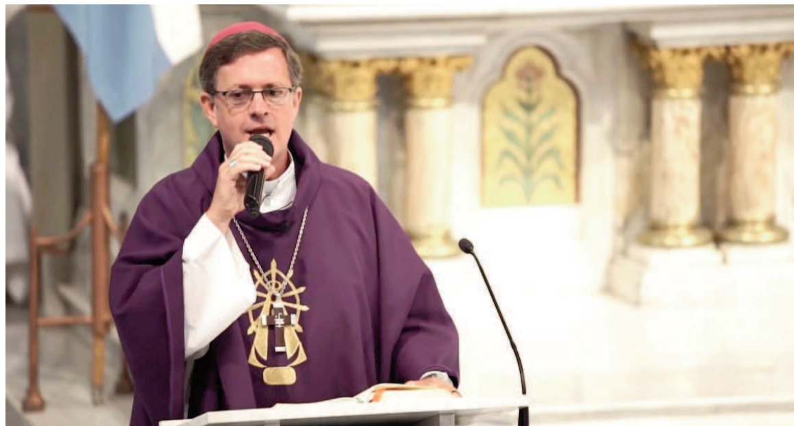
El arzobispo de Buenos Aires, Jorge García Cuerva.