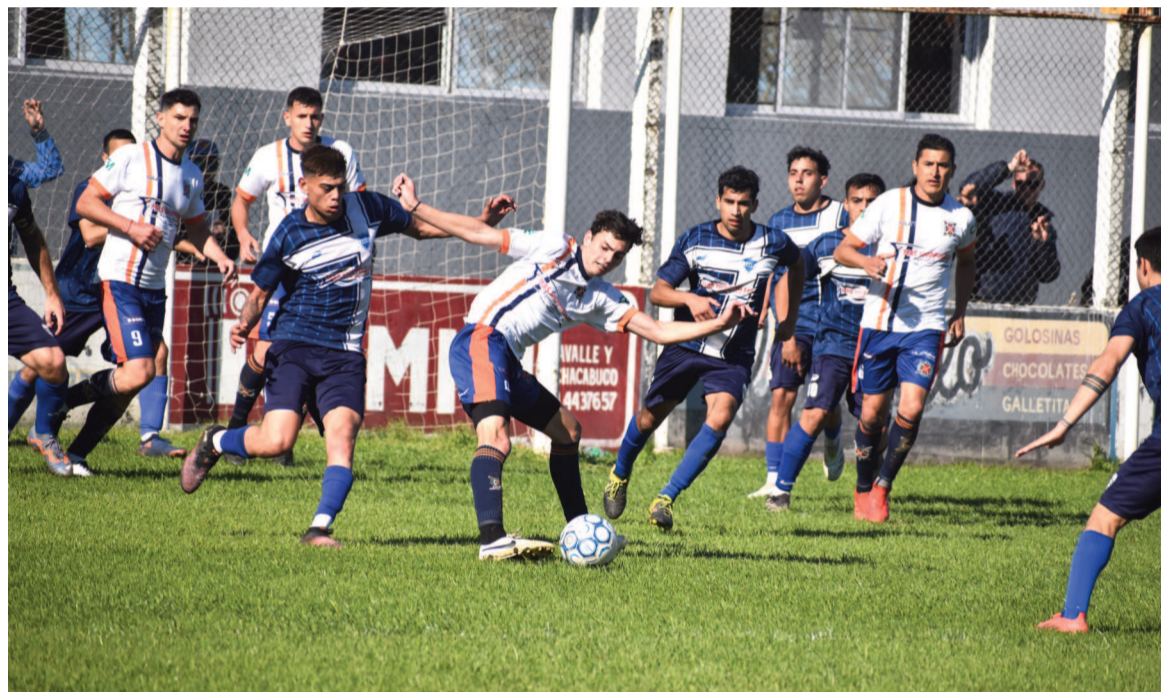
Regatas será local ante 12 de Octubre en Prado Español. EL NORTE

Siete partidos animarán la jornada de hoy, en la que se destaca el choque que protagonizarán Defensores y Gral. Rojo en Villa Ramallo. El Granate es uno de los punteros junto con Somisa.