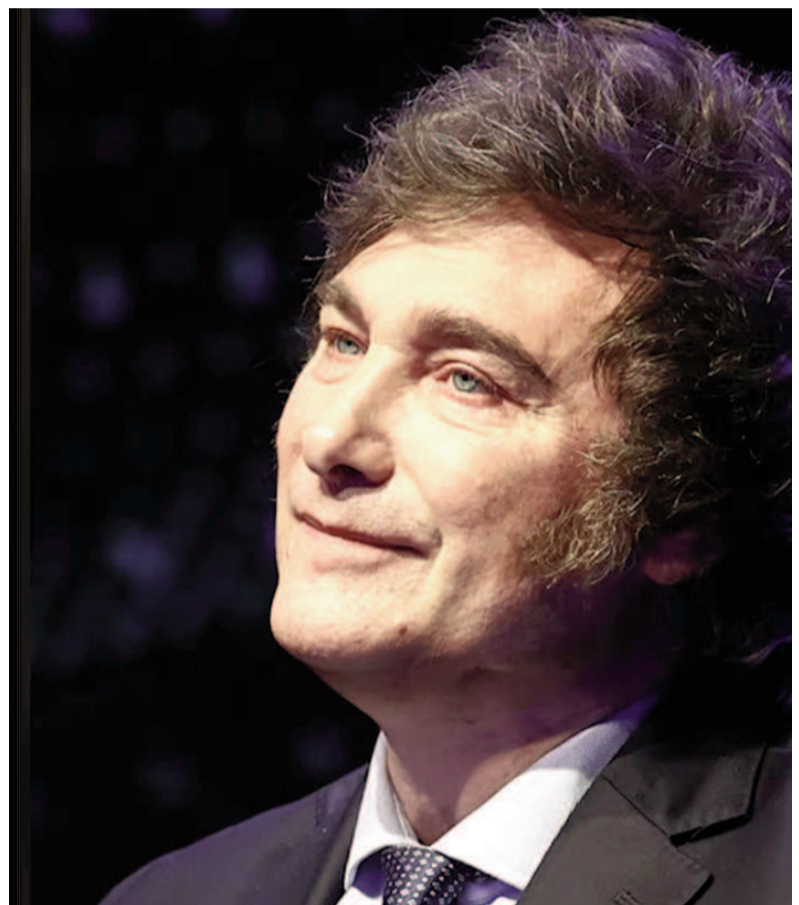
Milei y Macri volvieron a verse las caras después de un largo tiempo.

bajar en conjunto, a partir del 27 de octubre, para construir los consensos necesarios que nos permitan avanzar en las reformas estructurales que necesita nuestro País para que sea grande nuevamente. VLLC!”, escribió el jefe de Estado. Volvió a llamar “Presi” a Macri, luego de los enconos desatados el año pasado por los señalamientos a la gestión del líder de PRO; y por los destratos de la hermana de Milei a los amarillos en el armado electoral en la Ciudad, este año. Las últimas conversaciones se habían mantenido en total reserva por días. Y en varios casos, los encar-