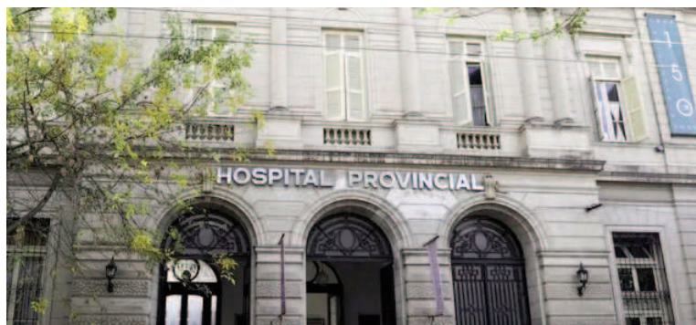
La víctima fue internada en el Hospital Provincial por un tiro en el estómago.

A pesar de haber ingresado al hospital con una identidad inicial errónea, proporcionada por terceros, la víctima fue finalmente