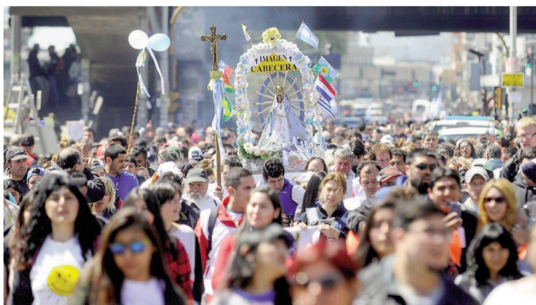
Nueva peregrinación a Luján.