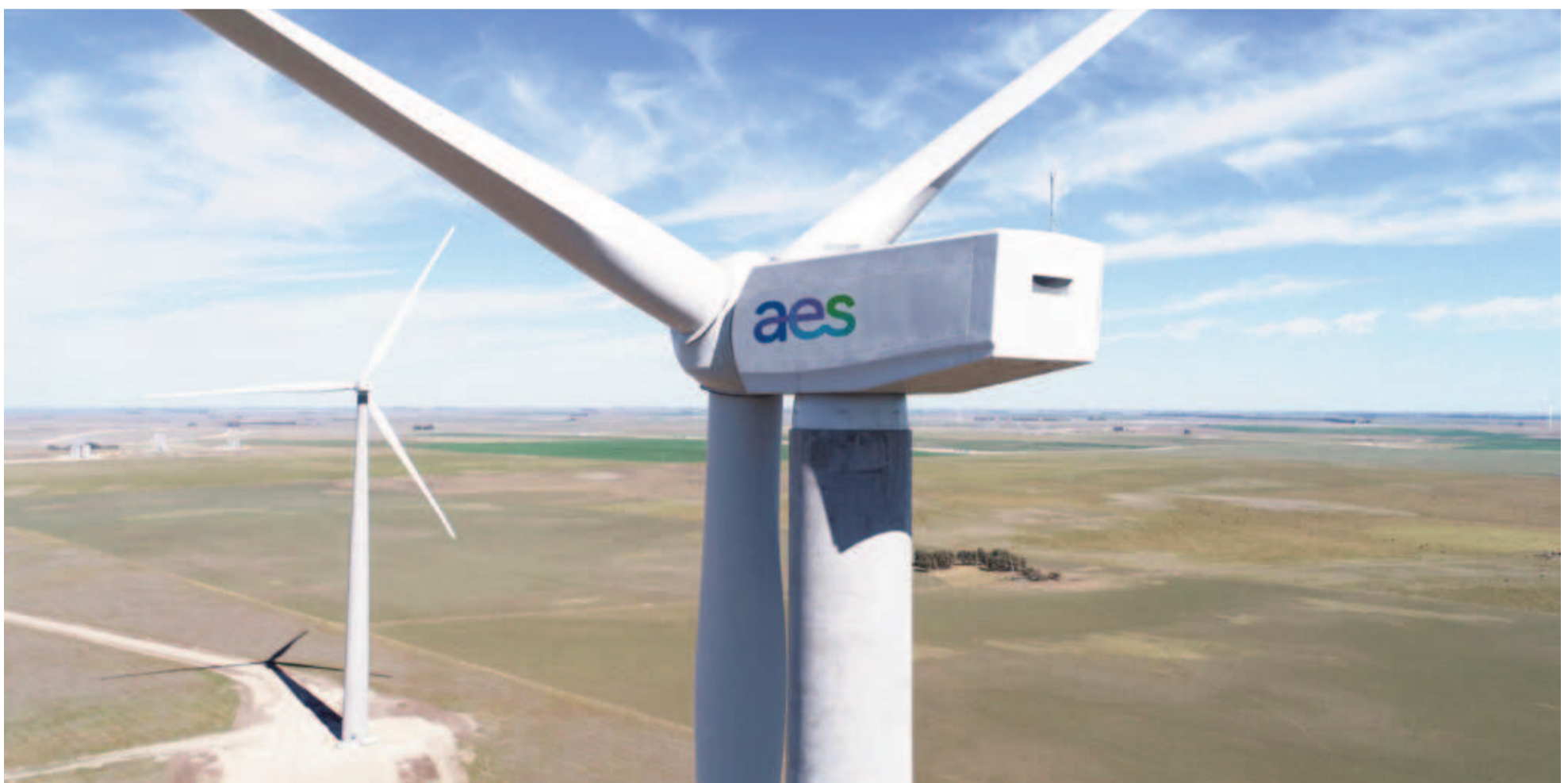
Global Infrastructure Partners, una empresa controlada por BlackRock, busca comprar AES Corporation, según lo publicado inicialmente por Financial Times .

El fondo de inversión más grande del mundo está en conversaciones avanzadas para comprar AES Corporation, una de las cinco mayores generadoras de energía del país. La empresa estadounidense obtuvo este año una sentencia favorable en el CIADI contra el Estado argentino por un valor de US$ 732 millones.