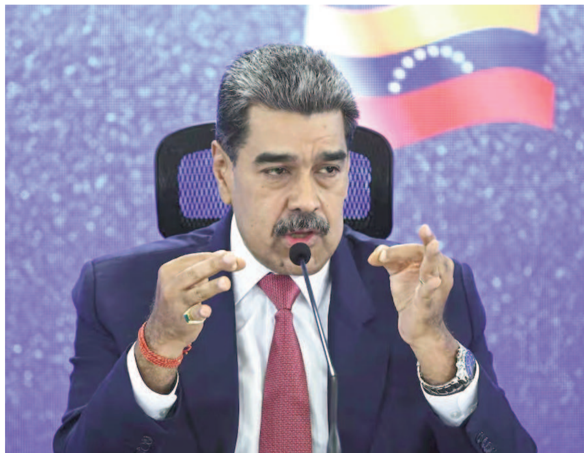
Dura acusación de Maduro contra Trump.

“Venezuela jamás se humillará ante ningún imperio, tenga el poder que tenga, llámese como se llame”, insistió el presidente de Venezuela.