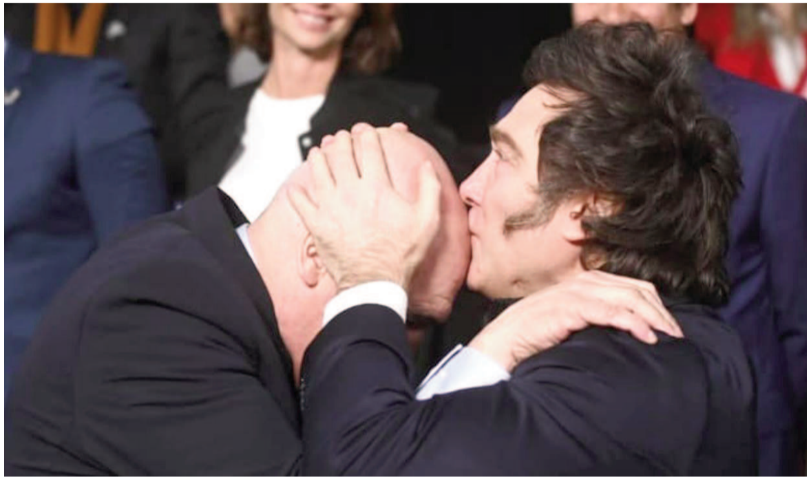
Milei sigue apoyando a Espert mas allá de las denuncias en su contra.

El candidato libertario, que pasó de defenderse con datos y argumentos a mostrar su costado más vulnerable, insistió en que todo se trata de una operación política. «Pasé de ser doctor en economía con 10 a narco, una cosa de loco», lamentó. «A este juego nos llevan esta manga de delincuentes. Y se lo vamos a pelear. Y le vamos a ganar. Y voy a demostrar en la justicia que la inocencia mía es total en esto», concluyó, no sin antes reafirmar la dureza del momento que atraviesa: «No puedo creer lo que te puede hacer la política».