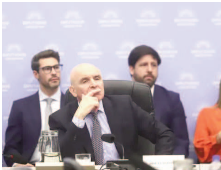
La oposición no descarta expulsar a Espert del Congreso.

A su vez, los bloques buscarán emplazar a la comisión de Presupuesto para forzarla a debatir ciertos días y horario la “ley de leyes” y po-