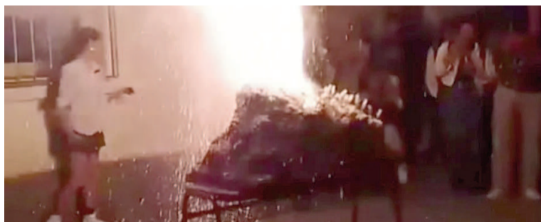
Explosión en una Feria de Ciencias en Pergamino.

Luego prosiguió: "Esta combinación va a formar la pólvora que lo que va a hacer es lo que va a explotar.