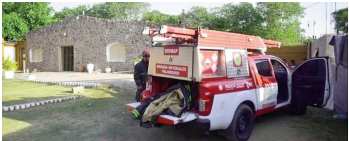
Dos nenas uruguayas murieron tras el incendio de una iglesia evangélica.

Las circunstancias que originaron el incendio en Villa Serrana todavía forman parte de la investigación en curso. Personal de Bomberos y efectivos policiales siguen recorriendo el área, recabando elementos y testimonios para recons-