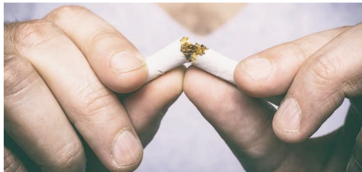
“Nunca es demasiado tarde, y nadie está ‘demasiado enfermo’ para dejar de fumar”.

Un estudio realizado en el Centro Oncológico Siteman sugiere que los pacientes con cáncer en etapa avanzada que dejan de fumar pueden ganar hasta un año adicional de vida en comparación con quienes continúan fumando.