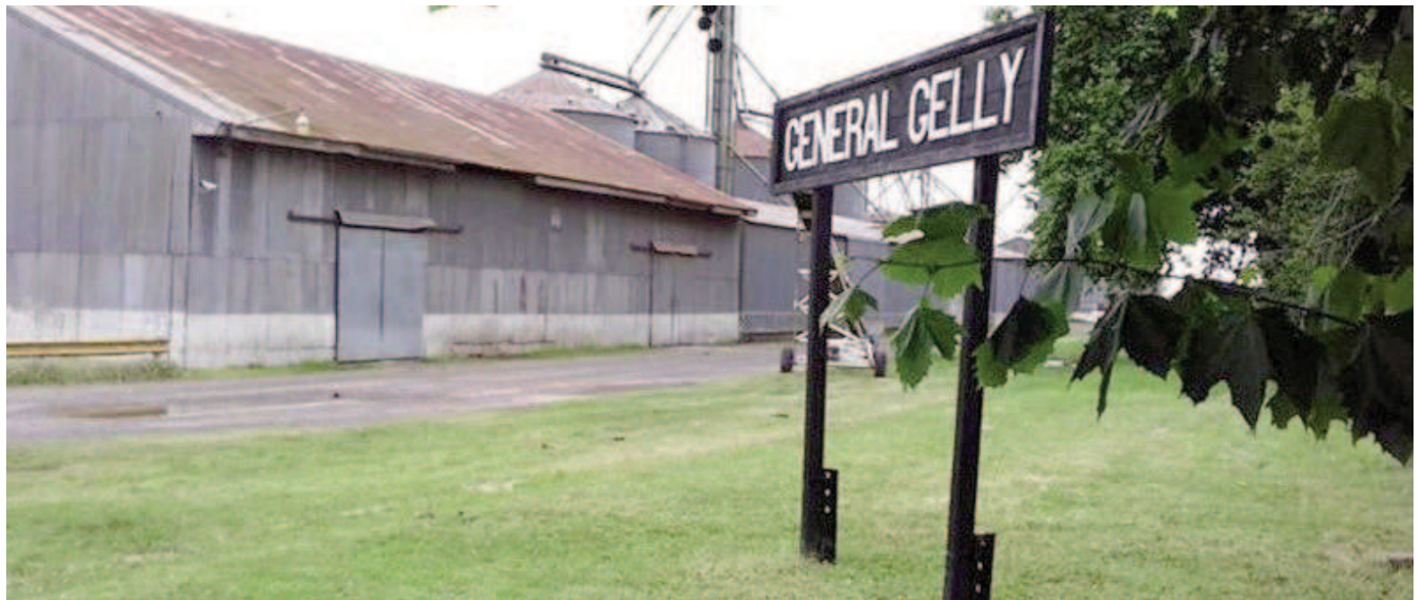
El robo tuvo lugar en un pueblo de 700 habitantes no acostumbrado a este tipo de episodios.

Una hora después del asalto, la víctima consiguió desatarse y avisó a una familiar, quien notificó el episodio al destacamento local. Por estas horas, los investigadores intentaban determinar si se trató de