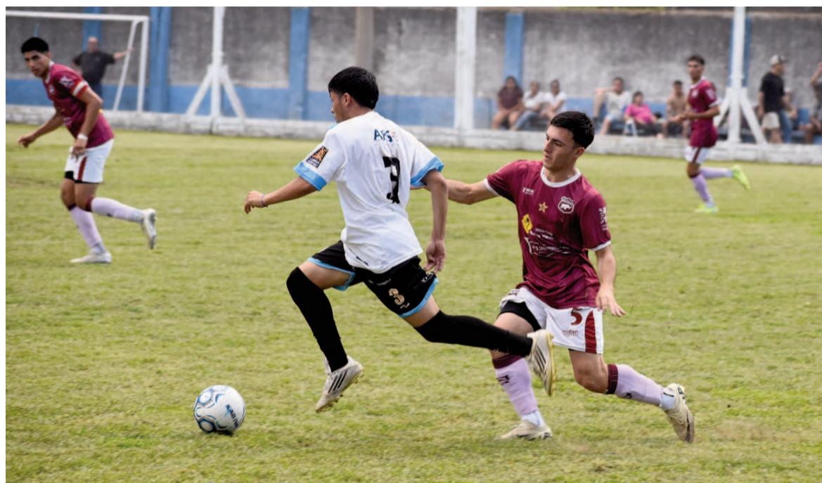
El Albiceleste logró una victoria fundamental ante el Granate. EL NORTE

En el arranque de la décima fecha, y en medio de una intensa lluvia, el Celeste venció como local a Defensores por 1 a 0 y sumó tres puntos clave en su lucha por entrar a la Liguilla.