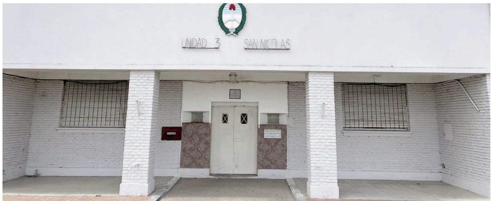
La UP3 de San Nicolás aloja a 985 internos, entre mujeres y varones, superando ampliamente su cupo establecido, que es de 358 personas.

Hay 6 establecimientos destinados exclusivamente a mujeres, 13 a mujeres y varones y 3 a varones y mujeres trans. Distribuidas entre todos ellos, fueron contabilizadas 61.999 personas privadas de libertad en el mes de septiembre de 2025. De ese total, 985 internos, entre mujeres y varones, se encuentran en la penitenciaría de San Nicolás, cuyo cupo es de 358 personas, lo que representa un exceso de población ubicado en el orden del 174,9% que la posiciona muy por