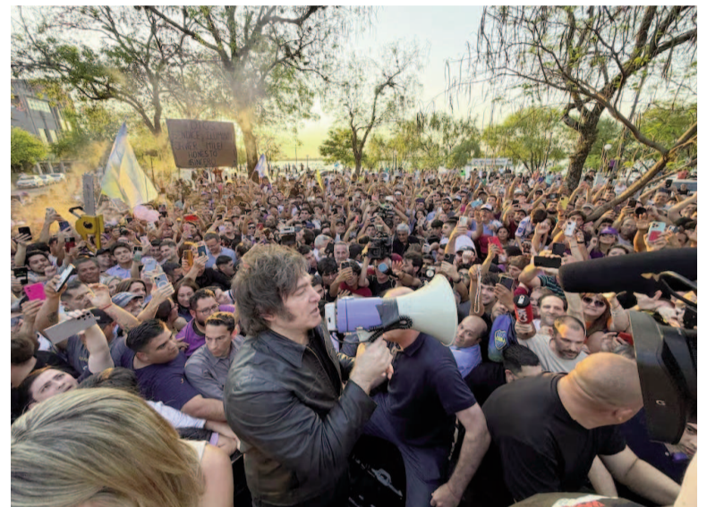
Javier Milei hizo una recorrida por la costanera de Corrientes capital ayer por la tarde.

Durante la última semana, el Presidente también apuntaló la campaña en recorridos en Mar del Plata y San Nicolás. Su objetivo es protagonizar la captación de votos y reencausar