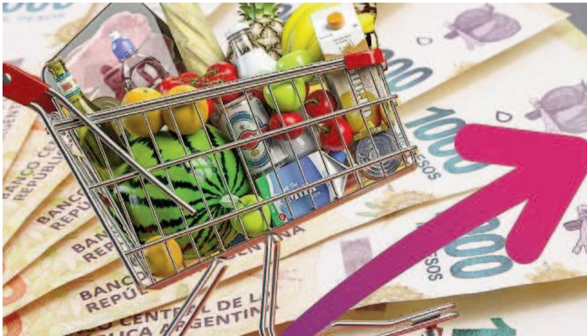
El supermercado continúa siendo un desafío para el bolsillo de los argentinos.

Esta tendencia tiene correlato con otros estudios. Por caso, el informe