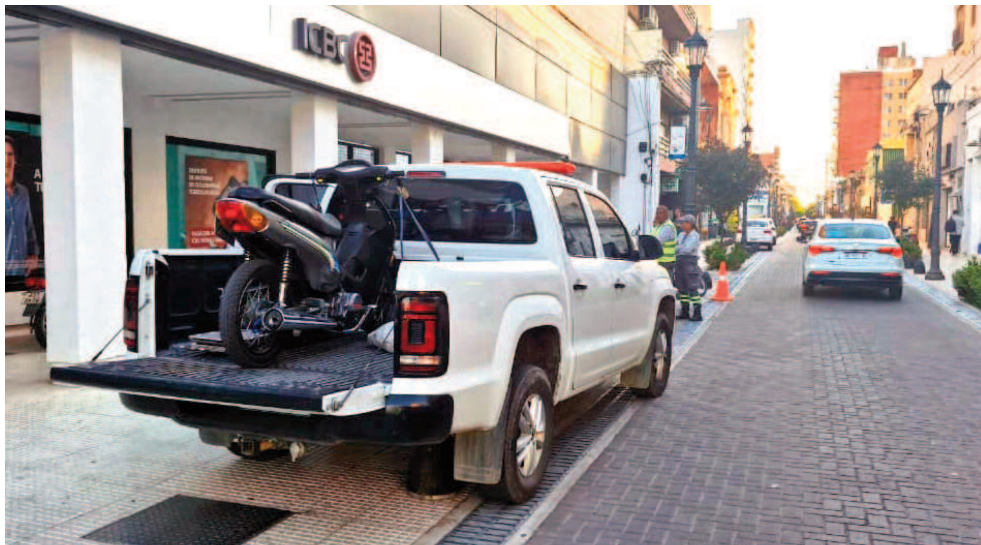
Controles dinámicos en el centro y en los barrios. EL NORTE

En lo que va del 2025 fueron incautadas 1025 motos. La falta de casco y de documentación son las infracciones más comunes. Tras la ordenanza aprobada hace unos años, bajó la cantidad de secuestro de motos por escapes libres, que en este año representan apenas el 7 por ciento del total.