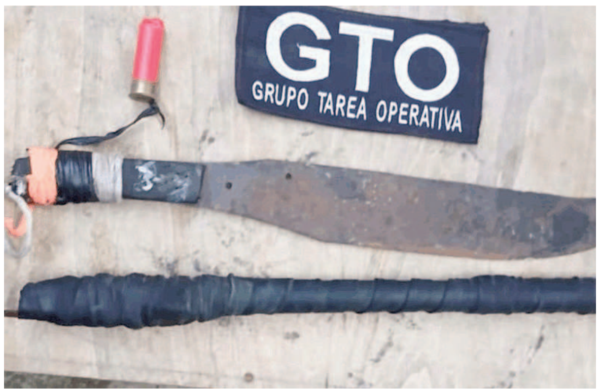
El cartucho, el arpón y la cuchilla que secuestraron durante el allanamiento.

Finalmente, la UFI en turno avaló las actuaciones de todo el cuerpo policial y solicitó que notifiquen a los sospechosos por los delitos de abuso de arma y lesiones leves. Ambos permanecerán bajo arresto.