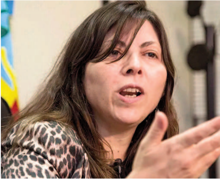
Silvina Batakis, exministra de Economía.

Silvina Batakis, exministra de Economía y actual ministra de Hábitat y Desarrollo Urbano de la provincia de Buenos Aires, criticó duramente la política económica actual y la inédita intervención de Estados Unidos en el mercado cambiario argentino.