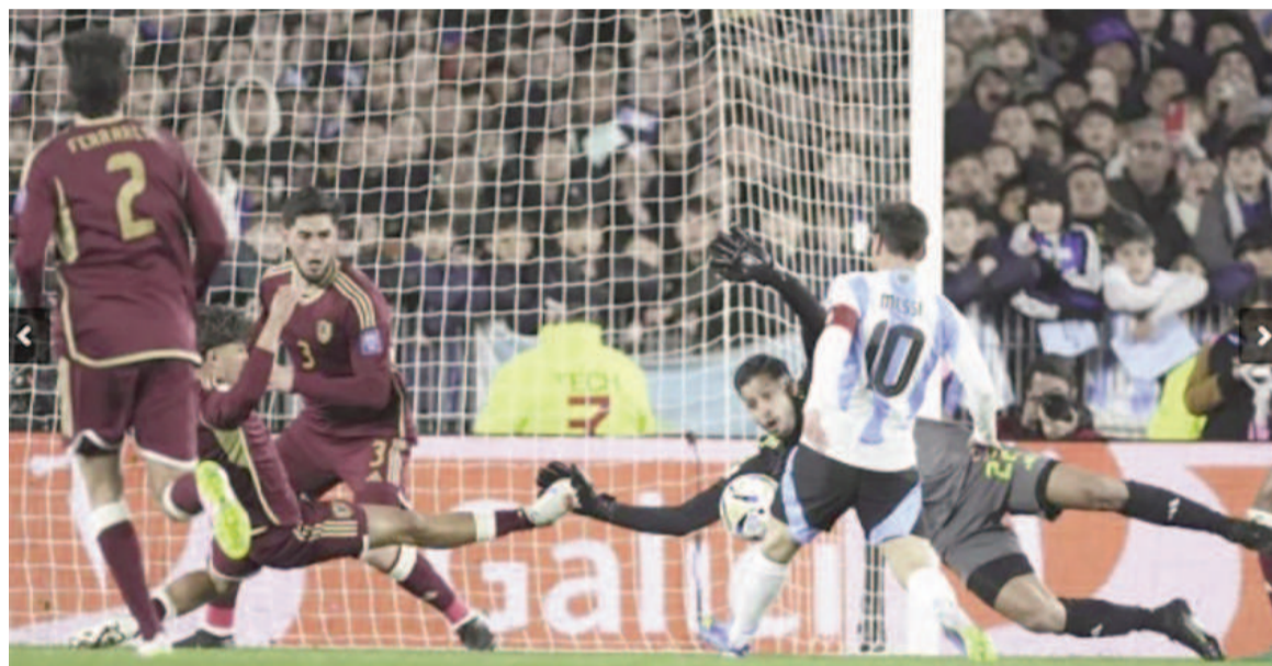
El equipo de Scaloni fue muy superior y plasmó una categórica victoria.

El conjunto albiceleste derrotó a la Vinotinto por 3 a 0 en el Monumental con una actuación estelar del crack rosarino, quien anotó dos goles, y el restante fue obra de Lautaro Martínez.