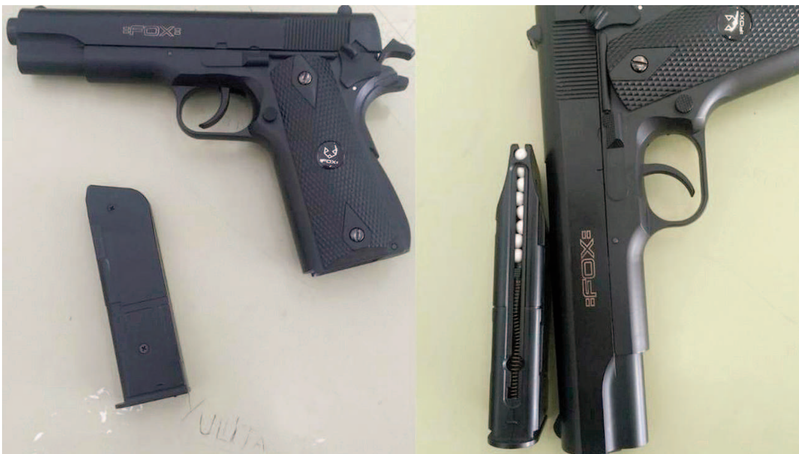
Un alumno ingresó a la escuela con una réplica de arma de fuego en su mochila.

La mujer, presente en el lugar, autorizó la revisión de las pertenencias de su hijo sin oponer resistencia. Durante la inspección, el personal constató que dentro de la mochila del menor había una réplica de arma de fuego.