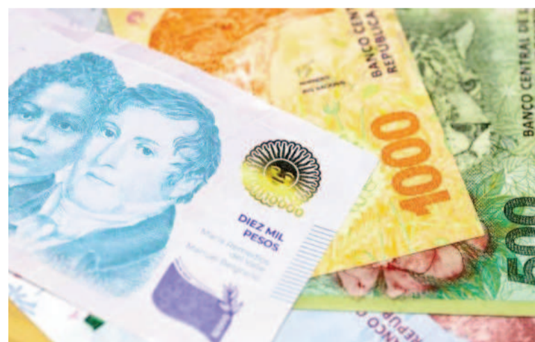
Empresas planifican que los salarios fuera de convenio sean igual a la inflación.

Así y todo, el 16% de las compañías prevén incrementos entre 3 y 5 puntos por debajo de la inflación.