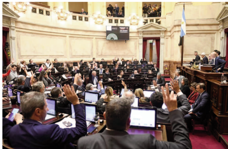
El pleno de la Cámara Alta durante la sesión de este jueves.

Desde el momento en que esas leyes se aprobaron, el Gobierno aseguró que rompían el equilibrio fiscal. "Vamos a vetar. Aún si se dieran las circunstancias, que no creo, que el veto se caiga, lo vamos a judicializar. Aún si se diera el peor de los casos que de repente la Justicia tuviera un acto de celeridad, y lo decidiera tratar en poco tiempo, aun así, el daño que podrían causar podría ser mínimo. Sería una mancha en dos meses, la