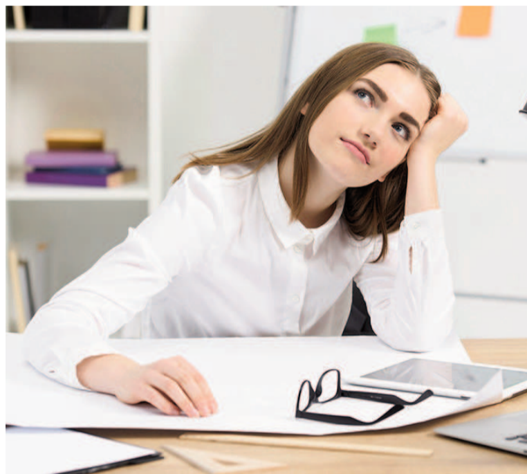
La ensoñación consciente potencia la creatividad y el bienestar mental, según estudios recientes.

No todas las formas de soñar despierto aportan los mismos beneficios. Existe una distinción clara entre ensoñaciones productivas e improductivas. Las primeras impulsan la búsqueda de soluciones, la generación de ideas y la inspiración. Ejemplos frecuentes incluyen imaginar detalladamente cómo abordar una conversación difícil, visualizar el logro de una meta personal o analizar creativamente distintas posibilidades