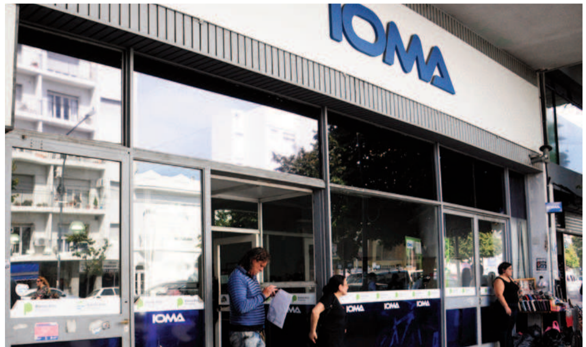
Presentan proyecto que elimina la excepción que permite a legisladores y jueces no afiliarse a IOMA.

Rozas ya había solicitado que los legisladores sean parte del directorio del IOMA y así poder controlar de manera plural a la obra social de los estatales bonaerenses. Lo pedido por el proyecto del legislador oriundo