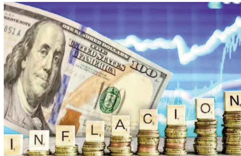
La inflación de agosto fue del 2,1%, según el REM.

Además, la estimación para el crecimiento del PBI de 2025 se recortó desde el 5% hasta el 4,4%. Esto es resultado del ya evidente impacto del «apretón monetario» sobre la actividad económica, por vía de la