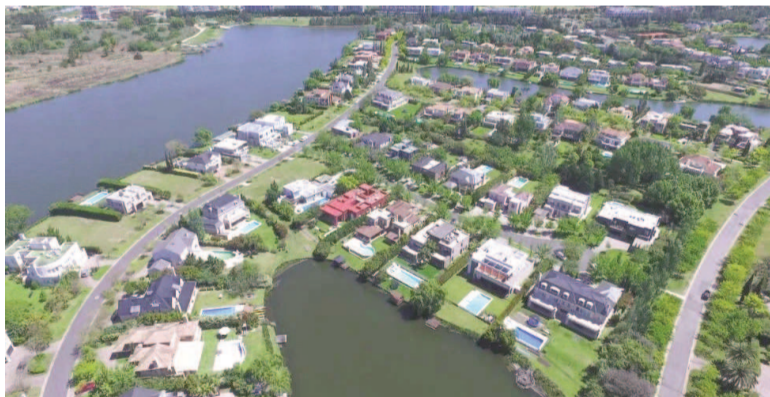
Retiran subsidios a usuarios de barrios cerrados y countries.

El Gobierno nacional informó que, durante el mes de agosto, se identificaron y excluyeron del régimen de subsidios energéticos a 3.578 usuarios de alto poder adquisitivo residentes en barrios cerrados y countries del AMBA Norte y el barrio Puerto Madero.