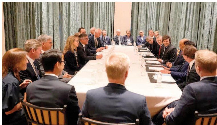
Milei se encontró con inversores y banqueros en Los Ángeles.

A diferencia de sus 11 viajes anteriores a los Estados Unidos, Milei llegó a la Costa Oeste en un esce-