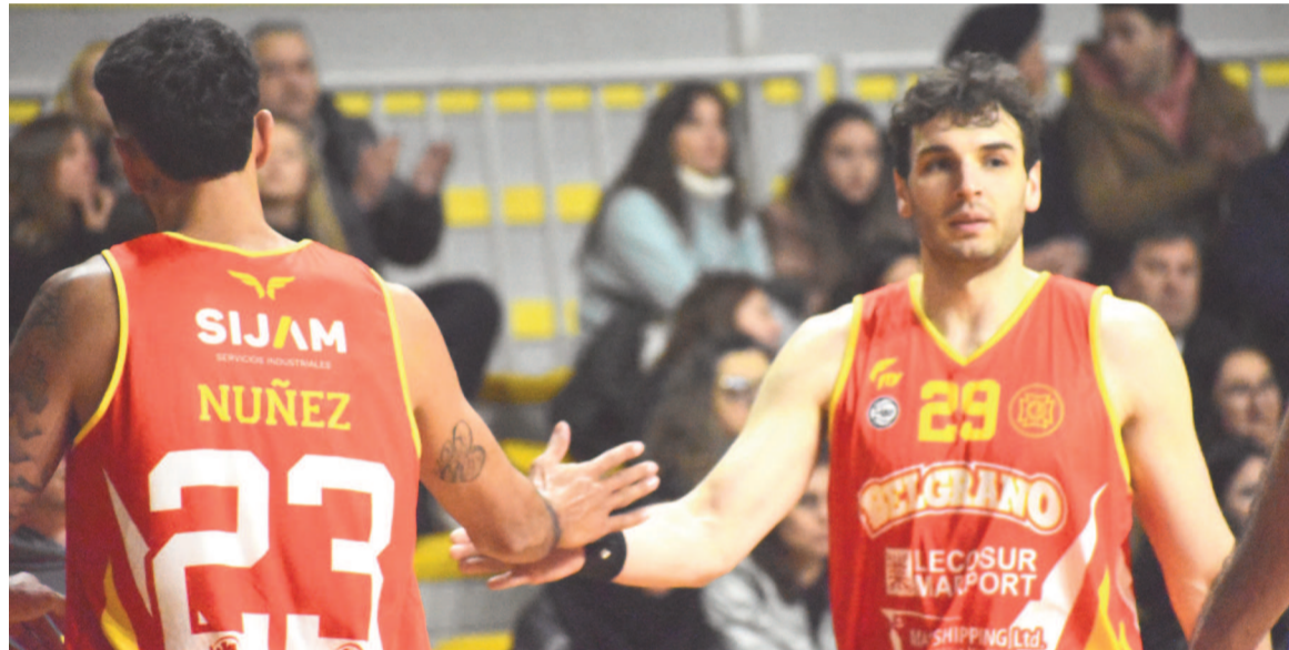
Belgrano ganó ante Náutico de local y Colón en Chivilcoy.

Por la cuarta fecha del Grupo B, hoy actuarán dos de los ocho representantes de la ABSN en el torneo. Desde las 21.00 el Rojo jugará de local ante Juventud de Pergamino, mientras que los somiseros lo harán en el mismo horario en San Pedro, en donde visitarán a Náutico.