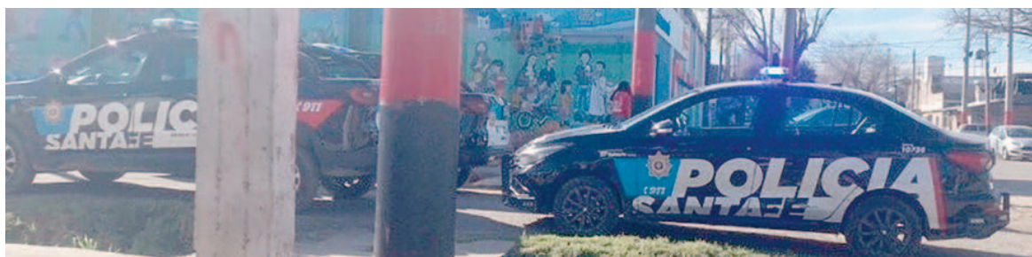
Un hombre fue baleado en un barrio de la zona sur de Rosario.

Los testigos del barrio señalaron que los posibles autores serían dos hombres que se desplazaban en una motocicleta Honda Wave de color blanco, ambos con casco.