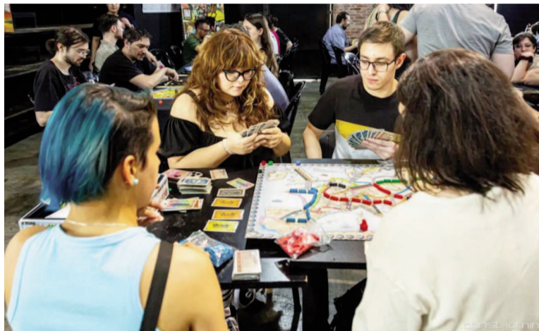
El fin de semana, el Galpón 11 y el CEC recibirán la edición 2025 de Cultura en Juego.

El 6 y 7 de septiembre, el Galpón 11 y el CEC recibirán la edición 2025 de Cultura en Juego. Con entrada libre, habrá más de 200 títulos, torneos de cartas, rol, escape rooms, clásicos como ajedrez y propuestas innovadoras.