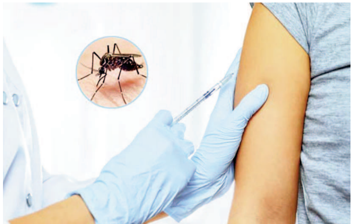
La única forma de inscribirse para recibir la dosis contra el dengue es a través de la página oficial Mi Salud Digital. ILUSTRACIÓN

Cabe recordar que la inmunización contra el dengue, en el marco de la campaña sanitaria bonaerense, es gratuita y contempla la aplicación