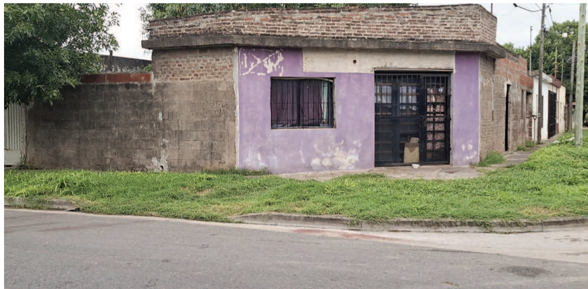
El homicidio se produjo durante la madrugada del miércoles 12 de marzo de este año en una vivienda de la zona norte.