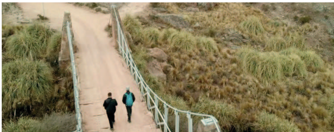
El Senado aprobó el proyecto que declara Patrimonio Inmaterial al Camino de Brochero.

La iniciativa busca preservar el valor cultural, religioso, turístico y social de este recorrido de 240 kilómetros que une Villa Santa Rosa de Río Primero, Córdoba capital y Villa Cura Brochero, tres ciudades vinculadas a la vida y obra del "Cura Brochero", canonizado en 2016. El proyecto también declara de interés nacional el Memorandum de Entendimiento firmado en 2023 entre la Xunta de Galicia y el exgobernador cordobés Juan