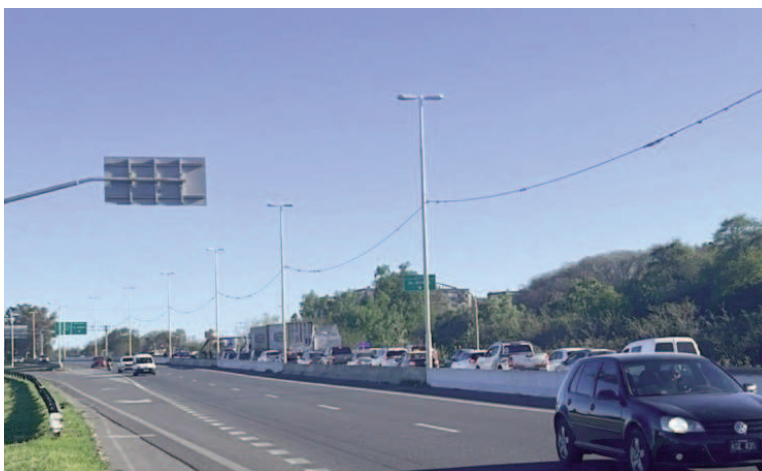
Uno de los siniestros viales ocurrió en Circunvalación a la altura de Ayolas.

Inicialmente, se evaluó su traslado en helicóptero sanitario, pero