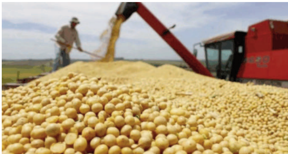
ARCA informó que se alcanzó la registración del cupo de US$ 7000 millones.

cultura, las DJVE por producto -hasta primeras horas del miércoles- se distribuían de la siguiente manera: 4.720.086 de toneladas en subproductos de soja; 2.698.740 en soja; 905.110 en aceite de soja; 1.777.100 en trigo pan; 177.981 en aceite de girasol; 952.500 en maíz; 195.300 en cebada forrajera; 21.300 en sorgo; 17.500 en subproductos de girasol y 512 toneladas de harina de trigo. Por lo pronto, no se han dado a conocer los números finales del volumen registrado,