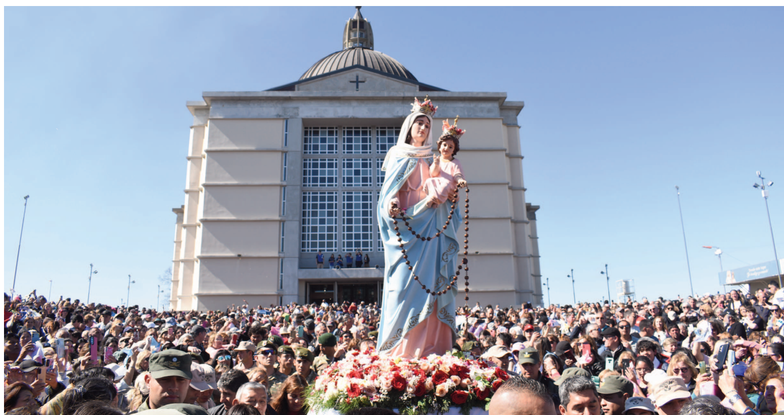
El momento del inicio de la procesión por las inmediaciones del Santuario, ayer por la tarde, previo a la misa central en el 'Campito'.

La homilía central tuvo como eje referencias al papa León XIV, quien