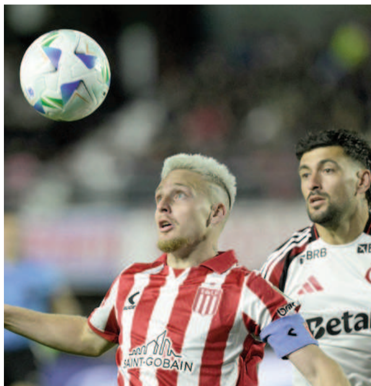
El conjunto carioca festejó en La Plata y se medirá ante Racing en semis.