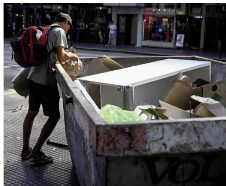
Familias atraviesan situaciones de vulnerabilidad en distintos barrios urbanos.

La publicación difundida este jueves también detalla la evolución reciente sobre la indigencia y otros indicadores sociales, permitiendo comparar el desempeño actual frente a los trimestres anteriores, así como analizar los factores que inciden en la dinámica social del país.