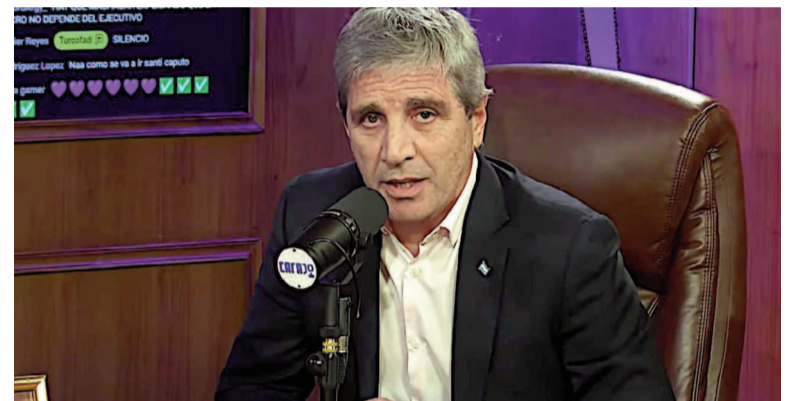
Ministro de Economía Luis Caputo.

Caputo planteó que la coyuntura actual combina un frente político con-