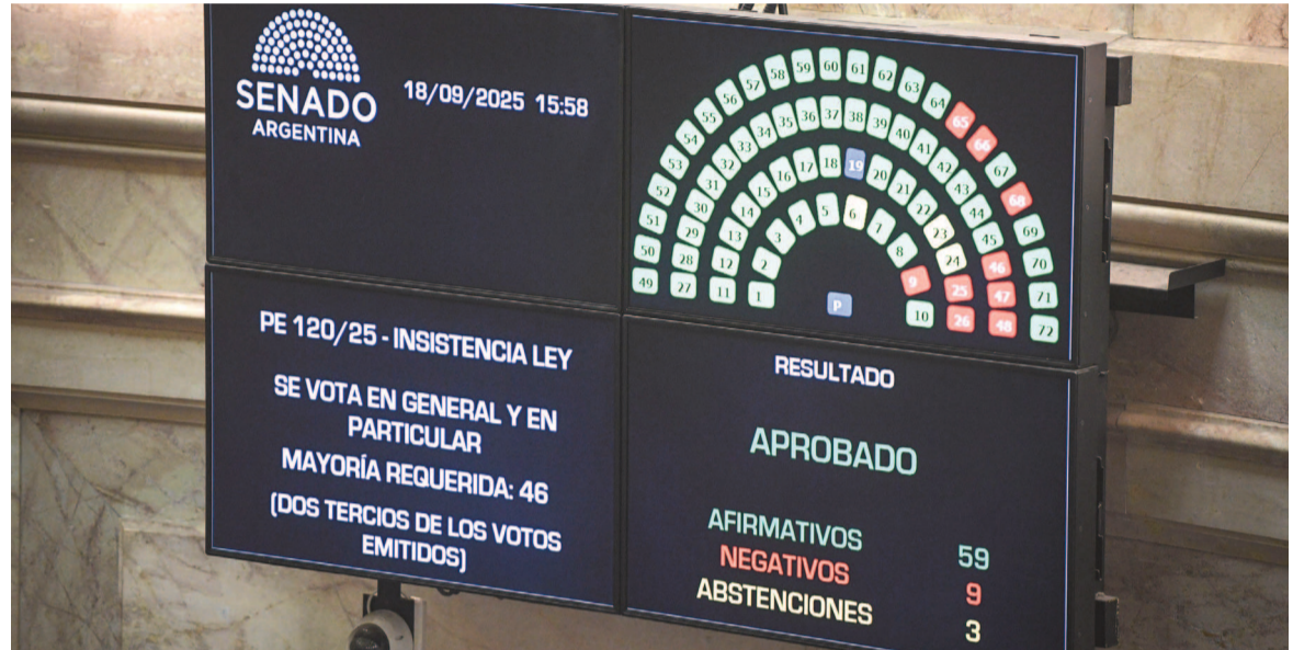
El Senado rechazó el veto de Javier Milei al reparto automático de los ATN.

Por otra parte, el jujefeño de La Libertad Avanza (LLA), Ezequiel Atauche defendió el veto ironizando: “Si hay una emergencia,