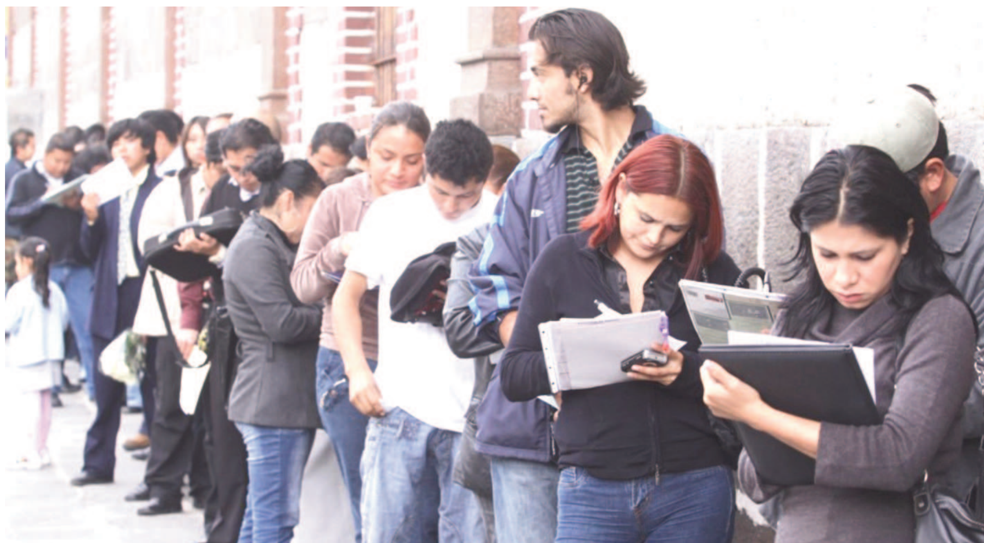
San Nicolás-Villa Constitución es uno de los 31 aglomerados urbanos de todo el país que el Indec releva a través de su Encuesta Permanente de Hogares.

El Instituto Nacional de Estadística y Censos difundió este jueves su reporte de Mercado de Trabajo correspondiente al segundo trimestre de este año. A nivel nacional, la desocupación alcanzó el 7,6%, mientras que para el aglomerado urbano que integran San Nicolás y Villa Constitución el indicador se ubicó en 9,3%: casi un punto por encima del primer trimestre y casi tres arriba en la comparativa interanual.