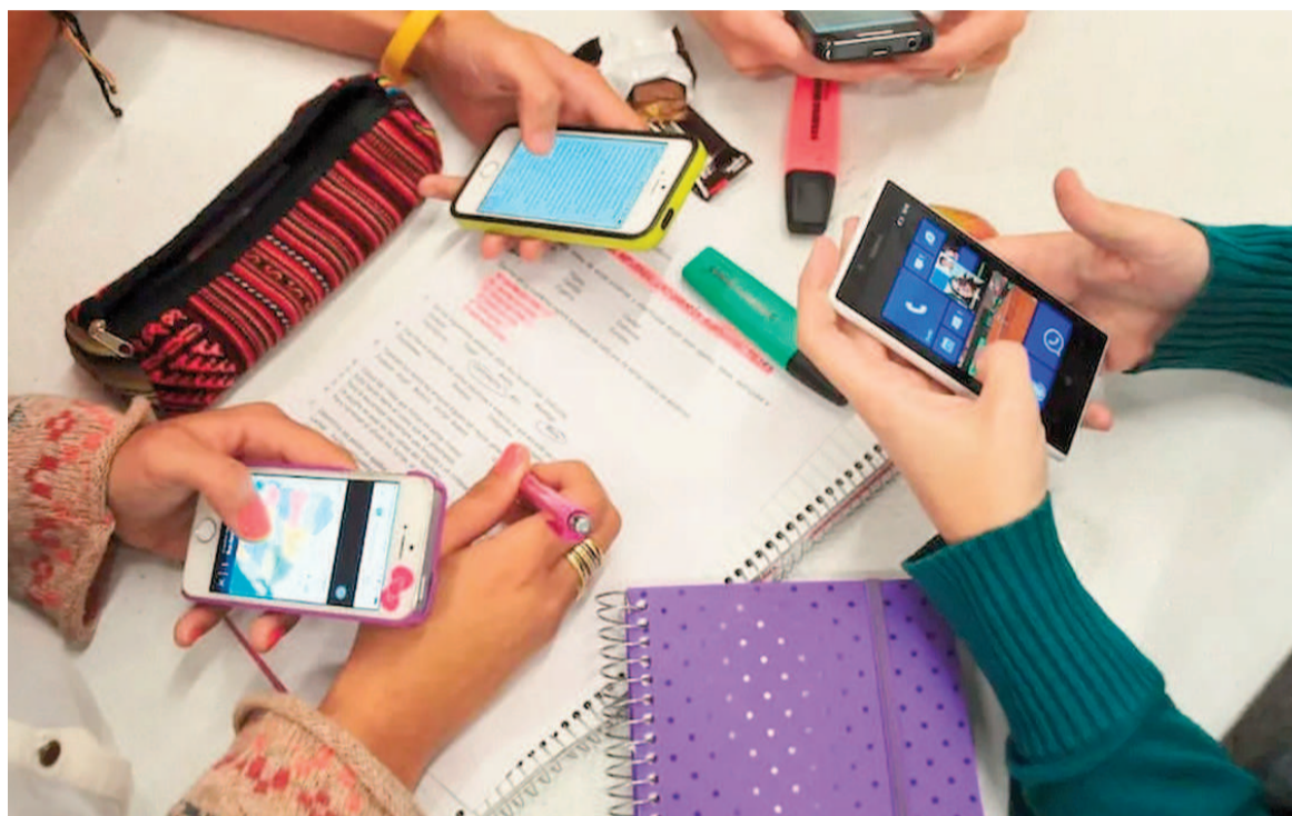
Los alumnos de las primarias bonaerenses no podrán usar el celular mientras estén en la escuela, a menos que los docentes lo indiquen.

advierte que la exposición temprana y prolongada a medios electrónicos se asocia a un mayor riesgo de síntomas psicofísicos, en especial con cuestiones relacionadas al aisla-