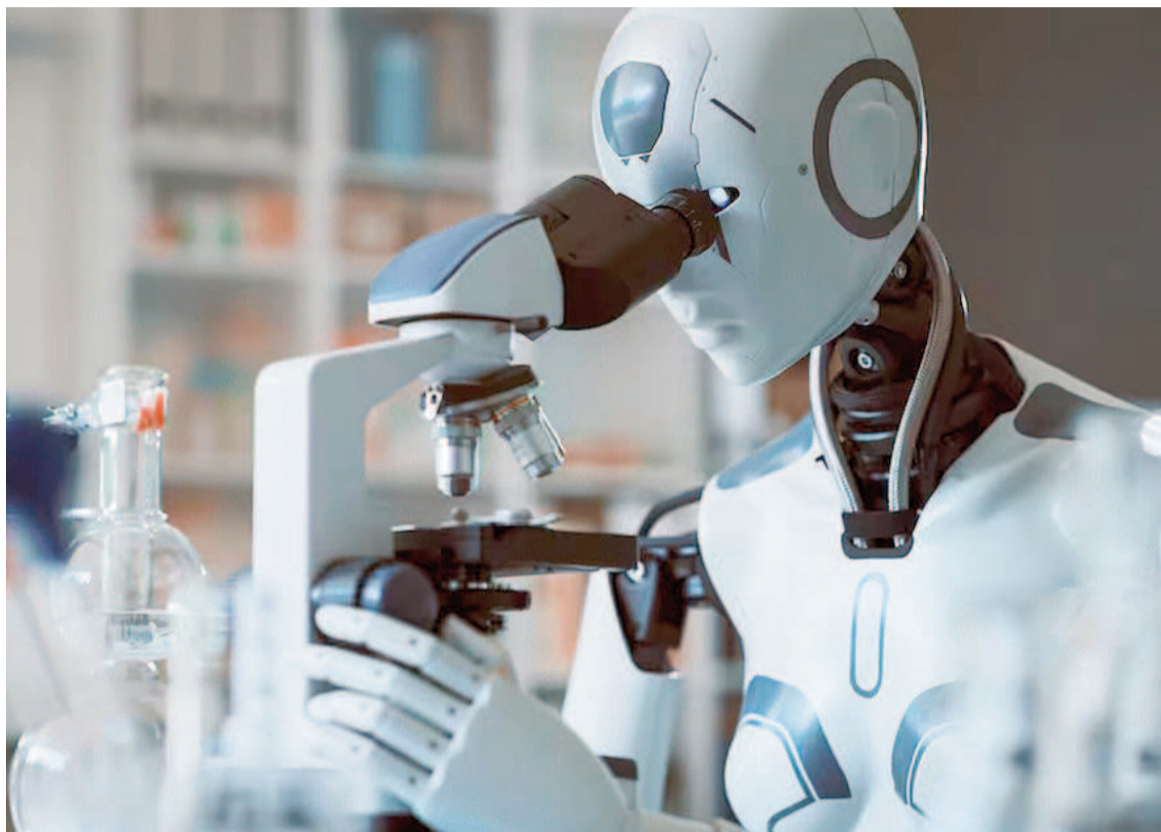
La IA Delphi-2M «predice la prevalencia de más de 1000 enfermedades» con años de antelación.

En el futuro, modelos como este podrían ayudar a "orientar el seguimiento y, posiblemente, conducir a