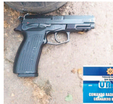
El arma que descartó el adolescente.

Poco después, una comunicación alertó de que el autor de los disparos