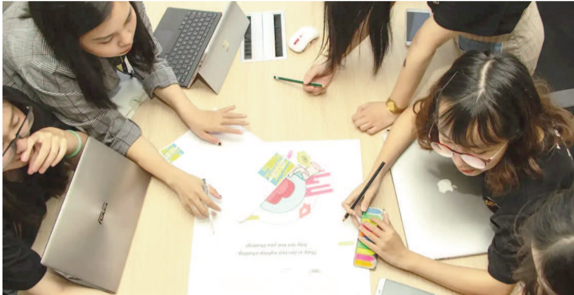
La mentalidad de crecimiento es fundamental para el desarrollo académico de los estudiantes.

Esta actitud, según el análisis que se publicó en The Conversation , revela creencias erróneas sobre el aprendizaje que influyen en la forma en que los estudiantes abordan las clases y, en consecuencia, en lo que logran aprender. El artículo destaca la importancia de la llamada mentalidad de crecimiento, un concepto ampliamente valorado en el ámbito educativo. Los estudiantes con mentalidad de crecimiento creen que pueden mejorar y seguir aprendiendo, mientras que quienes adoptan una “mentalidad fija” tienden a pensar