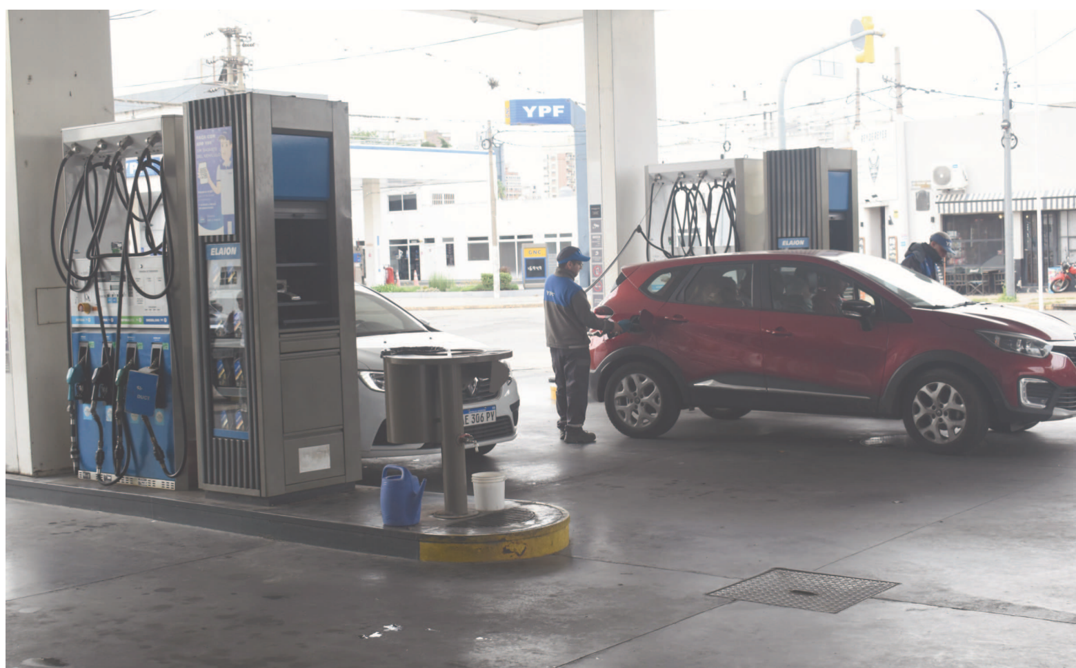
En ocho semanas de modalidad de micropricing , la nafta Súper XXI de YPF acumuló una suba del 5,53% en los surtidores de San Nicolás. EL NORTE

Para garantizar el cumplimiento, se prevé un régimen de sanciones económicas. Las petroleras que incumplan con la nueva norma –en caso de ser aprobada y convertida efectivamente en ley– podrán recibir multas equivalentes al precio de entre 5000 y 150.000 litros de nafta súper, además de la suspensión de la habilitación en casos de reincidencia. Las estaciones de servicio, por su parte, enfrentarían penalizaciones de entre 100 y 500 litros de