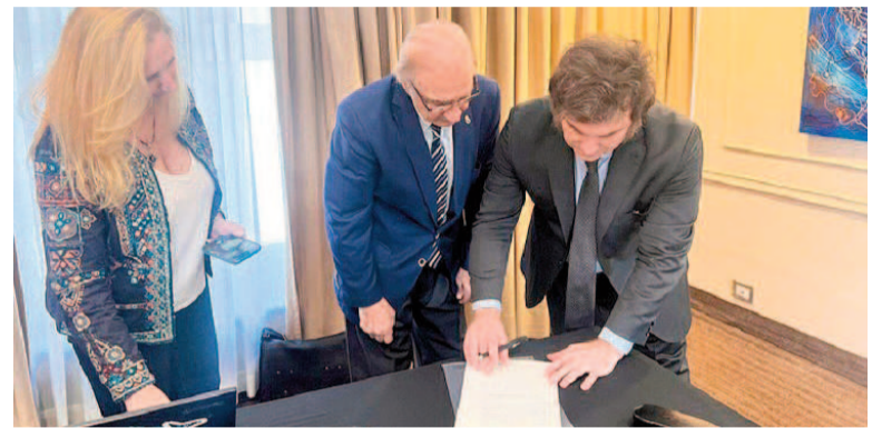
El Presidente vetó la ley de emergencia pediátrica.

tículo 84 de la Constitución Nacional, que habilita al presidente a rechazar una ley si considera que es contraria a los intereses del país o que generan un desequilibrio económico.