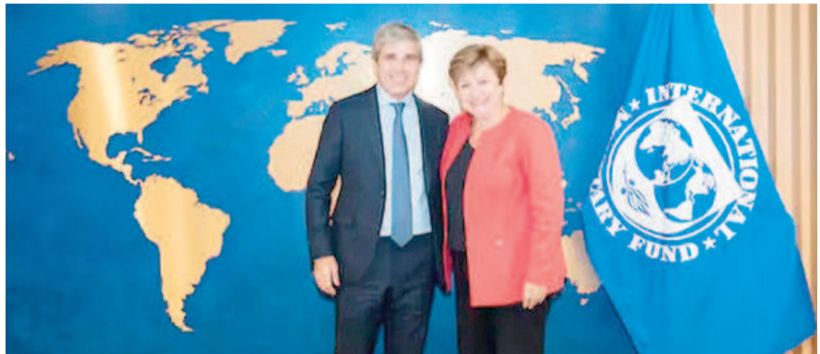
Caputo con Kristalina Georgieva, la titular del FMI.

Sin embargo, Kozack reiteró una preocupación del organismo, las altas tasas de interés que Caputo viene implementándole para evitar una fuga hacia el dólar: "Como se destaca en el informe del Staff, para la primera revisión del programa, las mejoras en el marco de gestión monetaria y de liquidez deberían continuar mitigando la volatilidad de las tasas de interés y los efectos negativos asociados en la actividad económica". Dos semanas atrás, el elenco de Ca-