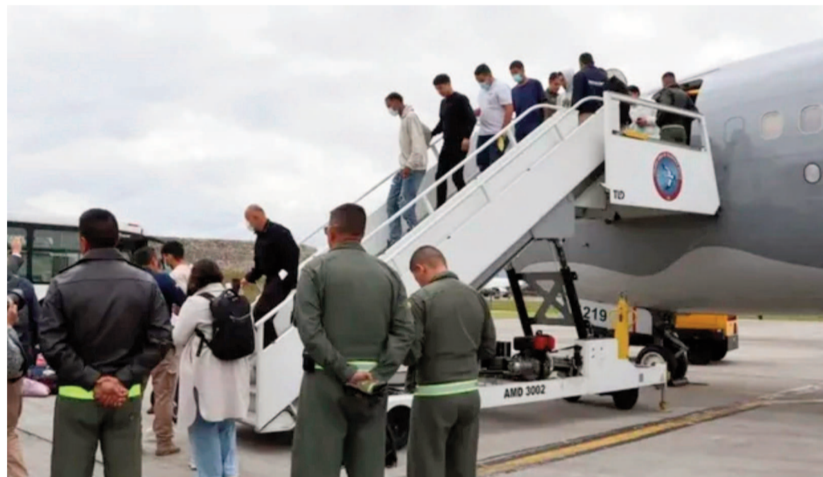
Los ciudadanos fueron expulsados por las autoridades migratorias estadounidenses.

El avión de Omni Air International aterrizó pasadas las tres de la madrugada del jueves y los pasajeros ingresaron por la terminal privada.