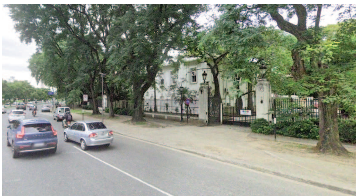
Telefe Rosario, otra vez escenario de intimidaciones entre bandas narcos.

El hecho ocurre un día después del ataque con bombas molotov a una cancha de fútbol 5 de zona sudoeste, que también parecía ser un mensaje mafioso. Y a varios meses de la seguidilla de banderas colgadas en distintos puntos de la ciudad con los nombres de referentes del narcotráfico local, conocidos por las crónicas policiales.