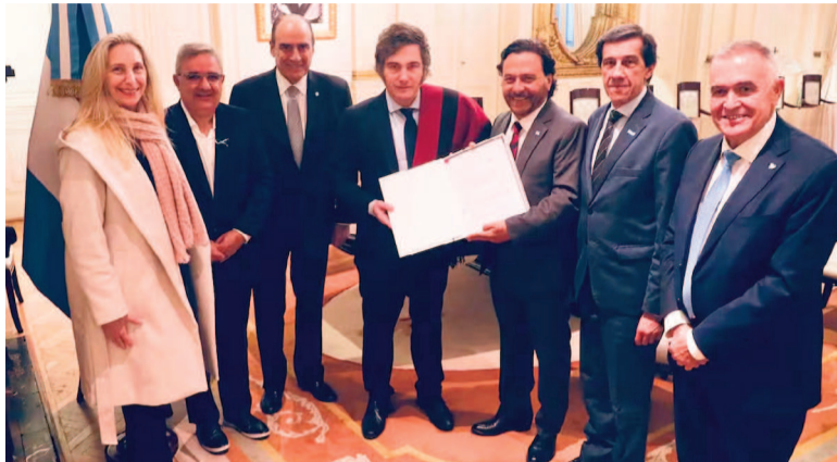
Cayó el reparto a las provincias.

Javier Milei vetó la ley que repartía de manera automática los ATN (Aportes del Tesoro Nacional) entre las provincias. El Ejecutivo ya se lo comunicó al Senado, la Cámara de origen del proyecto.