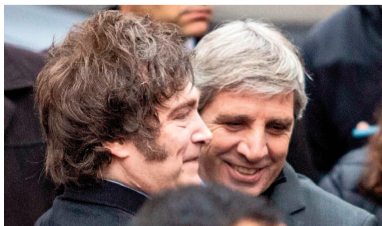
El Gobierno busca cederles dos empresas públicas a las provincias en medio de las tensiones.

YCRT fue creada en 1958 con el objetivo de explotar la cuenca carbonífera de Santa Cruz y abastecer de combustible sólido al mercado interno. Su función central es la extracción de carbón mineral y el abastecimiento de la usina termoeléctrica emplazada en la misma localidad. Nación cuenta con el 95% de las acciones a través de la Secretaría de Energía, mientras el 5% restante quedó en manos de la Secretaría de Minería. Según el último informe fiscal del Ministerio de Economía, la empresa cuenta con un déficit operativo de $6.503 millones. Tiene ingresos por $24.040 millones -que son transferencias corrientes-, pero los gastos corrientes abarcan $30.543 millones: deriva $23.987 millones en remuneraciones, $726 millones en bienes y servicios y $5800 millones en