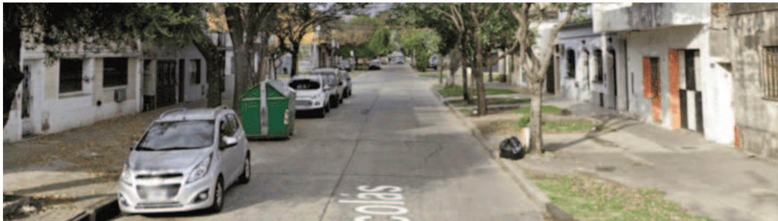
San Nicolás al 2300, la cuadra donde se produjeron las balaceras.

El primero de los ataques a ese domicilio tuvo lugar en la madru-