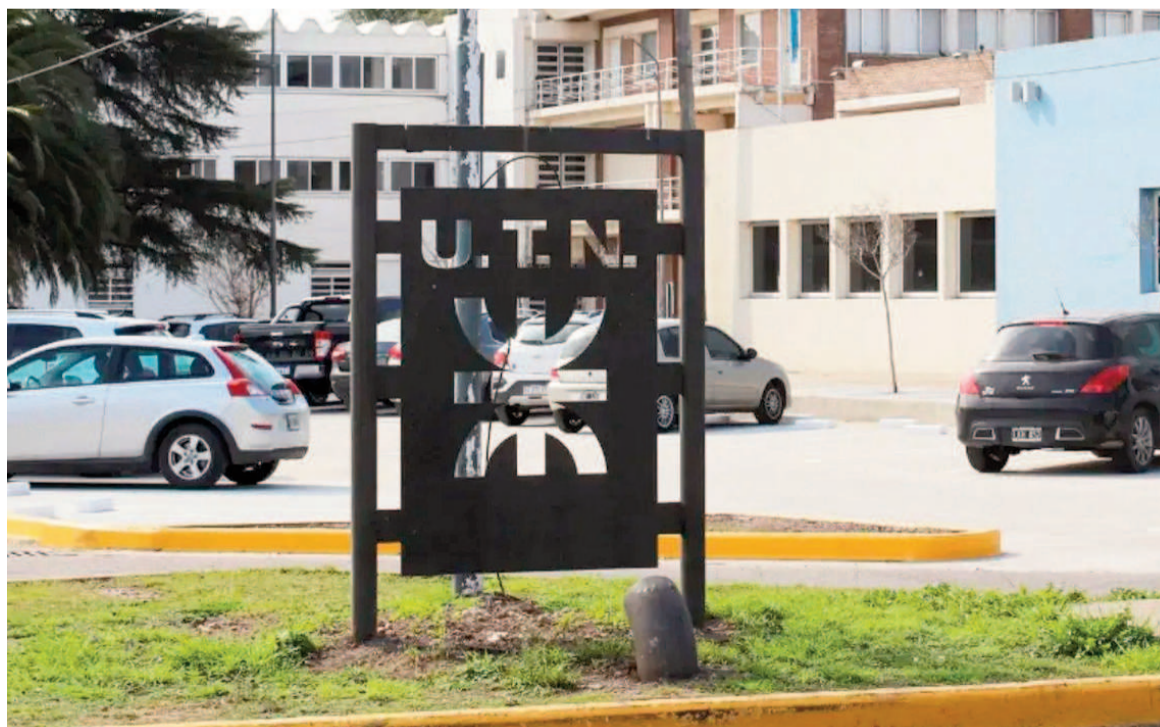
Facultad Regional San Nicolás, de la Universidad Tecnológica Nacional, adhiere al paro.