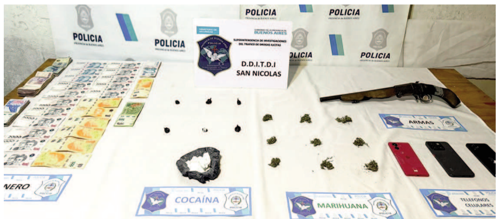
La Fiscalía avaló lo actuado por el personal policial, ordenó el secuestro de la totalidad de los objetos incautados y la aprehensión del principal investigado.

Las tareas de inteligencia incluyeron averiguaciones de manera encubierta, vigilancias alternadas, seguimientos, análisis de diversas conversaciones de WhatsApp, es-