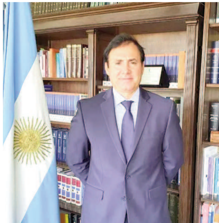
El juez Alejandro Maraniello.

gistrado de mal desempeño y posible comisión de delitos en el ejercicio de sus funciones por haber dispuesto la medida cautelar que para la oposición, juristas y colegios de abogados supone una flagrante violación de un derecho humano como es la libertad de expresión, en el marco del escándalo de presunta corrupción por cobro de coimas en la Agencia Nacional de Discapacidad (ANDIS).