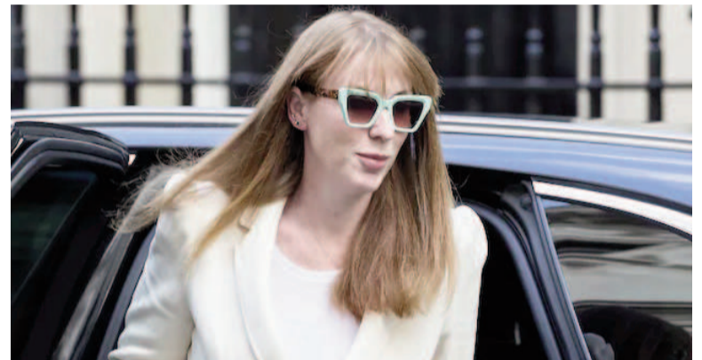
Angela Rayner a su llegada a una reunión de gabinete en Downing Street, Londres, el 2 de septiembre de 2025.

De acuerdo con lo indicado por la prensa británica, el hecho de que Rayner no hubiera buscado la manera de obtener la adecuada asesoría legal para realizar la compra de esta segunda vivienda dentro del orden regular de pago de impuestos correspondientes representa una falta que la lleva a apartarse de sus cargos