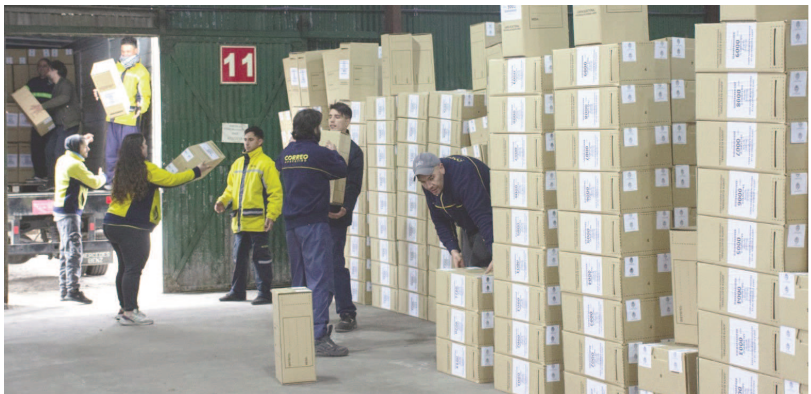
En San Nicolás, el operativo supondrá la distribución de las 380 urnas en los 64 edificios escolares que serán centros de votación este domingo.

lectivos de la empresa EVHSA, que pondrá a disposición del operativo 8 unidades hoy para la fase de despliegue y 14 mañana para un despliegue de personal temprano en la mañana y para el posterior repliegue de todo el material de vuelta hacia el Correo Argentino. La empresa de transporte también pone personal propio a disposición del operativo.