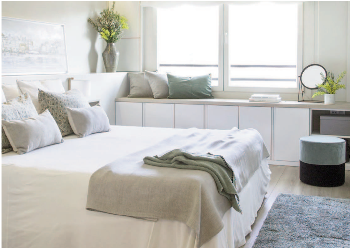
La distribución del dormitorio influye en la calidad del sueño y el bienestar diario.

La falta de espacio para guardar ropa y objetos personales representa otro desafío recurrente. Si los cajones y armarios resultan insuficientes, la ropa suele acumularse sobre sillas