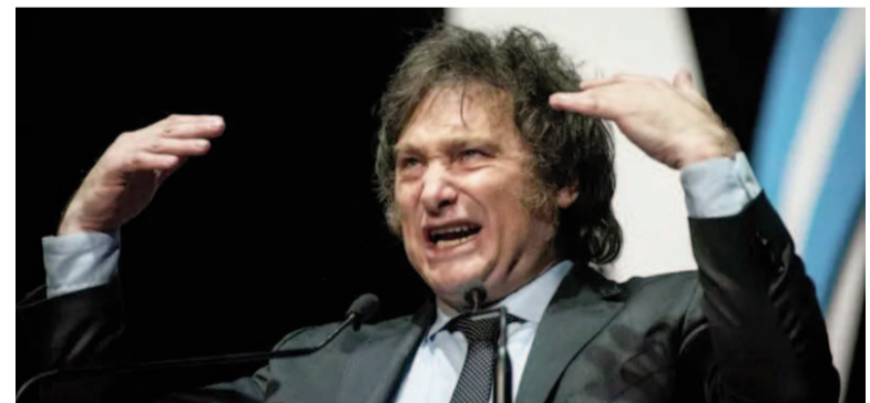
El presidente Javier Milei