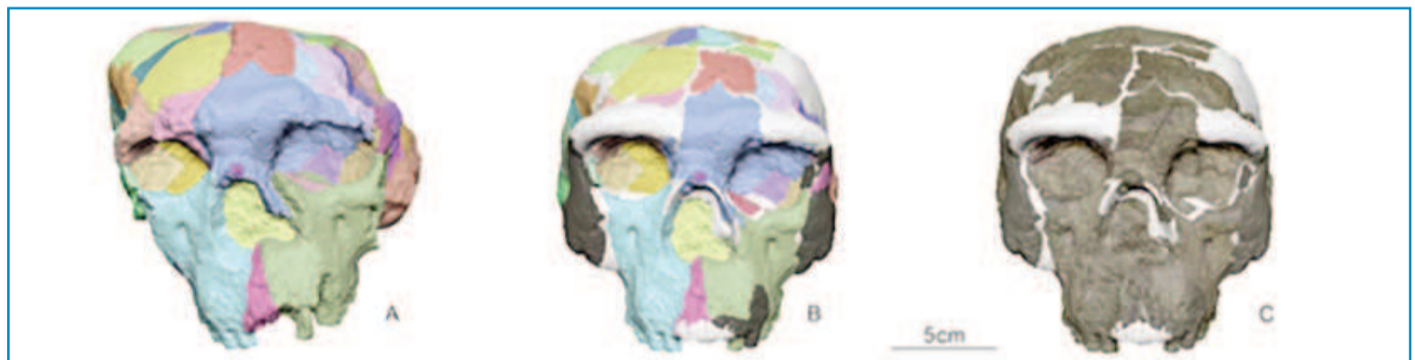
La figura A muestra el cráneo original con áreas deformadas resaltadas en colores. La figura B exhibe el mismo cráneo, corregido digitalmente, con las mismas áreas marcadas. La figura C presenta el cráneo ya reconstruido, señalando en blanco las partes que faltan

También plantea que Asia occidental pudo haber sido una región importante en este proceso de diversificación de