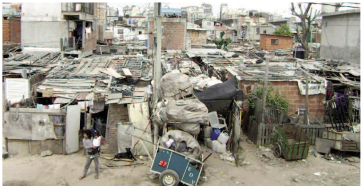
En la actualidad hay 4,48 millones de pobres y 2,29 millones de indigentes menos.

atrás con 183.532 pobres y otras 43.088 personas atraviesan un contexto de indigencia. Completan la nómina la región de Bahía Blanca-Cerri con 75.714 personas pobres y San Nicolás con 69.079.