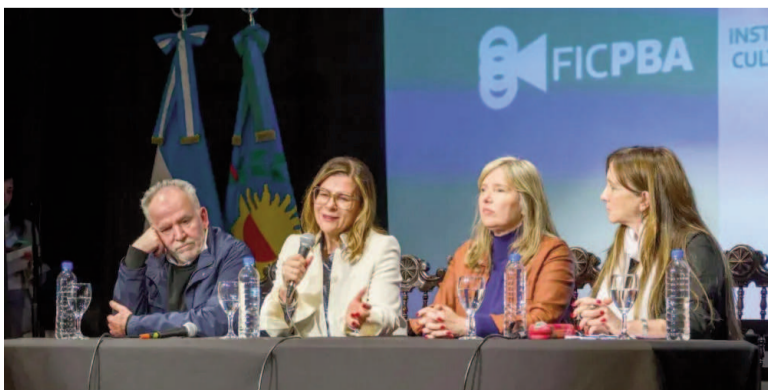
La presentación oficial se realizó en la Casa de la Provincia en CABA.