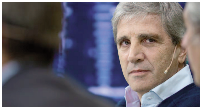
El ministro de Economía, Luis Caputo.

También destacó que los productores cuentan con margen de negociación y libertad para buscar mejores precios en el mercado.