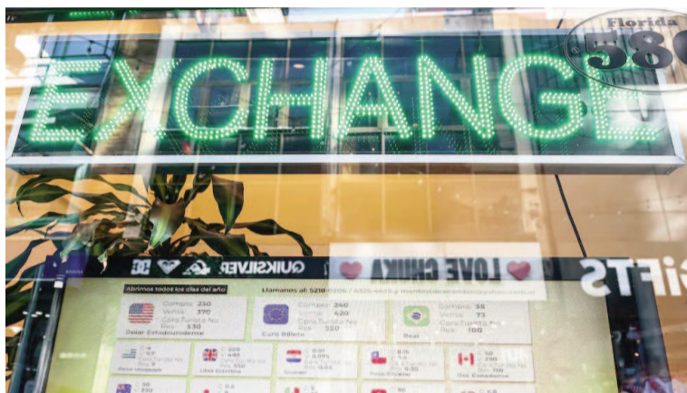
En el mercado esperan que el regreso de la restricción cruzada haga regresar la brecha cambiaria.

Las brechas activaron los “rulos”, operaciones de arbitraje en las que se compra en el mercado donde el dólar está más barato y se vende en el que está más caro. Esto no tiene costos para el Banco Central, salvo que esté vendiendo reservas en el mercado oficial. Algo que pasó apenas por tres días, aunque con montos importantes que superaron los USD1.100 millones antes del anuncio de apoyo del Tesoro de EEUU.