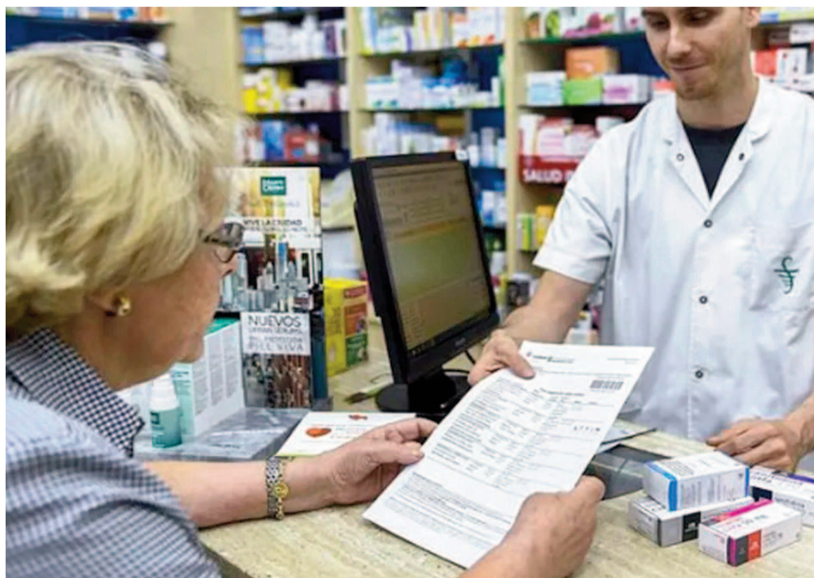
Retrotraen una medida perjudicial para los jubilados.