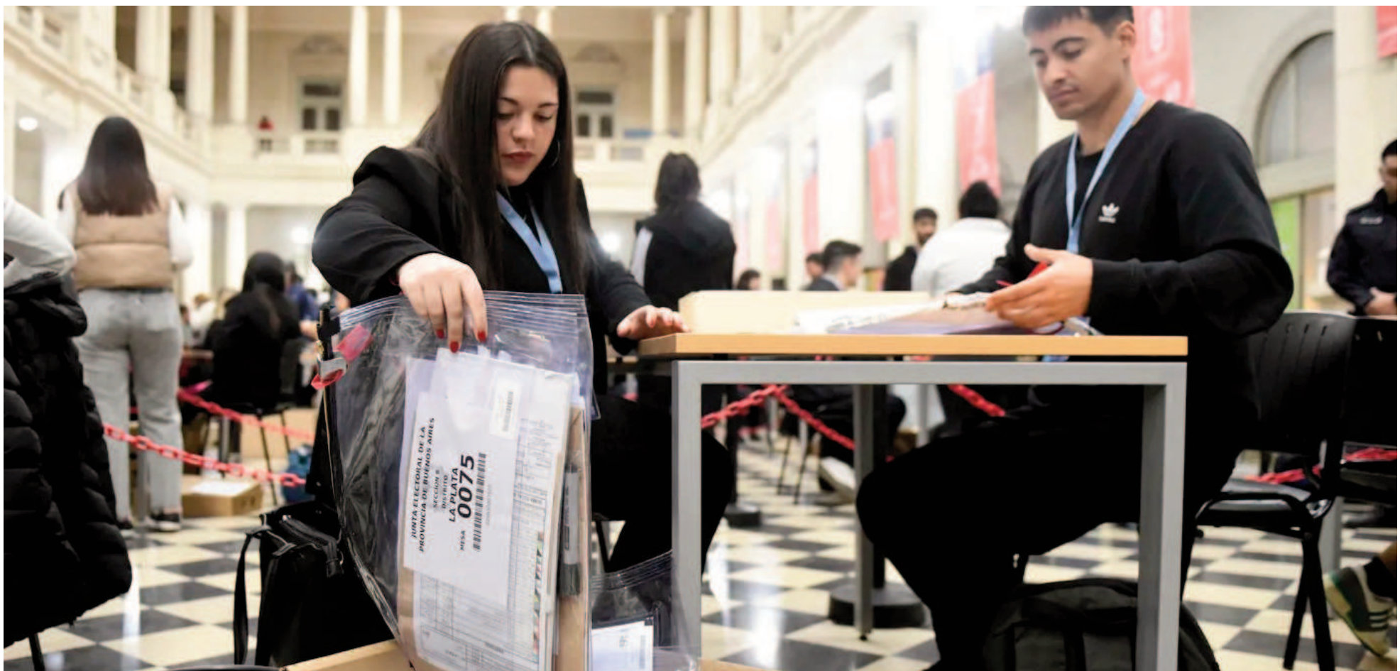
El escrutinio definitivo, a cargo de la Junta Electoral bonaerense, se lleva a cabo en el Pasaje Dardo Rocha de La Plata.