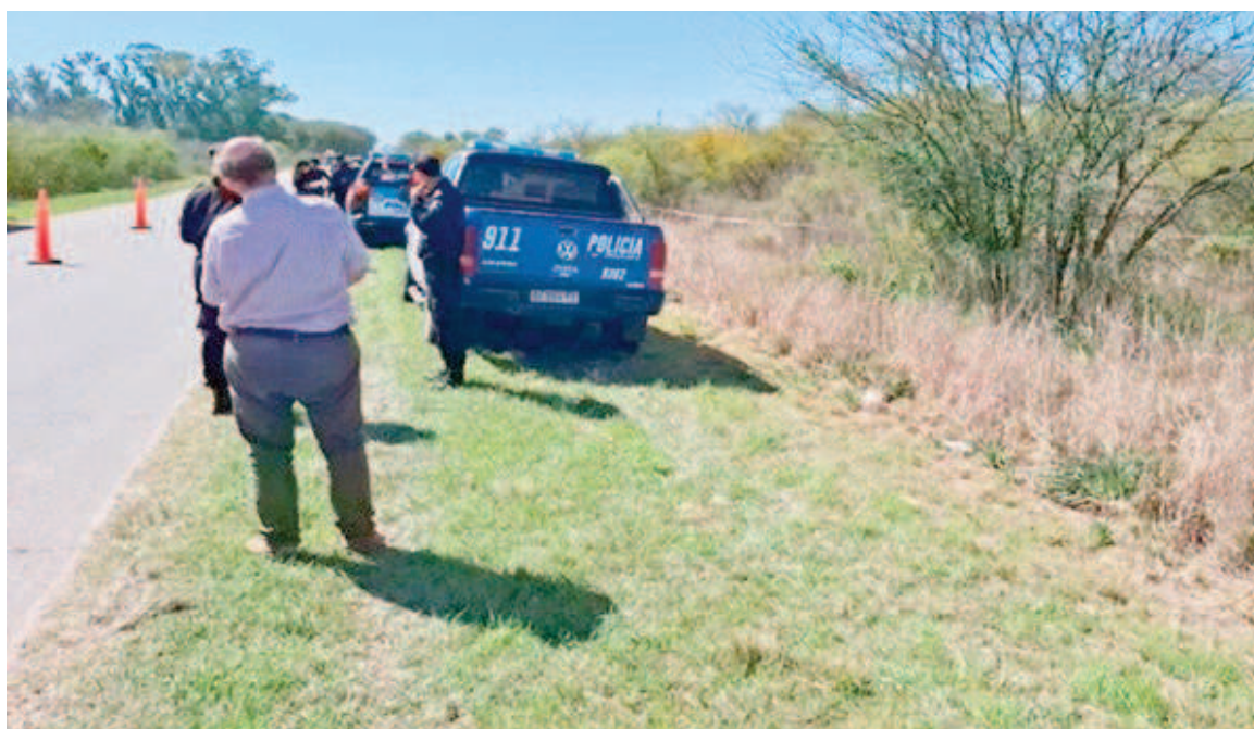
El hallazgo del cuerpo fue en una zona rural entre Monte Vera y Laguna Paiva.