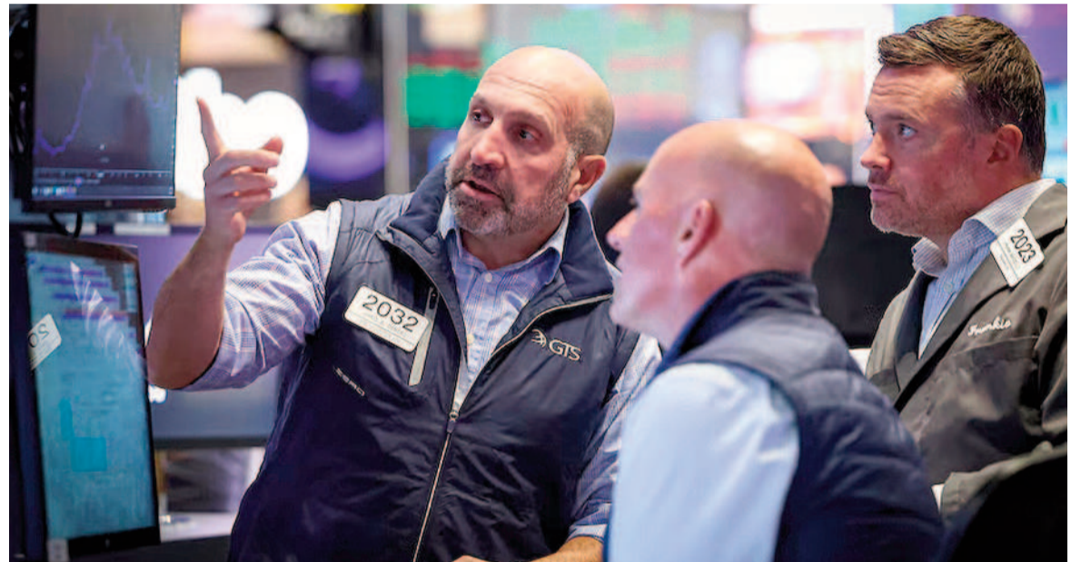
Las señales oficiales sustentaron una mejora de precios para los activos argentinos.

Los bonos en dólares rebotaron 4,5% en promedio. El riesgo país se mantiene alrededor de 1200 puntos básicos. El S&P Merval ganó 2,3%, los ADR escalaron hasta 5% en Wall Street. El dólar subió cinco pesos en el Banco Nación, a $1480.