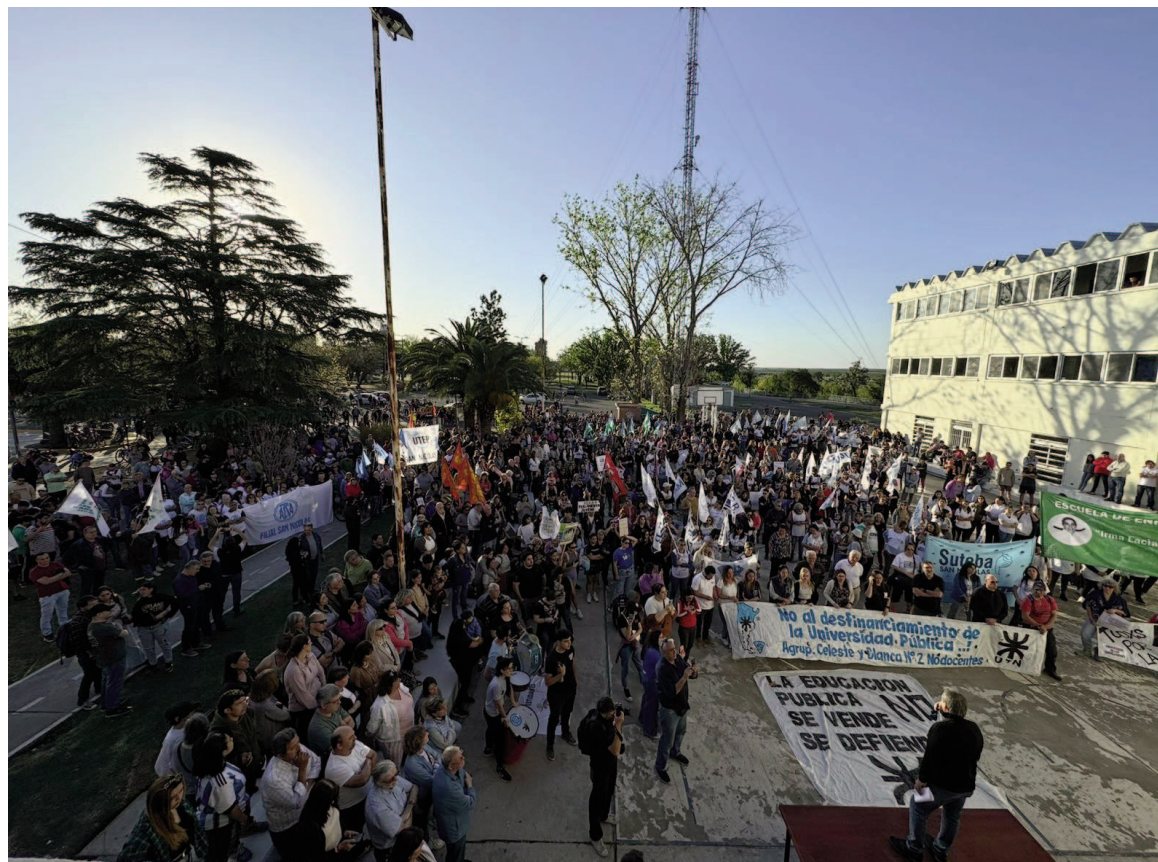
La FRSN UTN también fue escenario –el año de pasado– de otras manifestaciones en defensa de la educación pública y del presupuesto para las universidades.

Por su parte, el sindicato de docentes tecnológicos de nuestra