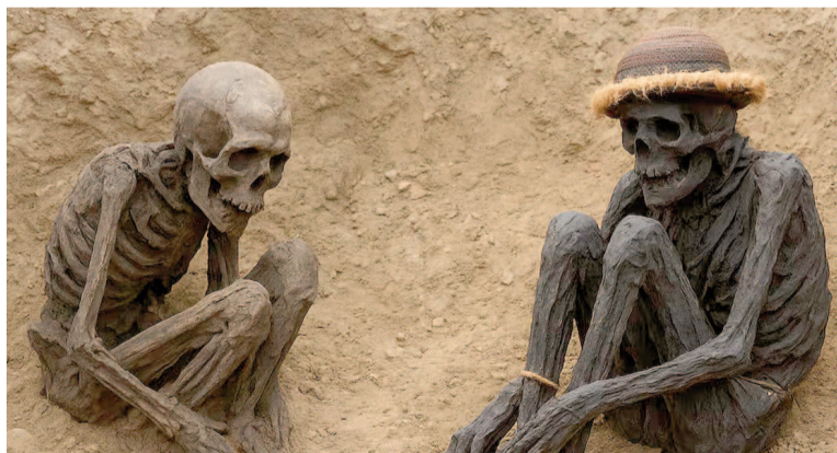
Momias halladas en el sudeste asiático.

Los restos humanos analizados fueron hallados en yacimientos de