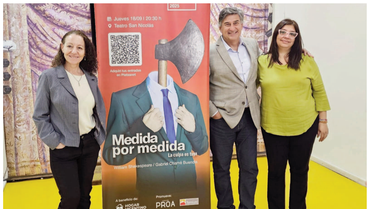
Desde Ternium y Movilizarte invitaron a la comunidad a disfrutar la obra, cuya recaudación será a beneficio del Hogar Vicentino.