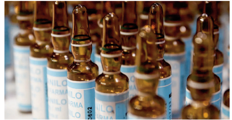
Se define la situación procesal de los imputados.