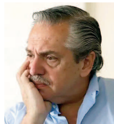
Piden revocar el procesamiento de Alberto Fernández.

El propio Fernández expuso de manera directa en la Cámara Federal. Allí insistió en su planteo de enemistad con Ercolini, con quien, dijo, había tenido en el pasado una