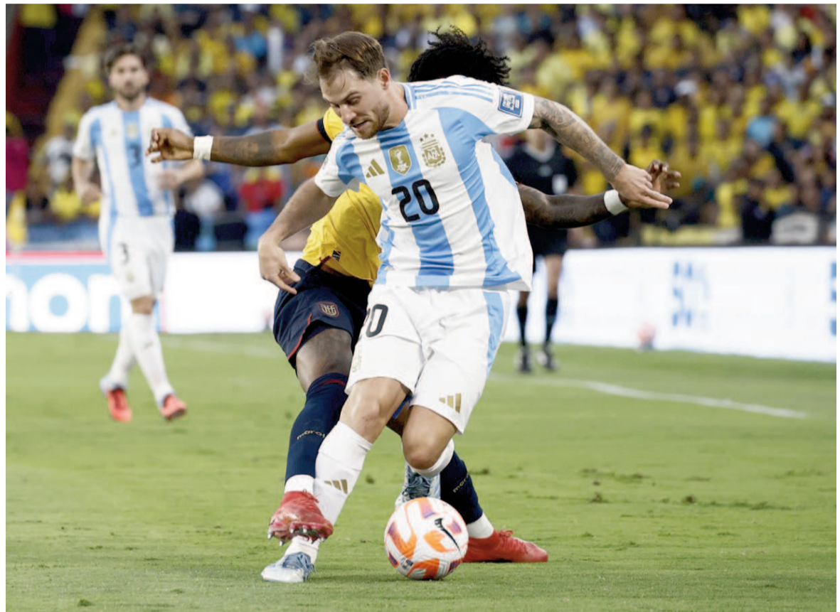
Ecuador cerró las Eliminatorias con un triunfo ante nuestra Selección.

En la segunda etapa, los dirigidos por Lionel Scaloni emparejaron