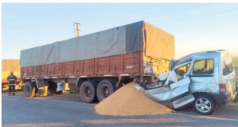
El Camino de la Costa se cobró otra vida.

El tránsito en la zona permaneció obstruido tras el siniestro y trabajan en el lugar efectivos de la Estación de Policía Comunal Ramallo 2. a , junto