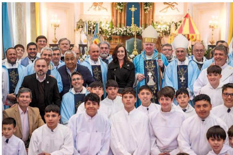
San Pedro cuenta con una Basílica Menor.