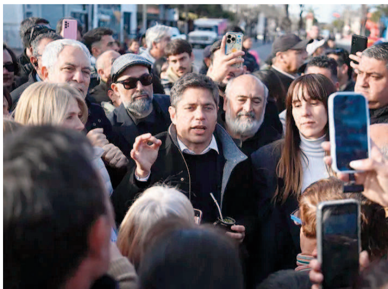
El gobernador Axel Kicillof junto a vecinos de La Plata.

El domingo, en medio de los festejos por el triunfo de Fuerza Patria, el mandatario había pedido a Milei que lo llame, algo que repitió luego en varias entrevistas. Paralelamente, la Rosada activó una mesa de diálogo político con gobernadores y, en ese sentido, se espera que llamen a dialogar a Kicillof. Sin embargo,