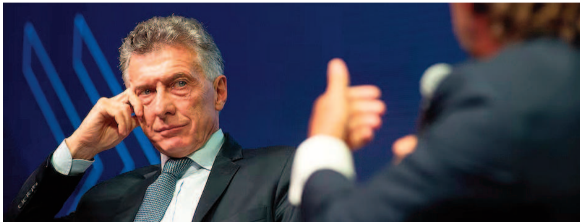
El expresidente Mauricio Macri.

Mientras el Gobierno nacional ensaya una reacción política al revés en los comicios del domingo, con una reorganización de la mesa de conducción, el macrismo comenzó un proceso nuevo para asimilar el golpe de haber perdido parte de la estructura (el PRO resignó cinco bancas entre diputados y senadores provinciales y cayó en distritos donde