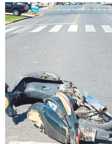
Dos motos colisionaron entre sí.

Producto del impacto, la conductora de 44 años y el menor de 7 años sufrieron lesiones de carácter leve. Ambos fueron asistidos en el lugar