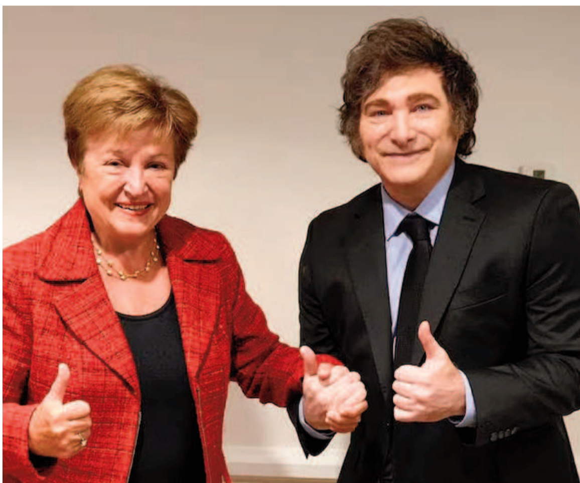
Kristalina Georgieva y Javier Milei en su último encuentro.