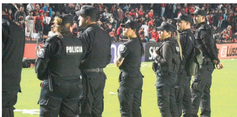
Actualizaron los valores de las horas POLAD.

Esta modificación permite diferenciar las horas trabajadas por efectivos policiales en tareas co-