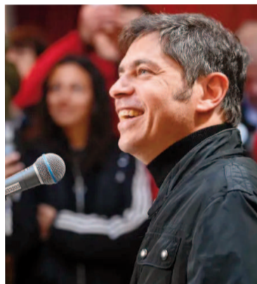
Axel Kicillof, al celebrar el triunfo en las elecciones legislativas.