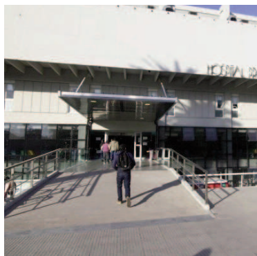
La mujer está internada en el Centenario.

traumatismos, uno de ellos en el cráneo. Declaró al recobrar la consciencia que recuerda haber discutido con su expareja antes de sufrir los golpes.