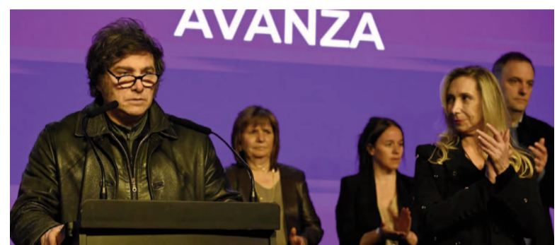
Junto a su hermana, Javier Milei reconoció la derrota de La Libertad Avanza en la provincia de Buenos Aires.