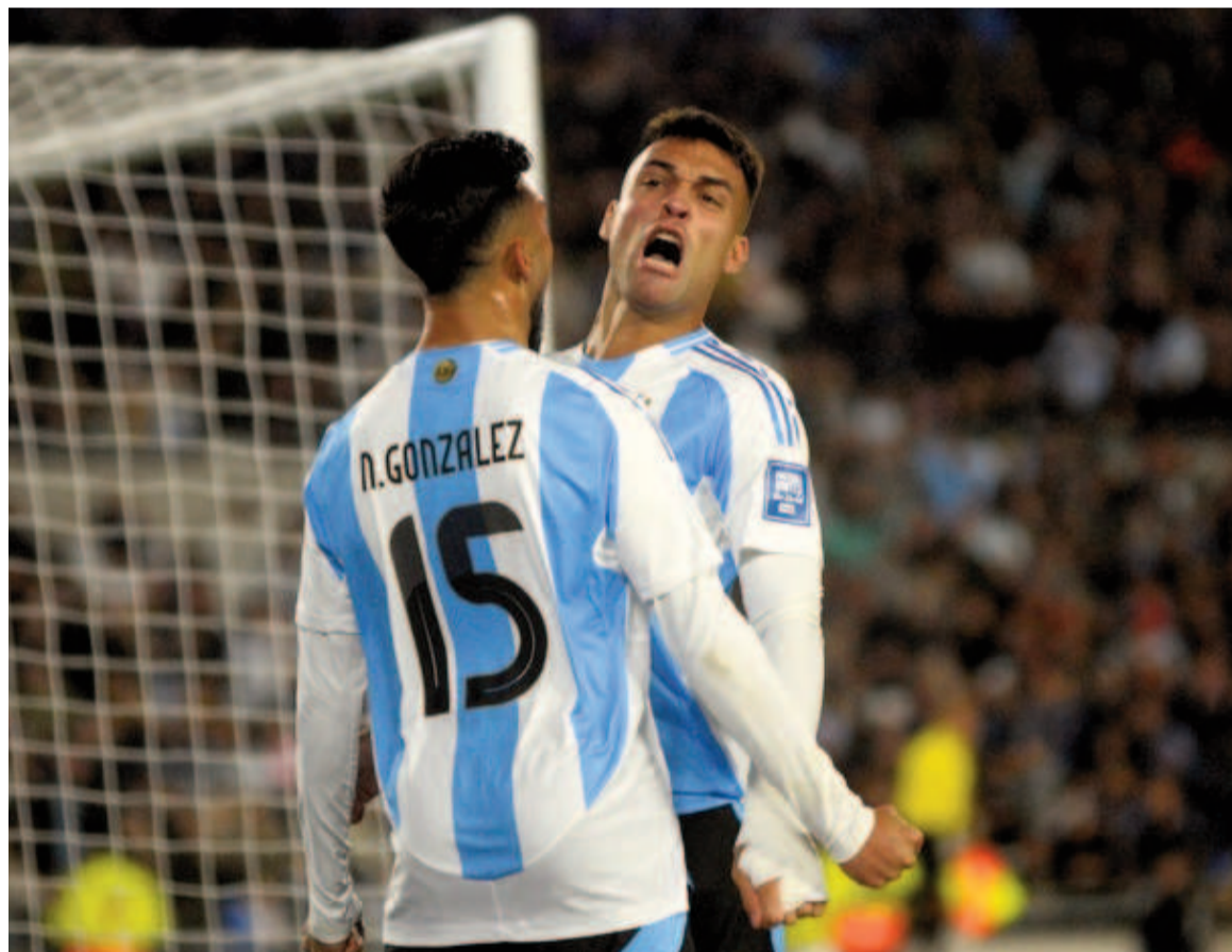
La Selección albiceleste buscará despedirse con una victoria. WEB

Por la última fecha se medirán hoy desde las 20.00 en el Estadio Banco Pichincha de Ecuador, estando ambas selecciones clasificadas. Scaloni haría varios cambios con respecto a la formación que goleó a Venezuela.