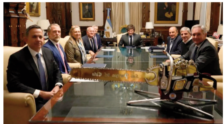
Milei junto al ministro de Economía, Caputo, mantuvo una reunión con Ilan Goldfajn

En el marco de de la Cumbre Regional de Seguridad y Justicia, organizada por el BID junto con el Ministerio de Seguridad Nacional, a cargo de Patricia Bullrich, se informó que el destino de ese monto permitirá "una respuesta más rápida y eficaz a las crisis de seguridad, y una inversión a gran escala en las reformas que nuestra región necesita para un desarrollo sostenible", según señaló Goldfajn.