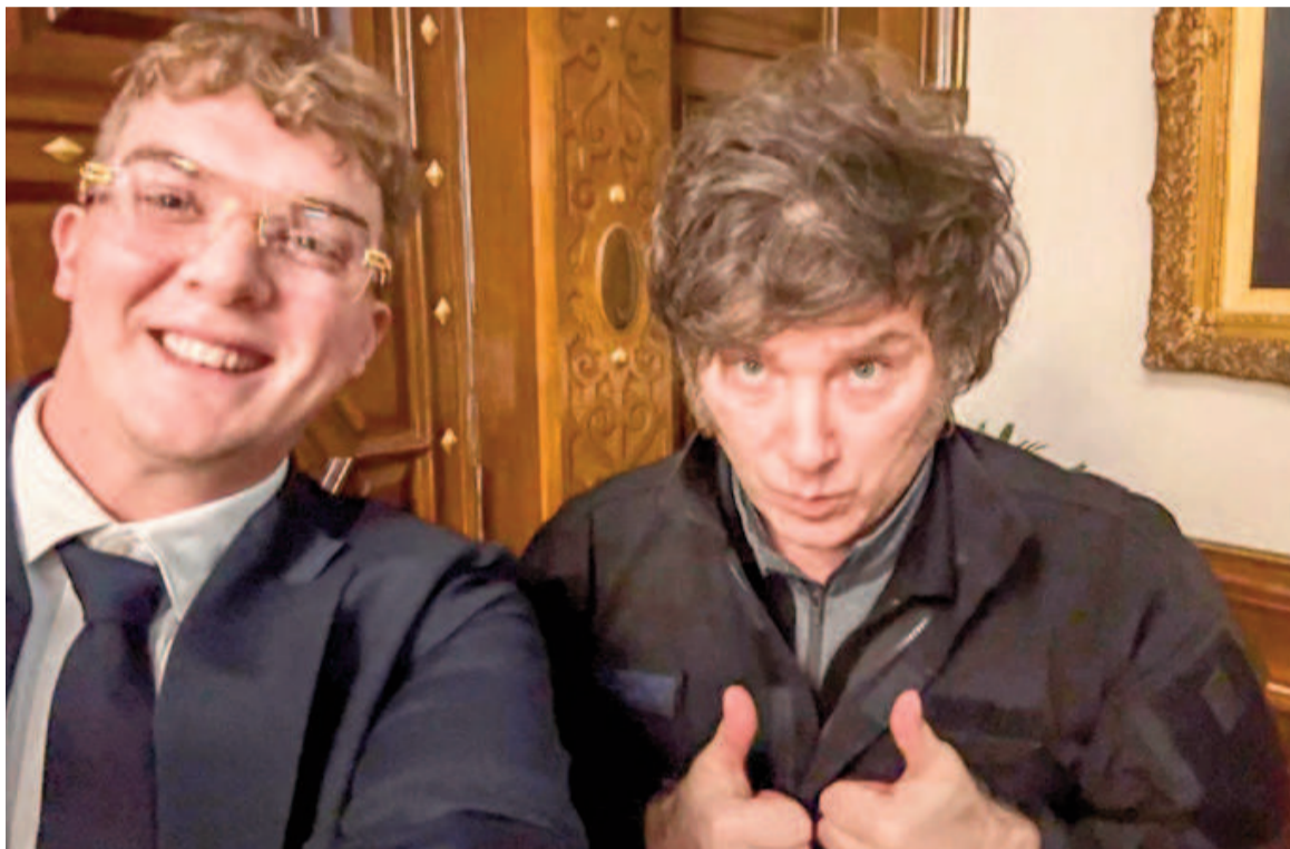
Tras la derrota del gobierno se activó la comisión investigadora de la cripto estafa $Libra.

A través de un tuit, Ferraro buscó "pinchar" a Milei por la debacle electoral del oficialismo y le sugirió que si verdaderamente quiere hacer una autocrítica -tal como se comprometió