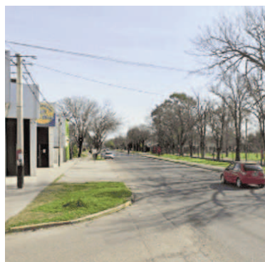
La zona donde se produjo el ataque.

Los médicos informaron que el joven se encuentra estable. La inves-