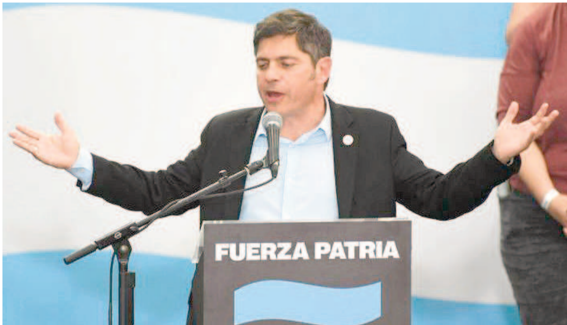
El gobernador Kicillof criticó al presidente Milei.

En ese sentido, Kicillof comparó el discurso presidencial con los resultados reales. "Dijo que la economía iba a subir como pedo de buzo, pero no se ha visto. Cayó como buzo en pedo", sentenció con sorna, dejando