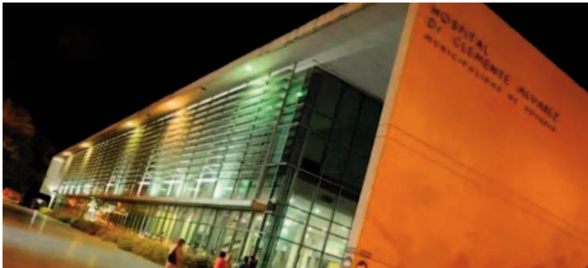
La primera víctima de la balacera pasó a quirófano en el HECA.