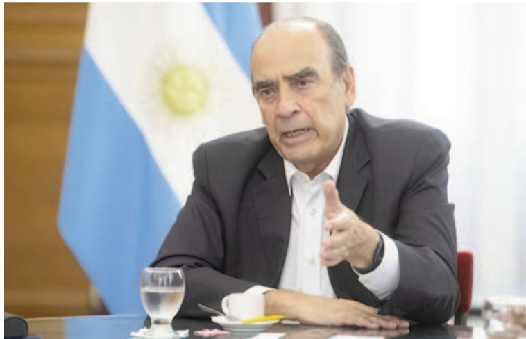
Francos será el representante del Gobierno en el 17° Coloquio Industrial que se desarrollará hoy en Córdoba.

rector ejecutivo de la UIA, brindará la charla "El potencial industrial: políticas de Estado para impulsar