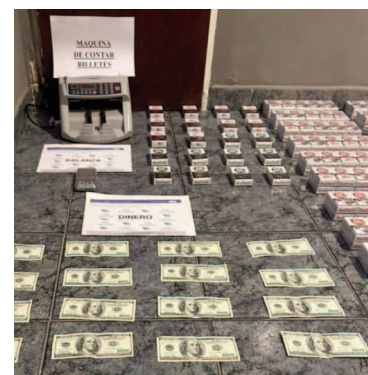
Parte del material secuestrado en el allanamiento.

gramos) y dos plantas de cannabis sativa (279 gramos), con un peso total de 1686 gramos. Además, incautaron tres cajas de papelillos, una balanza de precisión, una máquina contadora de billetes, 3000 dólares, 8500 pesos argentinos, 1040 atados de cigarrillos de distintas marcas y un celular. La Justicia dispuso la carátula "Infracción a la Ley 23.737, artículo 5, inciso C – Tenencia con fines de comercialización". El aprehendido deberá presentarse a primera audiencia judicial este martes.