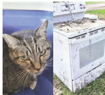
La historia del gato conmovió a todos en redes sociales.

Aunque nadie sabe con certeza cómo el felino terminó dentro del horno ni cuánto tiempo permaneció allí, un equipo de voluntarios de Kerrville Pets Alive! se movilizó rápidamente hacia el lugar. Al llegar, lograron atrapar al gato con facilidad y lo trasladaron de inmediato para recibir atención médica.