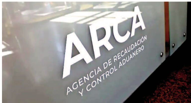
Cayó la recaudación en agosto.

lo que generaba el Impuesto PAIS el resto de los impuestos debería estar creciendo mucho más de lo que lo están haciendo ahora y para ello se requeriría de mayor actividad económica.