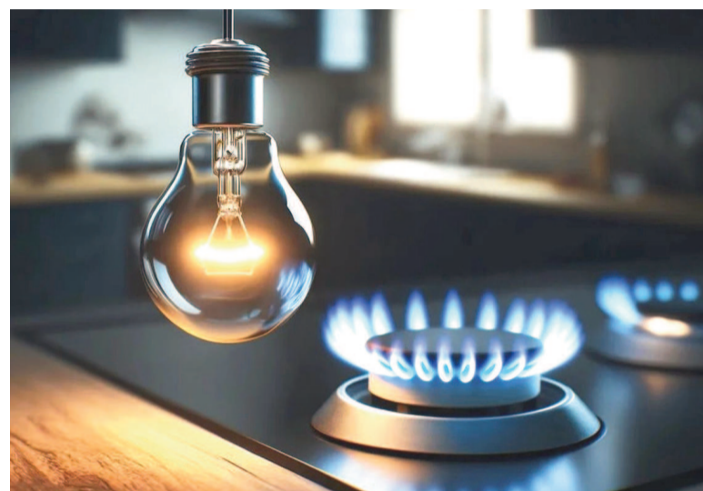
Servicios mas caros en septiembre.

La medida responde a la revisión quinquenal de tarifas y a la adecuación de precios mayoristas del gas en el punto de ingreso al sistema de transporte (PIST), afectando a los usuarios residenciales, comerciales e industriales de la zona licenciada. A partir de septiembre, los nuevos precios de gas en el PIST se trasladan íntegramente a los usuarios finales, conforme