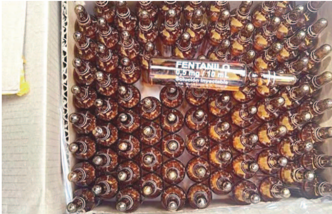
La OMS emitió una alerta por el fentanilo contaminado.