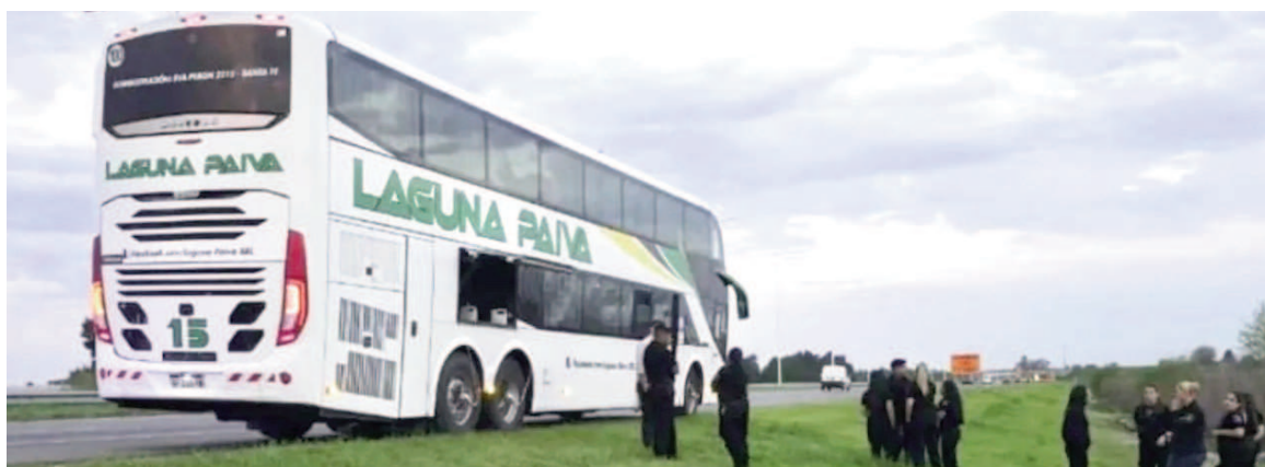
El colectivo de la empresa Laguna Paiva se dirigía a Rosario.

catarse del hecho, se comunicó con la central de emergencias 911 y dio aviso a las autoridades.