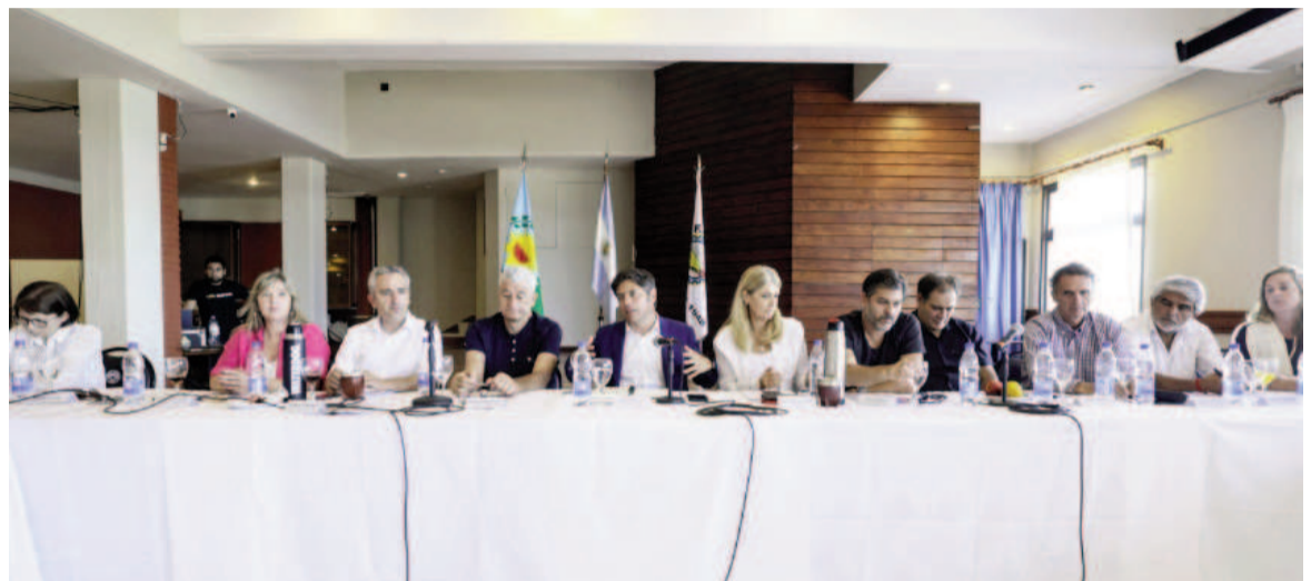
El gobernador bonaerense ofició de anfitrión junto a ministros bonaerenses e intendentes nucleados en el MDF.

Del asado participaron los dirigentes más cercanos al gobernador bonaerense, donde el propio Kicillof pidió “militar la boleta” de Fuerza Patria y “redoblar esfuerzos” para ganarle nuevamente a La Libertad Avanza. Las encuestas que circularon luego de la victoria electoral del peronismo lo dan arriba a Jorge Taiana por un escaso margen de votos. El gobernador le pidió a los dirigentes que militen la campaña porque “hay que volver a ganarle a Milei”. Por otra parte, el gobierno bonaerense espera un llamado del flamante ministro del