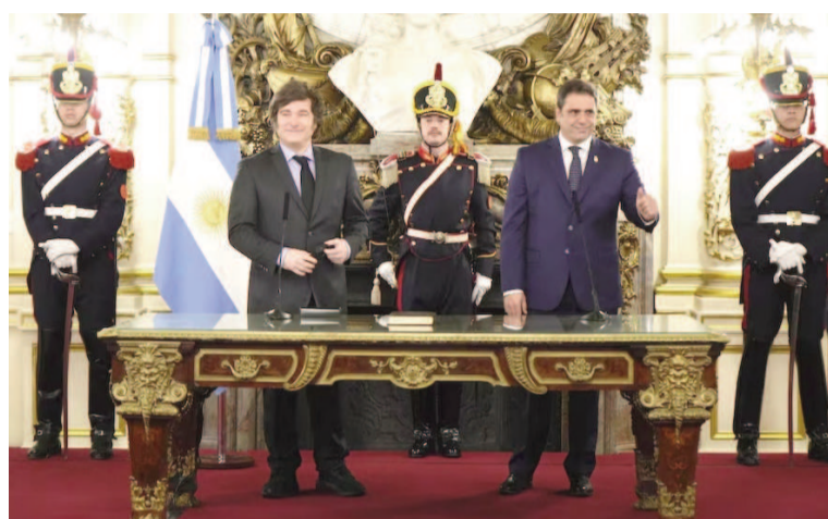
Javier Milei y Lisandro Catalán sonríen durante la toma de juramento.

Datos oficiales del Ministerio del Interior muestran que a Chaco se le transfirió ese monto por una supuesta Emergencia Agropecuaria. Misiones la solicitó formalmente por la Emergencia Hídrica, mientras que Entre Ríos por motivos de desequilibrio financiero. Por último, Santa Fe alegó