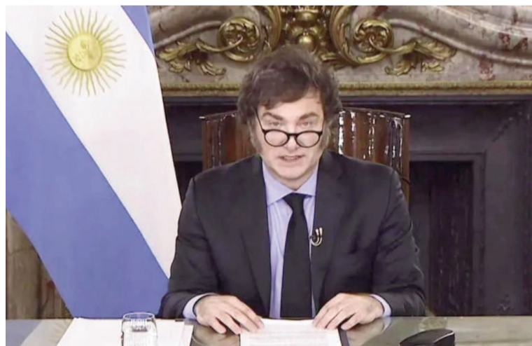
En cadena, Milei, aseguró que "lo peor ya pasó".

En un mensaje a la gente, Milei sostuvo que "los años más duros de afrontar fueron los primeros. Lo peor ya pasó". Para luego agradecer a los argentinos "por el enorme apoyo que demostraron a lo largo de este primer período". Consideró que los argentinos "son los protagonistas de este proceso, son quienes han emprendido el arduo camino de crecer y abrazar las ideas de la libertad", en lo que se interpreta como la intención de asociar a la población a las políticas de ajuste del gobierno.