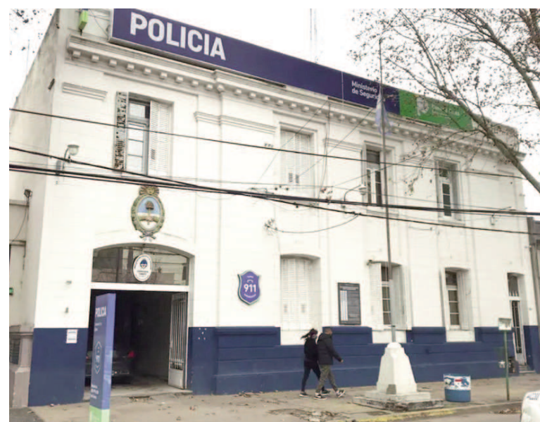
Trágica muerte en Zárate.

En paralelo, personal de la Comisaría Primera de Zárate y Policía Científica se presentaron en el lugar para llevar adelante las actuaciones de rigor, incluyendo el relevamiento fotográfico y el posterior retiro del cuerpo por parte de la morguera.