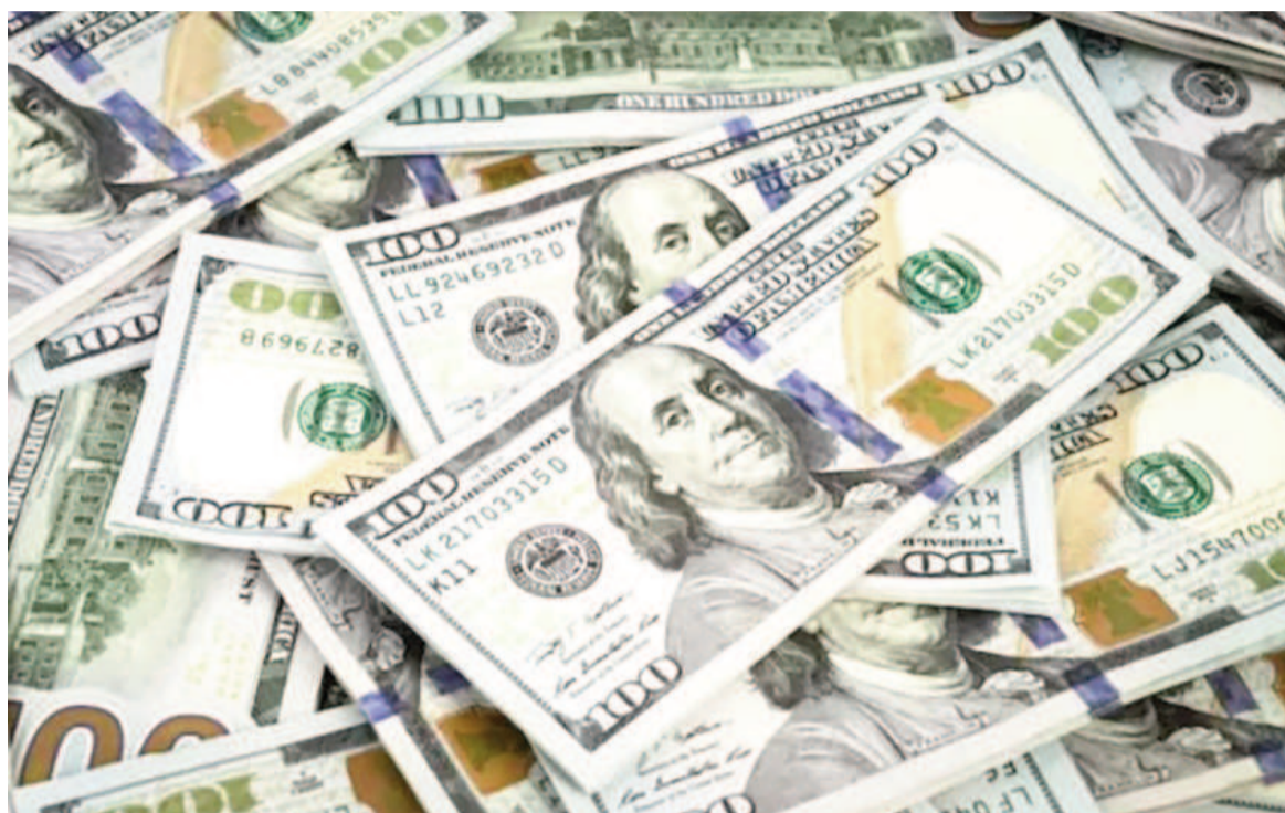
El dólar volvió a registrar otra suba importante.

En San Nicolás, algunos operadores de la moneda estadounidense en el mercado informal terminaron vendiendo este lunes la unidad blue a $1470 e incluso $1475, lo que representó un salto significativo de más del 3% en referencia al valor de $1425 con que se habían cerrado las últimas transacciones del viernes antes del cierre de los mercados du-