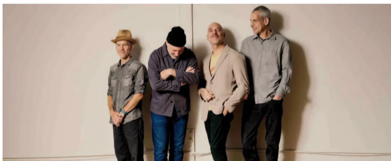
The Bad Plus, la principal visita internacional del Festival de Jazz de San Nicolás.

En 1979, el pianista norteamericano Bill Evans realizó una presentación en San Nicolás de los Arroyos que pasó casi inadvertida para el público local. A pesar de su reconocimiento internacional y de haber participado en álbumes célebres de jazz como Kind of Blue, de Miles Davis, Evans actuó ante un auditorio semivacío en el Teatro Municipal Rafael Aguiar, donde la principal atracción de la noche fue la coronación de la Reina de la Primavera y sus princesas. Esa visita de Evans a la Argentina fue la última antes de su fallecimiento, en 1980, y su paso por San Nicolás permanece como un episodio insólito de la brillante carrera del pianista (y quedó reflejado en la excelente película Bill 79, del director Ma-