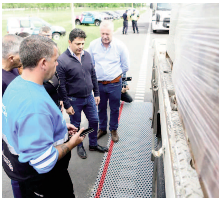
Controles de sobrepeso en rutas de la provincia de Buenos Aires.

«Un vehículo fuera de los valores legales permitidos representa un grave riesgo para la seguridad vial,