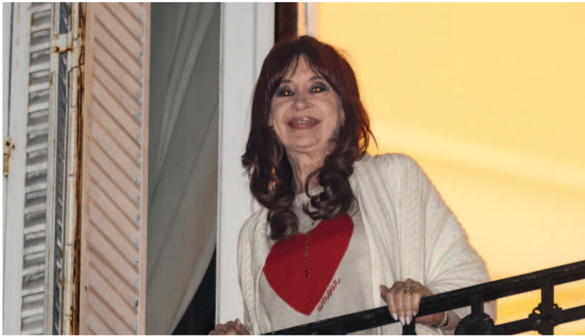
Cristina gana tiempo y demora el decomiso de sus bienes.

En primer lugar, después de que la Sala IV de la Cámara Federal de Casación Penal confirmó que el monto a decomisar es de 684.990.350.139,86, le recordaron