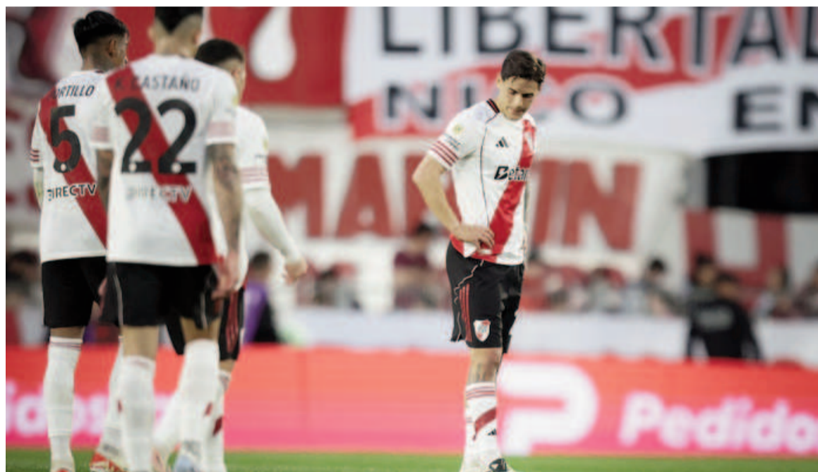
El equipo de Gustavo Benítez logró una resonante victoria.

El Malevo se impuso por 2 a 1 y se afianzó al tope de la Zona B, mientras que el Millonario sufrió su cuarta caída al hilo contabilizando las dos caídas ante Palmeiras por Copa Libertadores.