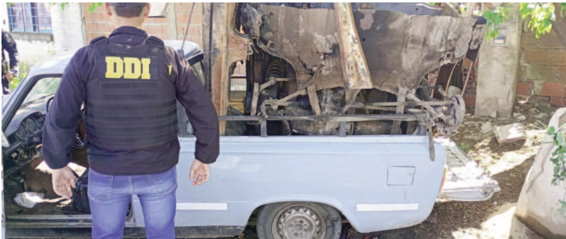
Un auto robado en Pergamino fue hallado en San Nicolás.

Según refirió el propietario del mismo, el auto había sido estacionado en inmediaciones del hospital privado Sadiv, adonde había concurrido por una cuestión de salud. Al permanecer interna-