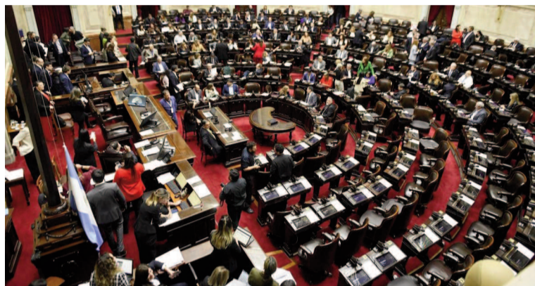
La Cámara Baja tendrá una semana agitada.

Si se trata previo a la elección, como quieren los opositores, la LLA deberá enhebrar acuerdos con la mayoría de los bloques para tener dictamen de mayoría, ya que tiene sólo tiene 6 de los 49 miembros, y el peronismo con la izquierda suman 21 voluntades.